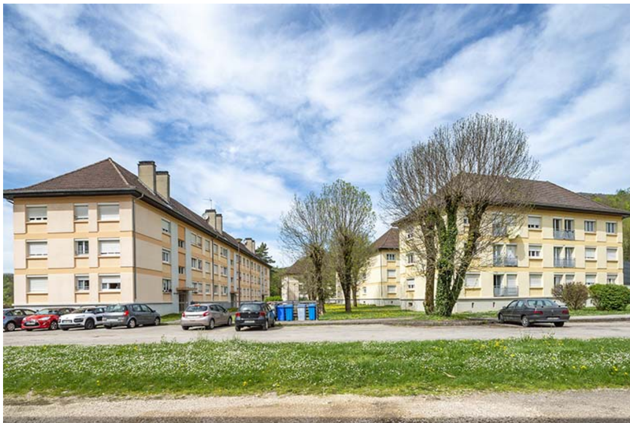
Vue d'ensemble depuis le sud.

39, Salins-les-Bains avenue Charles de Gaulle