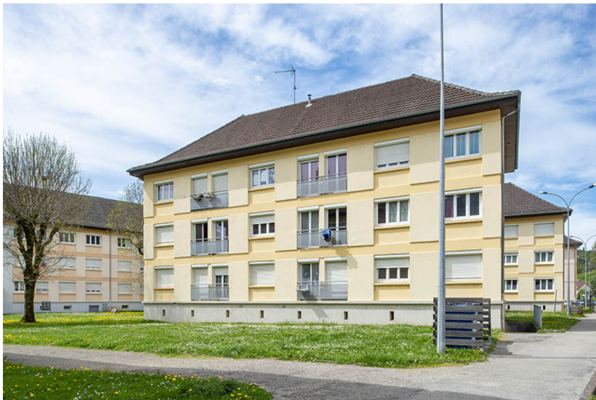
Vue depuis l'accès de l'avenue Charles de Gaulle.

39, Salins-les-Bains avenue Charles de Gaulle