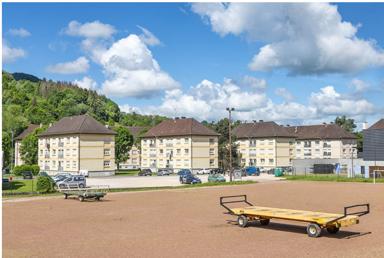
Vue d'ensemble depuis le sud-est.

39, Salins-les-Bains avenue Charles de Gaulle