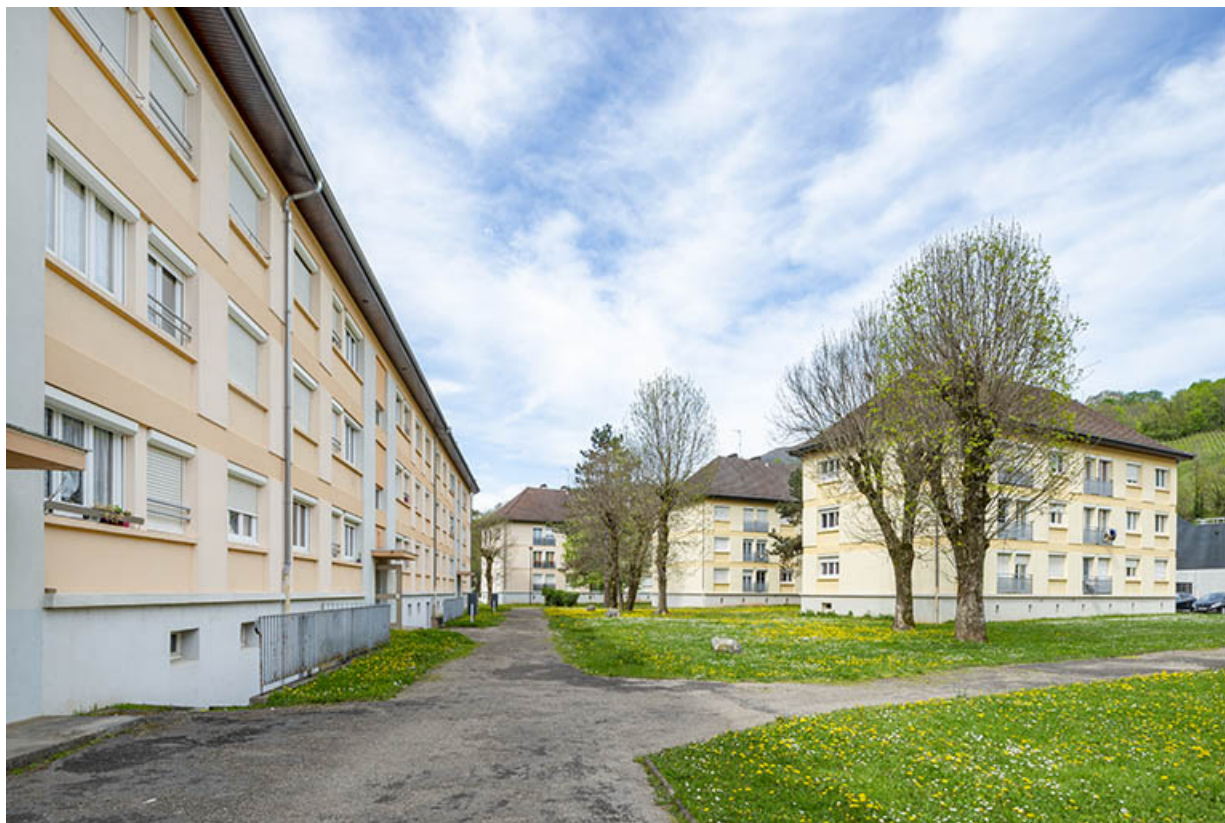
Vue d'ensemble depuis le sud du bâtiment Saint-André.

39, Salins-les-Bains avenue Charles de Gaulle