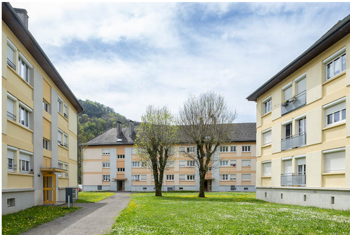
Vue du bâtiment Saint-André, entre celui de Belin et Max Claudet.

39, Salins-les-Bains avenue Charles de Gaulle