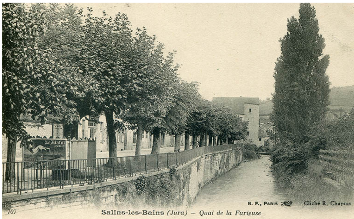
Salins-les-Bains (Jura) - Quai de la Furieuse, s.d. [fin 19e ou début 20e siècle].