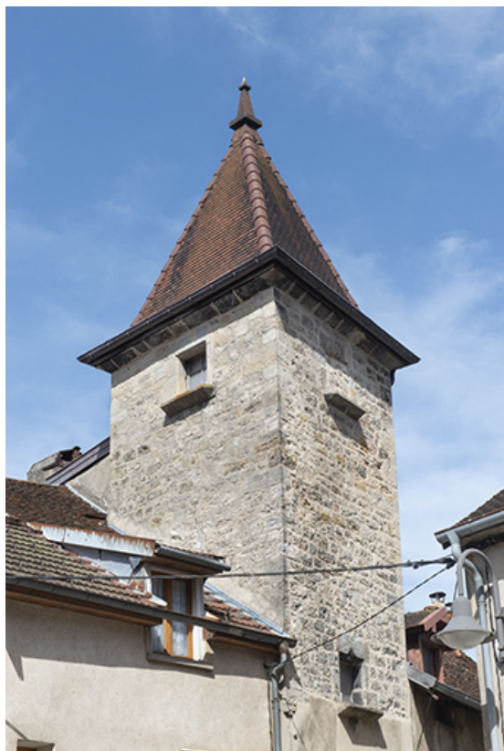
Tour flanquant la maison au sud.