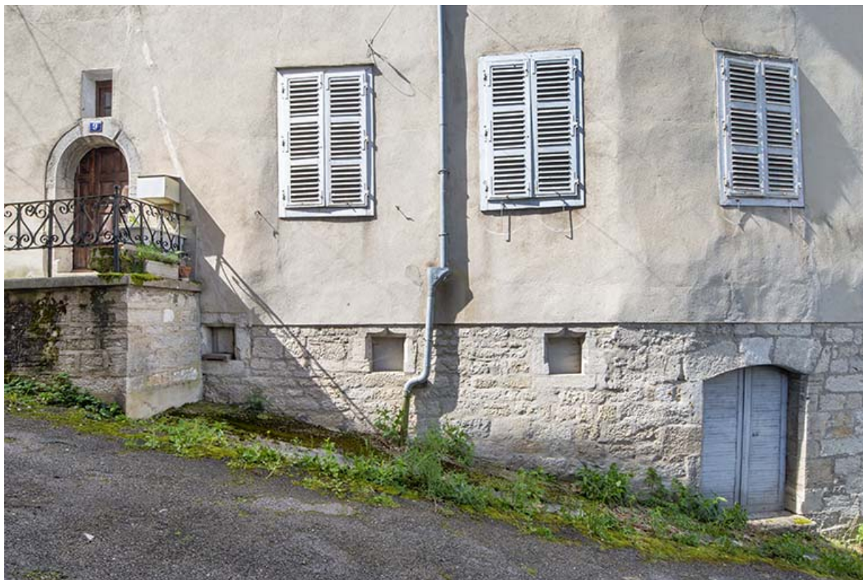
Façade est. Ouvertures du rez-de-chaussée et de l'étage de soubassement.