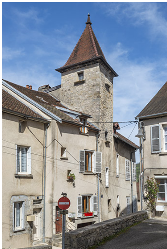
Vue d'ensemble depuis la place de l'église Saint-Maurice.