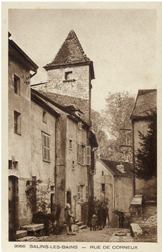
Salins-les-Bains. Rue de Corneux, s.d. [milieu 20e siècle].