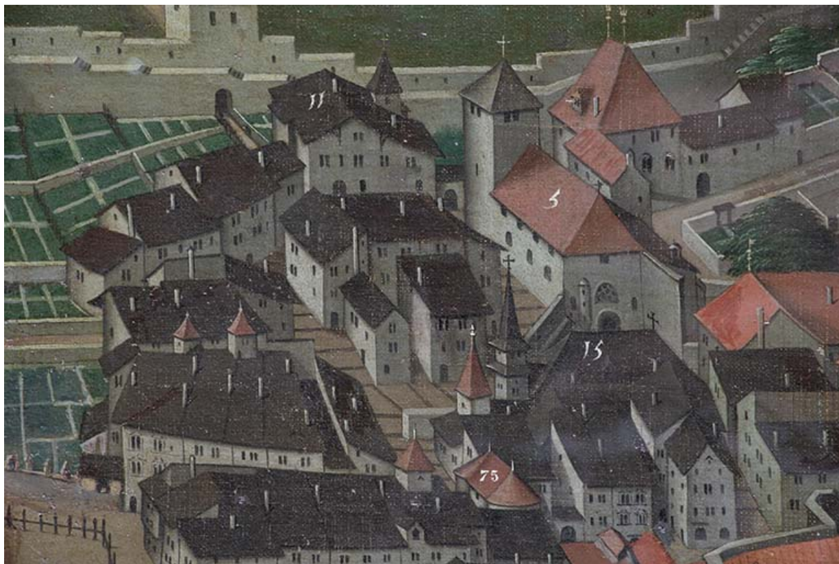
Détail du tableau de Nicolas Richard (1628). L'emplacement de l'immeuble se situe devant le n° 15 (La chapelle de Croix) et comprend le passage menant à l'église Saint-Jean.