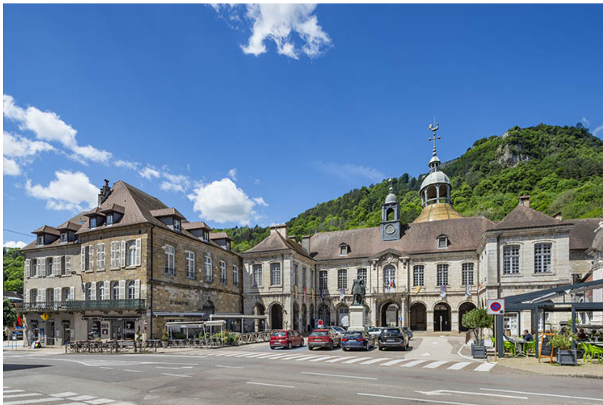
Vue d'ensemble, avec la place des Alliés.

39, Salins-les-Bains, 2 rue de la République