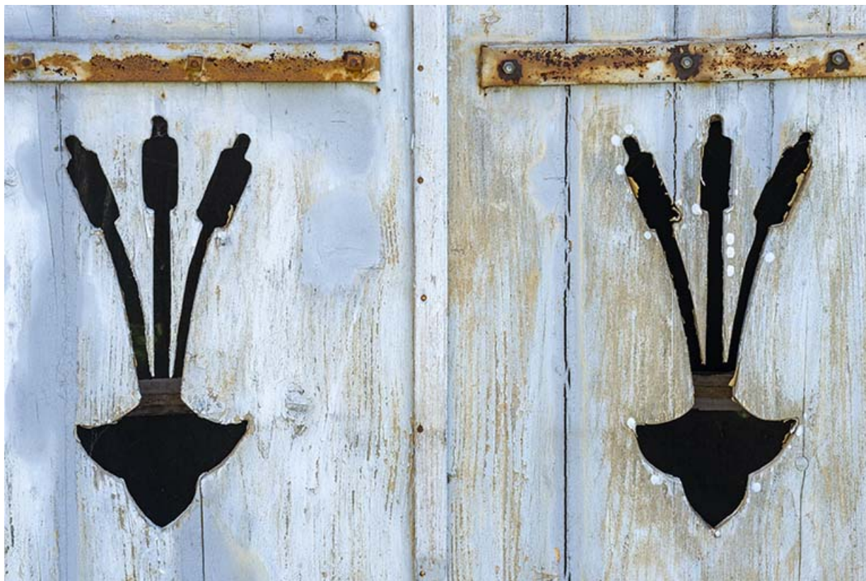
Détail de volets (façade nord).

39, Salins-les-Bains, 7, 9 rue des Bains