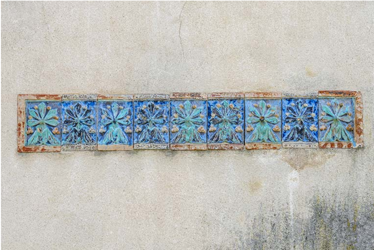
Frise de carreaux de grès flammé (façade nord, étage de soubassement).

39, Salins-les-Bains, 7, 9 rue des Bains