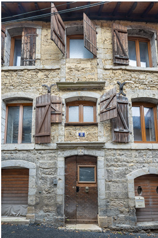
Elévation de la travée centrale.

39, Salins-les-Bains, 8 rue Saint-Nicolas