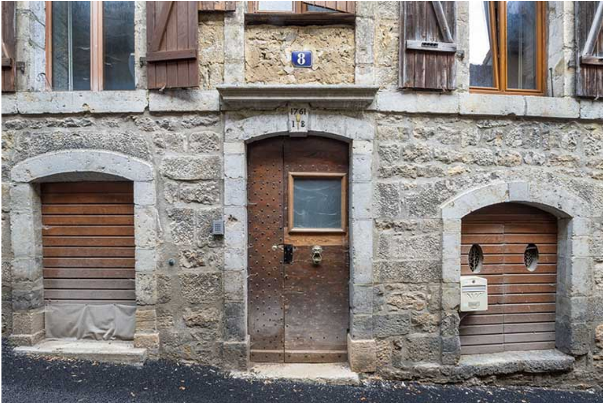
Travées encadrant la porte principale.

39, Salins-les-Bains, 8 rue Saint-Nicolas