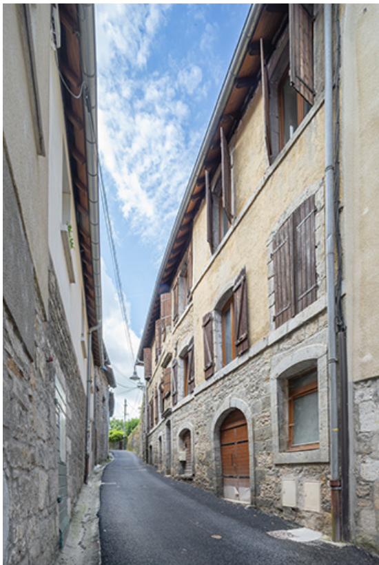
Façade vue de trois quarts, depuis le bas de la rue.

39, Salins-les-Bains, 8 rue Saint-Nicolas