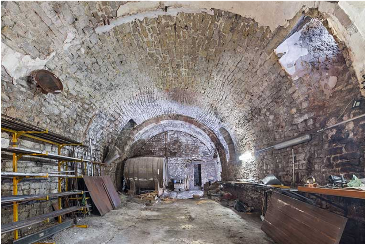
Cave en rez-de-chaussée. Vue depuis l'ouest.

39, Salins-les-Bains, 14 rue Charles Magnin