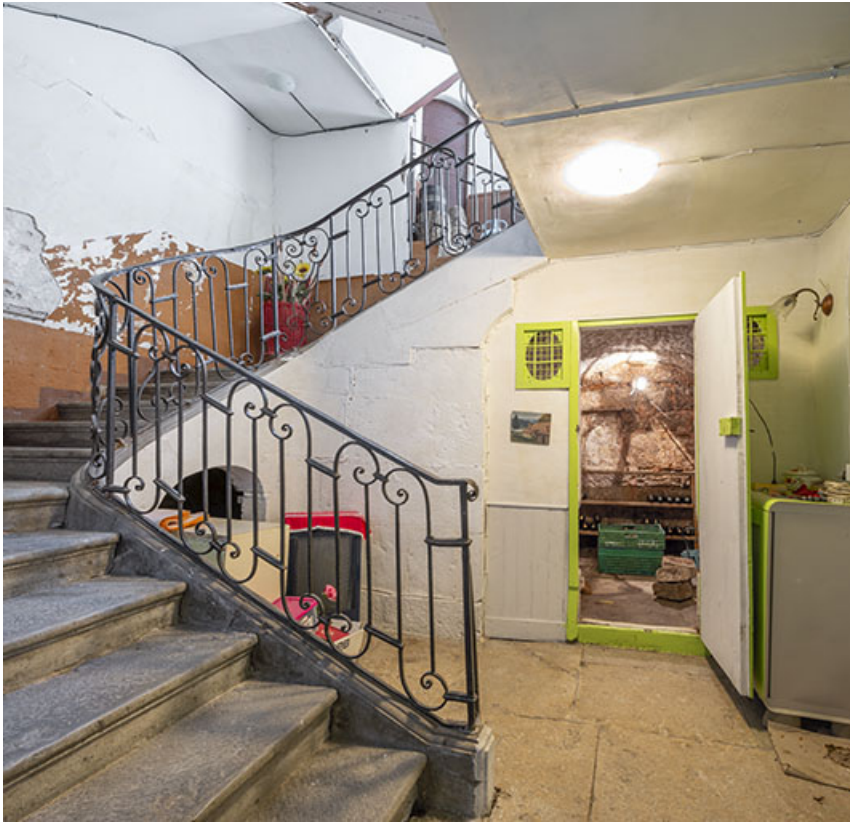
Cage d'escalier, depuis le rez-de-chaussée.

39, Salins-les-Bains, 14 rue Charles Magnin