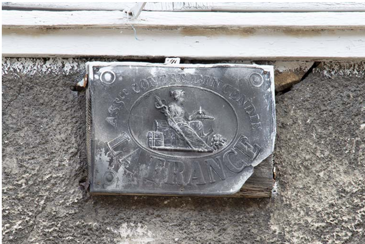
Façade sur la rue Charles Magnin (étage supérieur). Plaque d'assurance La France.

39, Salins-les-Bains, 14 rue Charles Magnin