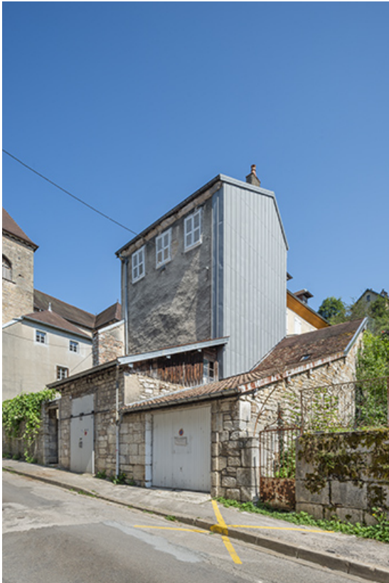
Vue d'ensemble depuis la rue Charles Magnin.

39, Salins-les-Bains, 14 rue Charles Magnin