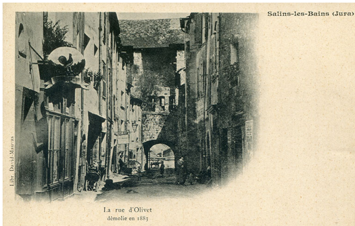
Salins-les-Bains. La rue d'Olivet démolie en 1883, s.d. [avant 1883].