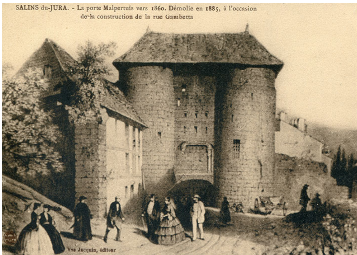
Salins-du-Jura. La porte Malpertuis vers 1860. Démolie en 1885, à l'occasion de la construction de la rue Gambetta, s.d. [avant 1883].