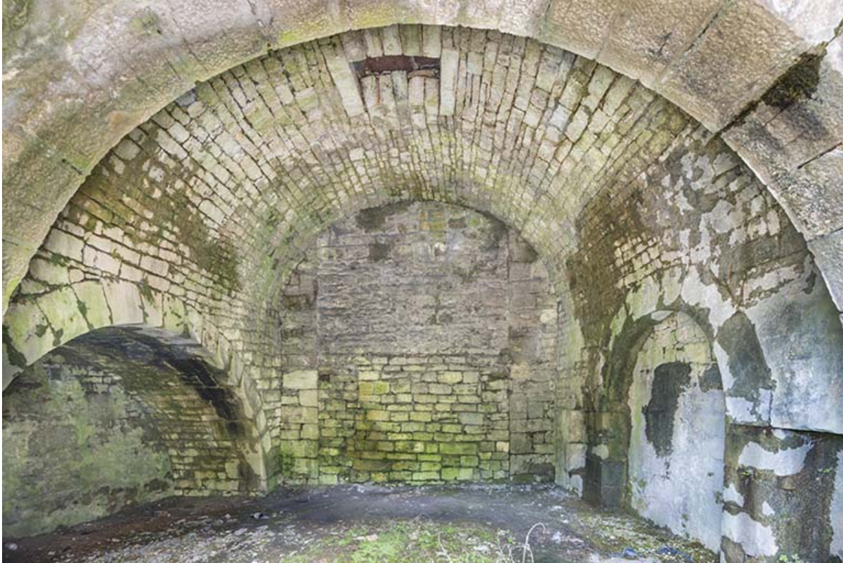
Pièce voûtée en berceau, située au nord de la tour est (vestiges du bâtiment construit en 1661 ?).