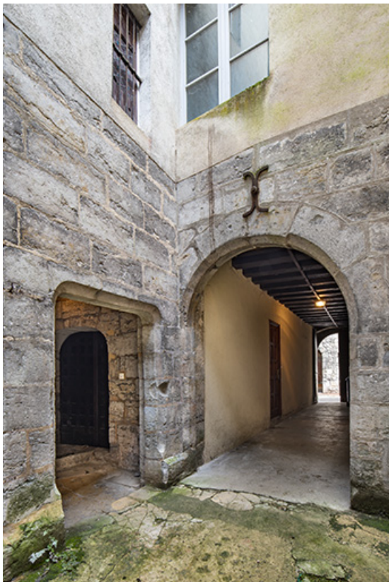
Vue de puis la cour : accès à la tour d'escalier et au couloir d'entrée.

39, Salins-les-Bains, 37 rue de la Liberté