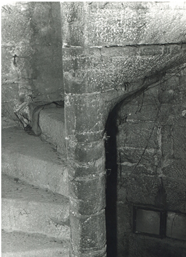
Escalier de la demeure (angle nord-ouest), 1979.

39, Salins-les-Bains, 79 rue de la République