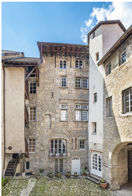
Bâtiment sur rue. Élévation de la façade postérieure, et tour d'escalier polygonale au joignant du bâtiment conventuel nord. 39, Salins-les-Bains, 79 rue de la République