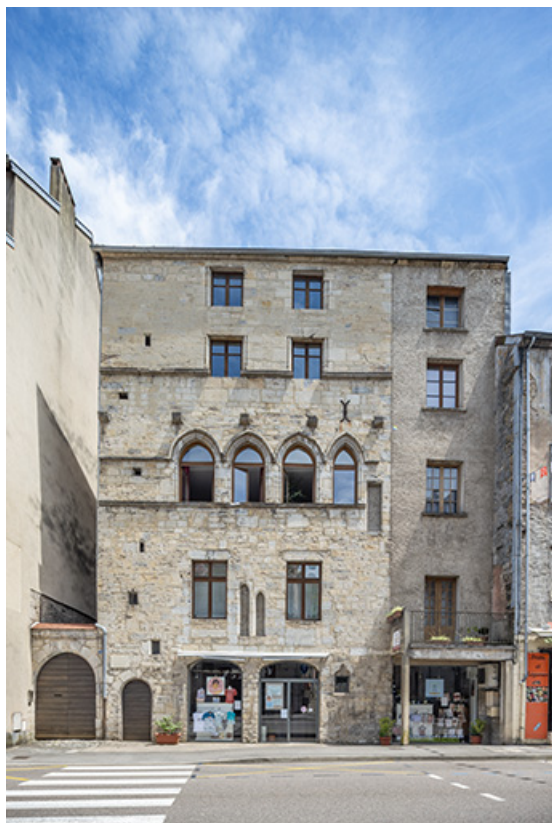
Façade antérieure. Vue de face.

39, Salins-les-Bains, 79 rue de la République