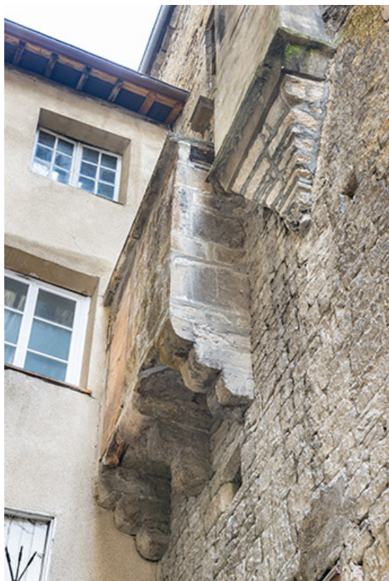
Bretèche et partie en encorbellement sur le mur nord du bâtiment sur rue. 39, Salins-les-Bains, 79 rue de la République