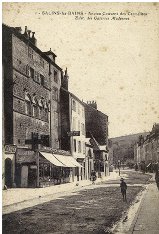
Salins-les-Bains (Jura) - Ancien couvent des Carmélites, carte postale, s.d. [début 20e siècle]. 39, Salins-les-Bains, 79 rue de la République