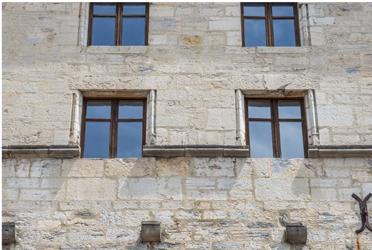
Façade antérieure. Baies des troisièmes et quatrièmes étages.

39, Salins-les-Bains, 79 rue de la République