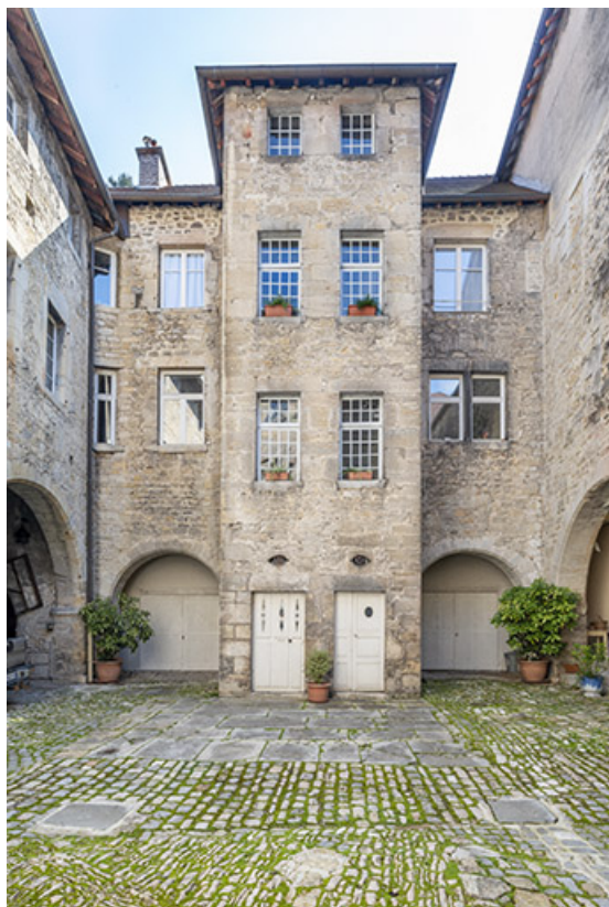
Bâtiment conventuel est. Façade sur cour.

39, Salins-les-Bains, 79 rue de la République