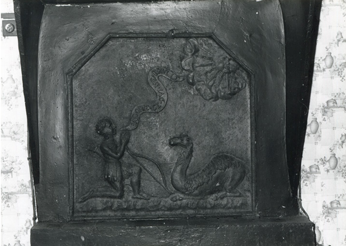
Bâtiment du couvent. Plaque de cheminée " J'adore ce qui me brûle ", 1988.

39, Salins-les-Bains, 79 rue de la République