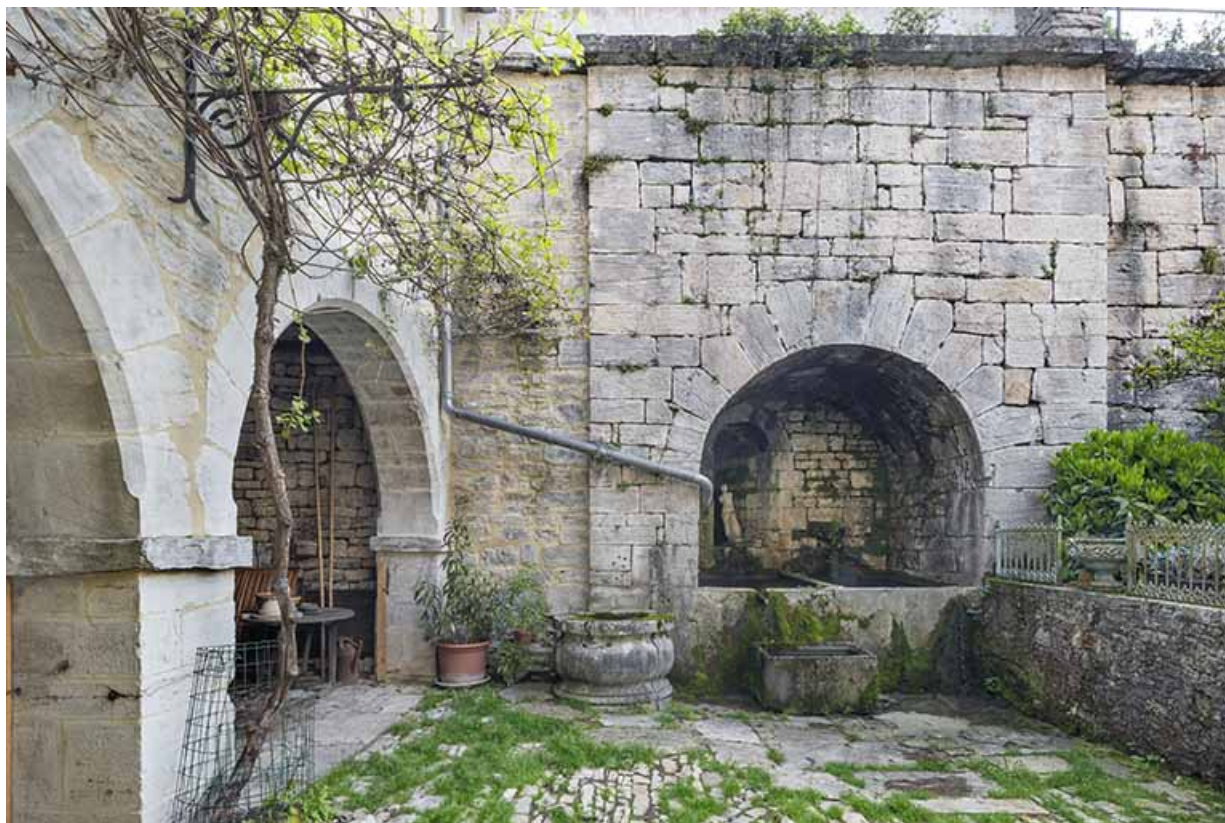
Vivier aménagé dans le mur de la terrasse en terre-plein.

39, Salins-les-Bains, 79 rue de la République