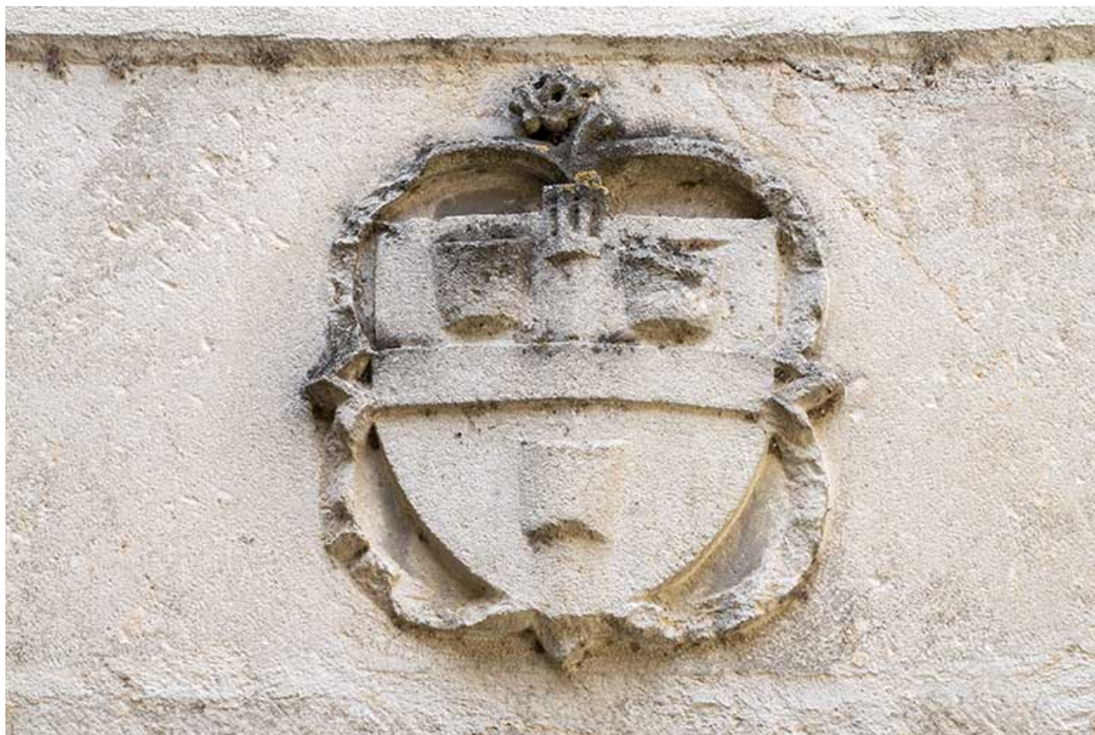
Blason sculpté (linteau de l'entrée de la tour polygonale).

39, Salins-les-Bains, 79 rue de la République