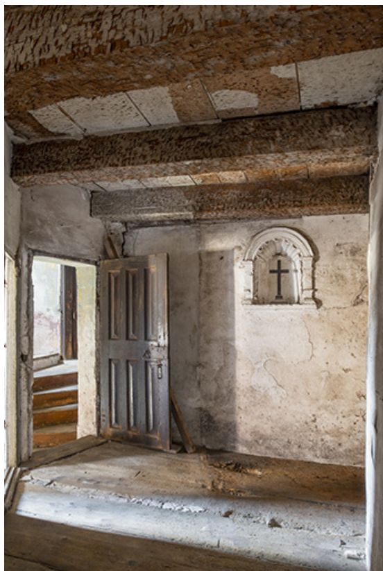
Bâtiment nord. Entrée du couloir des cellules des moniales.

39, Salins-les-Bains, 79 rue de la République