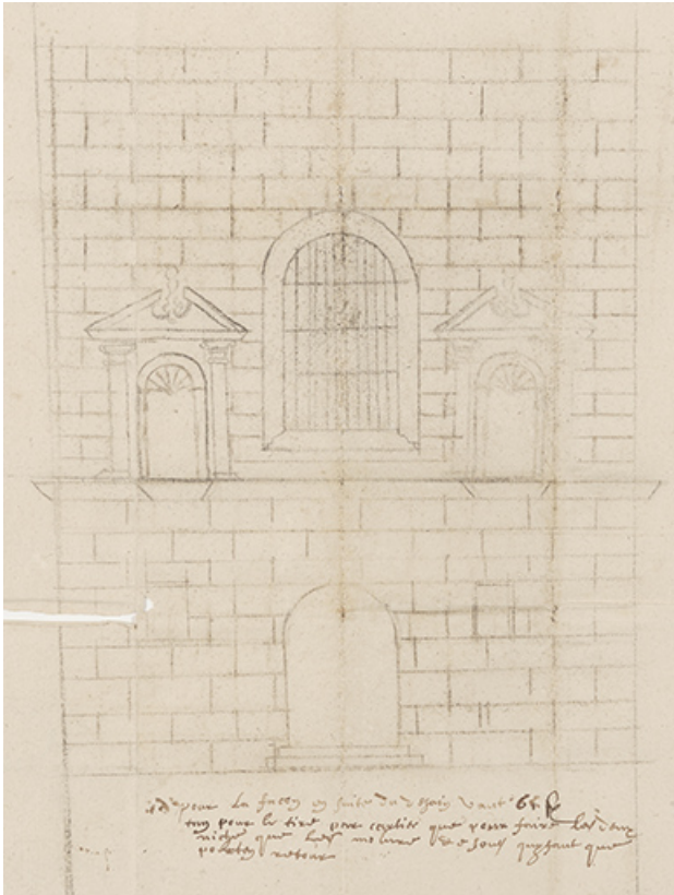
[Élévation de la façade ouest de l'église], s.d. [fin 17e siècle]. 39, Salins-les-Bains, 79 rue de la République