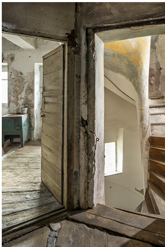
Accès au couloir des cellules depuis la tour.

39, Salins-les-Bains, 79 rue de la République