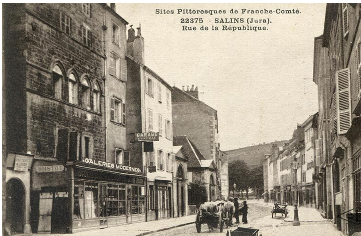
Salins (Jura). Rue de la République, carte postale, s.d. [début 20e siècle].

39, Salins-les-Bains, 79 rue de la République