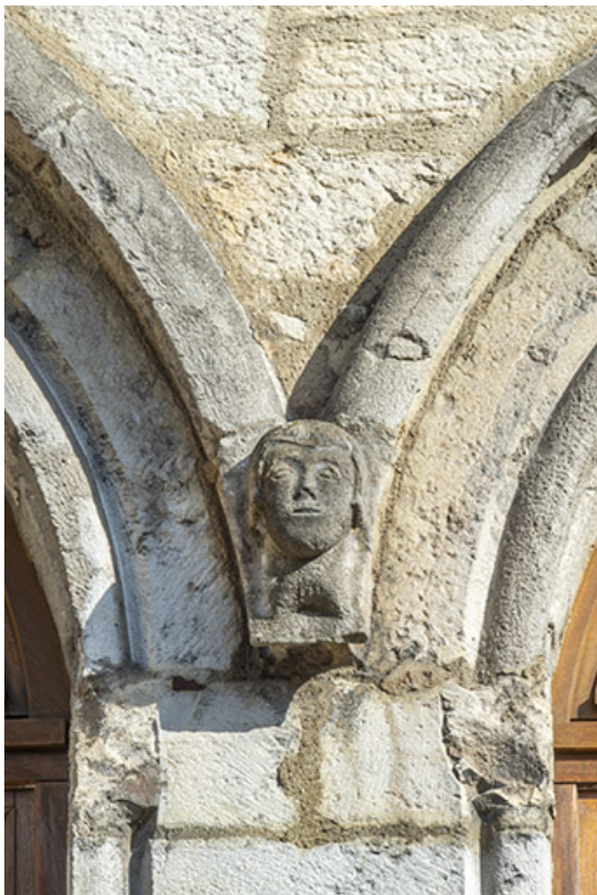
Façade antérieure. Tête sculptée à la retombée des arcs des deux premières baies.

39, Salins-les-Bains, 79 rue de la République