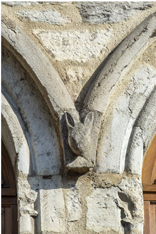
Façade antérieure. Tête sculptée à la retombée des arcs des baies centrales.

39, Salins-les-Bains, 79 rue de la République