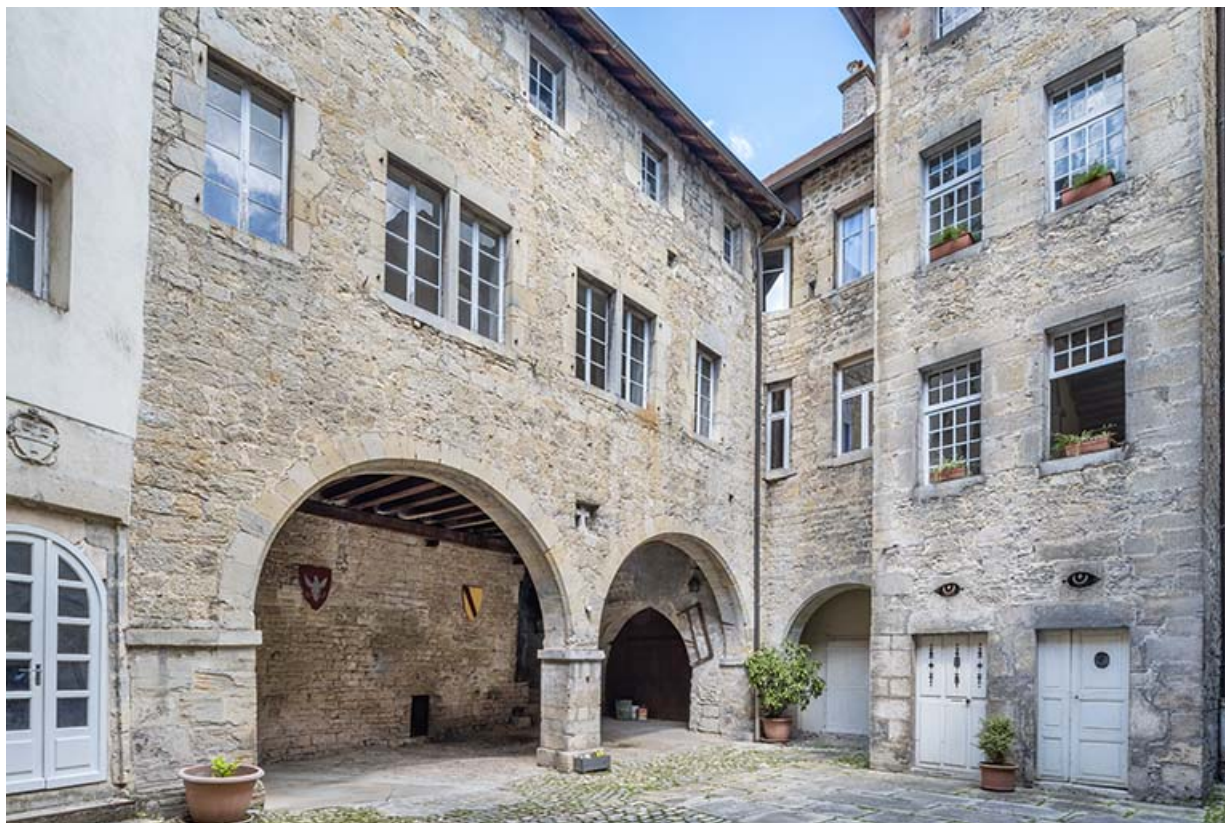
La première cour vue depuis le sud-ouest. 39, Salins-les-Bains, 79 rue de la République