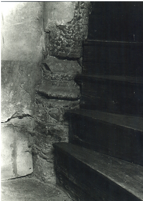
Escalier en vis (jonction entre la maison et l'aile nord du couvent). Base du noyau, 1979. 39, Salins-les-Bains, 79 rue de la République