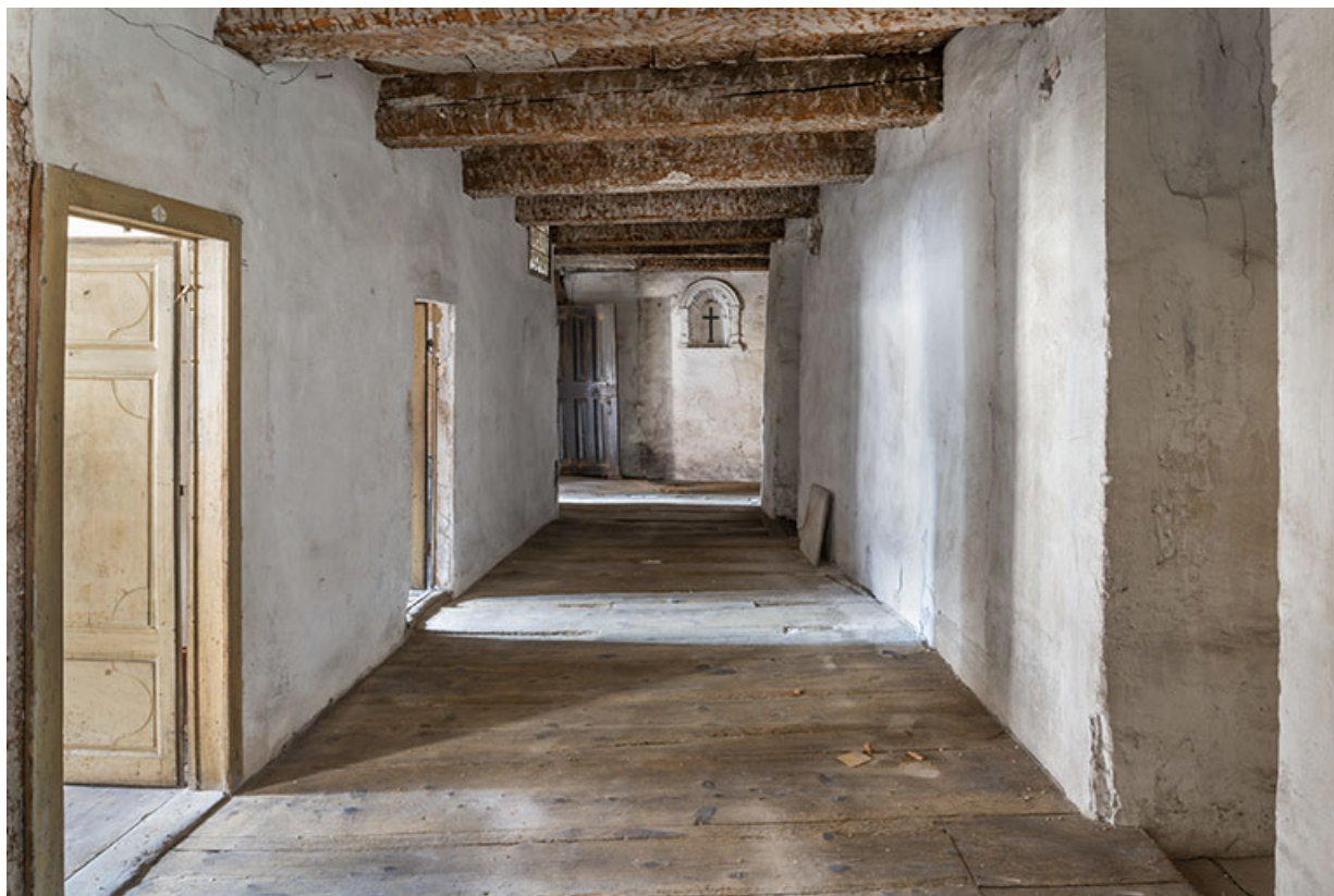
Second étage du bâtiment nord. Le couloir distribuant les cellules des moniales.

39, Salins-les-Bains, 79 rue de la République