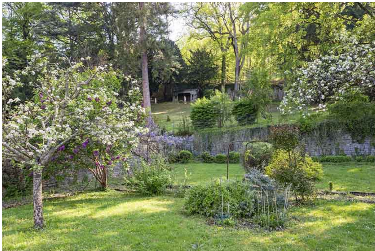
Les jardins (au premier plan). Vue rapprochée.

39, Salins-les-Bains, 79 rue de la République