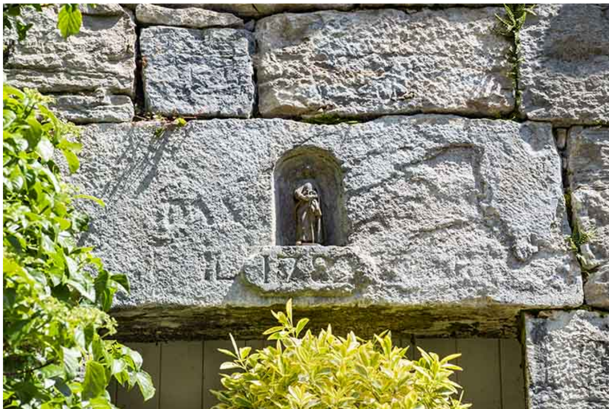
Mur de la terrasse en terre-plein. Linteau supérieur d'un local (glacière, cellier ?) portant une inscription effacée et la date 1782. 39, Salins-les-Bains, 79 rue de la République