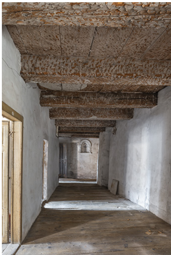
Second étage du bâtiment nord. Le couloir distribuant les cellules des moniales.

39, Salins-les-Bains, 79 rue de la République