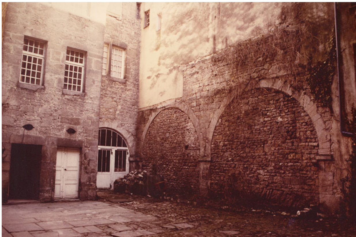
Mur sud de la cour, où apparaissent les grandes baies cintrées, symétriques à celles du mur nord, 1985. 39, Salins-les-Bains, 79 rue de la République