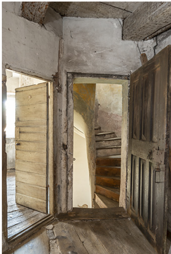
Entrée du couloir depuis la tour polygonale.

39, Salins-les-Bains, 79 rue de la République