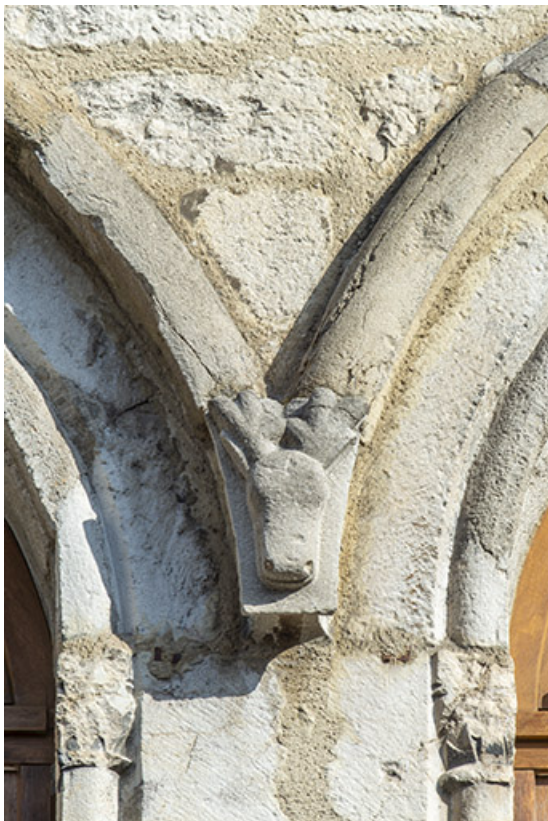
Façade antérieure. Tête sculptée à la retombée des arcs des deux dernières baies. 39, Salins-les-Bains, 79 rue de la République