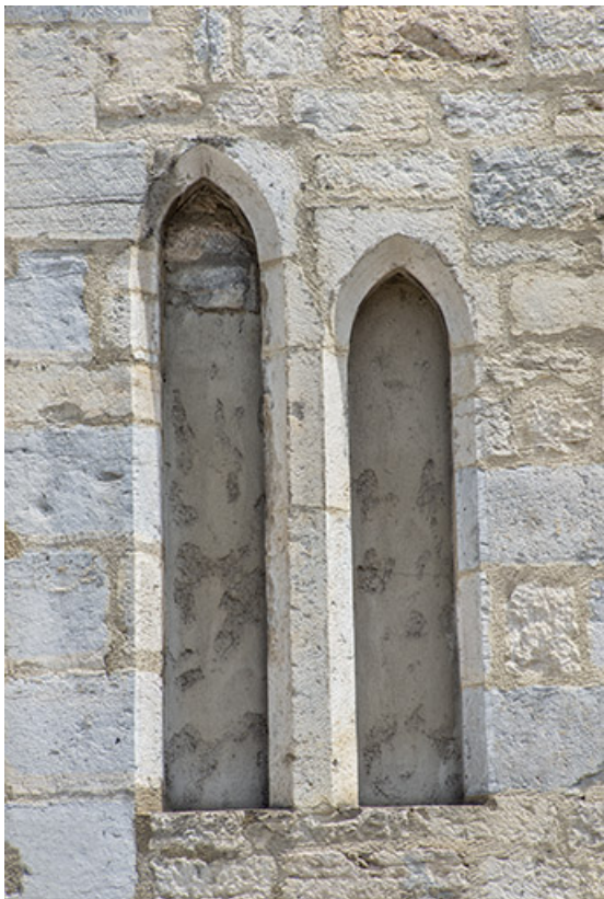
Façade antérieure. Baies étroites du deuxième étage.

39, Salins-les-Bains, 79 rue de la République