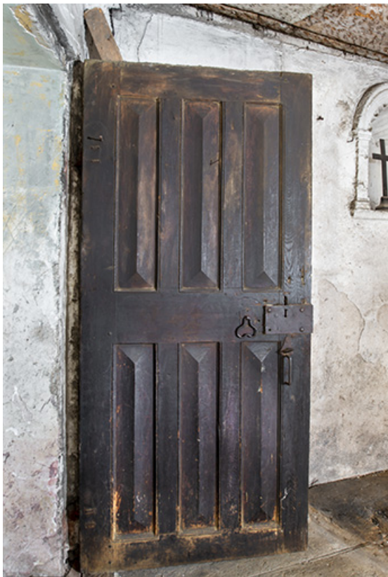
Porte de communication entre la tour polygonale et l'aile nord.

39, Salins-les-Bains, 79 rue de la République