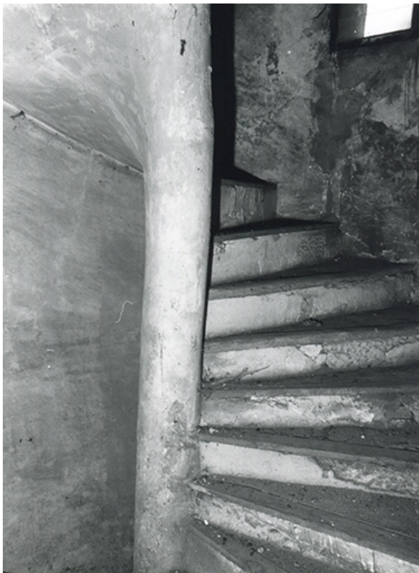
Escalier en vis (jonction entre la maison et l'aile nord du couvent), 1979.

39, Salins-les-Bains, 79 rue de la République