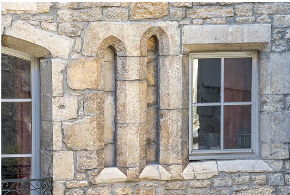
Bâtiment sur rue. Etroites lancettes jumelées (façade est).

39, Salins-les-Bains, 79 rue de la République