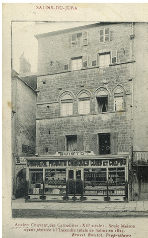
Salins-du-Jura. Ancien couvent des carmélites (XIIe siècle) [...] Ernest Boistot propriétaire, carte postale, s.d. [fin 19e ou début 20e siècle].

39, Salins-les-Bains, 79 rue de la République