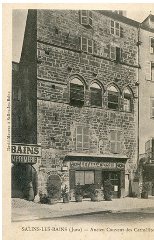
Salins-les-Bains (Jura) - Ancien couvent des Carmélites, carte postale, s.d. [fin 19e siècle].

39, Salins-les-Bains, 79 rue de la République