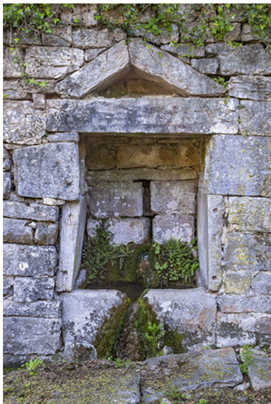
Niche (captage de source) dans le jardin.

39, Salins-les-Bains, 79 rue de la République