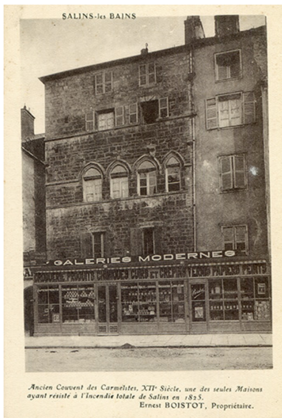
Salins-les-Bains. Ancien couvent des Carmélites, XIIe siècle [...] Ernest Boistot propriétaire, carte postale, s.d. [vers 1930]. 39, Salins-les-Bains, 79 rue de la République