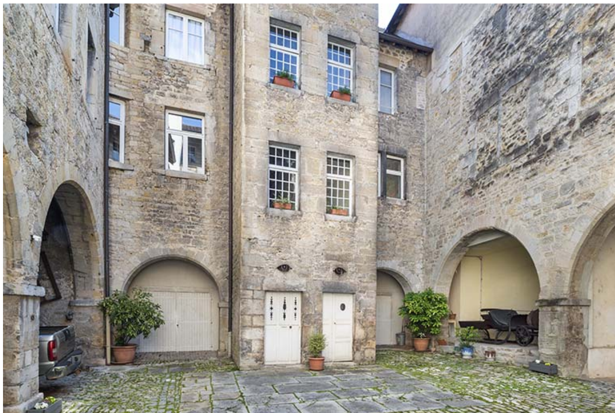
Première cour. Vue depuis le nord-ouest.

39, Salins-les-Bains, 79 rue de la République