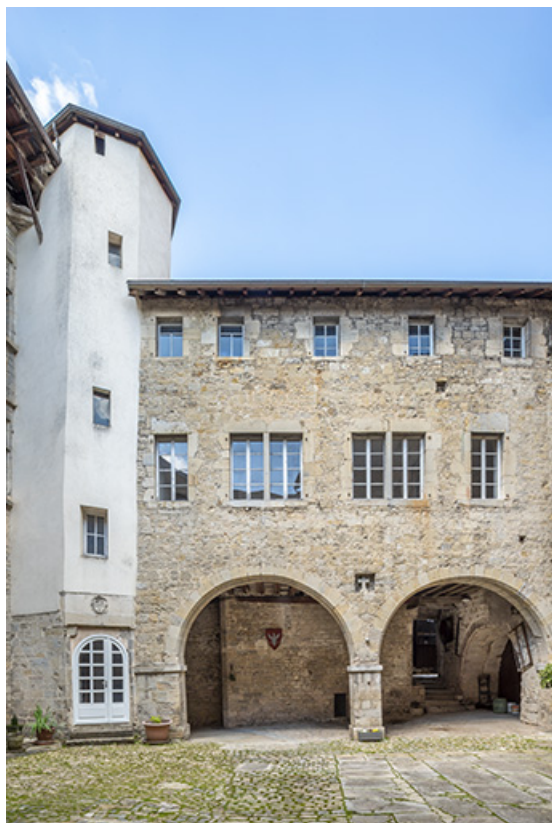
Aile nord. Façade sur cour. Au second étage, les fenêtres des cellules des carmélites. 39, Salins-les-Bains, 79 rue de la République