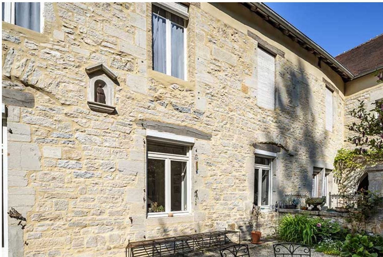
Façade sur la seconde cour du bâtiment conventuel.

39, Salins-les-Bains, 79 rue de la République