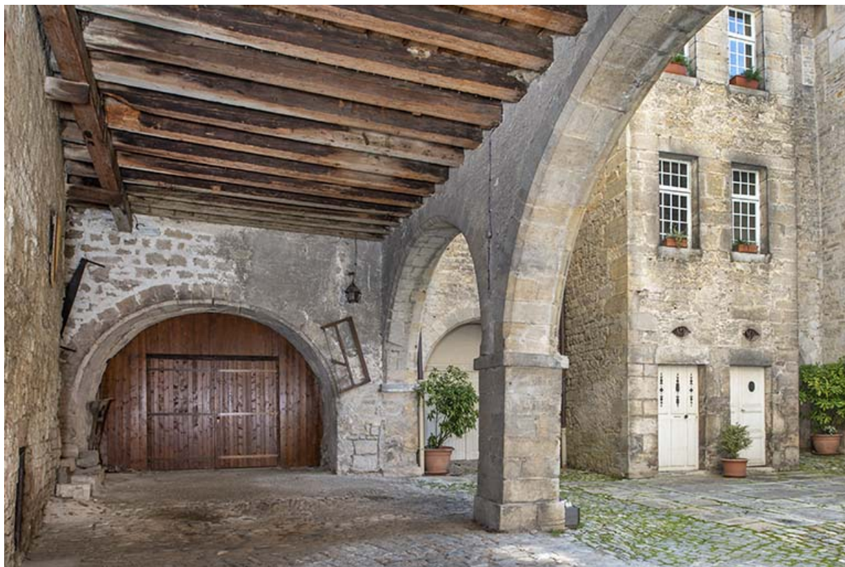
La cour depuis le passage couvert nord.

39, Salins-les-Bains, 79 rue de la République