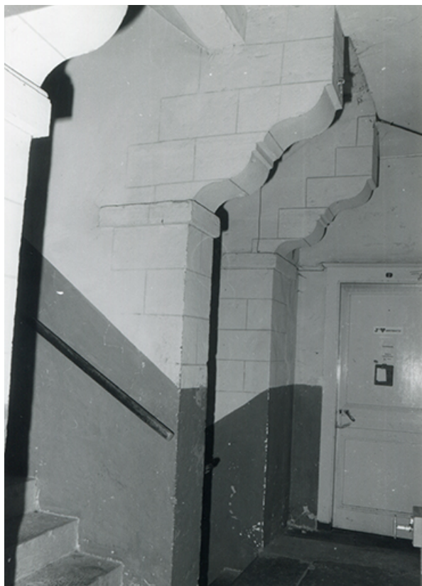
Consoles de l'escalier du couvent, 1985. 39, Salins-les-Bains, 79 rue de la République