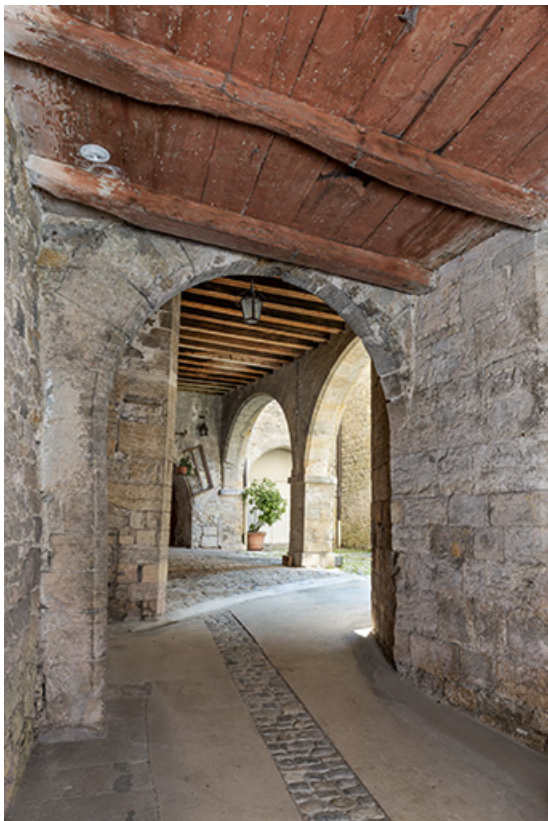
Première cour vue depuis l'entrée.

39, Salins-les-Bains, 79 rue de la République