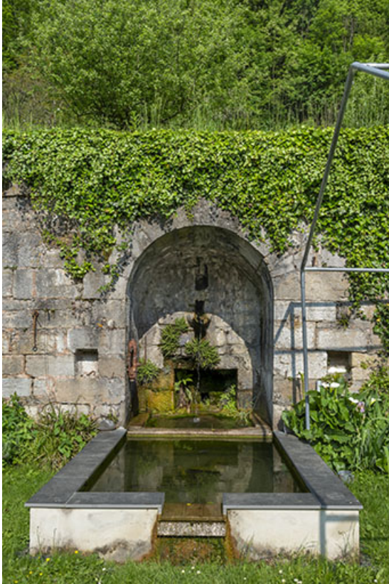
Fontaine dans la cours, au sud.

39, Salins-les-Bains, lieudit : le Paradis