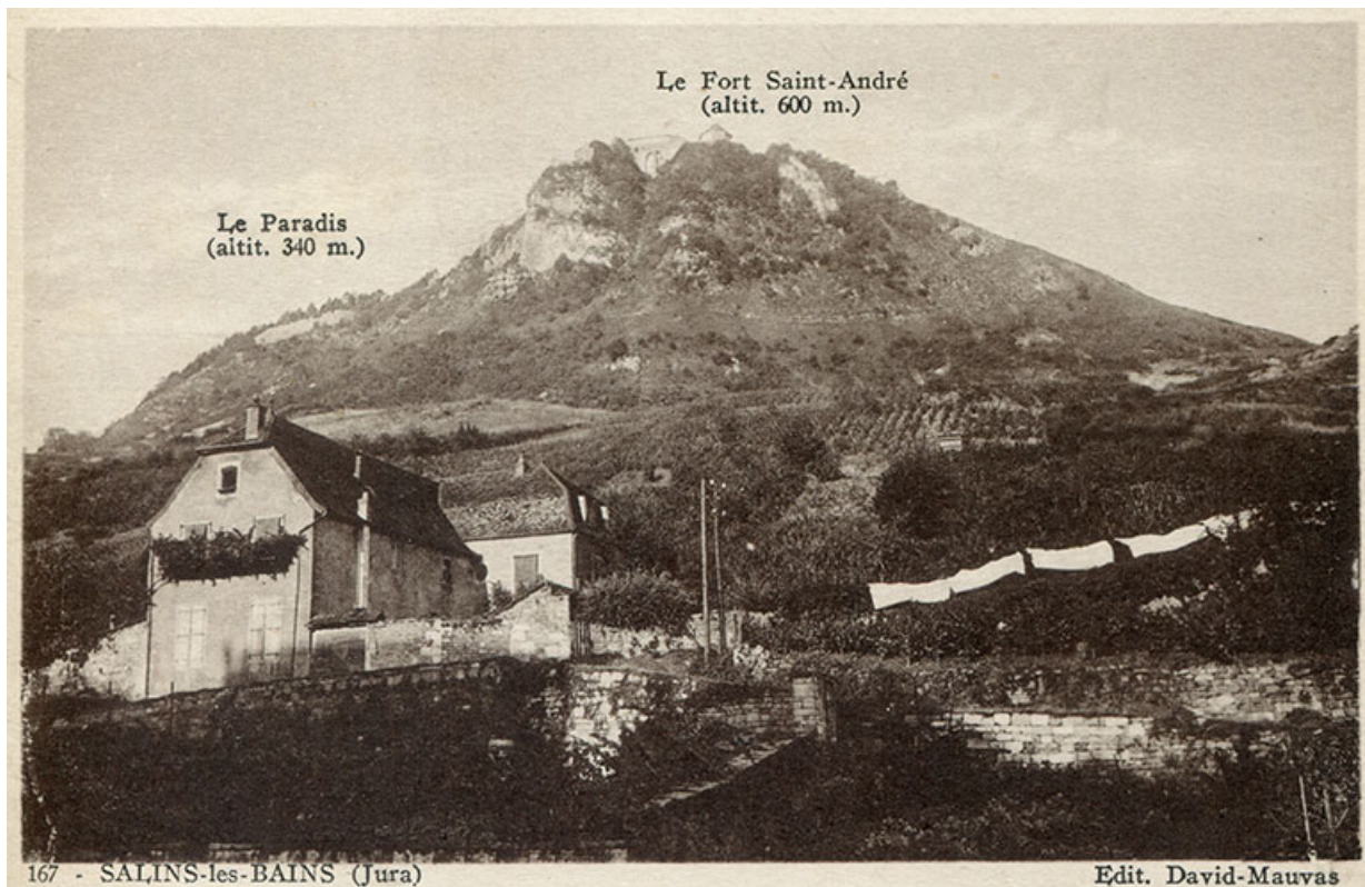
Salins-les-Bains (Jura). Le Paradis et le fort Saint-André, carte postale, s.d. [fin 19e ou début 20e siècle]. 39, Salins-les-Bains, lieudit : le Paradis

Salins-les-Bains (Jura). Le Paradis et le fort Saint-André, carte postale, éd. David-Mauvas, s.d. [fin 19e ou début 20e siècle].