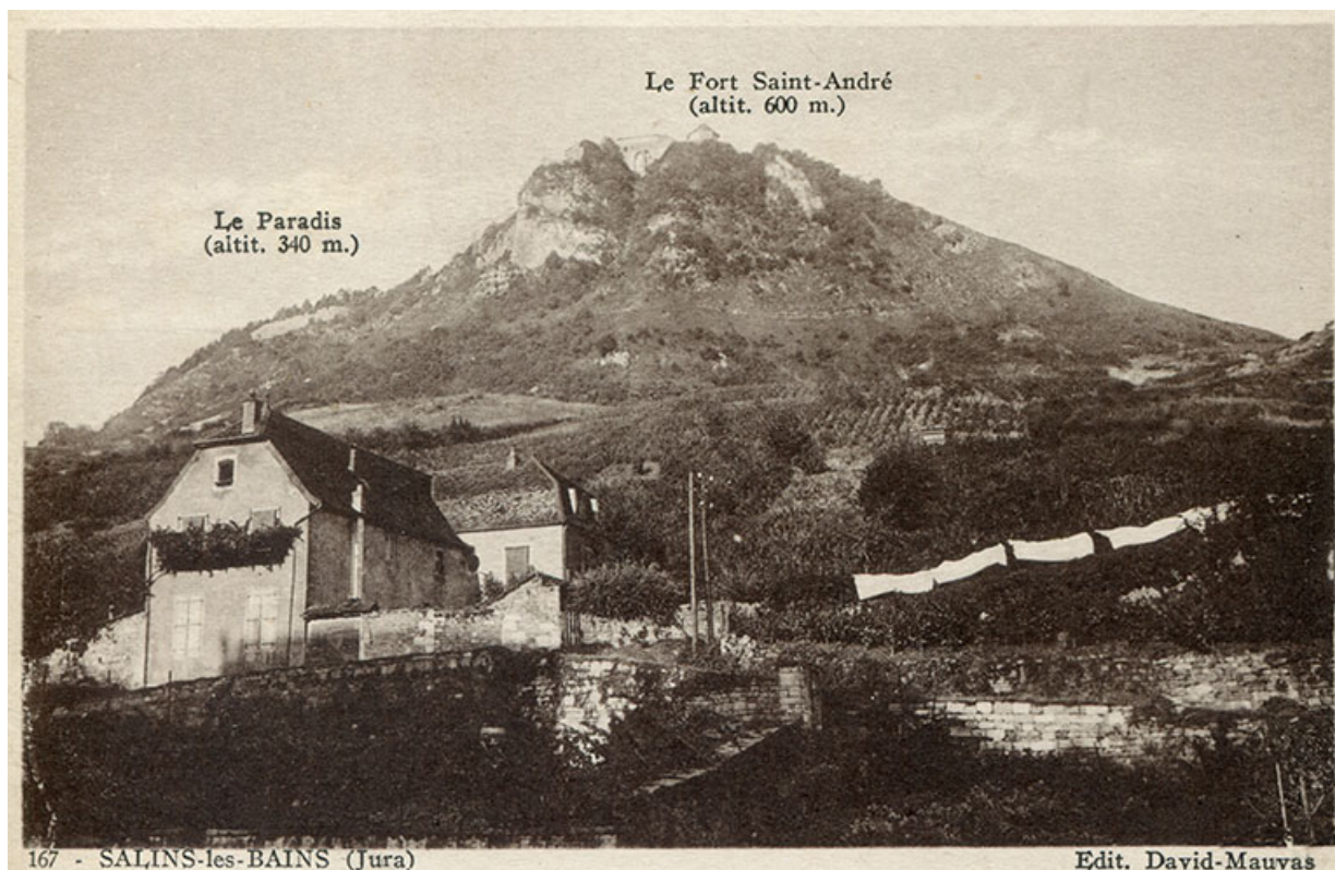
Salins-les-Bains (Jura). Le Paradis et le fort Saint-André, carte postale, s.d. [fin 19e ou début 20e siècle].

39, Salins-les-Bains, lieudit : le Paradis