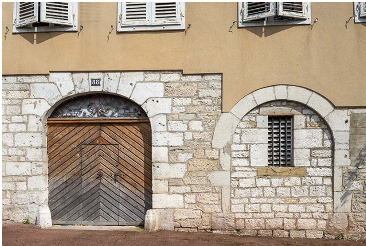
Ouvertures sud de la façade antérieure.

39, Salins-les-Bains, 88 rue de la Liberté