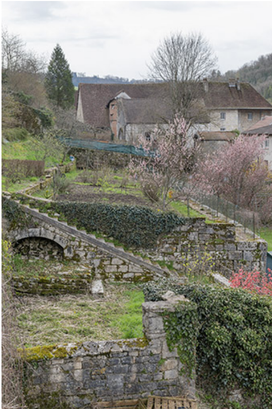
Terrasses en terre-plein des hôtels n°88 et 86 de la rue de la Liberté.

39, Salins-les-Bains, 88 rue de la Liberté