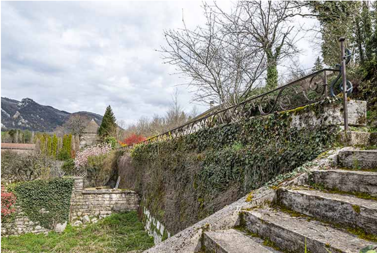
Terrasses supérieures, depuis le sud.

39, Salins-les-Bains, 88 rue de la Liberté