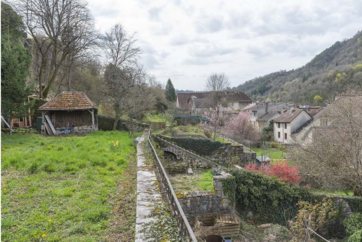
Vue depuis la terrasse supérieure (n° 88 et 86).

39, Salins-les-Bains, 88 rue de la Liberté