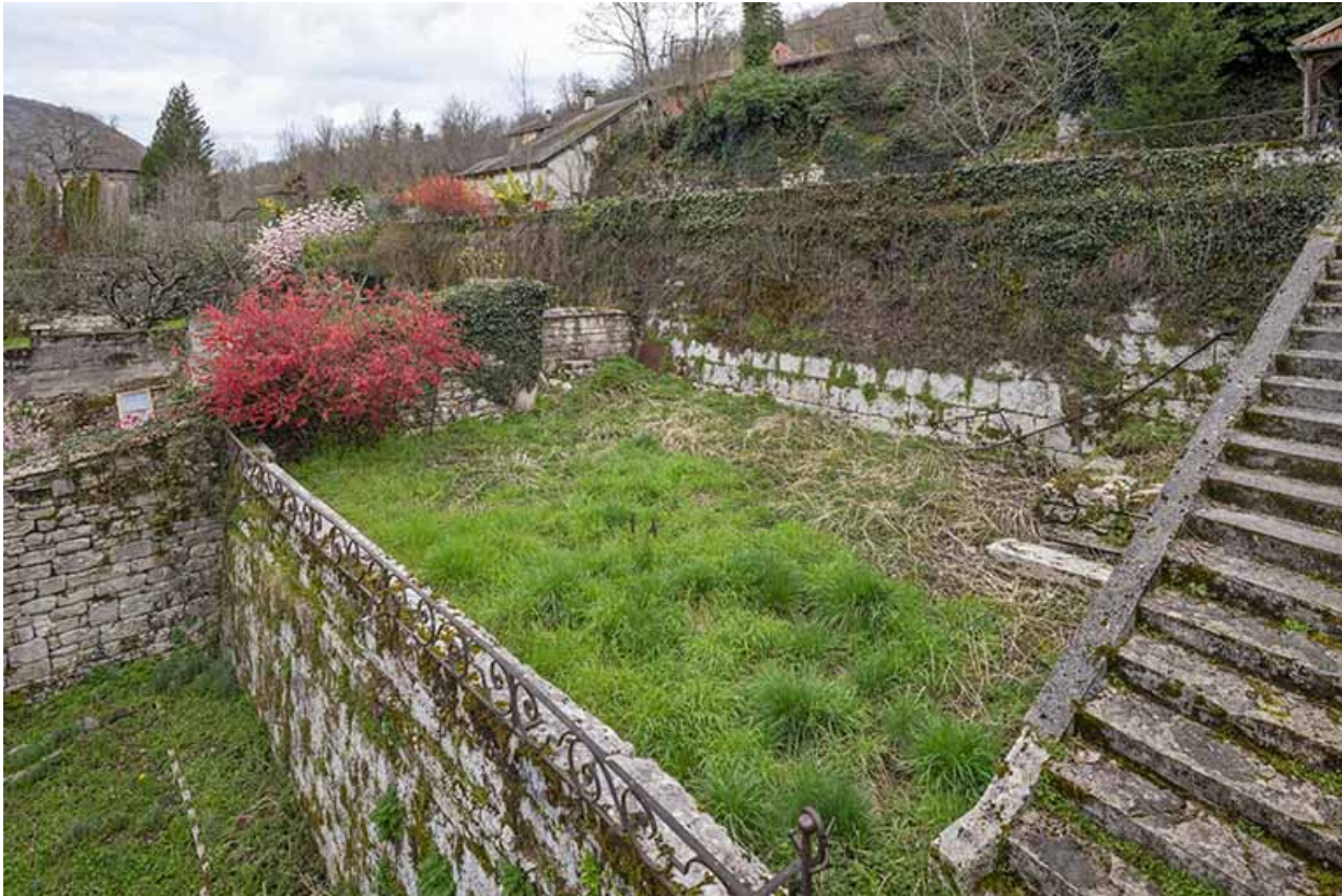
Vue sur la seconde terrasse.

39, Salins-les-Bains, 88 rue de la Liberté