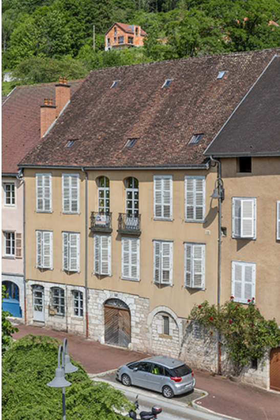
Vue d'ensemble de trois quarts droite.

39, Salins-les-Bains, 88 rue de la Liberté