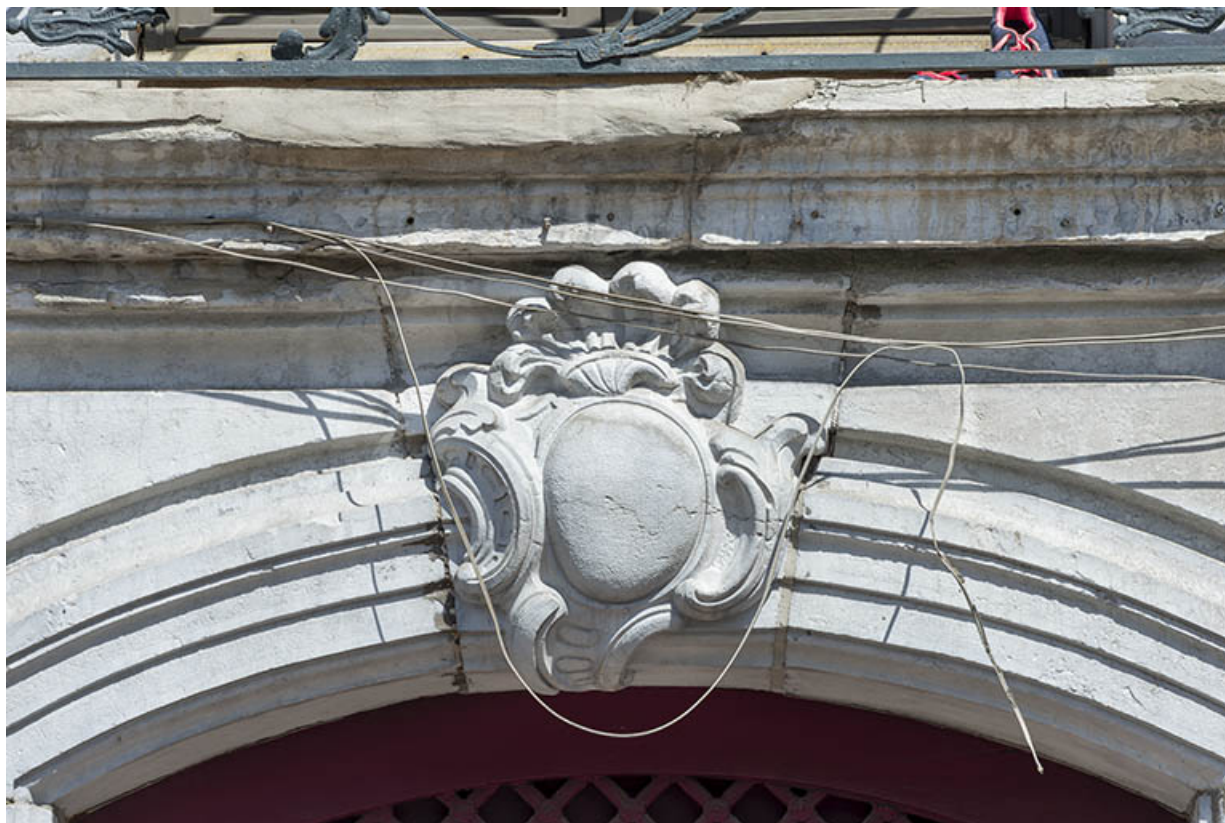
Porte principale. Détail de la clef de l'arc segmentaire.

39, Salins-les-Bains, 18 rue de la Liberté