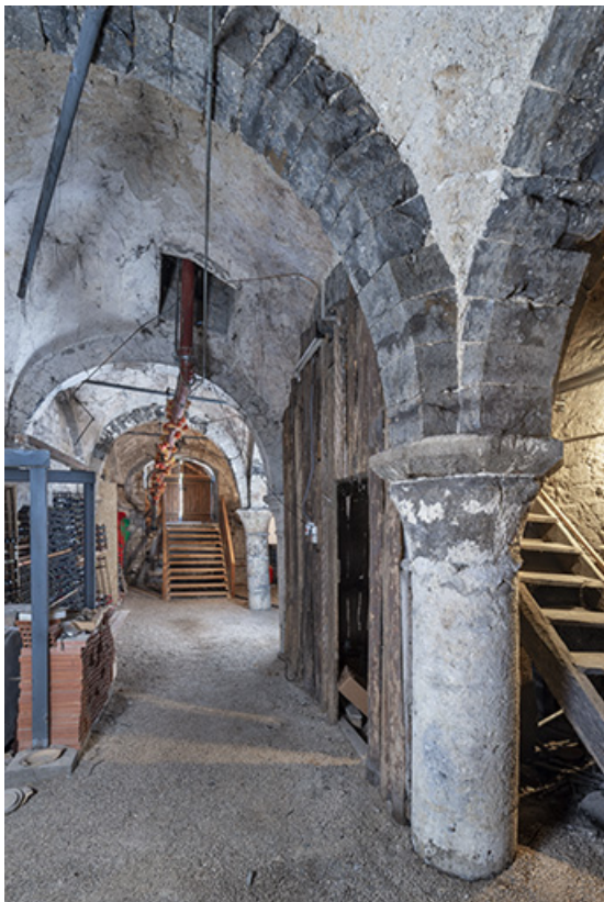
Vue d'ensemble de la cave, depuis l'est.

39, Salins-les-Bains, 7 rue de la Liberté