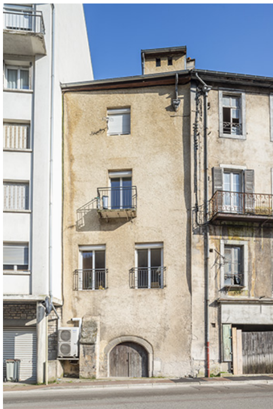
Façade ouest (rue Gambetta).

39, Salins-les-Bains, 7 rue de la Liberté