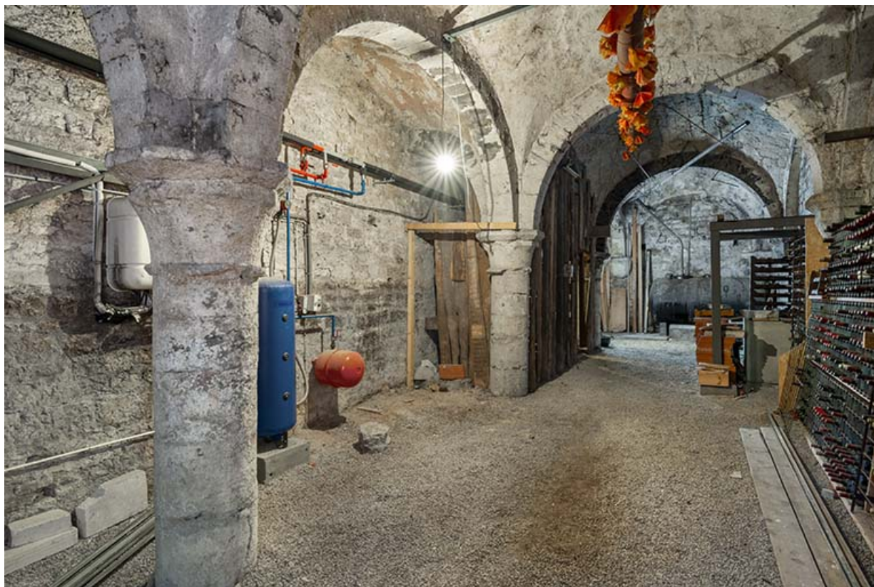
Cave vue de trois quarts, depuis l'ouest.

39, Salins-les-Bains, 7 rue de la Liberté