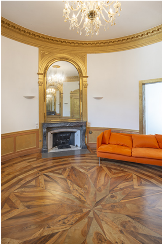
Salon circulaire. Vue depuis le sud.