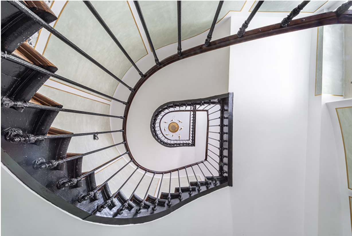
L'escalier principal (aile sud) depuis le rez-de-chaussée.