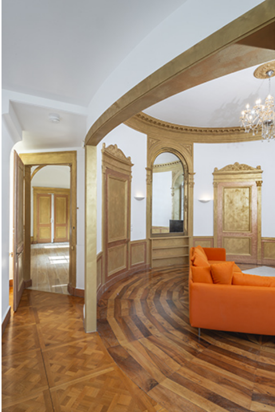
Premier étage. Couloir d'accès au salon circulaire.