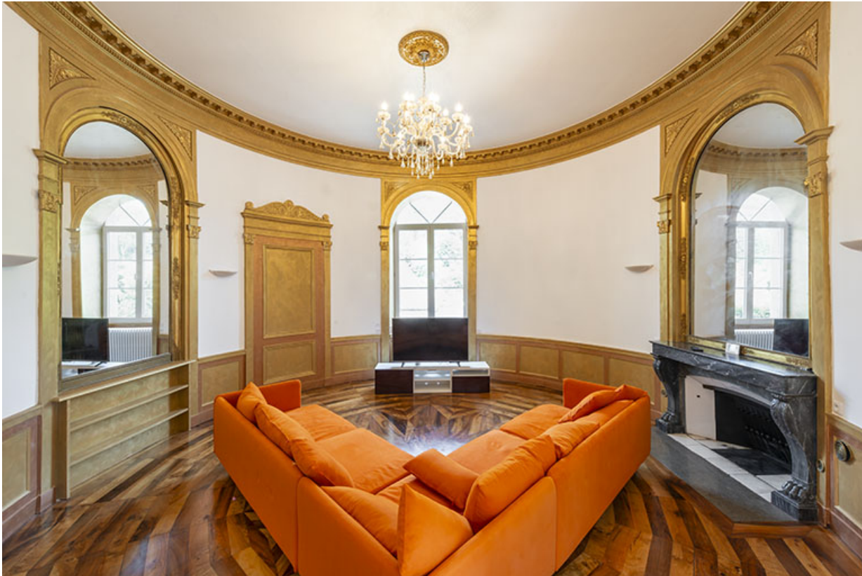
Salon circulaire. Vue d'ensemble.