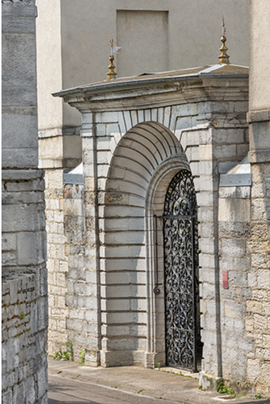
La porte monumentale vue de trois quarts.