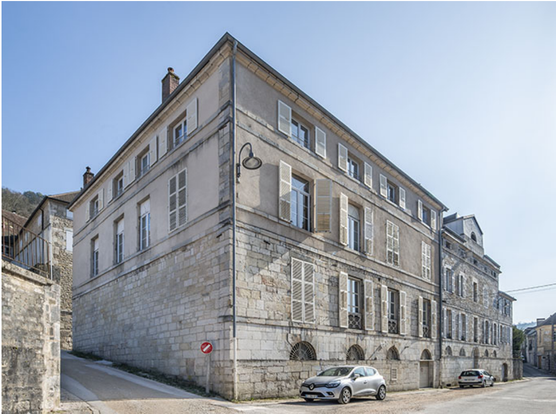
Vue de trois quarts, depuis le nord-ouest.