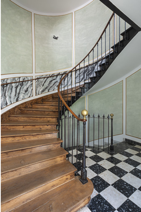
Escalier principal (aile sud). La première volée.