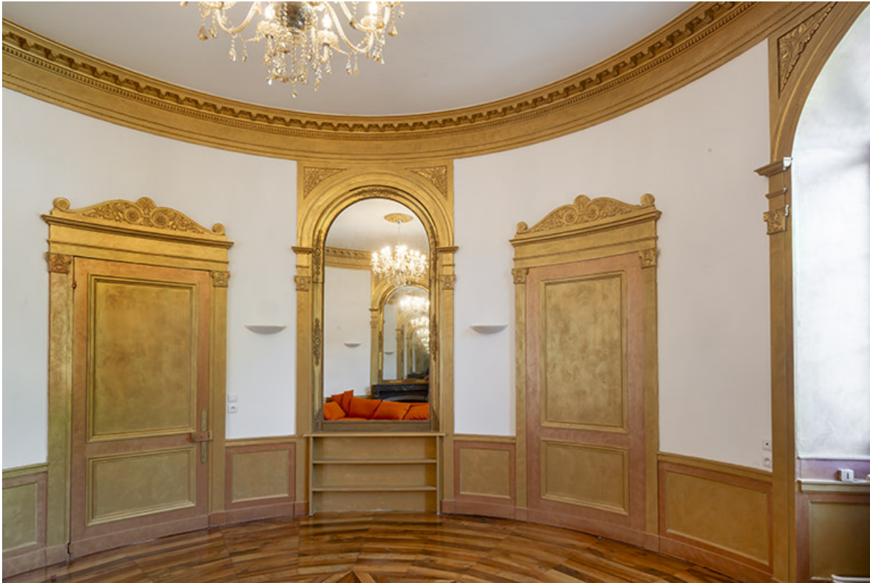
Salon circulaire. Vue depuis le nord. 39, Salins-les-Bains, 2 rue d' Orgemont