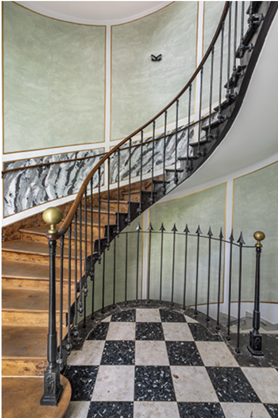
Départ de l'escalier principal (aile sud).