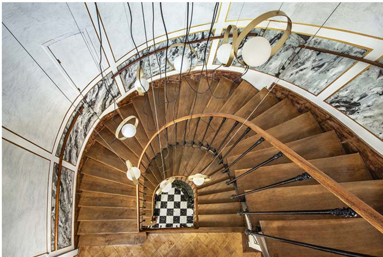
L'escalier principal (aile sud) depuis le second étage.