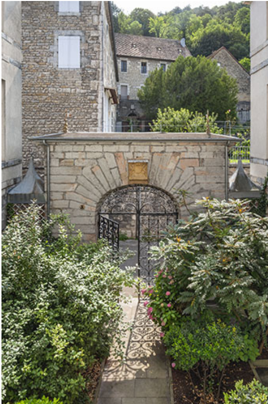
Vue de la cour depuis le premier étage.