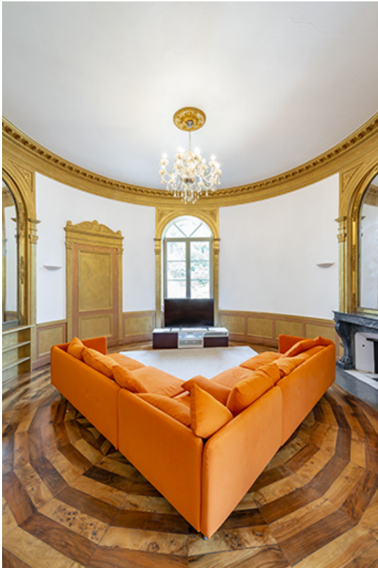
Salon circulaire. Vue d'ensemble.