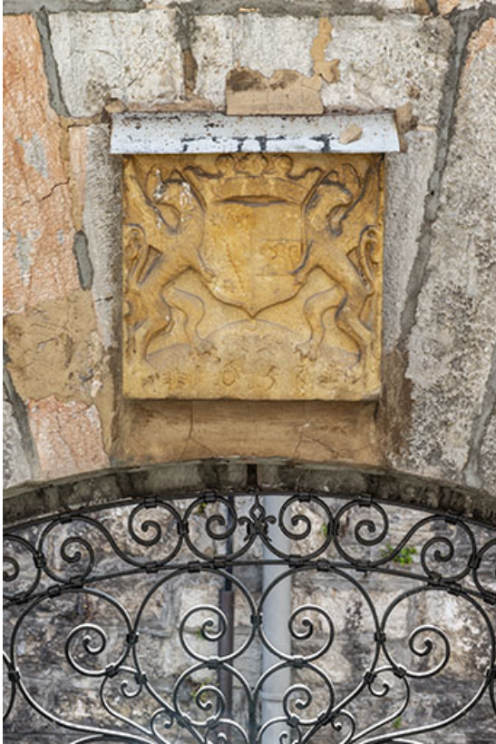
Relief armorié remployé sur le revers de la porte monumentale.