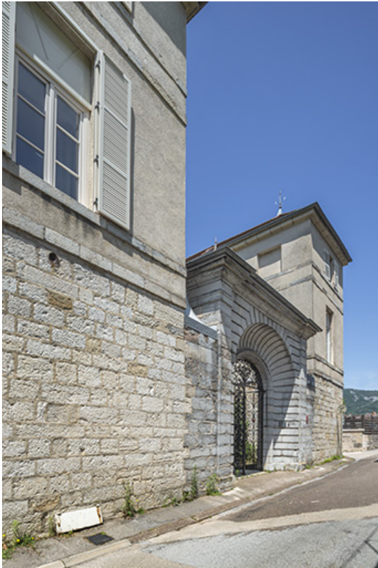
Façade antérieure vue de trois quarts gauche.