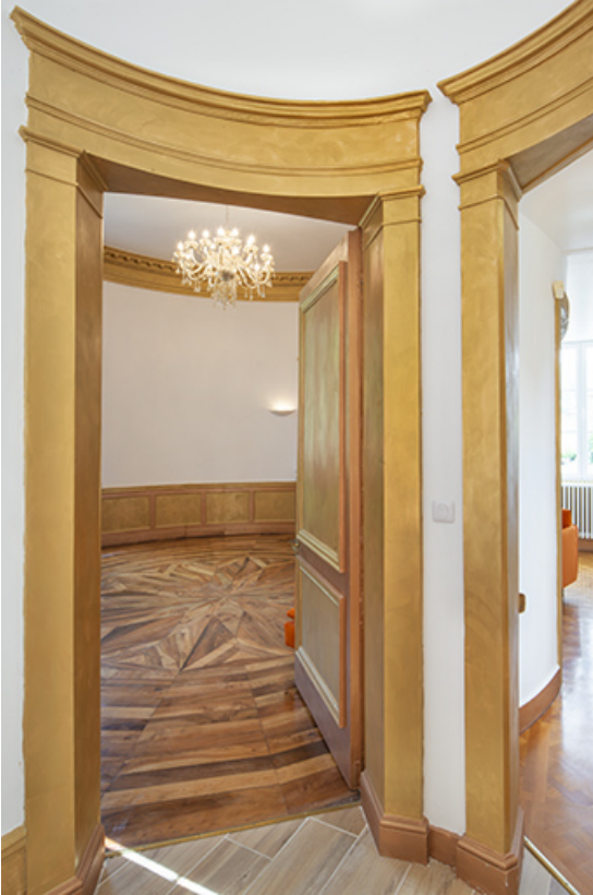
Porte d'accès au salon circulaire.