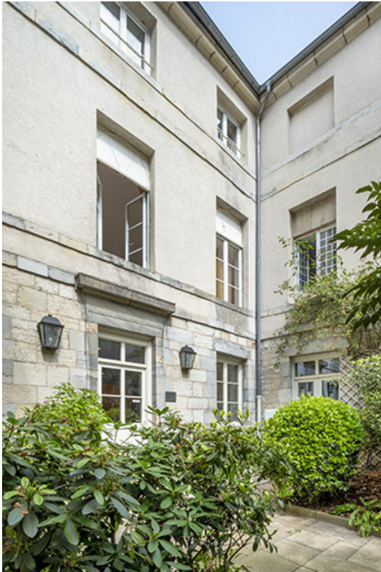
Aile sud vue depuis l'entrée.