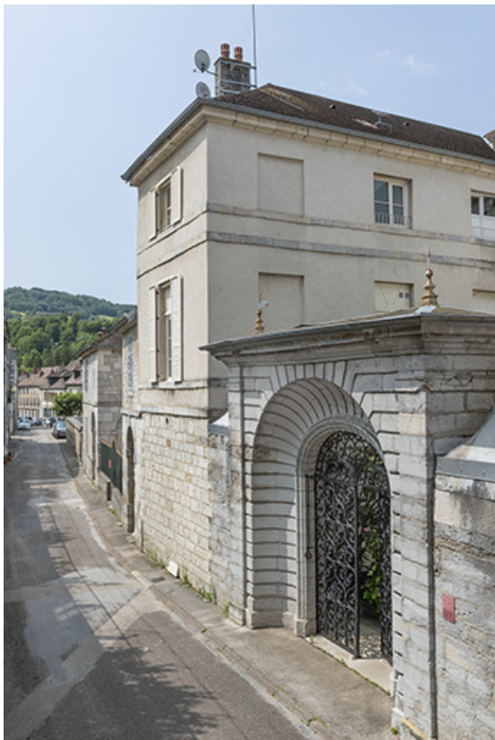
Vue plongeante depuis le nord-est.