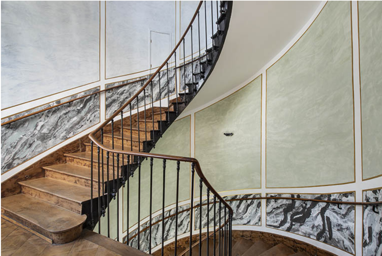
Escalier principal (aile sud). Vue depuis le premier étage.