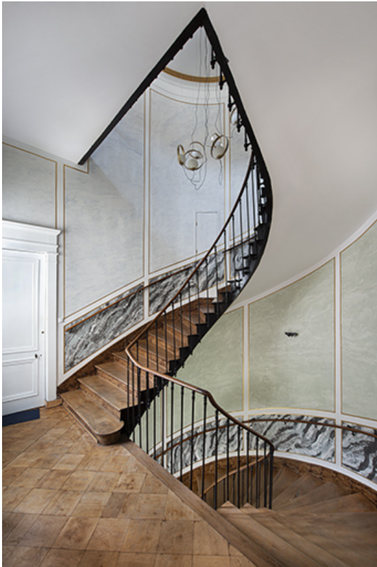
Escalier principal (aile sud). Vue depuis le premier étage.