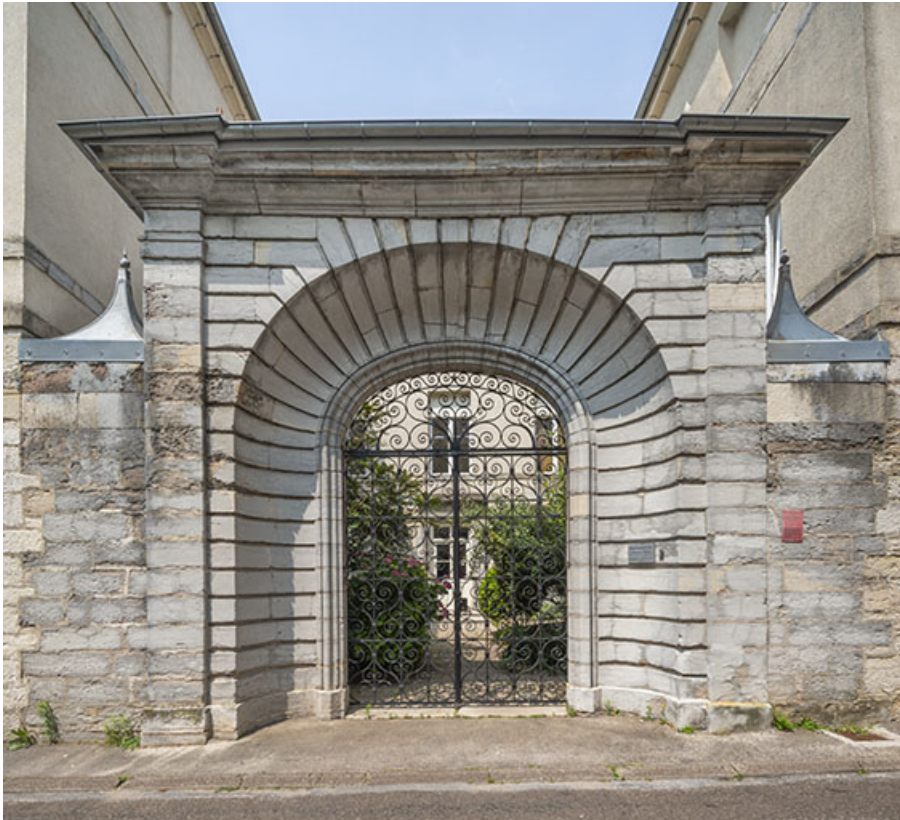
Porte monumentale. Vue de face.