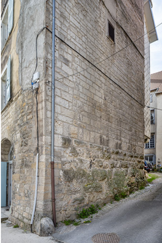
Façade nord du n°17.

39, Salins-les-Bains, 15, 17 rue de la Liberté