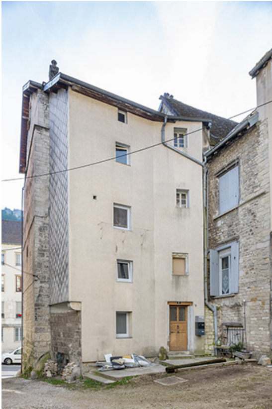
Façades postérieures des deux maisons depuis la cour des Halles.

39, Salins-les-Bains, 15, 17 rue de la Liberté