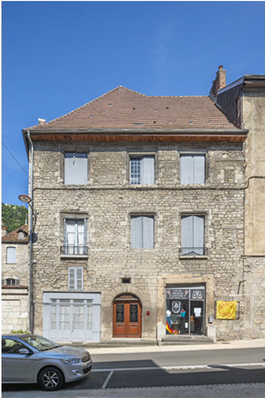
Bâtiment sud. Vue de face.

39, Salins-les-Bains, 15, 17 rue de la Liberté