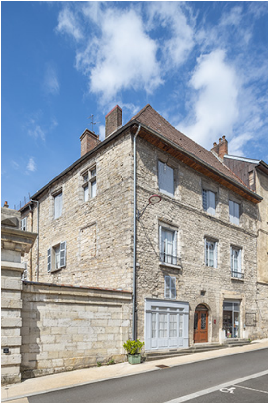
Vue d'ensemble de trois quarts gauche.

39, Salins-les-Bains, 15, 17 rue de la Liberté