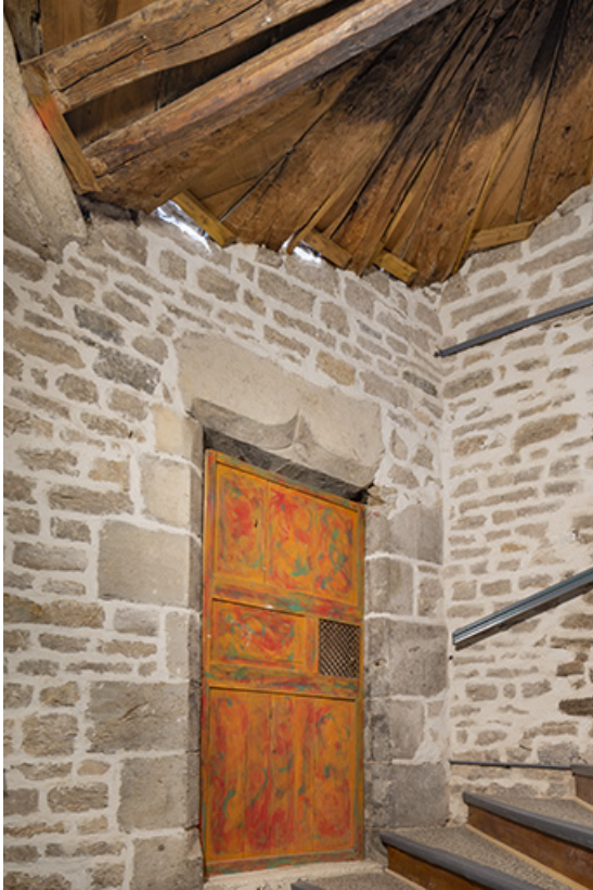
Escalier en vis (entrée n°1 cour des Halles). Porte palière.

39, Salins-les-Bains, 15, 17 rue de la Liberté