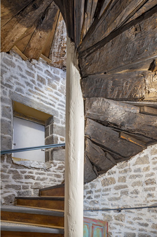
Escalier en vis (entrée n°1 cour des Halles). Détail des marches.

39, Salins-les-Bains, 15, 17 rue de la Liberté