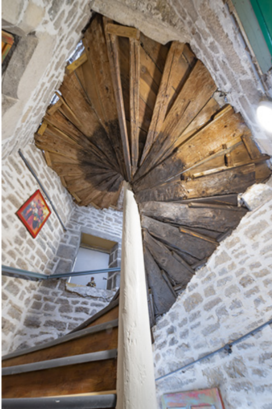
Escalier en vis (entrée n°1 cour des Halles). Vue en contre-plongée.

39, Salins-les-Bains, 15, 17 rue de la Liberté