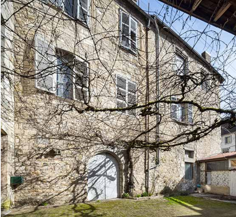
Façade sud (à gauche) depuis la cour de l'hôtel de Falletans.

39, Salins-les-Bains, 13 rue de la Liberté