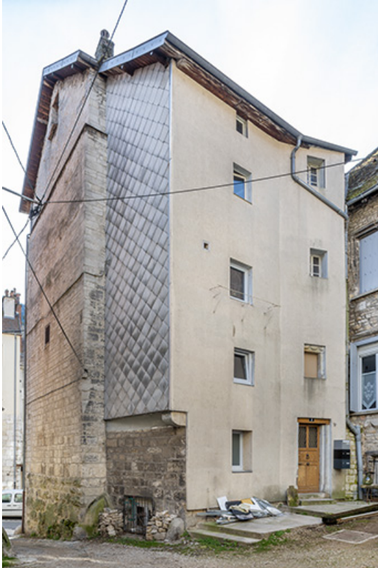
Façade postérieure (n°17) depuis la cour des Halles.

39, Salins-les-Bains, 15, 17 rue de la Liberté