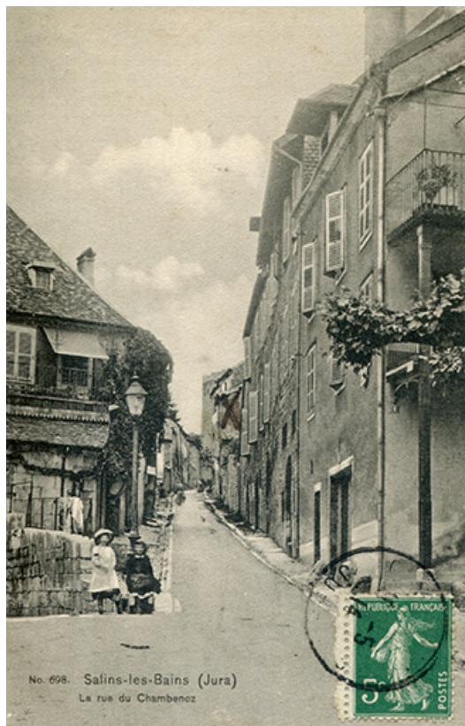
Salins-les-Bains (Jura). La rue du Chambenois, carte postale, s.d. [fin 19e ou début 20e siècle]. 39, Salins-les-Bains, 4 rue des Chambenois