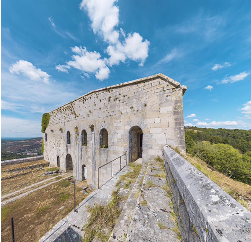
Vue de trois quarts droit de la façade postérieure.

39, Salins-les-Bains chemin Touillon, lieudit : Belin