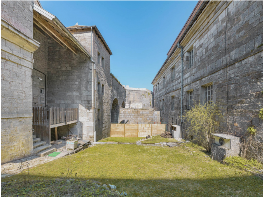
Façade postérieure (à droite).

39, Salins-les-Bains chemin communal du fort Saint-André, lieudit : Fort Saint-André