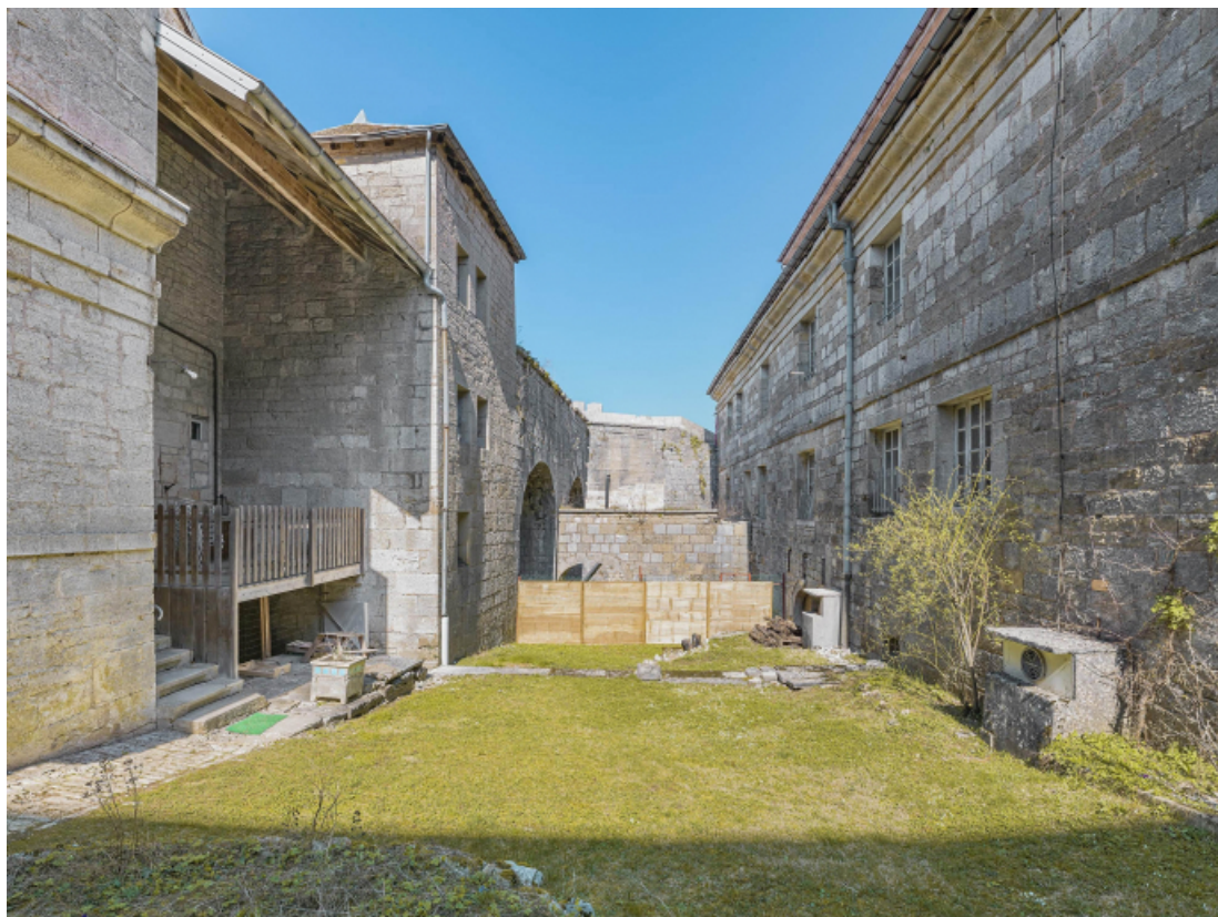
Façade postérieure (à droite).

39, Salins-les-Bains chemin communal du fort Saint-André, lieudit : Fort Saint-André