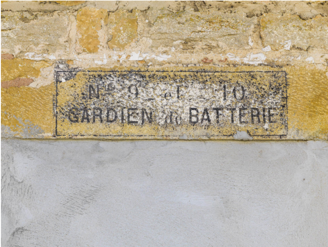
Porte murée avec inscription "gardien de batterie".

39, Salins-les-Bains chemin communal du fort Saint-André, lieudit : Fort Saint-André