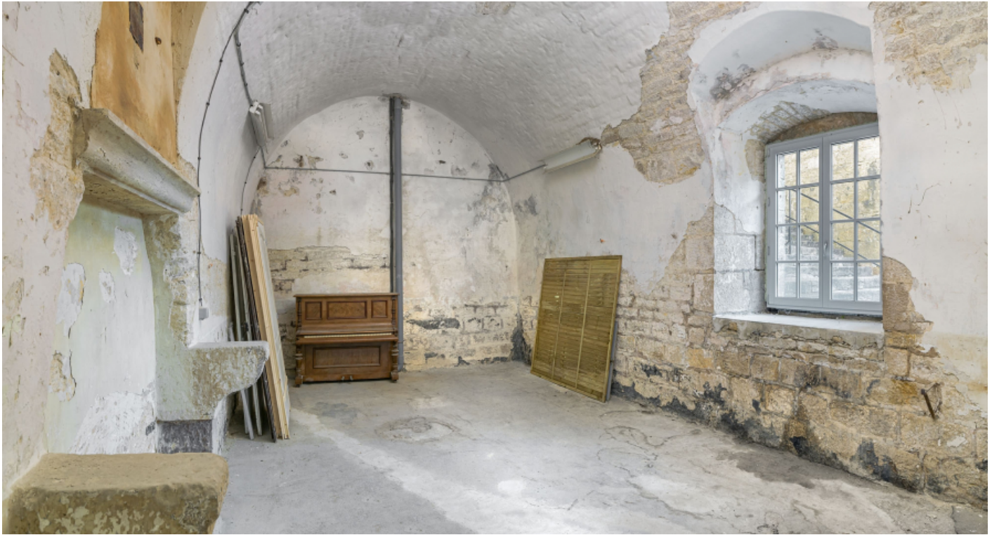
Le passage voûté : ancienne cave du major transformée en salle du corps de garde.

39, Salins-les-Bains chemin communal du fort Saint-André, lieudit : Fort Saint-André