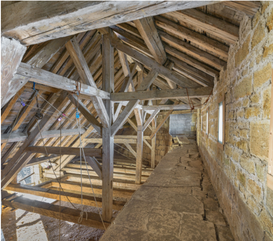
2e étage : charpente du bâtiment.

39, Salins-les-Bains chemin communal du fort Saint-André, lieudit : Fort Saint-André