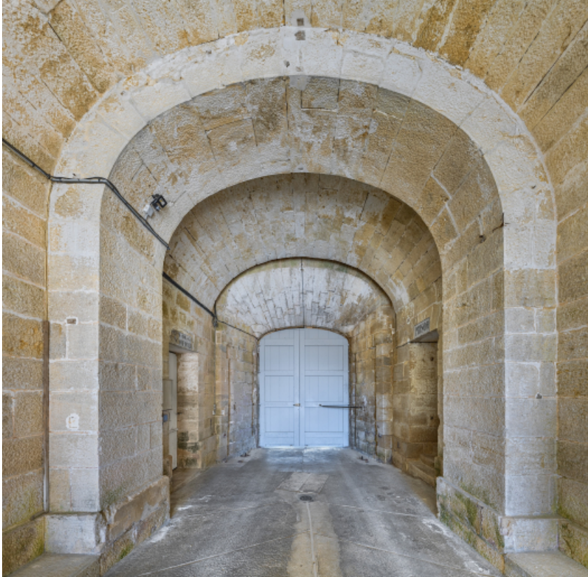
Pavillon d'entrée : passage voûté.

39, Salins-les-Bains chemin communal du fort Saint-André, lieudit : Fort Saint-André