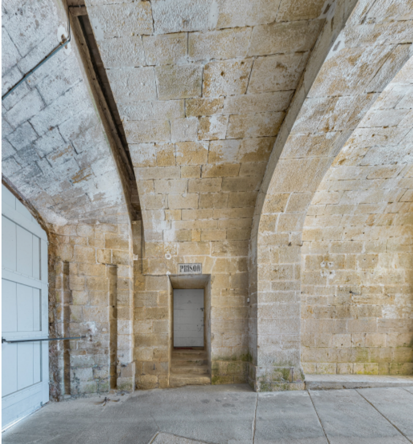
Le passage voûté : porte de l'ancienne prison.

39, Salins-les-Bains chemin communal du fort Saint-André, lieudit : Fort Saint-André