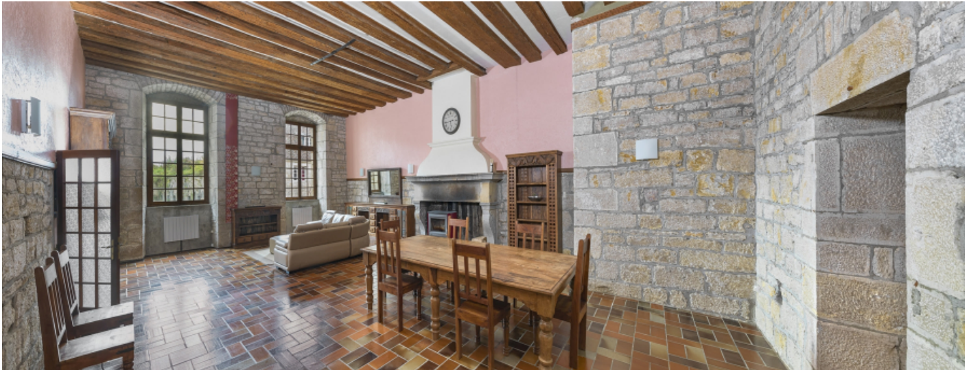
1er étage, logement destiné aux officiers.

39, Salins-les-Bains chemin communal du fort Saint-André, lieudit : Fort Saint-André