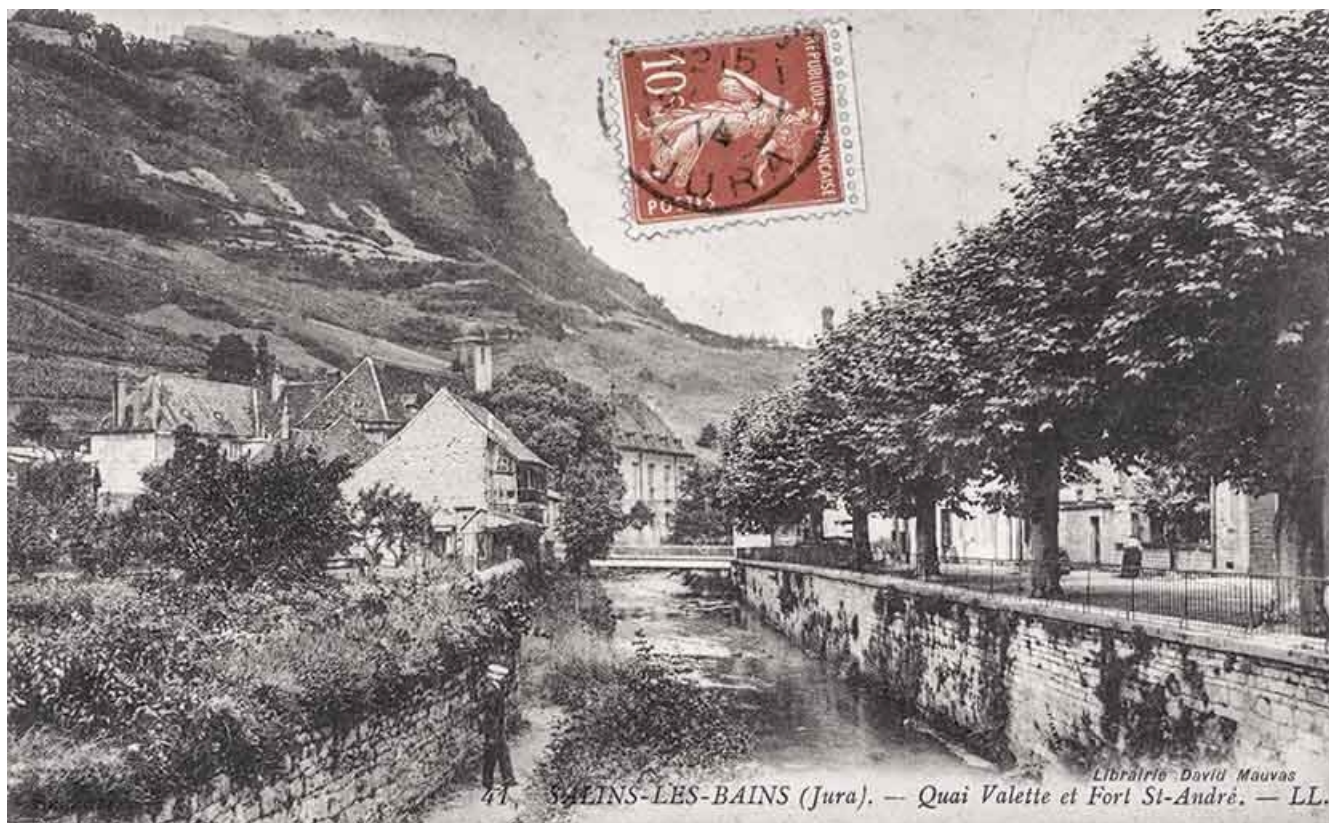
Salins-les-Bains (Jura). Intérieur du fort Saint-André. S.d.

39, Salins-les-Bains chemin communal du Fort Saint-André, lieudit : Fort Saint-André