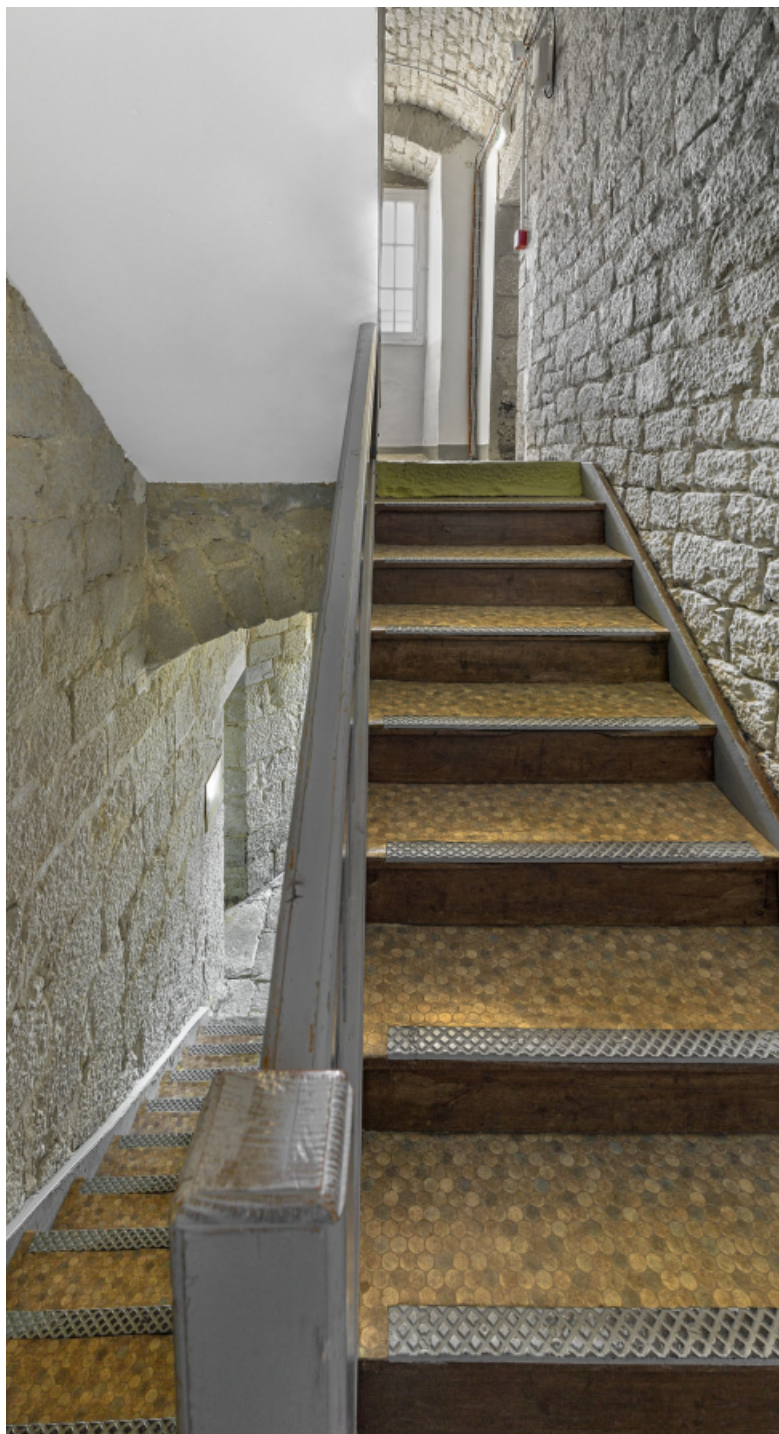
Caserne U : escalier tournant vers l'étage carré.

39, Salins-les-Bains chemin communal du Fort Saint-André, lieudit : Fort Saint-André