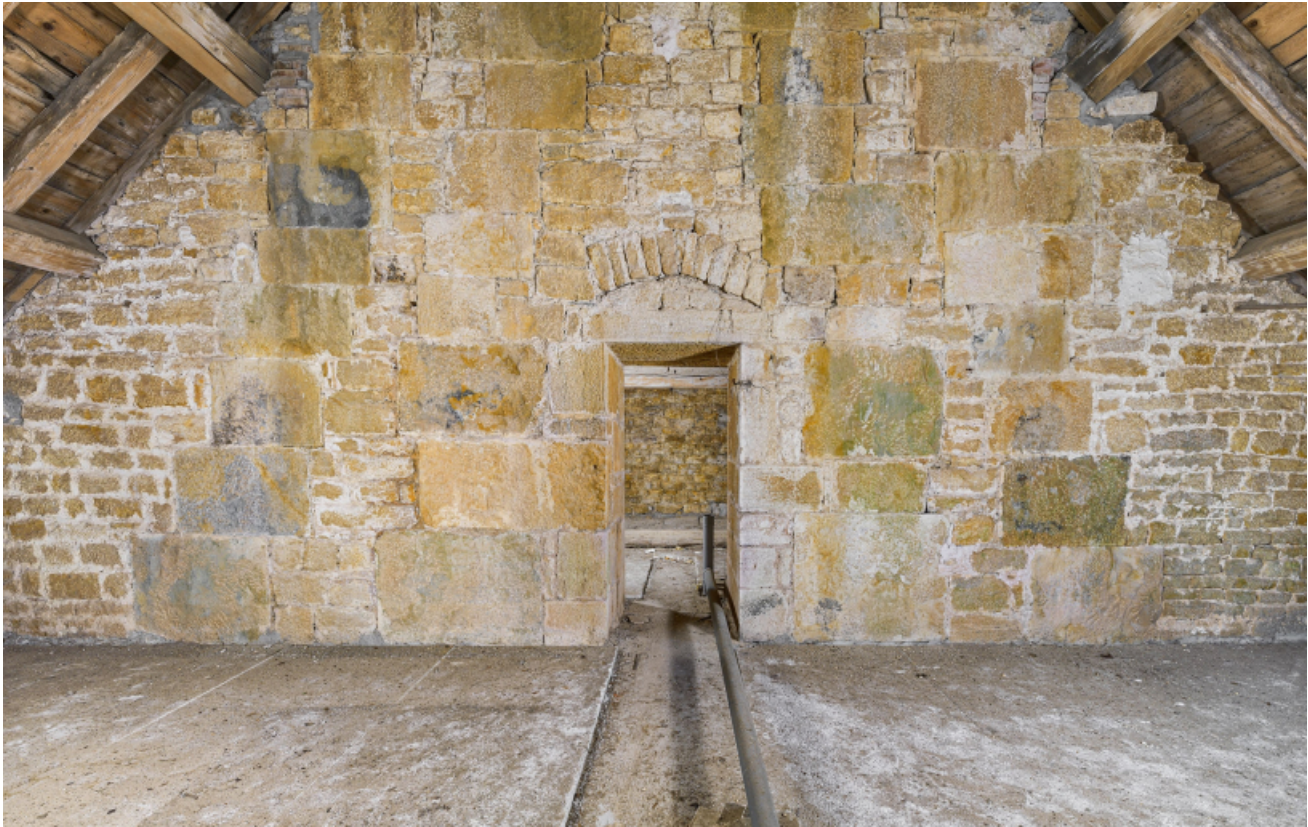
Caserne U, grenier : un des trois murs de refend.

39, Salins-les-Bains chemin communal du Fort Saint-André, lieudit : Fort Saint-André