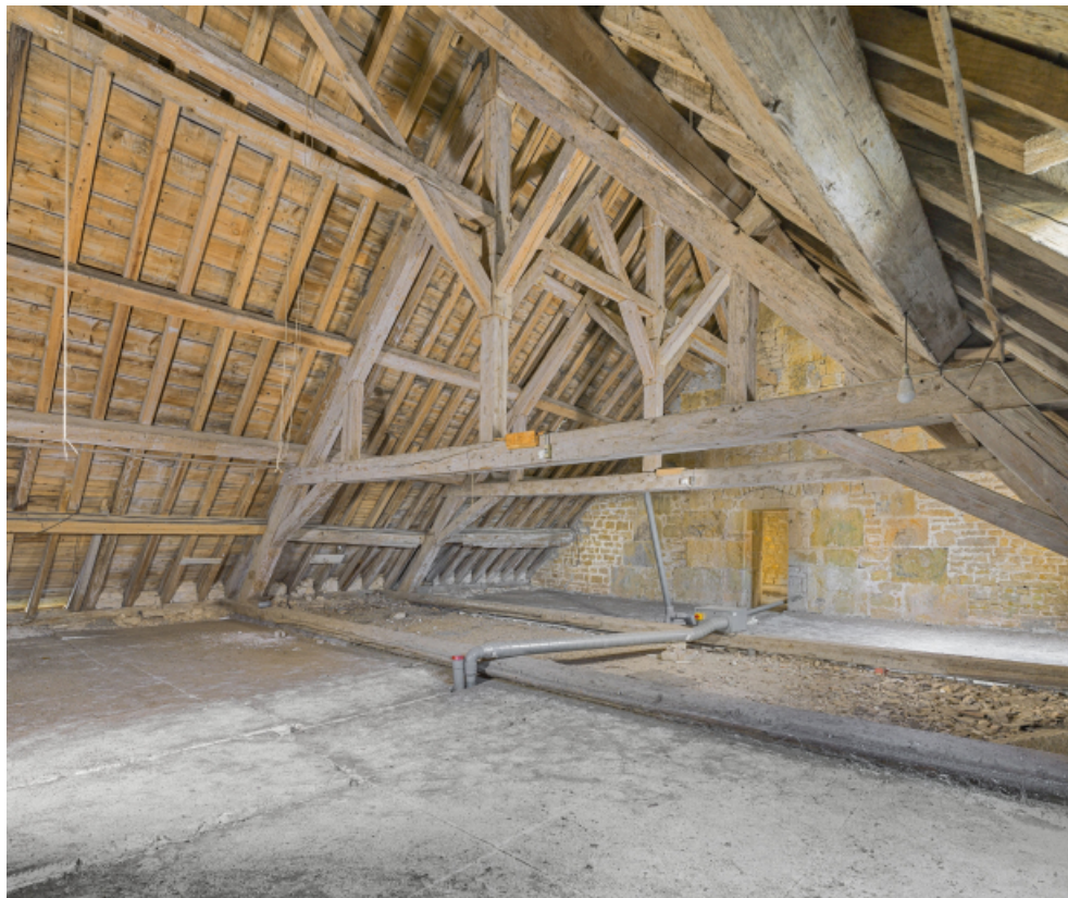
Caserne U, grenier : charpente du bâtiment.

39, Salins-les-Bains chemin communal du Fort Saint-André, lieudit : Fort Saint-André