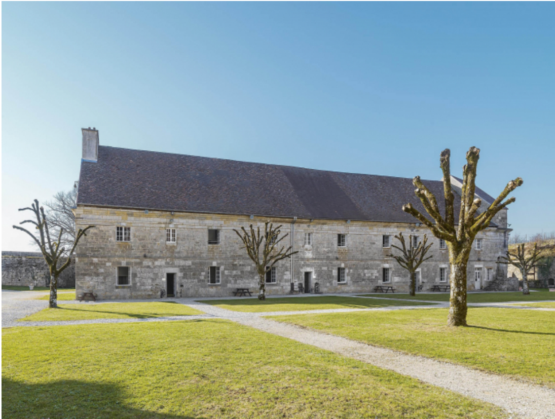
Caserne V : façade antérieure.

39, Salins-les-Bains chemin communal du Fort Saint-André, lieudit : Fort Saint-André