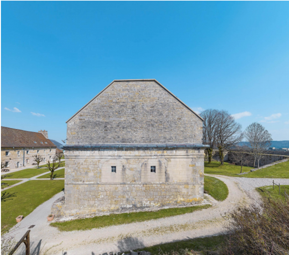
Caserne V : Mur pignon.

39, Salins-les-Bains chemin communal du Fort Saint-André, lieudit : Fort Saint-André