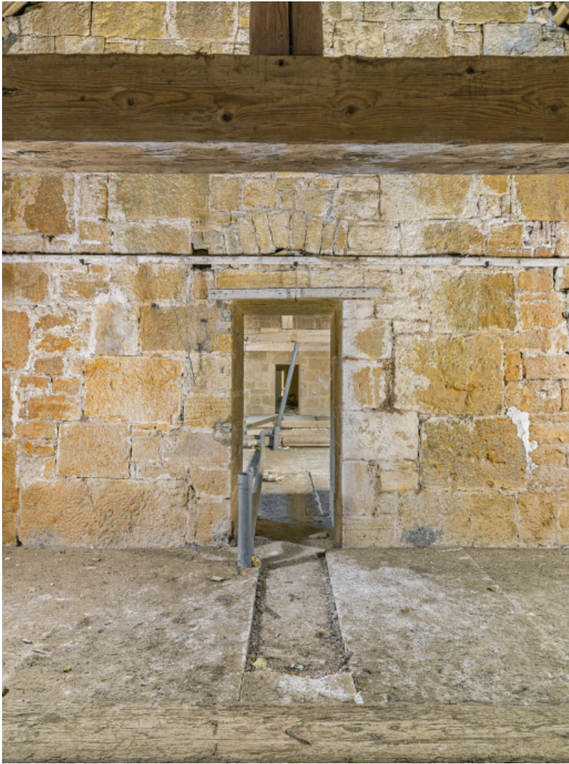
Caserne U, grenier : vue traversante.

39, Salins-les-Bains chemin communal du Fort Saint-André, lieudit : Fort Saint-André