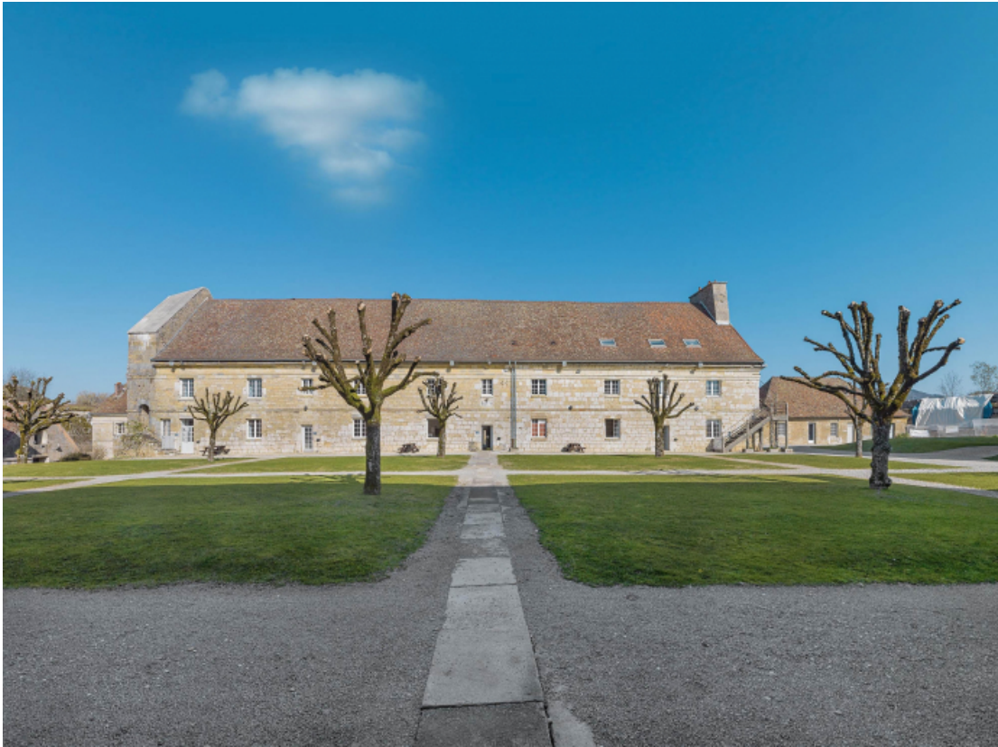
Caserne U : façade antérieure.

39, Salins-les-Bains chemin communal du Fort Saint-André, lieudit : Fort Saint-André