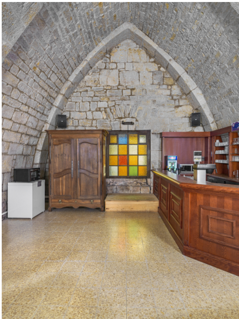
Vue intérieure depuis l'entrée.

39, Salins-les-Bains chemin communal du Fort Saint-André, lieudit : Fort Saint-André