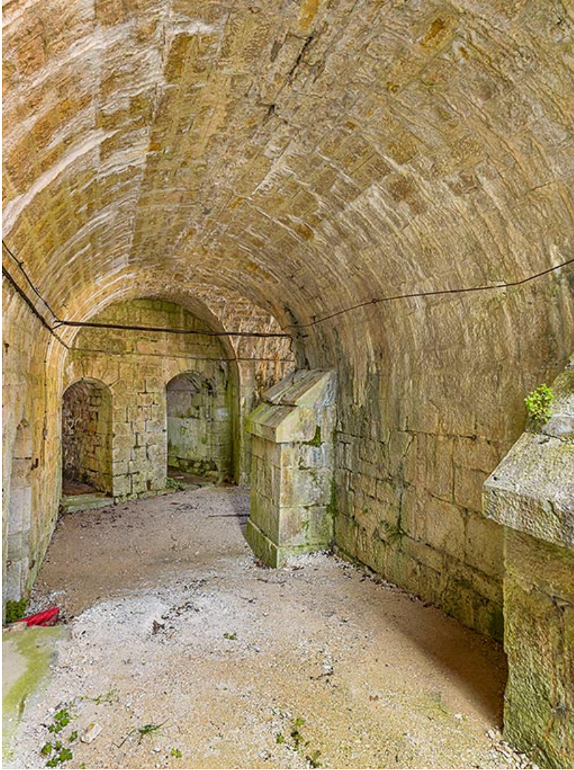
Une partie du couloir entourant l'édifice.

39, Salins-les-Bains chemin communal du Fort Saint-André, lieudit : Fort Saint-André