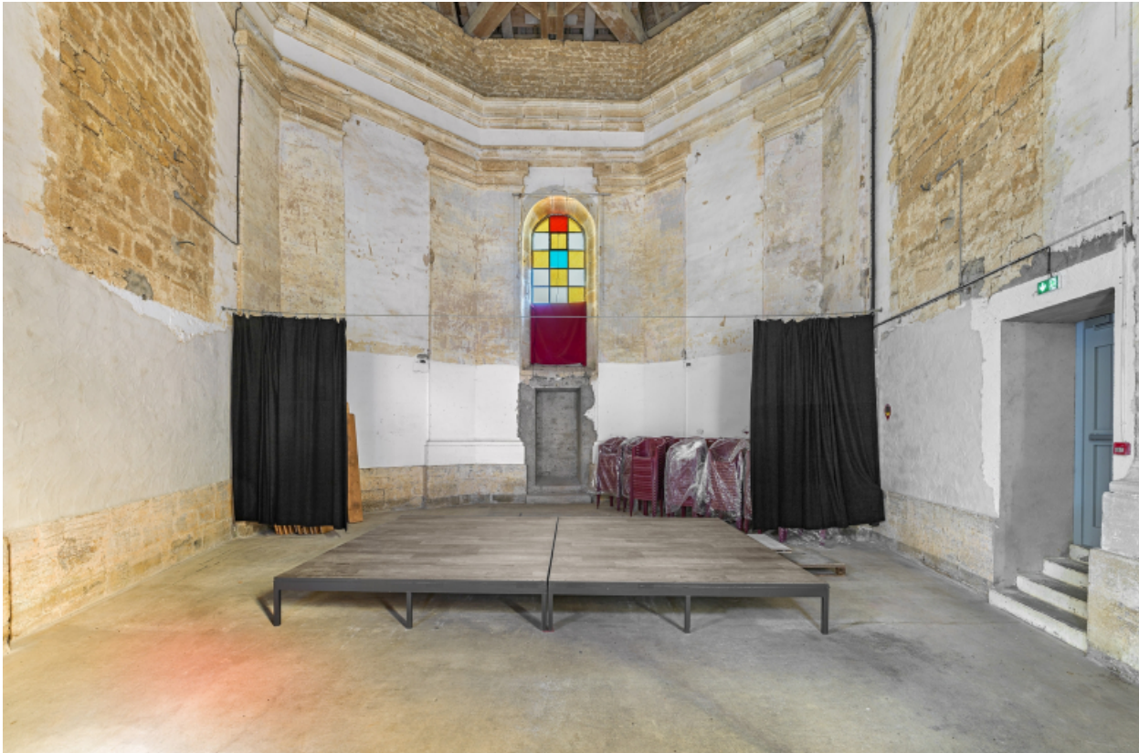
Le chœur, vue d'ensemble.

39, Salins-les-Bains chemin du Fort Saint-André, lieudit : Fort Saint-André