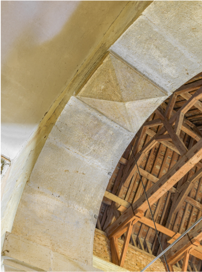
Clé de voûte de l'arcade centrale de la tribune.

39, Salins-les-Bains chemin du Fort Saint-André, lieudit : Fort Saint-André