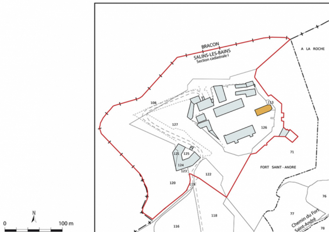
Plan-masse et de situation. Extrait du plan cadastral, 2021, section I, 1/2 000.

39, Salins-les-Bains chemin du Fort Saint-André, lieudit : Fort Saint-André