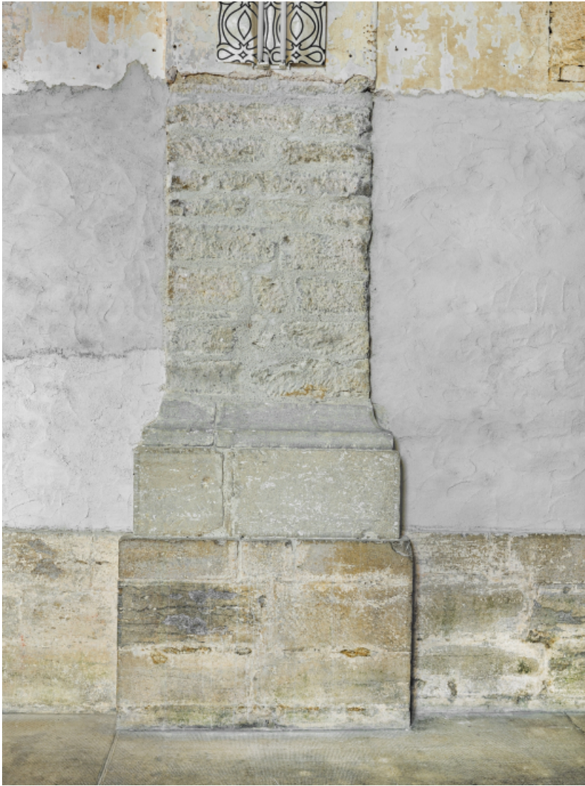
Pilastre dans la nef.

39, Salins-les-Bains chemin du Fort Saint-André, lieudit : Fort Saint-André