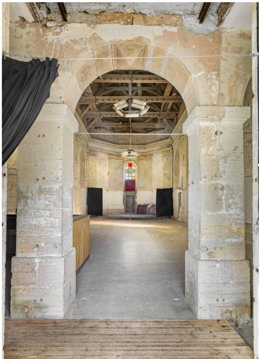
La nef et le chœur, vue depuis le narthex.

39, Salins-les-Bains chemin du Fort Saint-André, lieu dit : Fort Saint-André