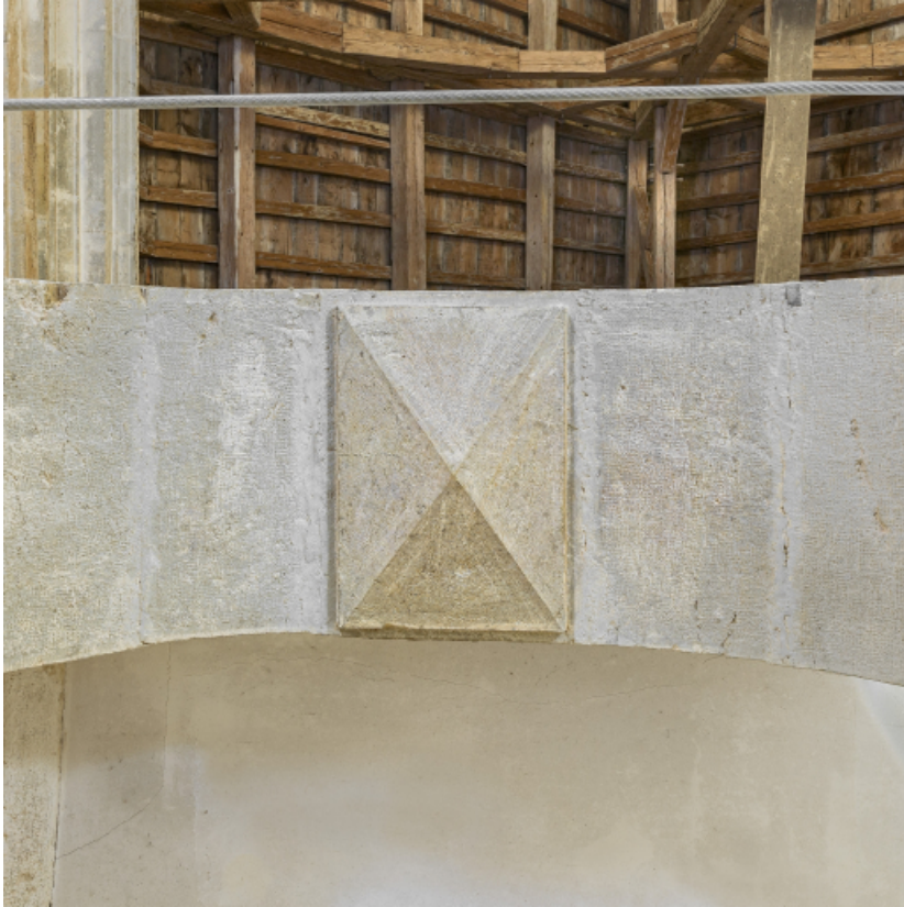
Détail de la clé de voûte de la tribune.

39, Salins-les-Bains chemin du Fort Saint-André, lieudit : Fort Saint-André