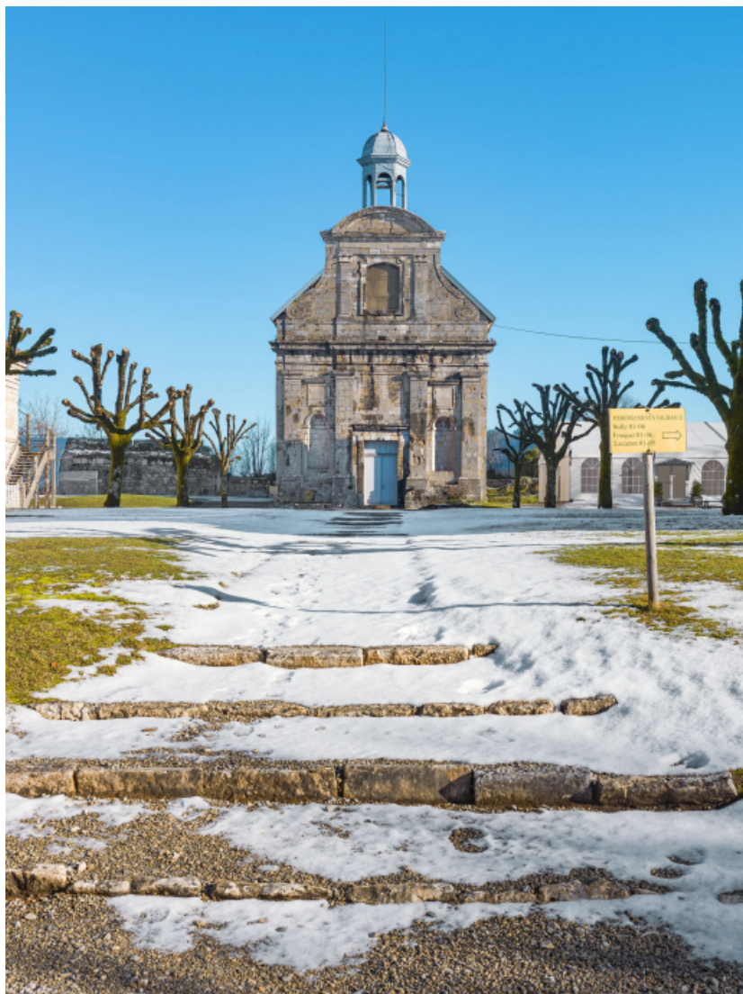
Façade principale de la chapelle depuis la place d'armes.

39, Salins-les-Bains chemin du Fort Saint-André, lieudit : Fort Saint-André