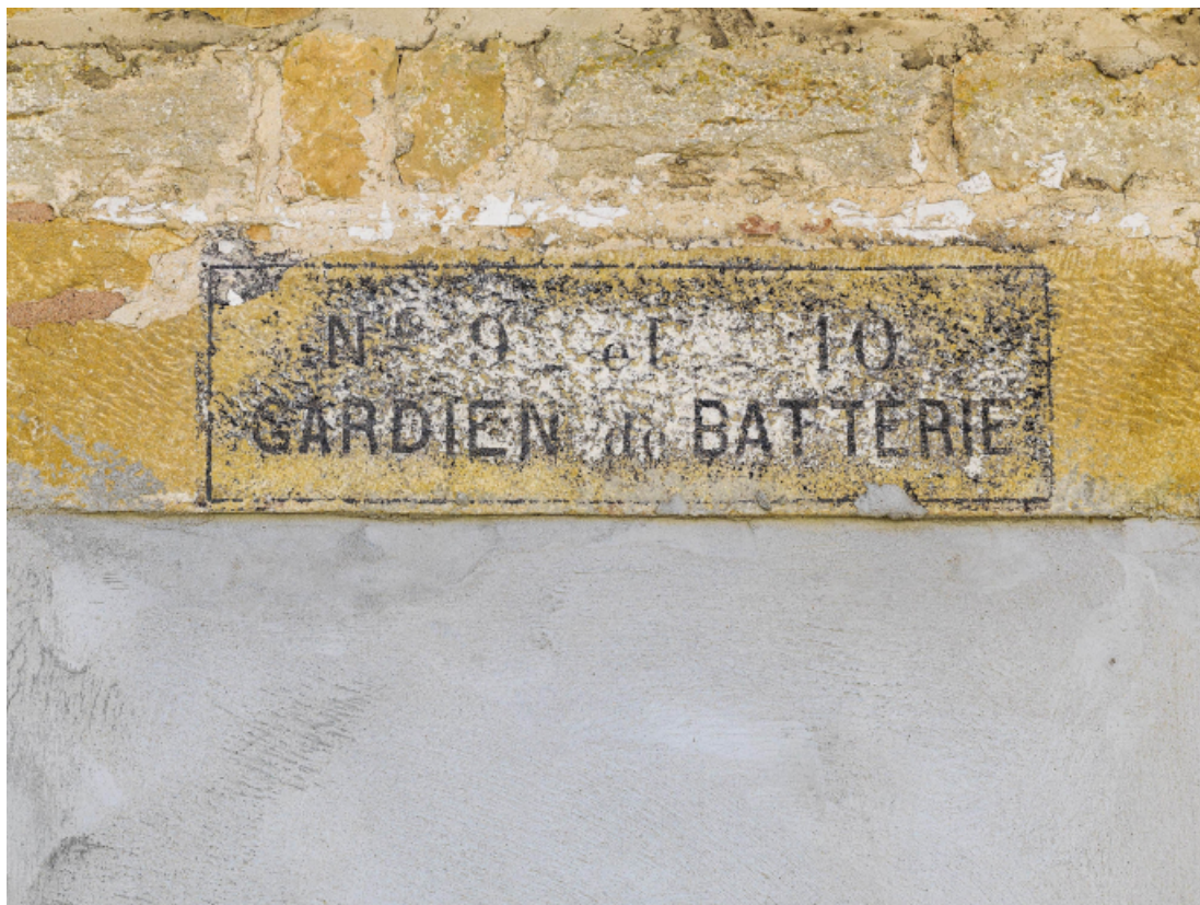
Porte murée avec inscription "gardien de batterie".

39, Salins-les-Bains chemin communal du fort Saint-André, lieudit : Fort Saint-André