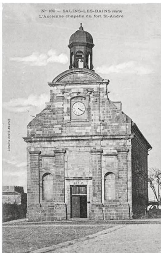
Salins-les-Bains (Jura). L'ancienne chapelle du fort Saint-André. S.d.[1ère moitié 20e siècle].

39, Salins-les-Bains chemin du Fort Saint-André, lieudit : Fort Saint-André