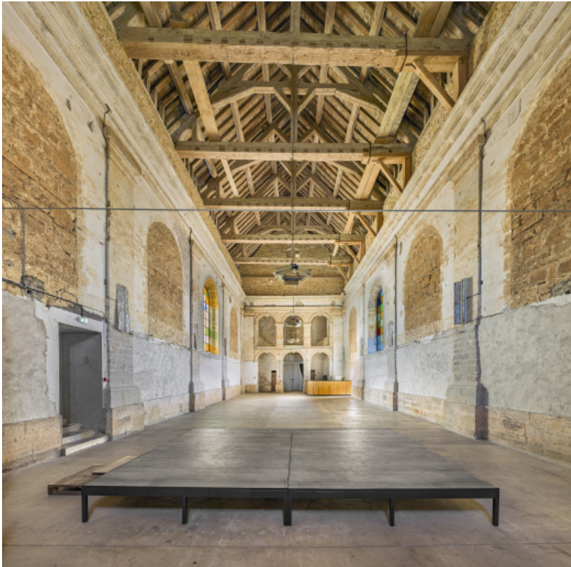
La nef, vue depuis le chœur.

39, Salins-les-Bains chemin du Fort Saint-André, lieudit : Fort Saint-André