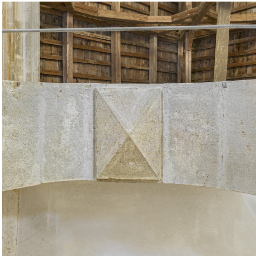
Détail de la clé de voûte de la tribune.

39, Salins-les-Bains chemin du Fort Saint-André, lieudit : Fort Saint-André