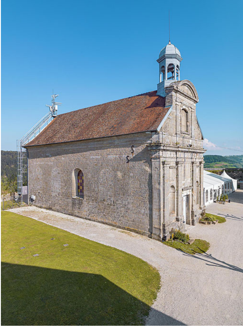
Cantine et logement du gardien de batterie : façade antérieure.

39, Salins-les-Bains chemin du Fort Saint-André, lieudit : Fort Saint-André