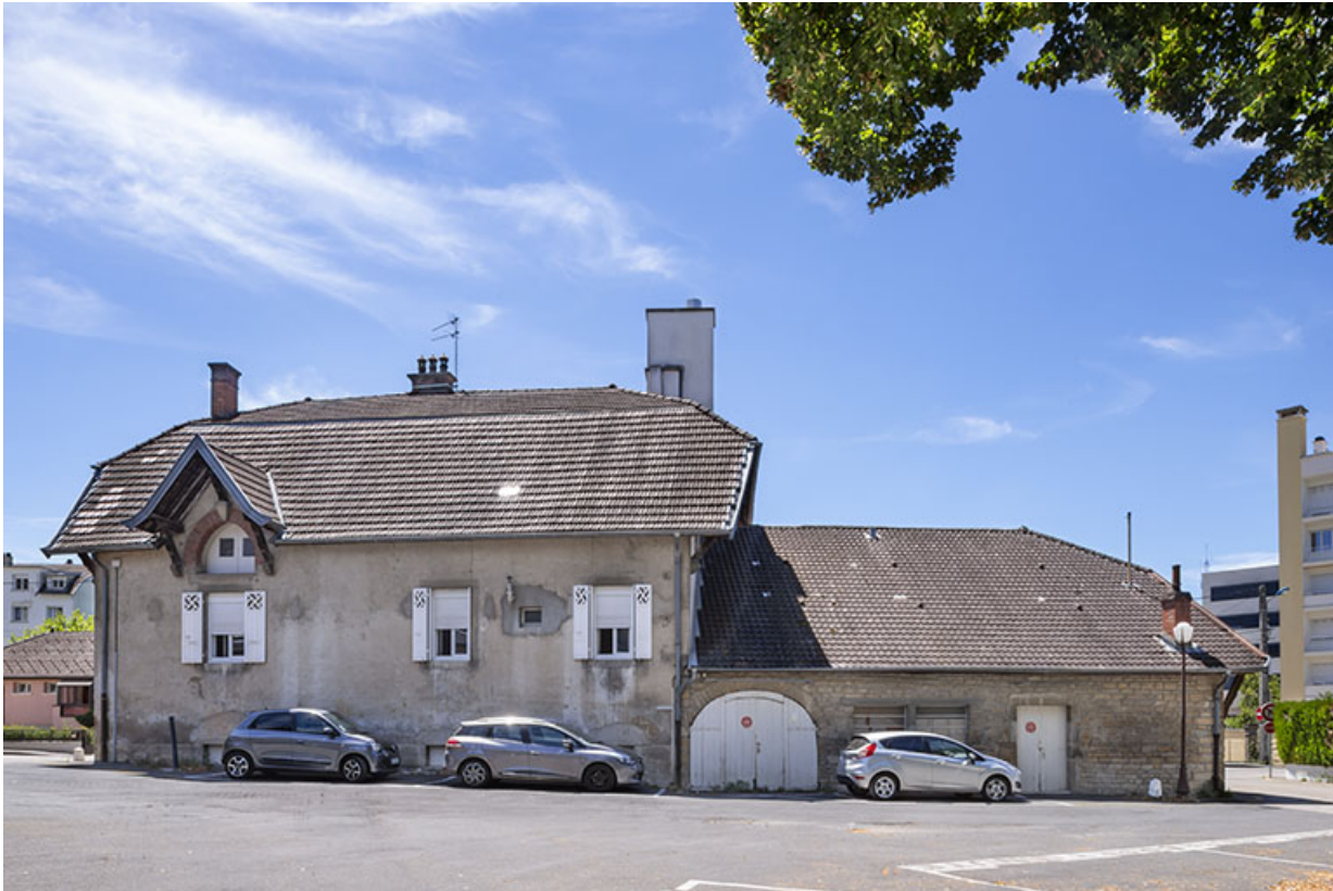
Vue depuis le nord.