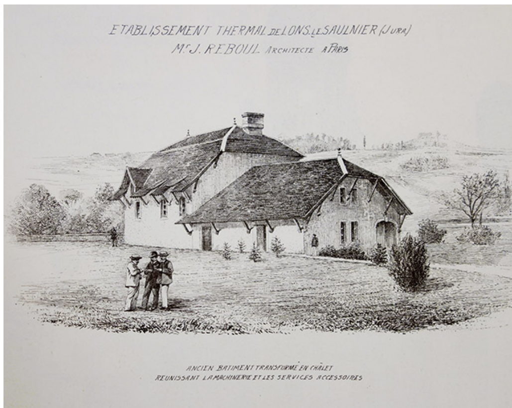
Vue ancienne (1896).