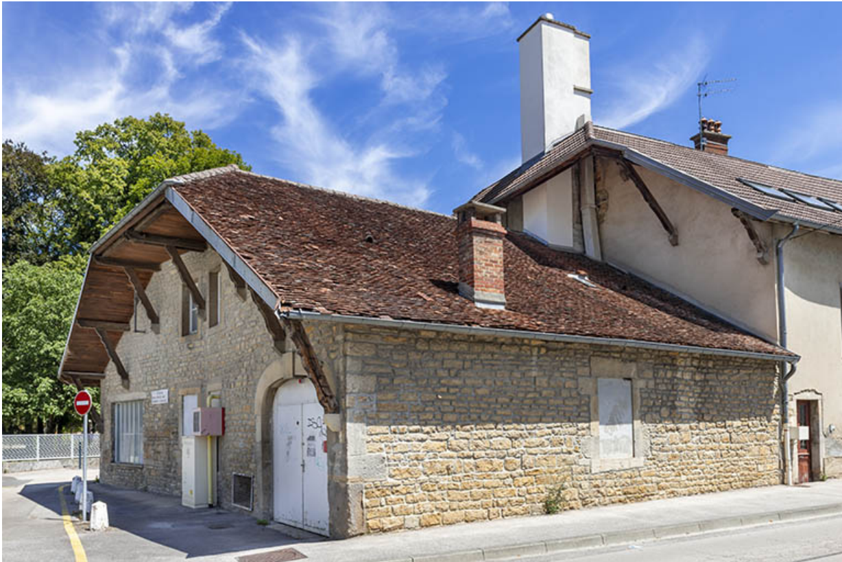
Vue depuis le sud-ouest.