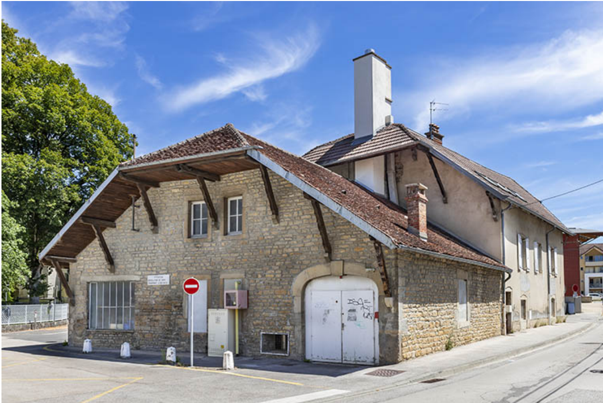
Vue depuis l'ouest.