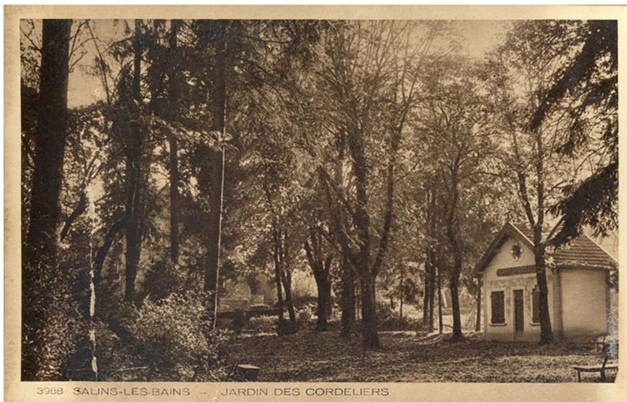
Salins-les-Bains - Jardin des Cordeliers, s.d. [vers 1930].