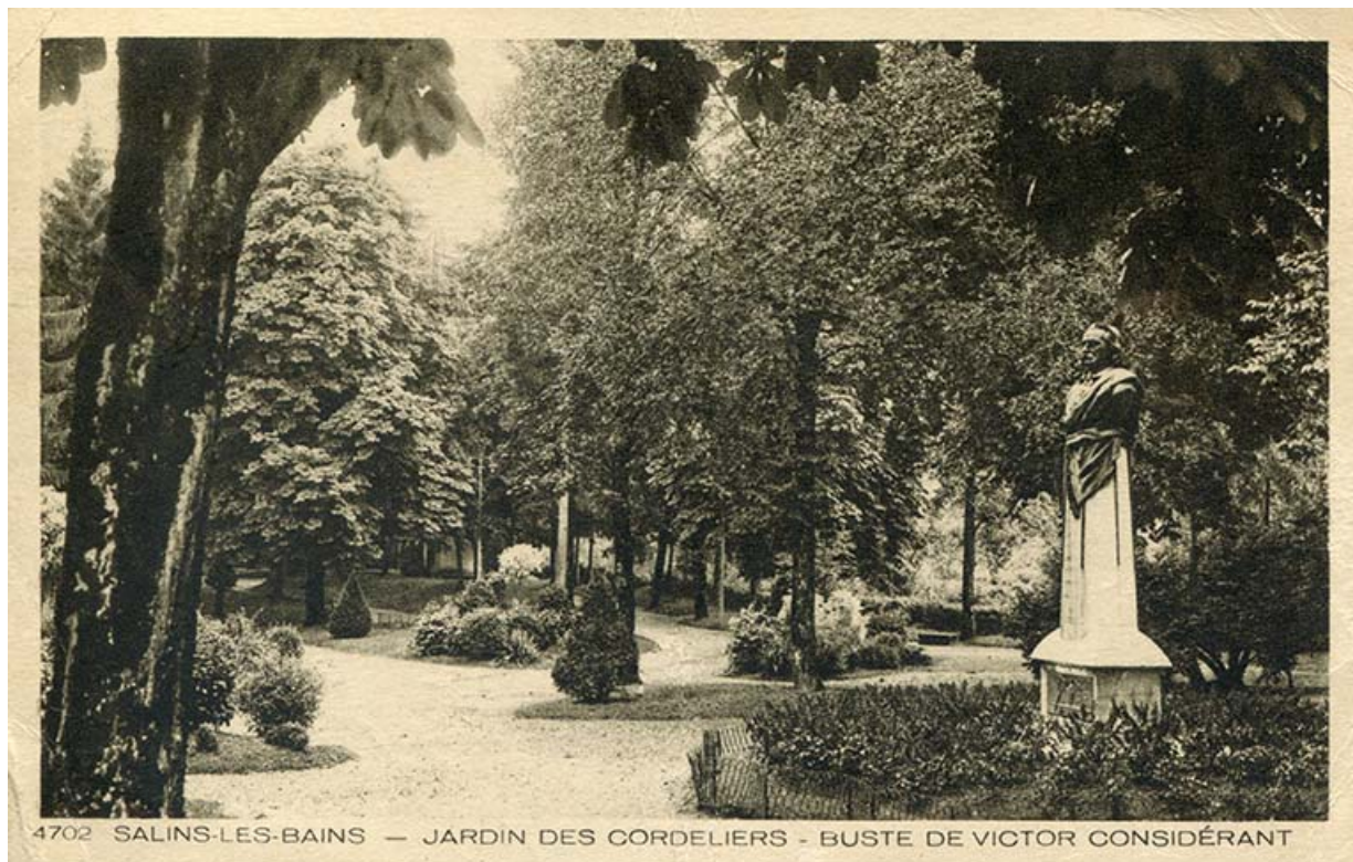
4702 SALINS-LES-BAINS — JARDIN DES CORDELIERS - BUSTE DE VICTOR CONSIDÉRANT

Salins-les-Bains - Jardin des Cordeliers - Buste de Victor Considerant, s.d. [fin 19e ou début 20e siècle]. 39, Salins-les-Bains rue Béchet