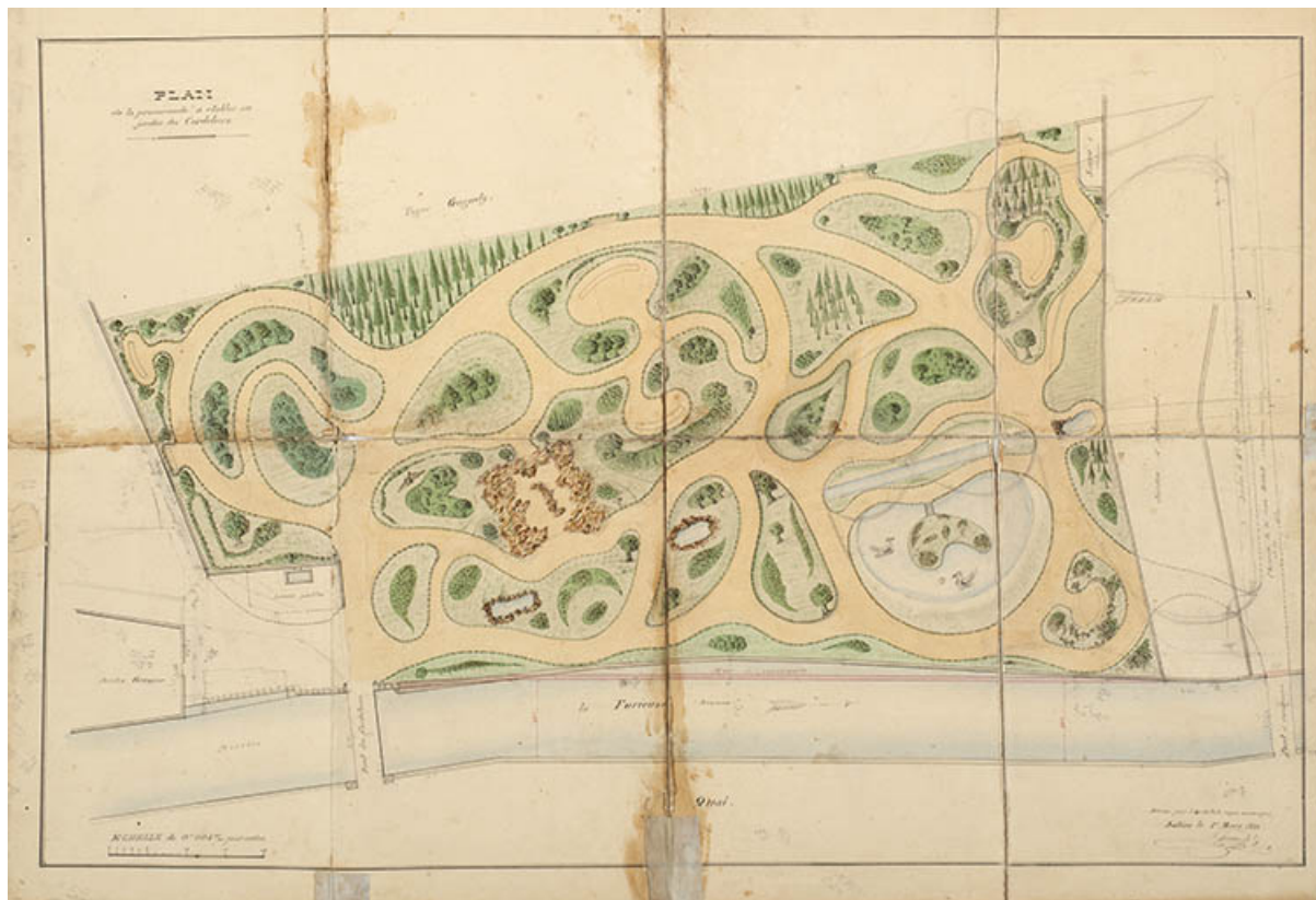
Plan de la promenade à établir au jardin des Cordeliers, 1880.