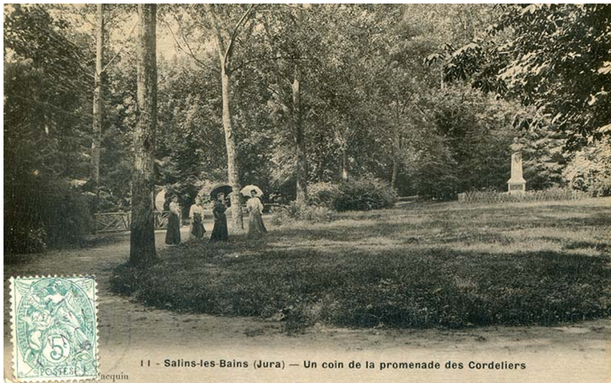
Salins-les-Bains (Jura). Un coin de la promenade des Cordeliers, s.d. [fin 19e ou début 20e siècle].