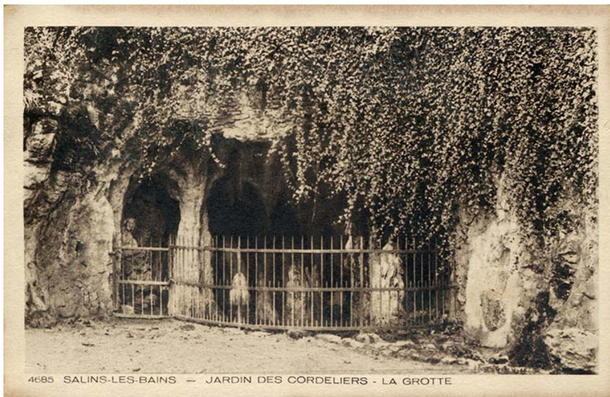
Salins-les-Bains - Jardin des Cordeliers - La grotte, s.d. [vers 1930].