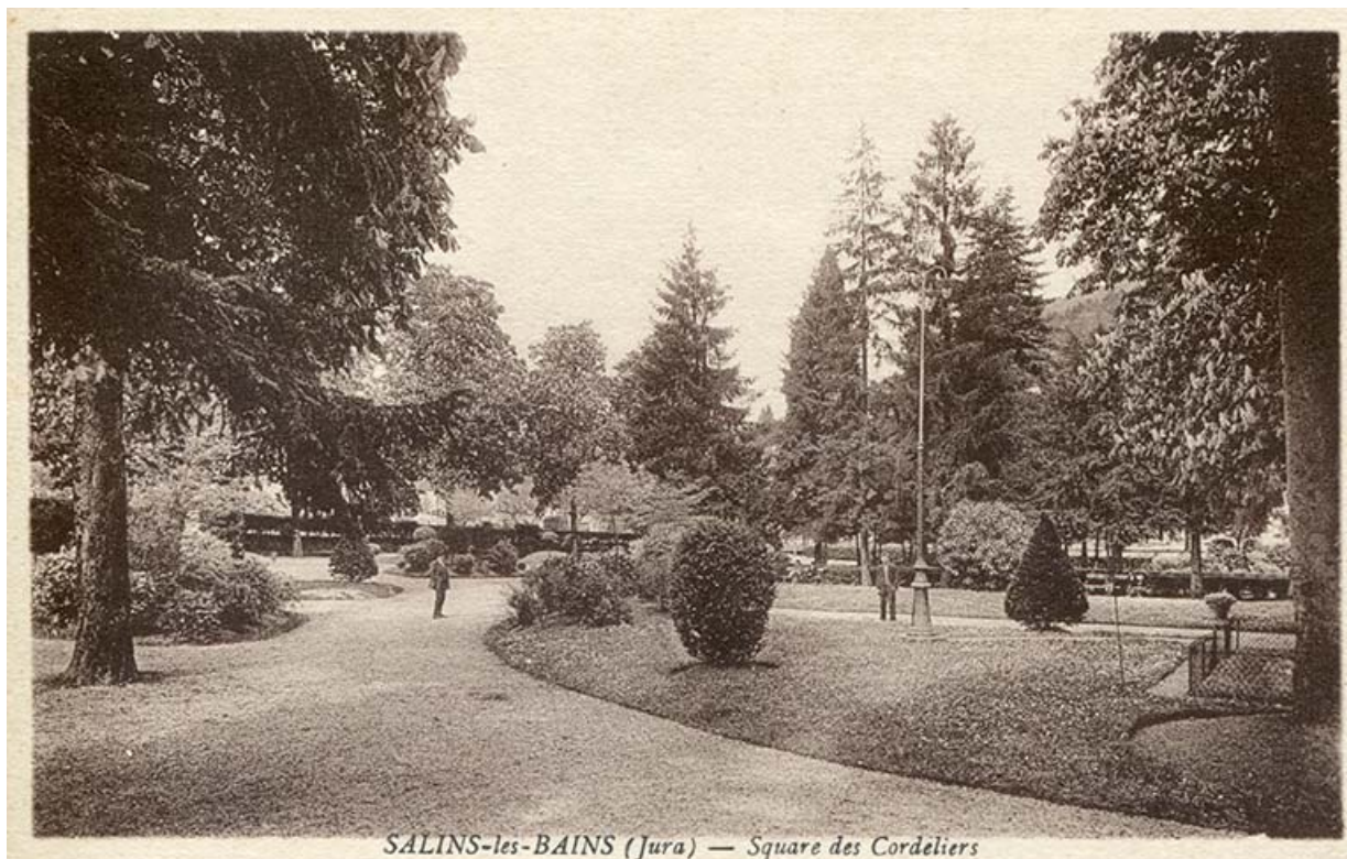
Salins-les-Bains (Jura). Square des Cordeliers, s.d. [fin 19e ou début 20e siècle]. 39, Salins-les-Bains rue Béchet