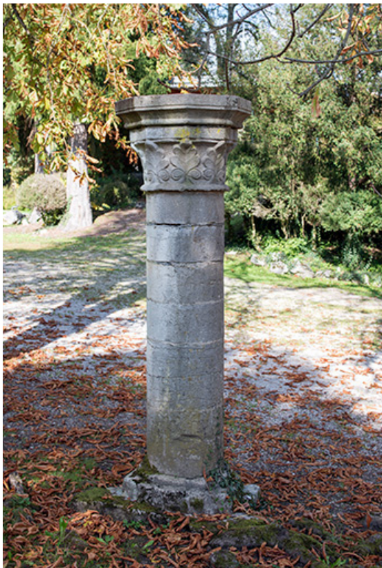
Colonne et chapiteau sculpté, au sud du kiosque.