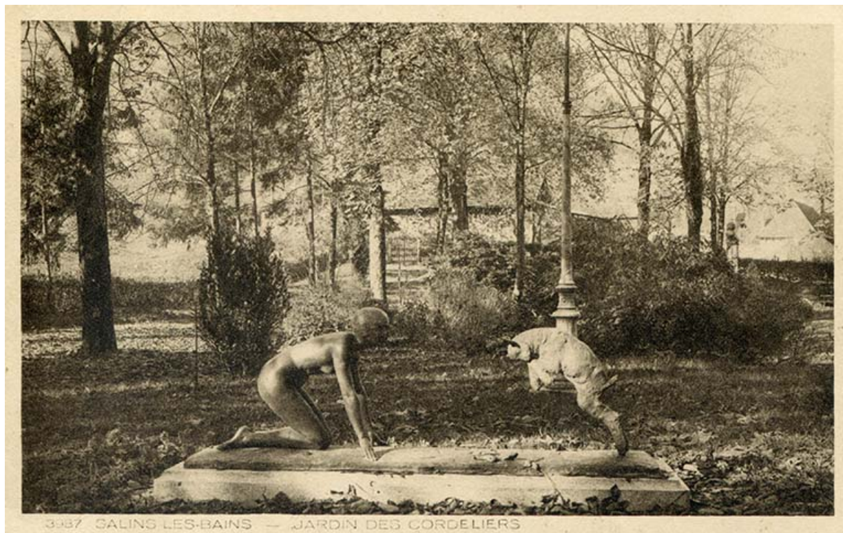
Salins-les-Bains - Jardin des Cordeliers, s.d. [vers 1930].