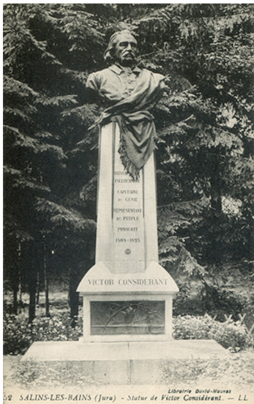
Salins-les-Bains (Jura). Statue de Victor Considerant, s.d. [fin 19e ou début 20e siècle]. 39, Salins-les-Bains rue Béchet