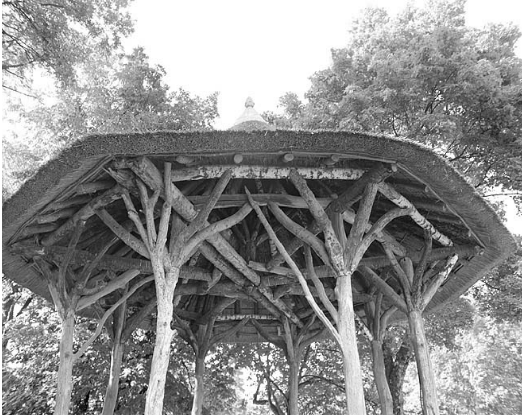
Kiosque : détail.

39, Lons-le-Saunier avenue Camille Prost