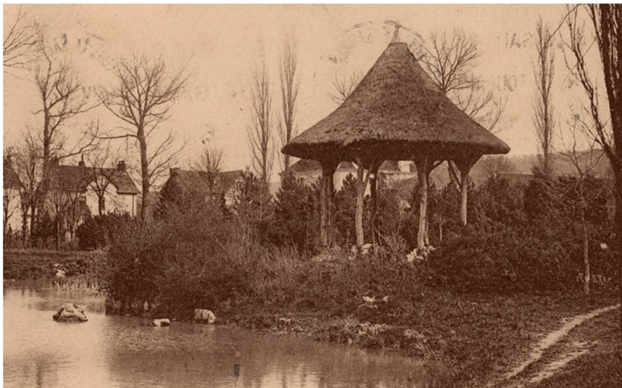
Vue du kiosque dans la première moitié du 20e siècle.

39, Lons-le-Saunier avenue Camille Prost