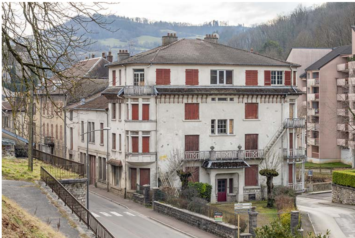
Façade principale, angle de la rue Gambetta (à gauche) et de la rue des Barres (à droite).