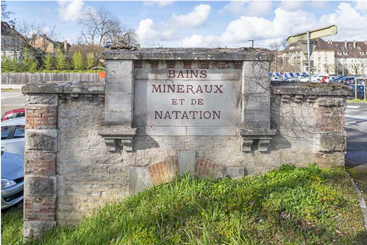
Ancienne entrée : "BAINS MINERAUX ET DE NATATION".

39, Lons-le-Saunier, 2 rue du Puits salé