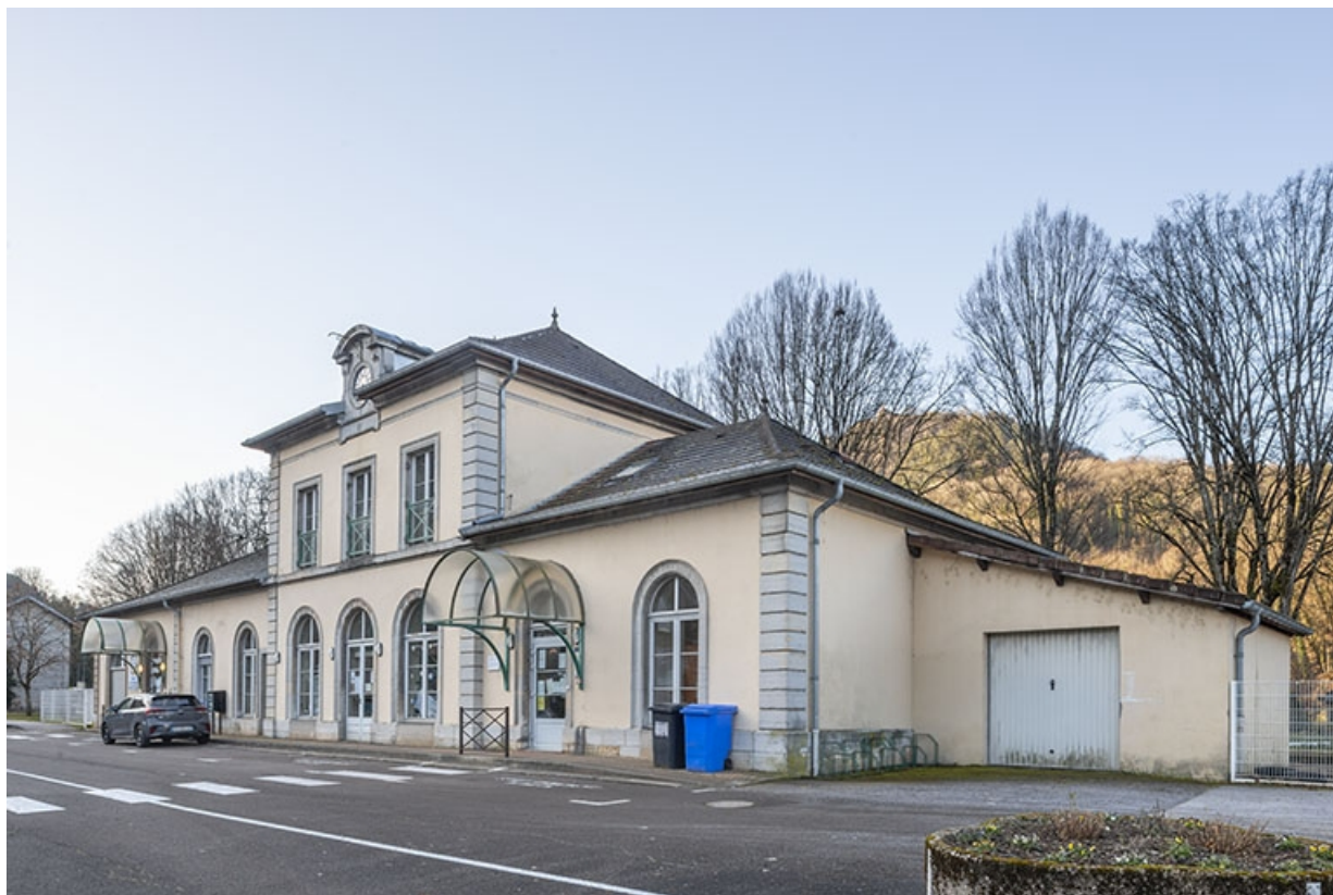
Vue actuelle, depuis le nord.

39, Salins-les-Bains, 1-3 rue du Docteur Éric Hurter