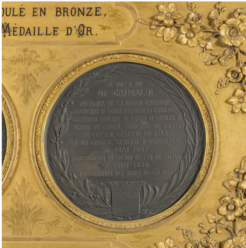
Médaille en l'honneur de Jean-Marie de Grimaldi, revers : "6 juin 1858, inauguration des bains de Salins" (Salins-les-Bains, musée municipal).