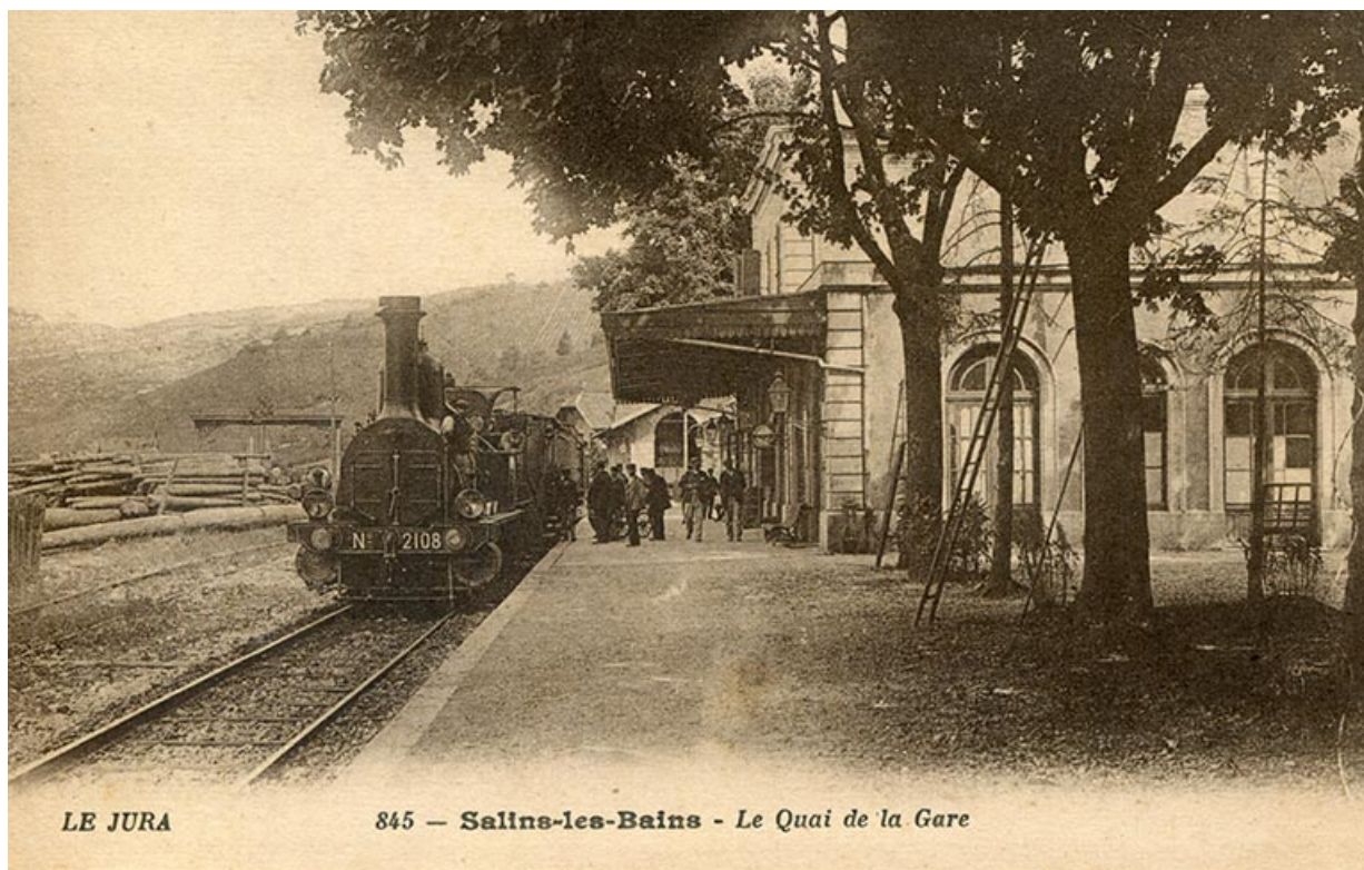
Le Jura - 845. Salins-les-Bains - Le Quai de la gare, s.d. [fin 19e ou début 20e siècle].

39, Salins-les-Bains, 1-3 rue du Docteur Éric Hurter