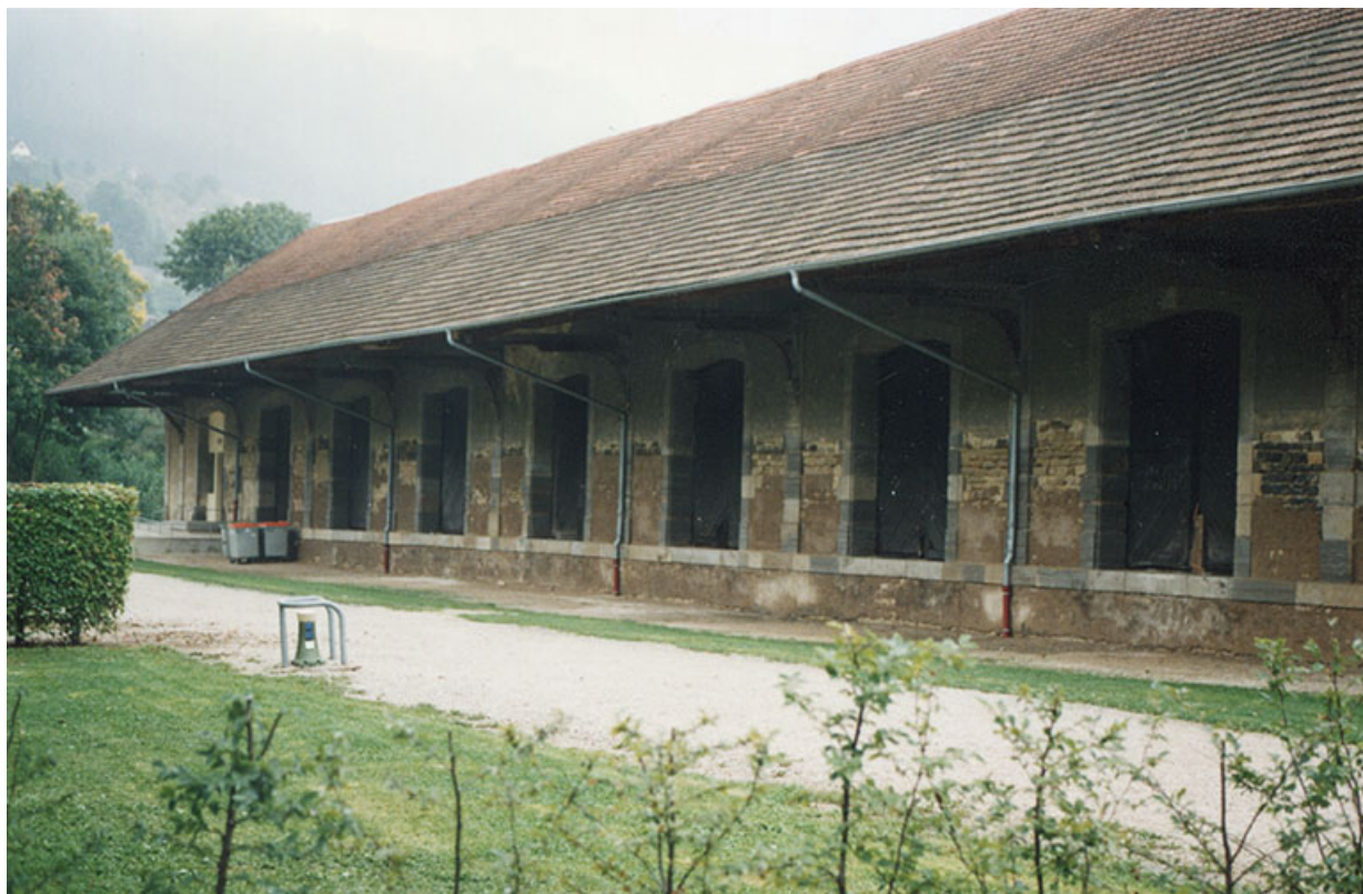
Entrepôt, s.d. [vers 1990].

39, Salins-les-Bains, 1-3 rue du Docteur Éric Hurter