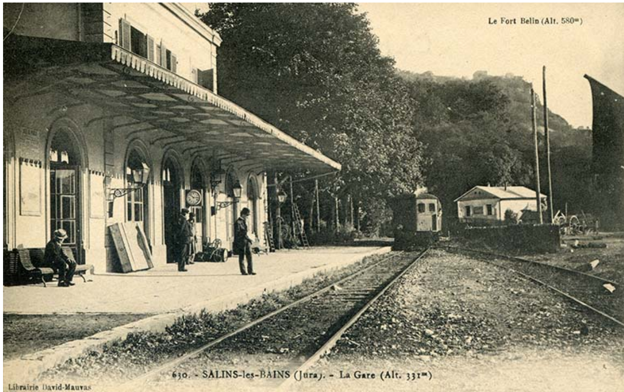
Salins-les-Bains (Jura) - La gare, s.d. [fin 19e ou début 20e siècle].

39, Salins-les-Bains, 1-3 rue du Docteur Éric Hurter