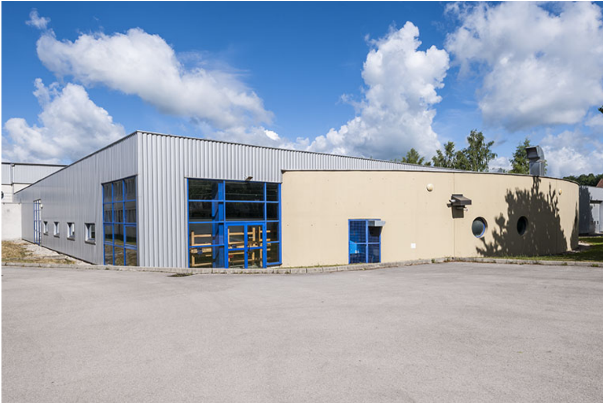
Ateliers, façade postérieure avec extension.

39, Moirans-en-Montagne, 6 route de Saint-Laurent