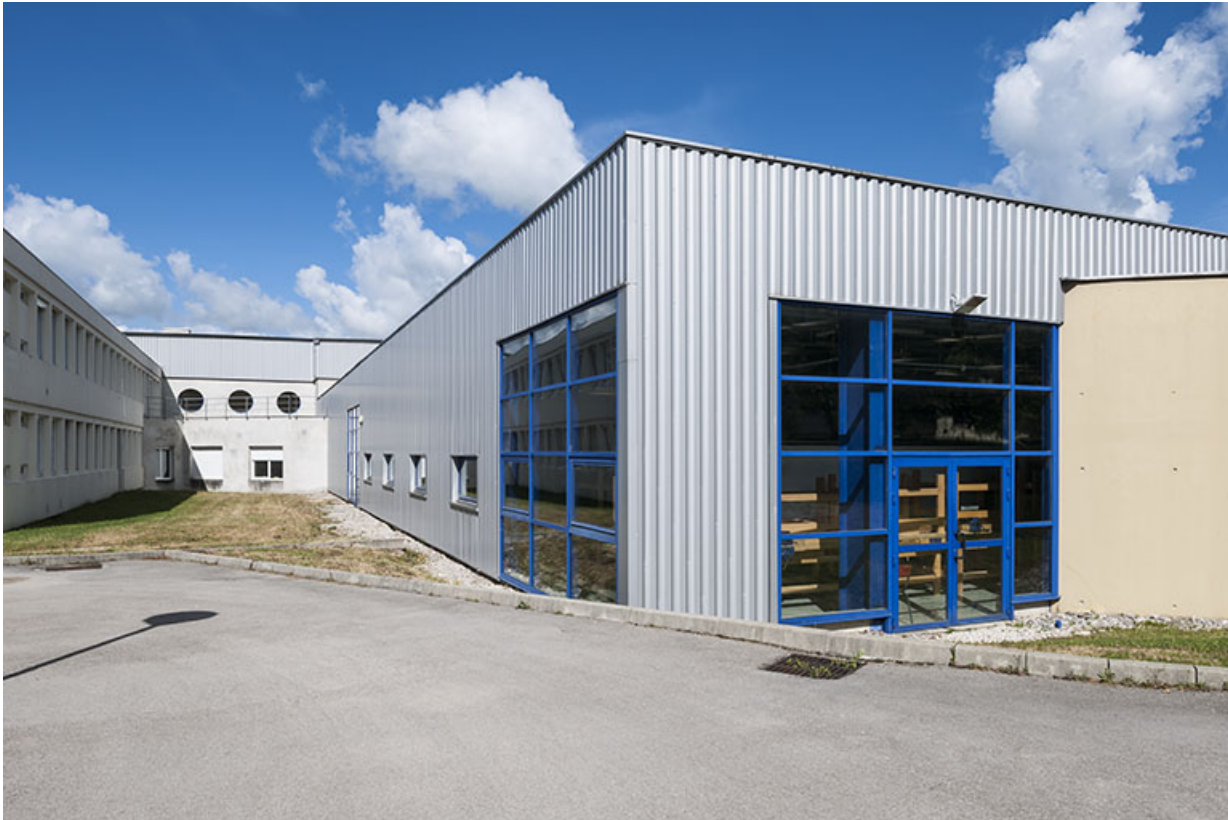
Ateliers, façade postérieure : détail.

39, Moirans-en-Montagne, 6 route de Saint-Laurent