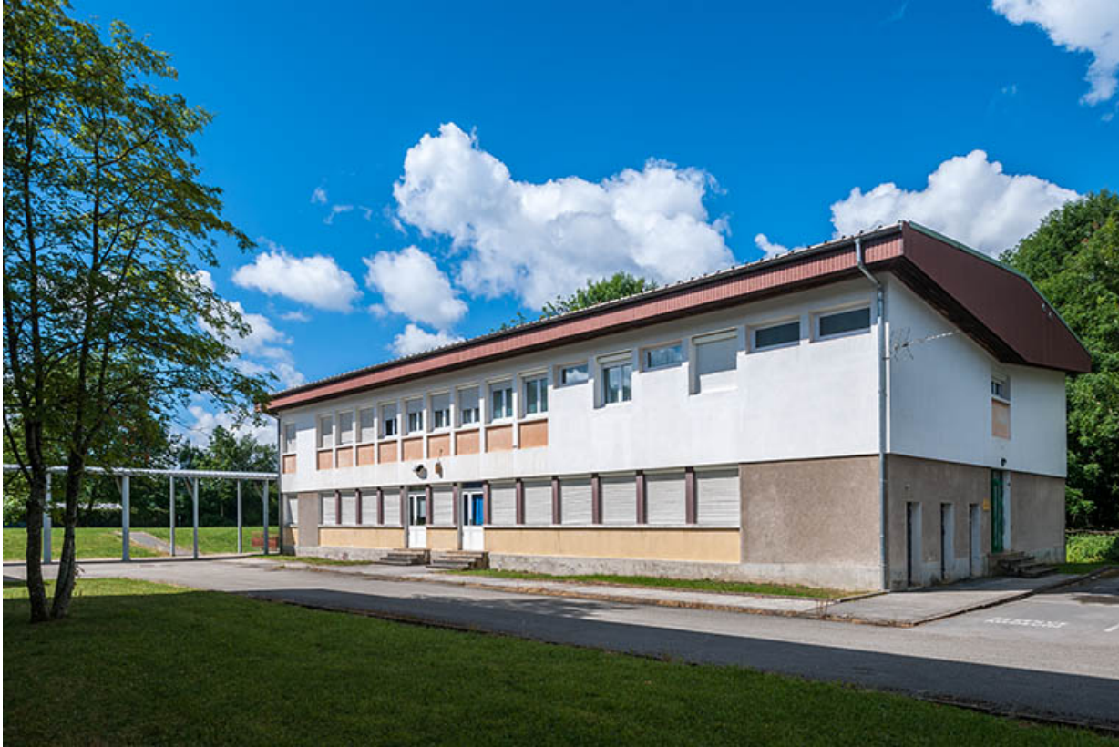
Externat : façade antérieure.

39, Moirans-en-Montagne, 6 route de Saint-Laurent