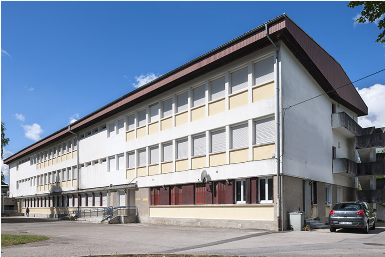
Internat : façade antérieure.

39, Moirans-en-Montagne, 6 route de Saint-Laurent