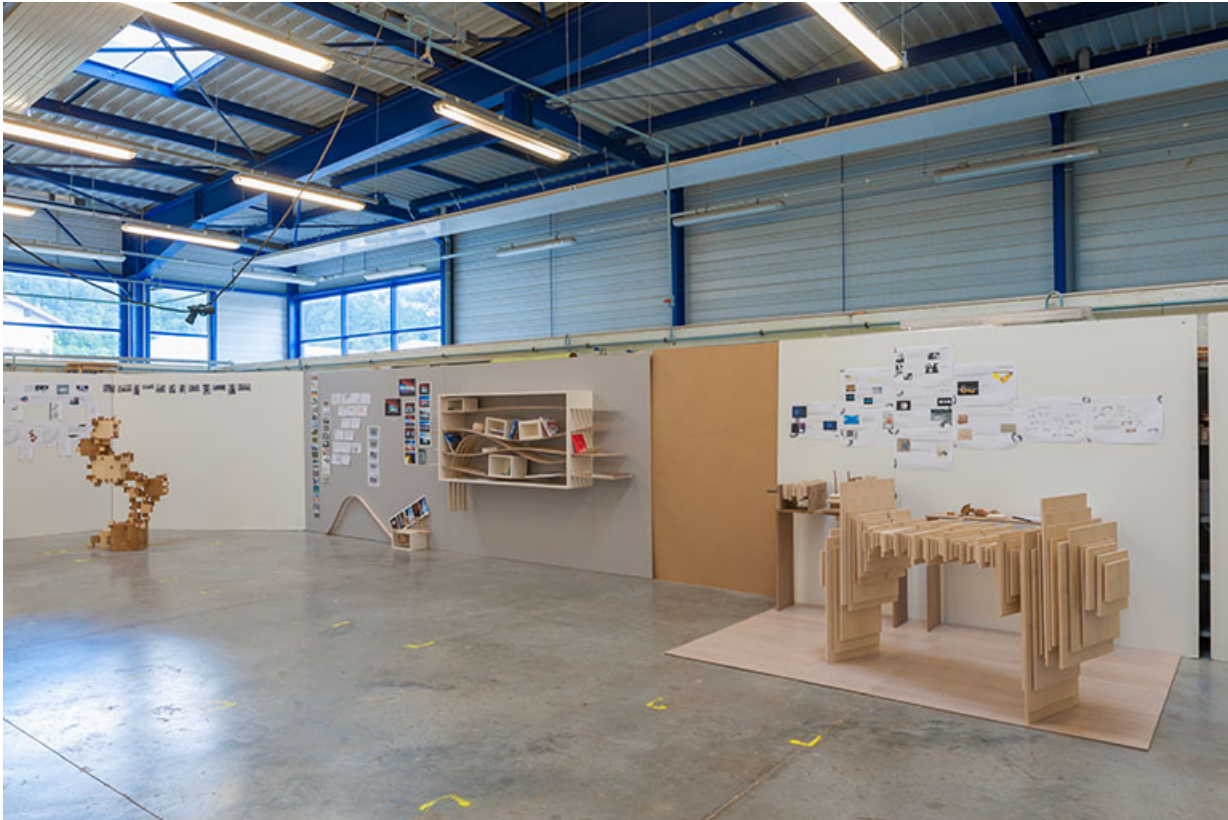
Ateliers : hall de présentation, travaux d'élèves de la formation aux métiers d'art.

39, Moirans-en-Montagne, 6 route de Saint-Laurent