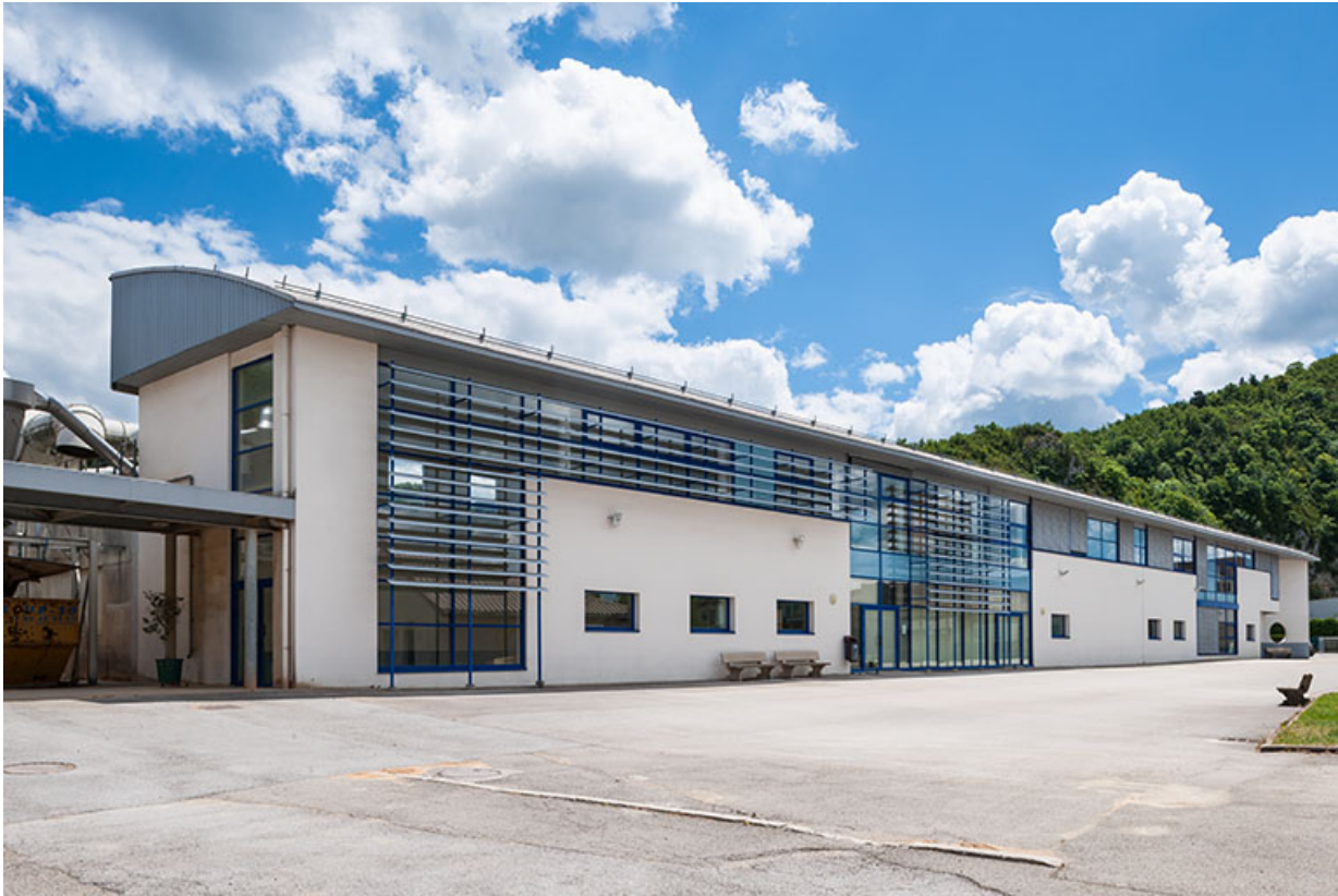
Ateliers, façade antérieure.

39, Moirans-en-Montagne, 6 route de Saint-Laurent