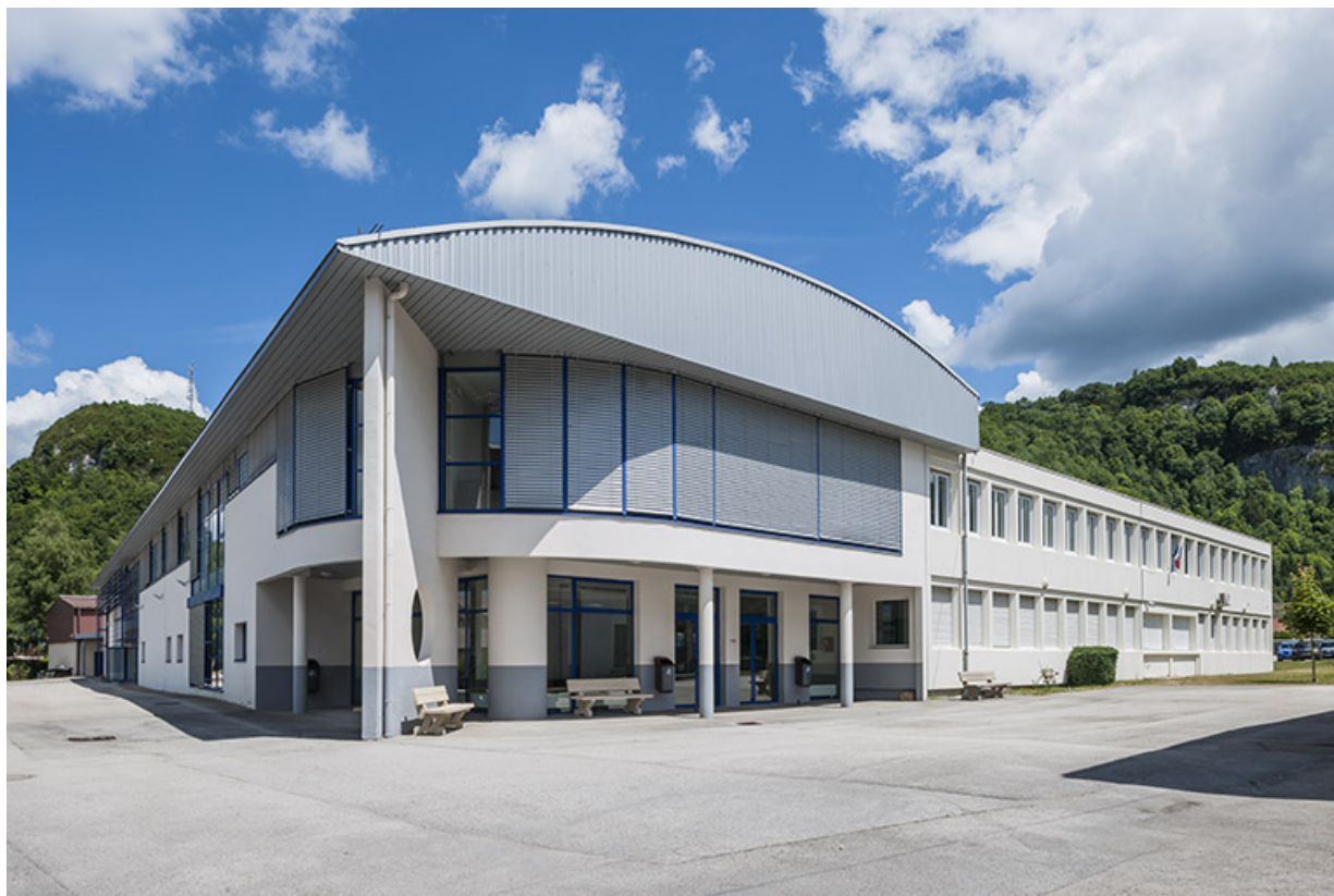
Ateliers, vue de trois quart de la façade antérieure et de la façade Sud.

39, Moirans-en-Montagne, 6 route de Saint-Laurent