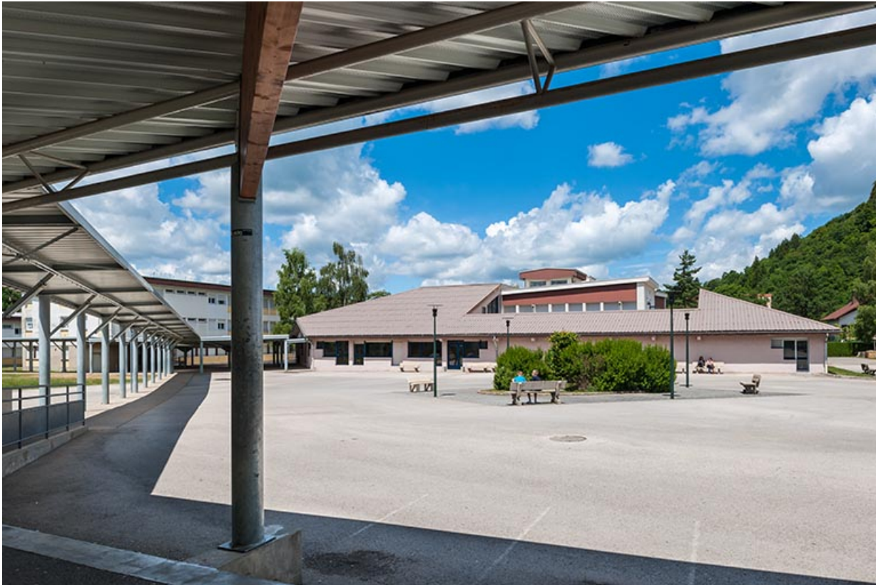
Restauration : vue d'ensemble, extension et bâtiment initial.

39, Moirans-en-Montagne, 6 route de Saint-Laurent