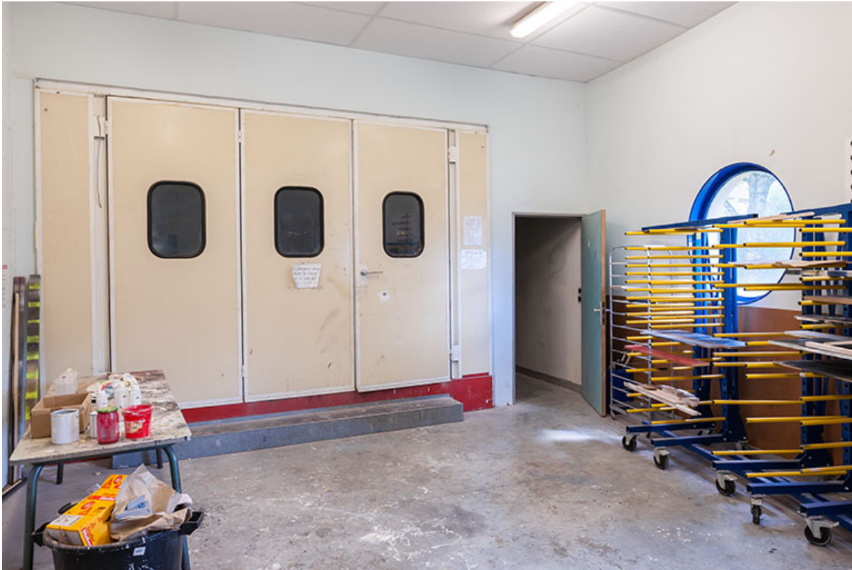
Ateliers : vue intérieure.

39, Moirans-en-Montagne, 6 route de Saint-Laurent