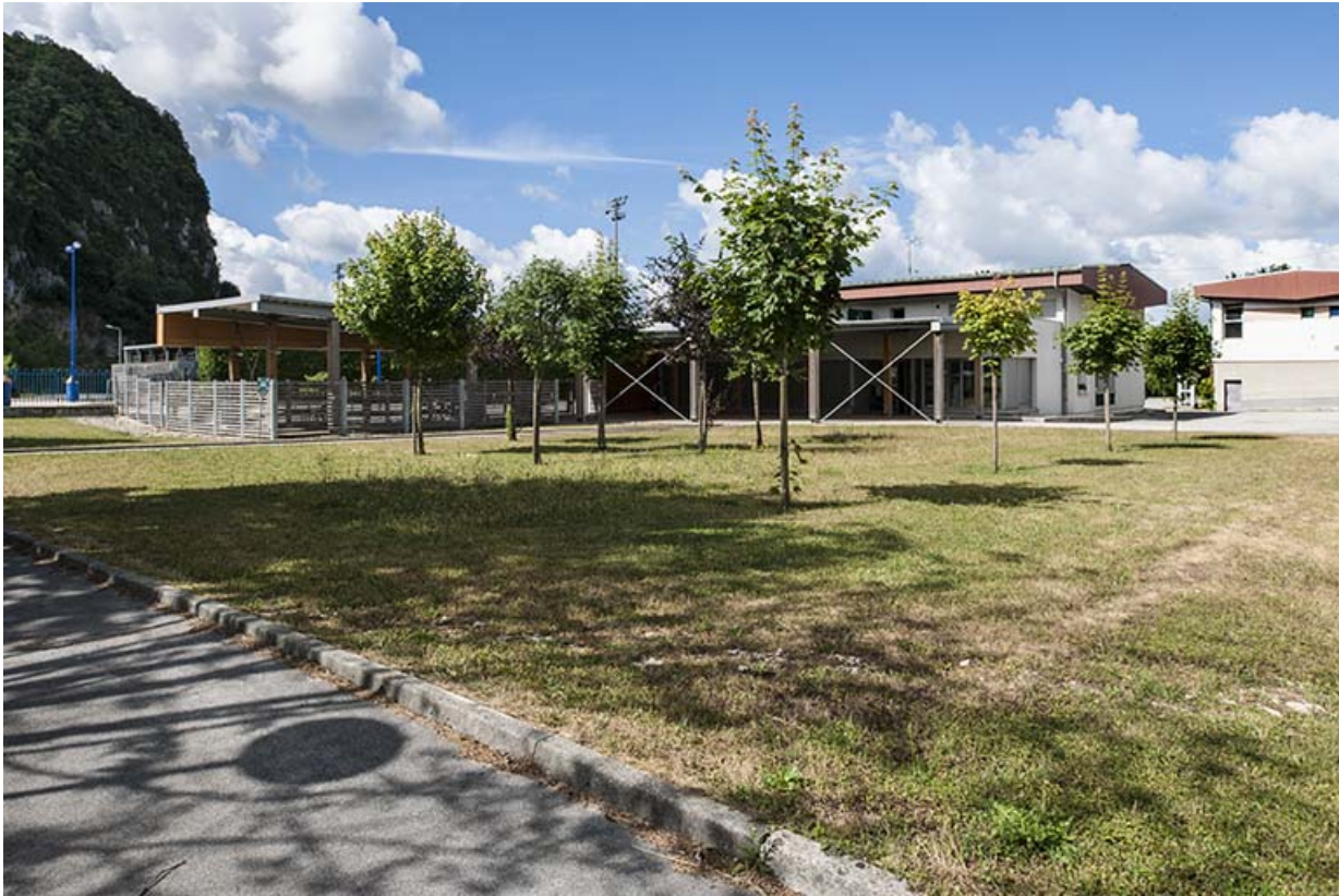
Entrée : préau avec abri pour cycles, vue postérieure.

39, Moirans-en-Montagne, 6 route de Saint-Laurent