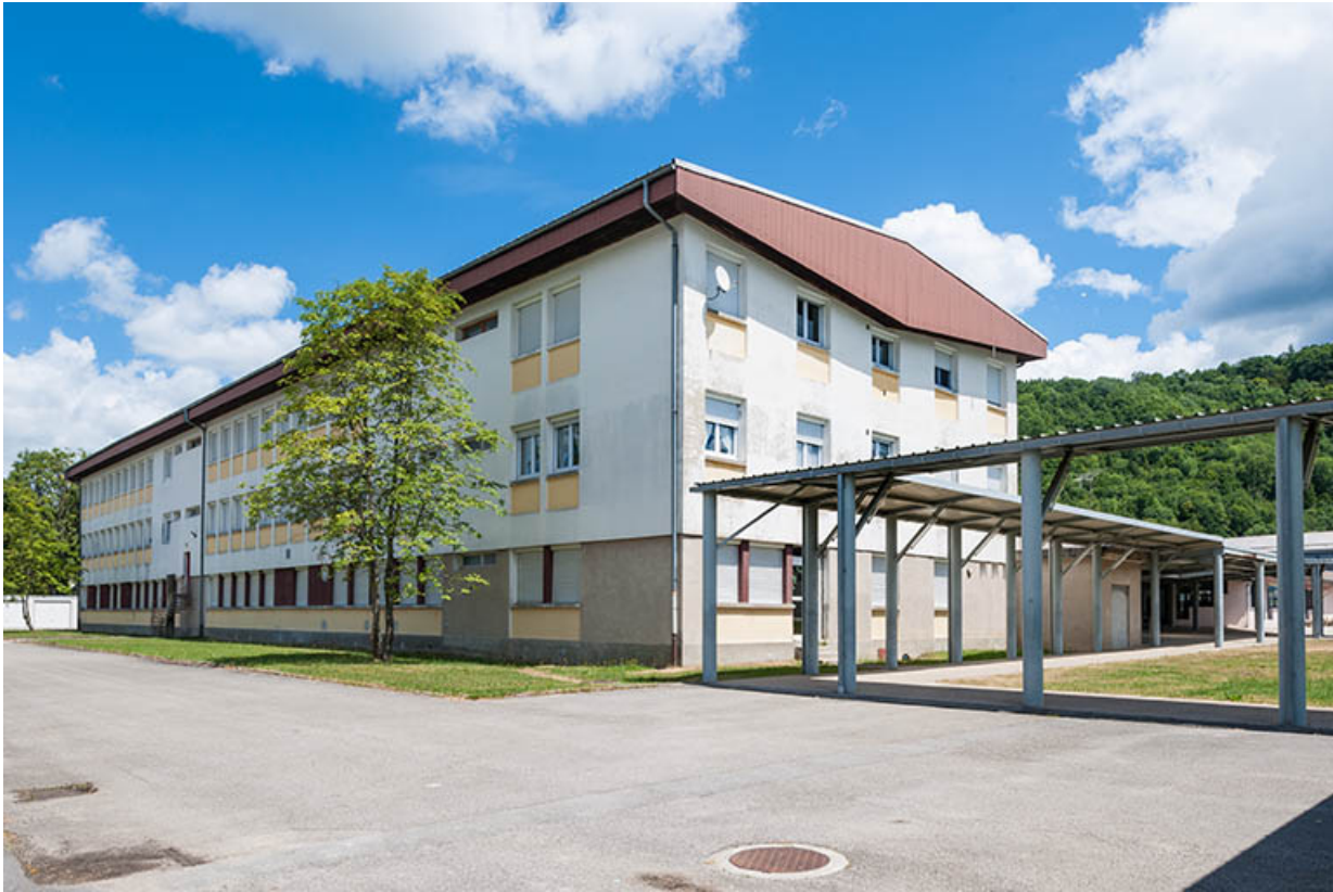
Internat : façade postérieure.

39, Moirans-en-Montagne, 6 route de Saint-Laurent