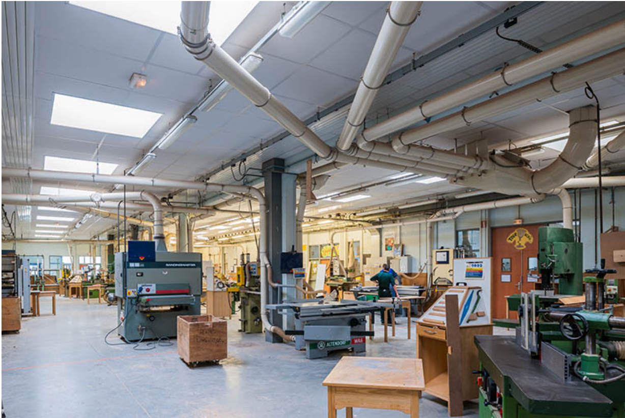
Ateliers : menuiserie, vue intérieure.

39, Moirans-en-Montagne, 6 route de Saint-Laurent