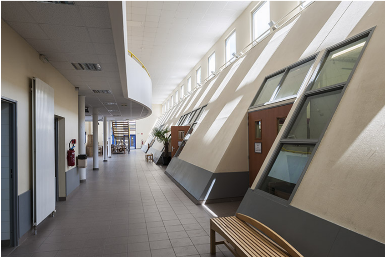
Ateliers : rez-de-chaussée, vue de puis la mezzanine.

39, Moirans-en-Montagne, 6 route de Saint-Laurent