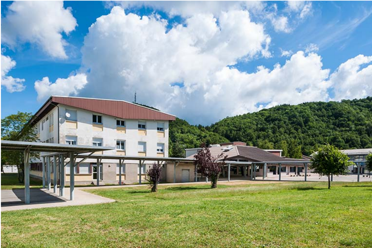
Internat à gauche (pignon sud) et bâtiment restauration à droite.

39, Moirans-en-Montagne, 6 route de Saint-Laurent