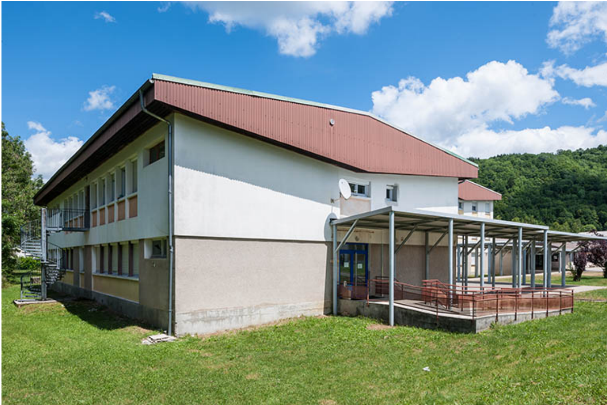
Externat : pignon sud.

39, Moirans-en-Montagne, 6 route de Saint-Laurent