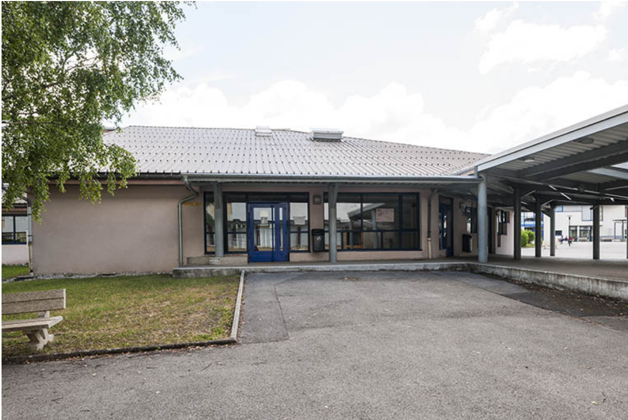
Restauration, façade Ouest, entrée.

39, Moirans-en-Montagne, 6 route de Saint-Laurent