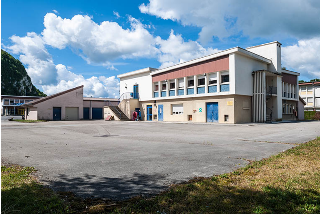
Restauration, bâtiment initial, vue de trois quart arrière.

39, Moirans-en-Montagne, 6 route de Saint-Laurent