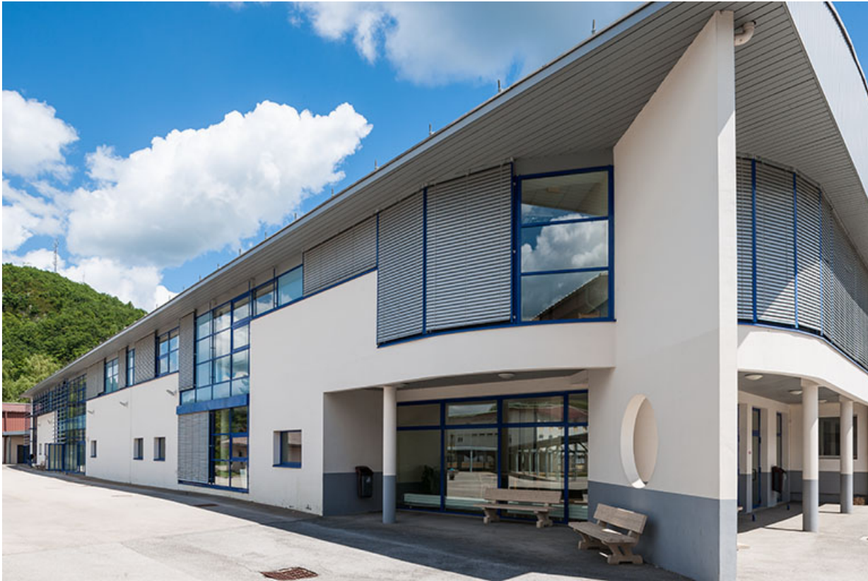
Ateliers : détail des façades et entrée.

39, Moirans-en-Montagne, 6 route de Saint-Laurent