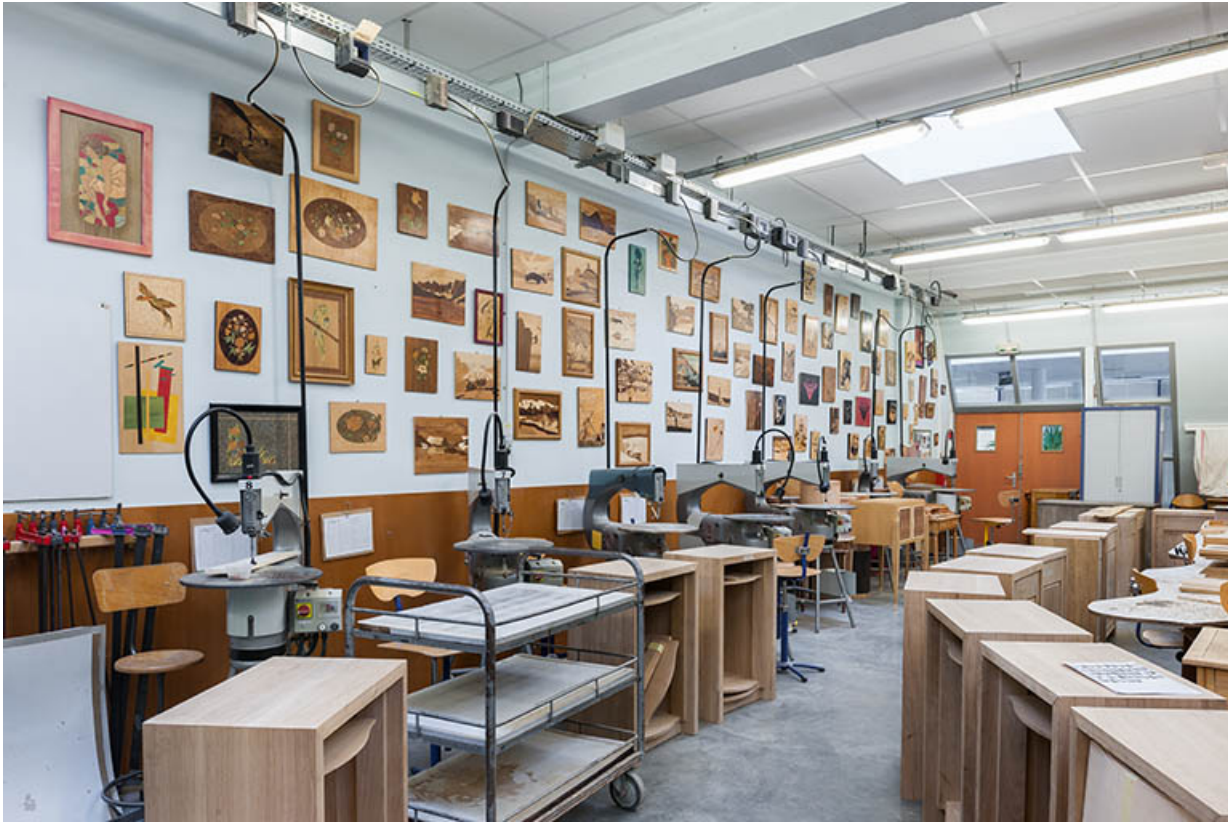
Moirans-en-Montagne, cité scolaire Pierre Vernotte : atelier de marqueterie.