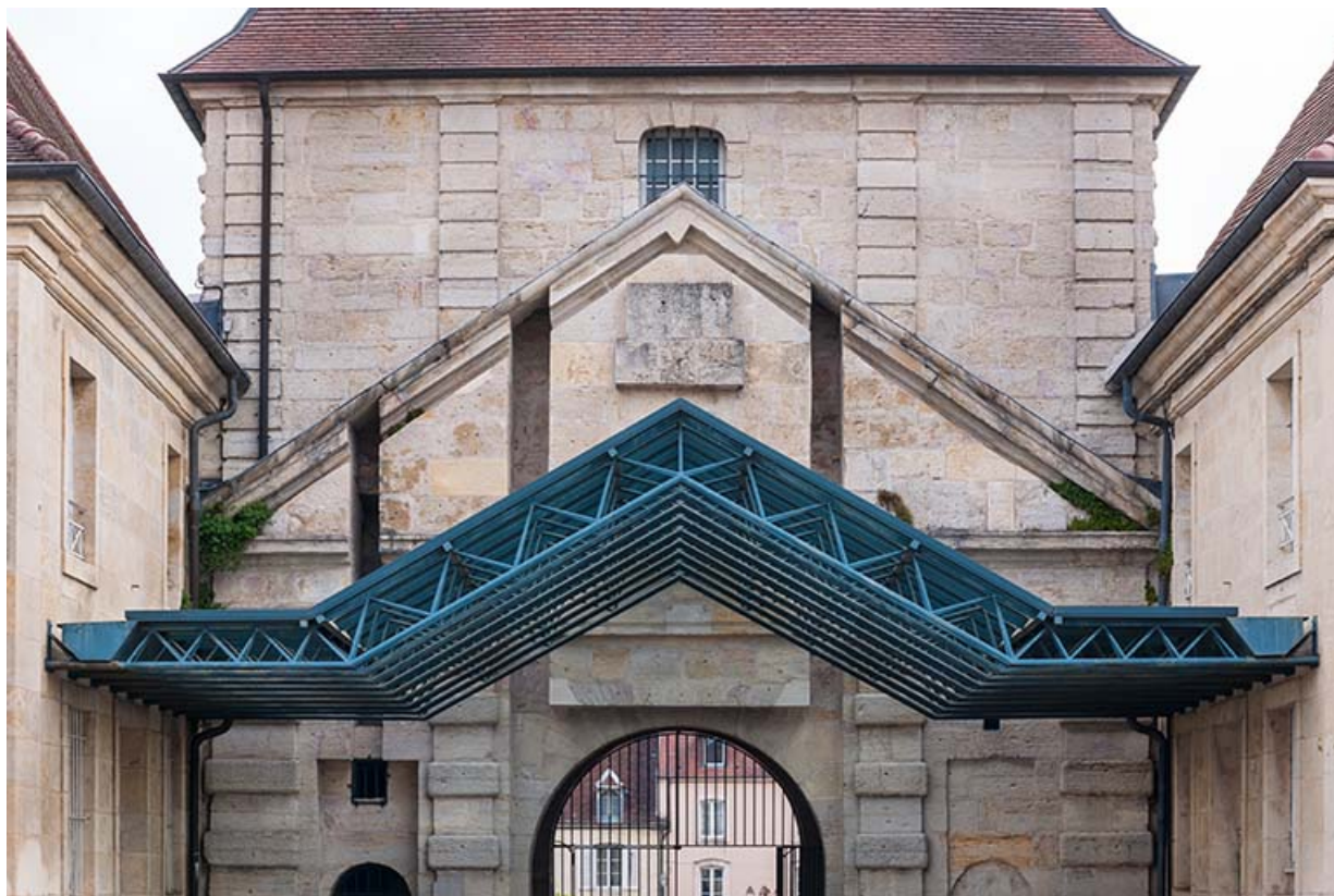
Porte d'arans, vue postérieure : détails.