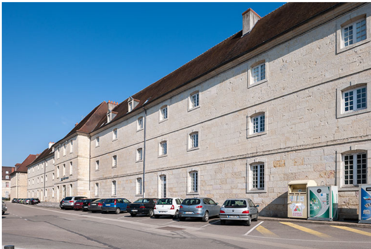
Externat : façade postérieure, place Barberousse.