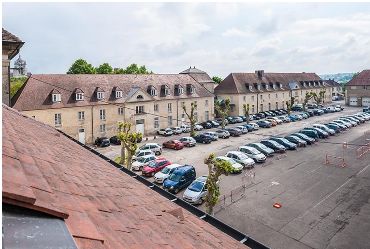
Vue générale, place Précipiano avec les bâtiments atelier-logement et restauration-exernat. 39, Dole, 31 place Barberousse