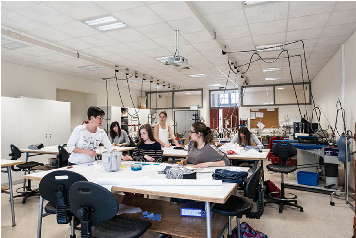
Atelier : cours de couture