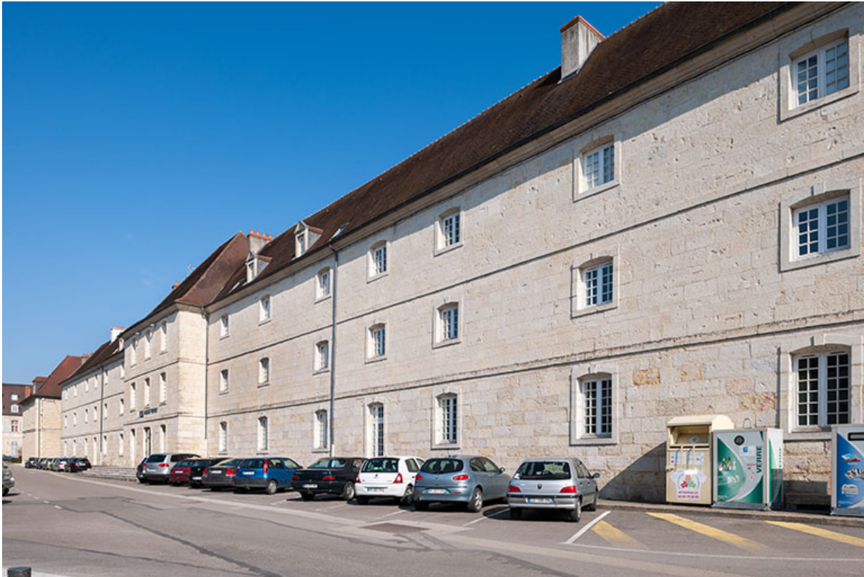
Externat : façade postérieure, place Barberousse.