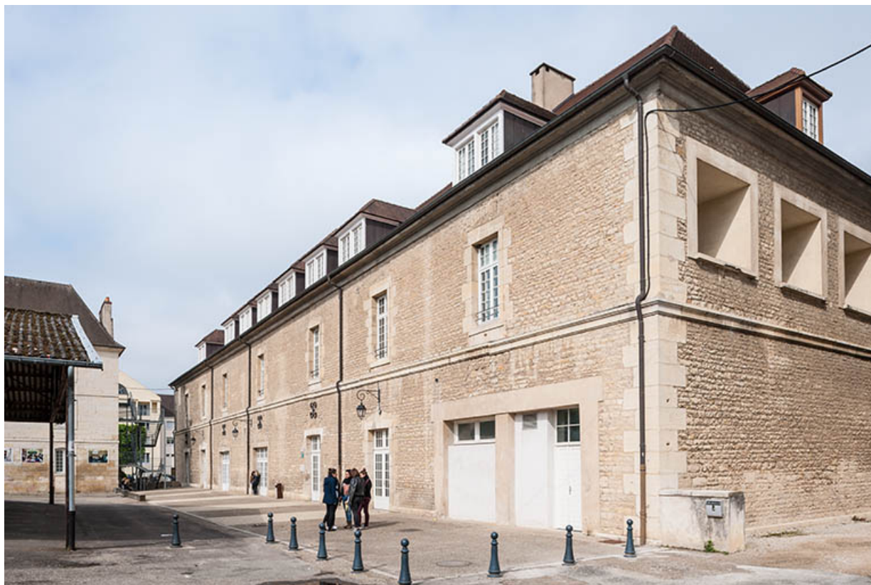
Atelier-externat : façade antérieure, vue 3/4. 39, Dole, 31 place Barberousse