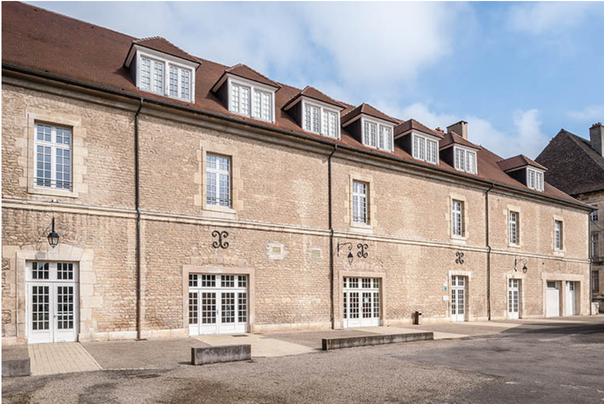
Atelier-extrnat : façade antérieure, place Précipiano.