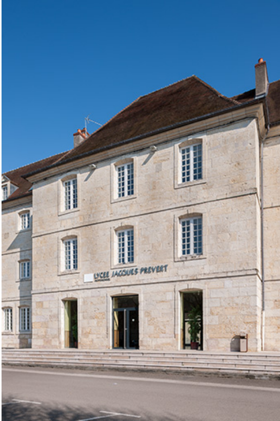
Avant-corps central de la façade postérieure de l'externat.