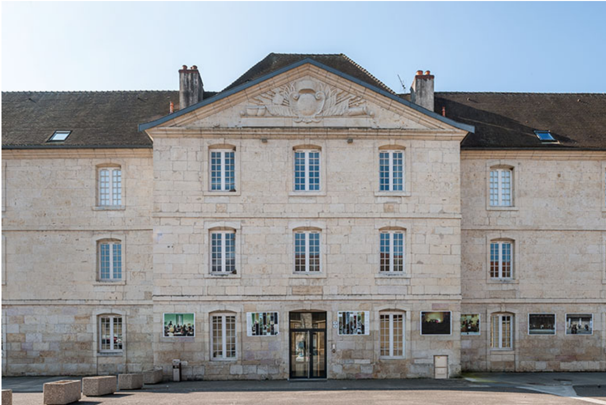
Externat-administration : avant -corps central de la façade antérieure, place Précipiano.