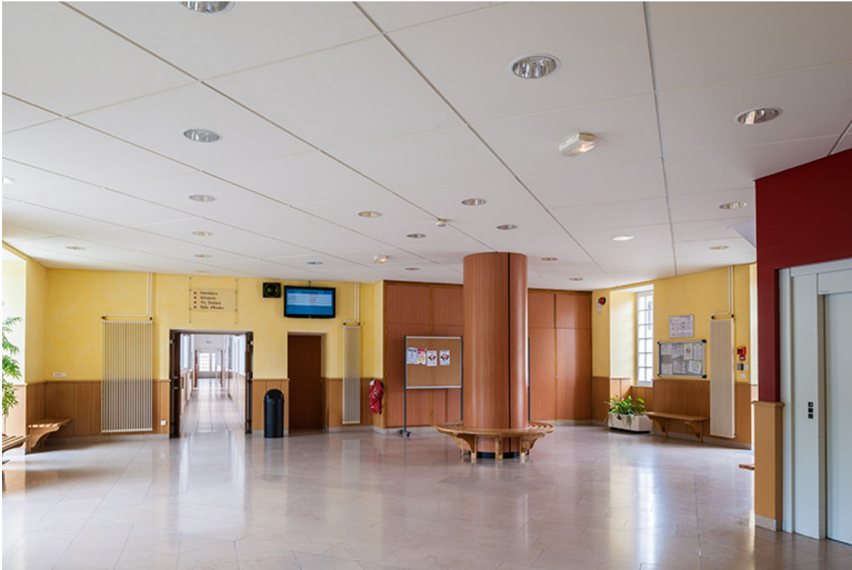
Externat : hall.