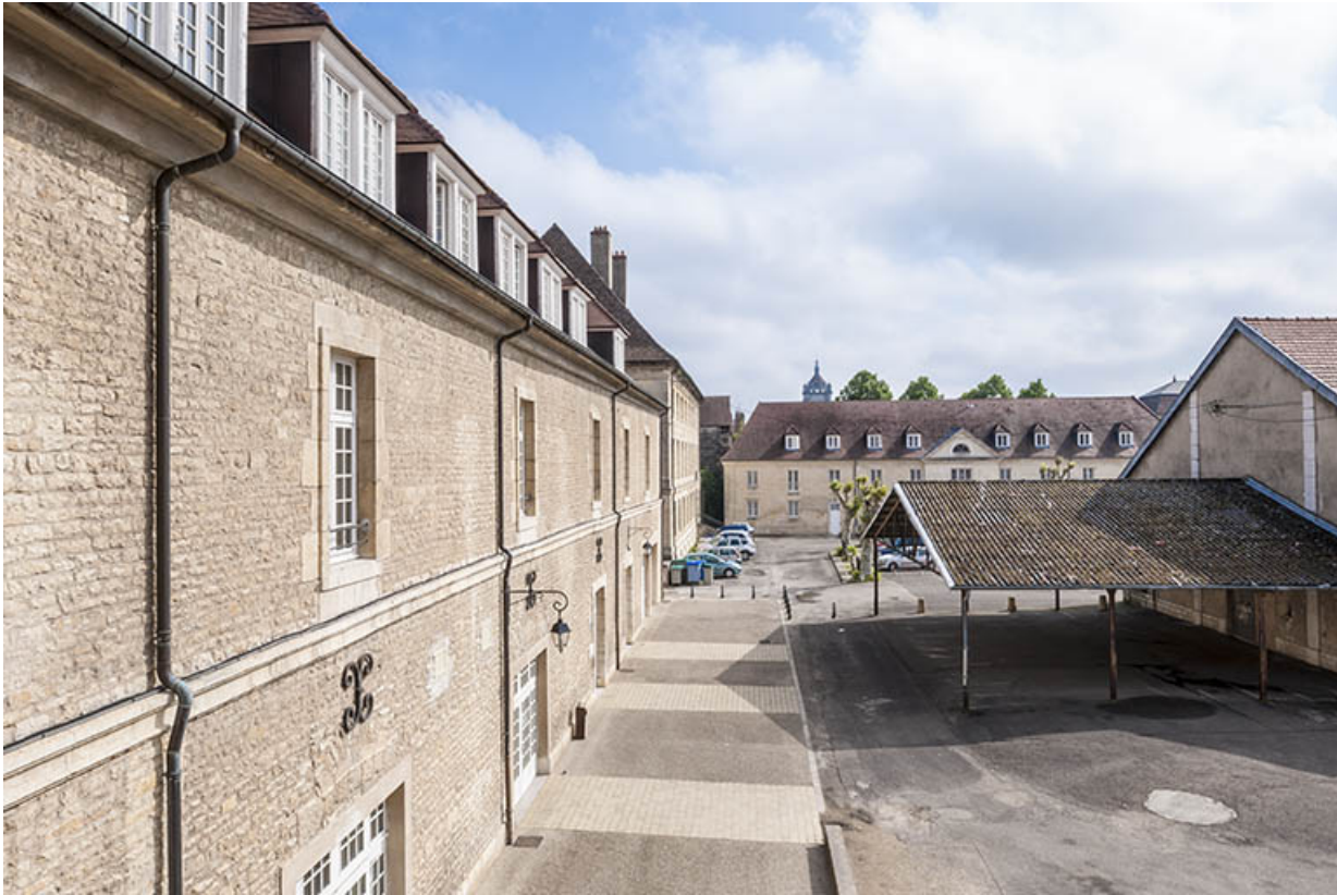
Plae Précipano, partie nord : au premier plan le bâtiment atelier-externat, en arrière plan le bâtiment atelier-logement. 39, Dole, 31 place Barberousse