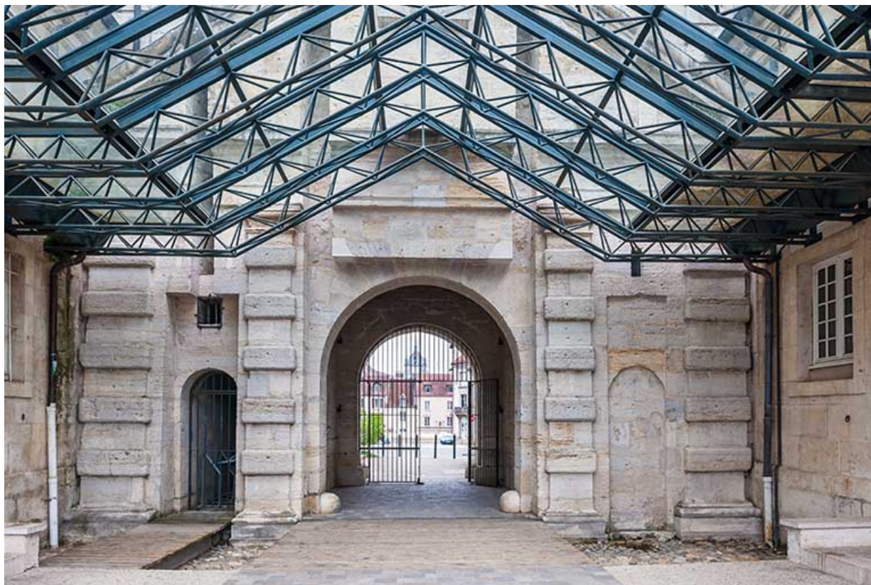
Porte d'Arens : vue postérieure avec aménagement du passage couvert.