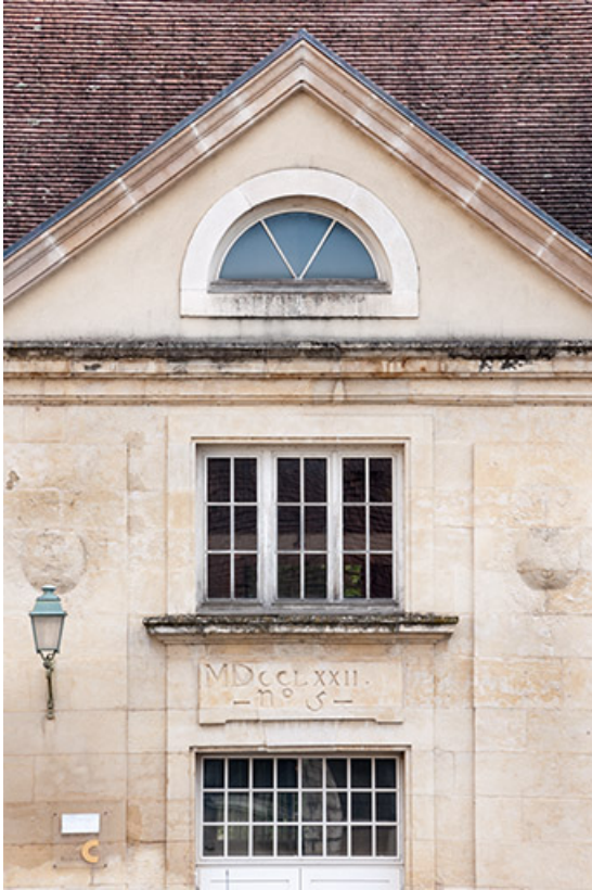
Avant-corps du bâtiment atelier -logement : détails