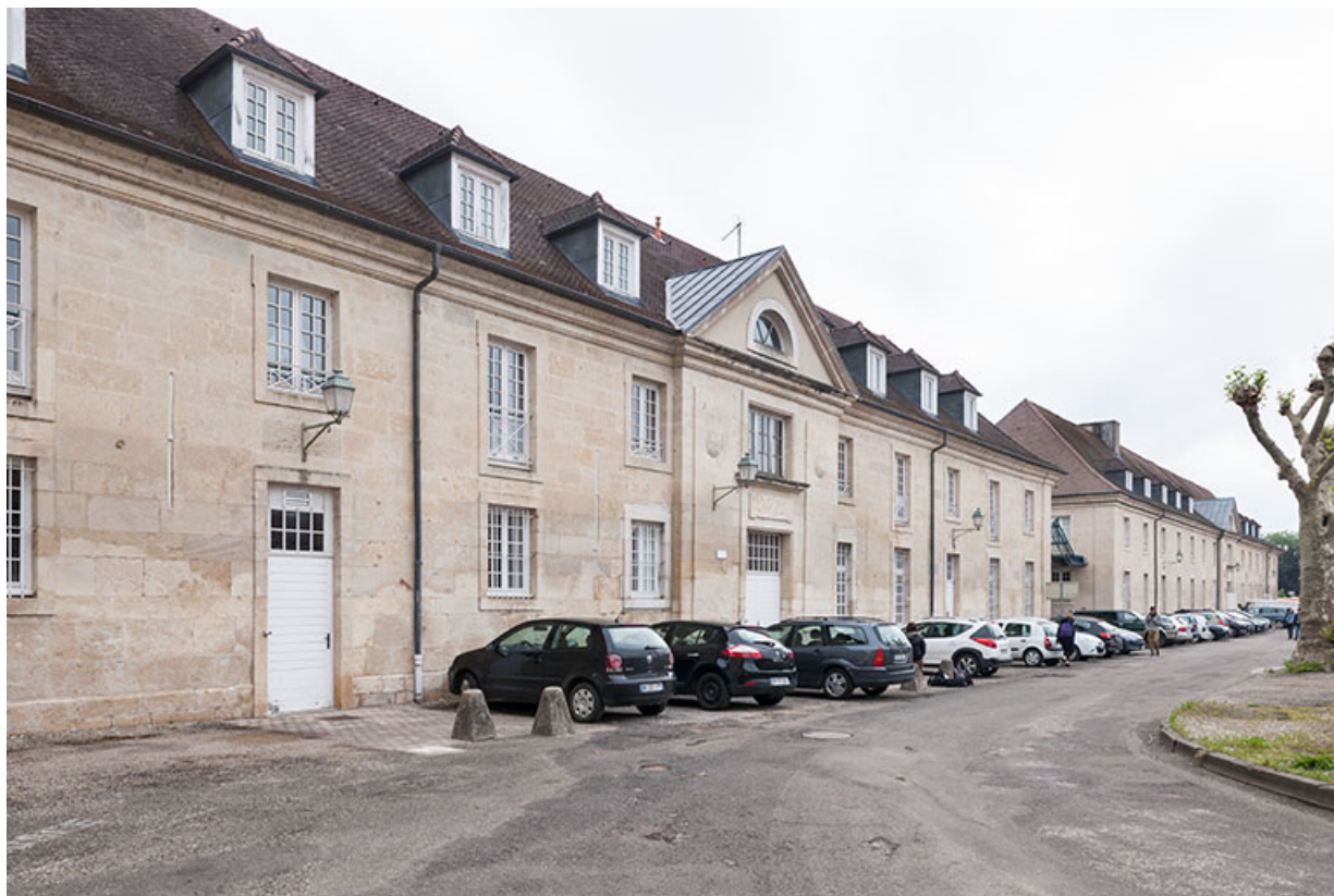
Bâtiment atelier-logement : façade postérieure, vue 3/4. 39, Dole, 31 place Barberousse