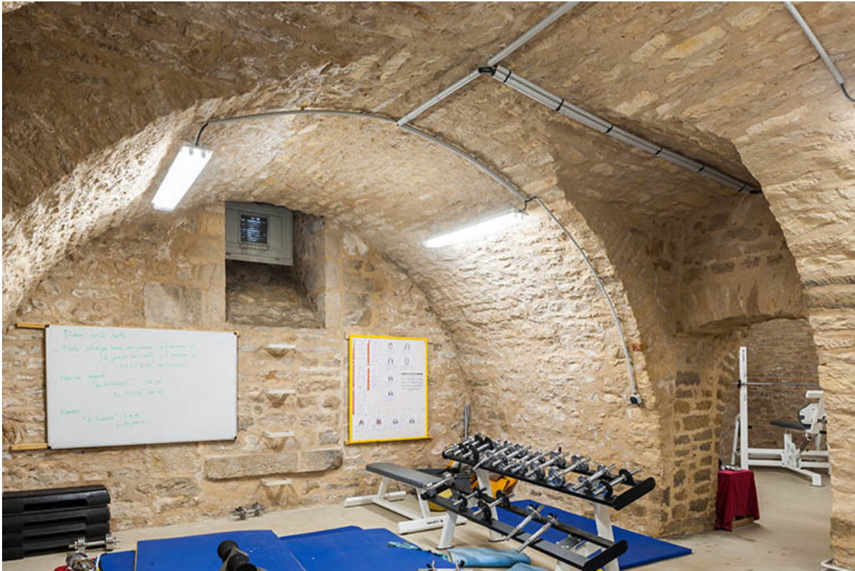
Externat : sous-sol voûté, salles de musculation.