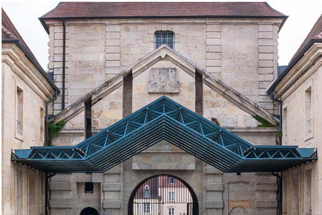
Porte d'arans, vue postérieure : détails.