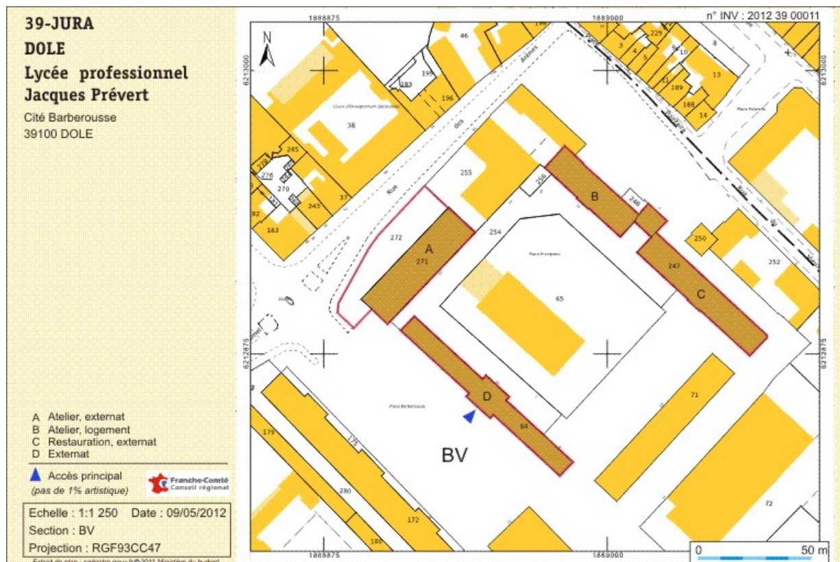
Plan-masse et de situation. Extrait du plan cadastral numérisé, section BV, échelle 1:1250.