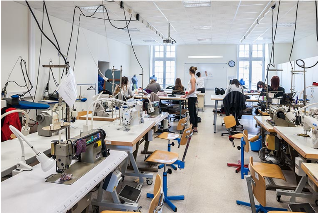
Atelier : salle de couture.