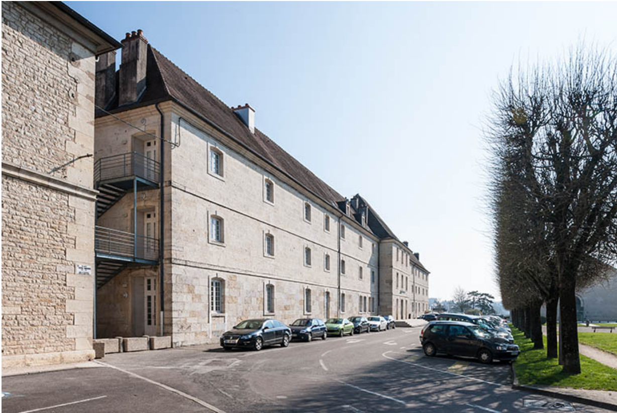
Externat : façade postérieure, place Barberousse, vue depuis la rue des Arènes. 39, Dole, 31 place Barberousse