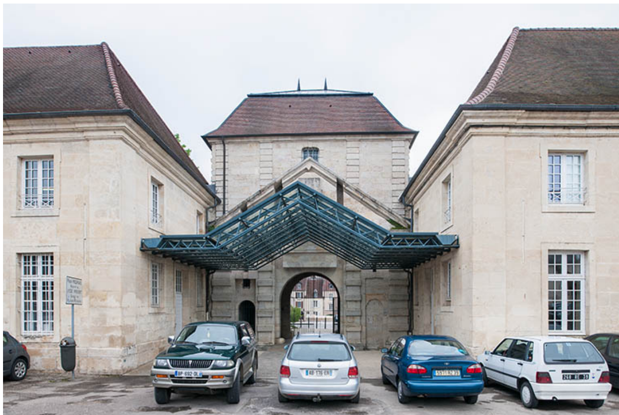
Porte d'Arans, vue postérieure : passage entre bâtiments atelier-logement et restauration-externat. 39, Dole, 31 place Barberousse