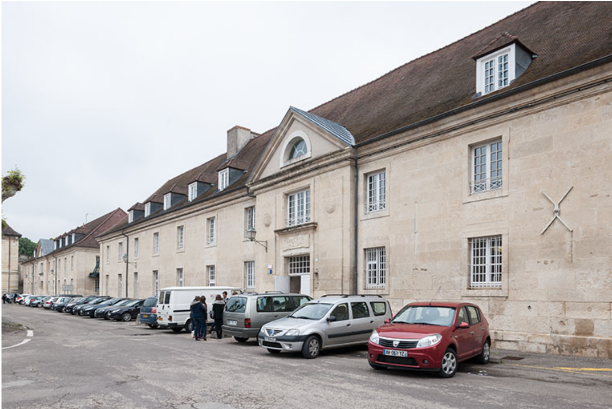
Bâtiment restauration-externat : façade postérieure.