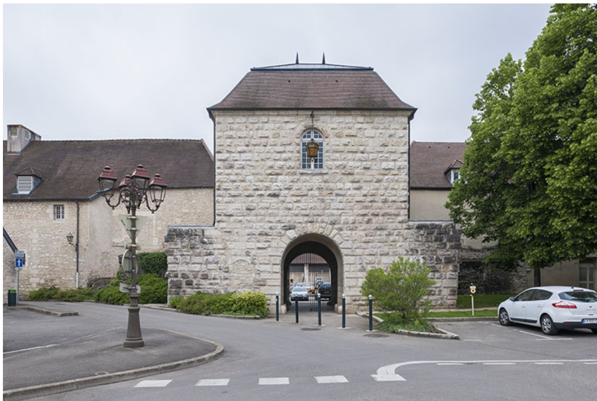
Porte d'Arans séparant les bâtiments atelier -logement et restauration-externat : vue antérieure. 39, Dole, 31 place Barberousse