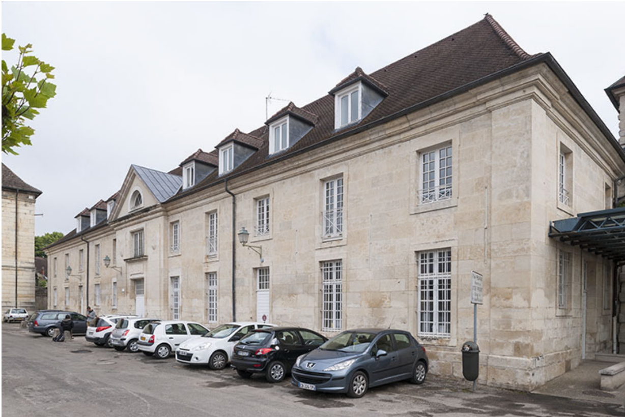
Bâtiment atelier-logement : vue 3/4 depuis le sud.