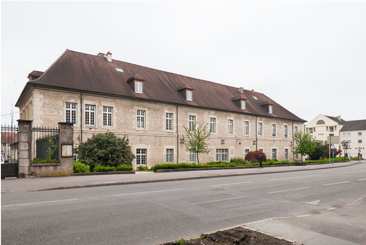
Atelier-externat : façade sur la rue des Arènes.