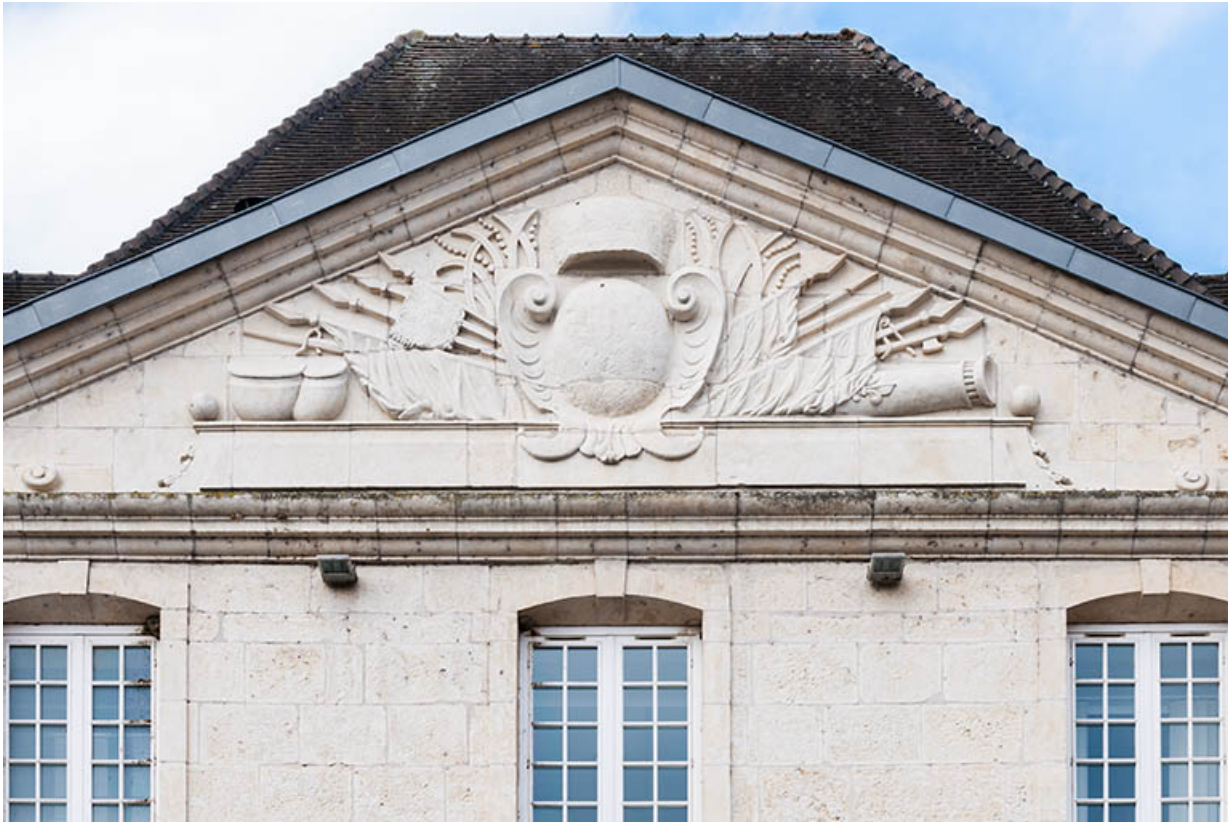
Fronton de l'avant-corps central de la façade antérieure de l'externat.