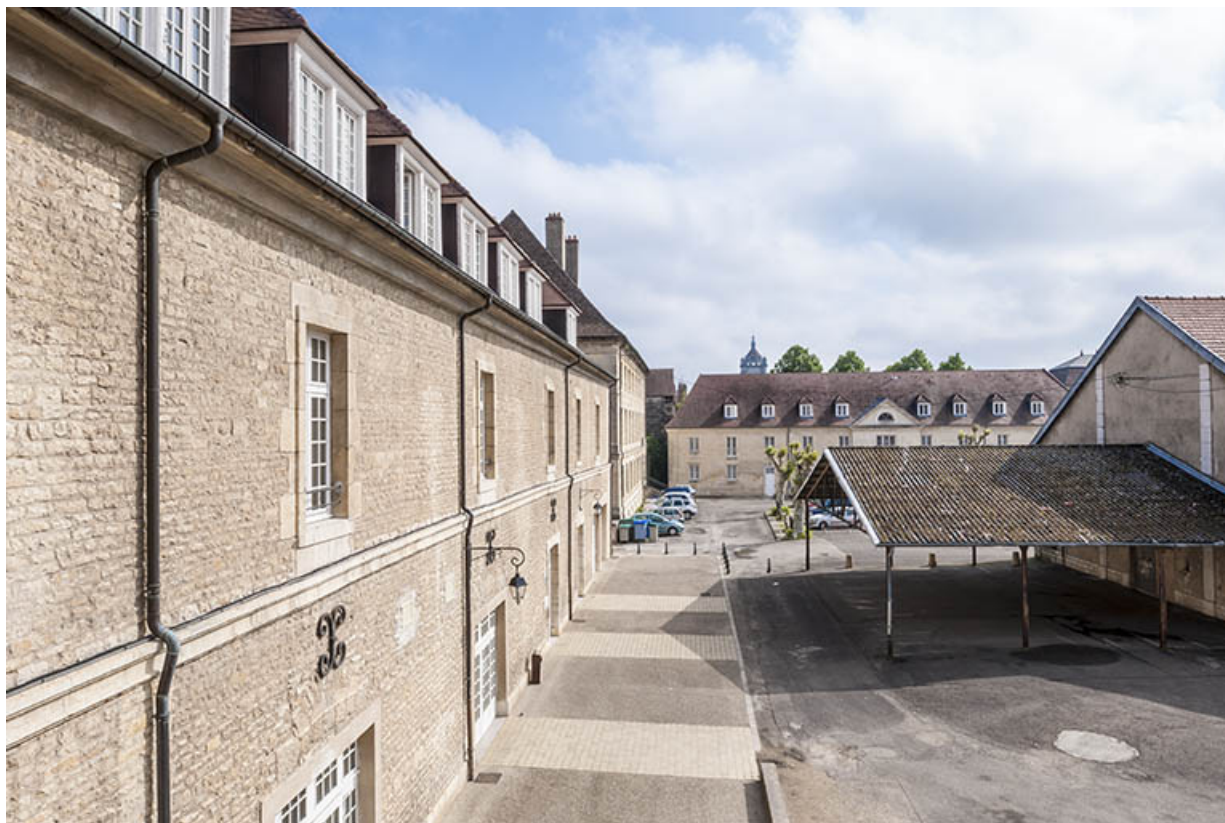
Plae Précipano, partie nord : au premier plan le bâtiment atelier-externat, en arrière plan le bâtiment atelier-logement. 39, Dole, 31 place Barberousse