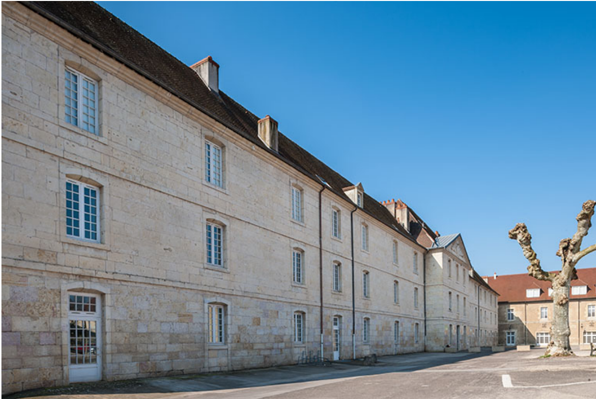
Externat : Vue 3/4 façade antérieure, place Précipiano.