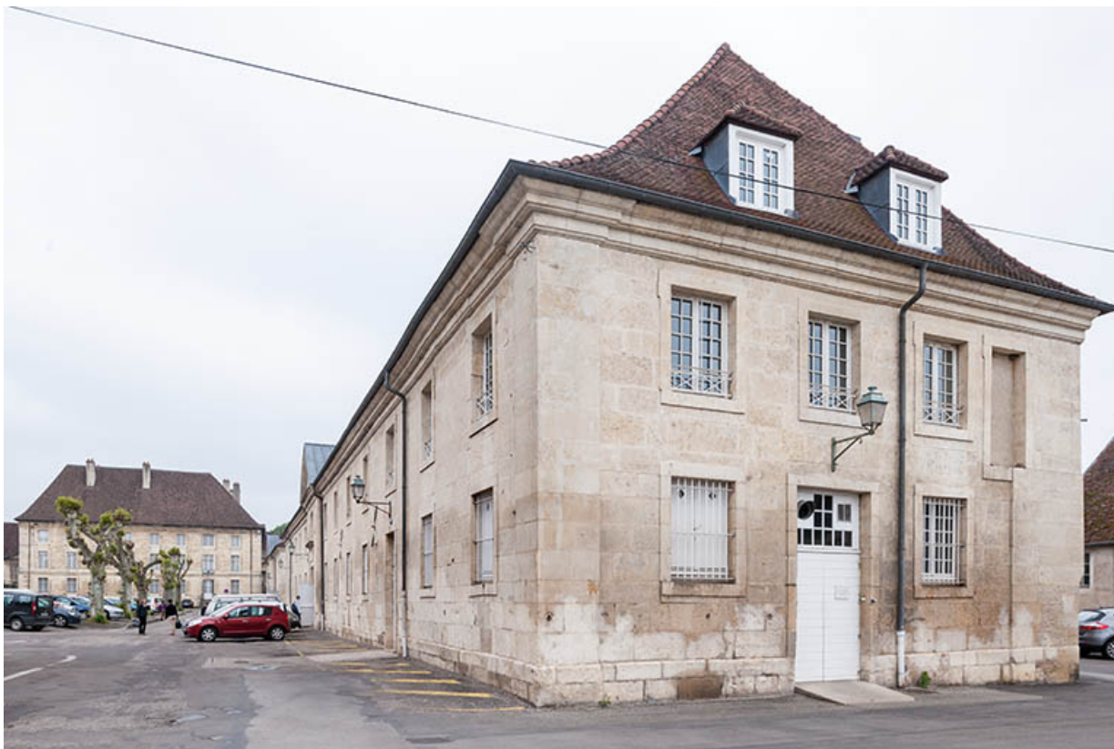
Bâtiment restauration-externat, pignon sud. 39, Dole, 31 place Barberousse