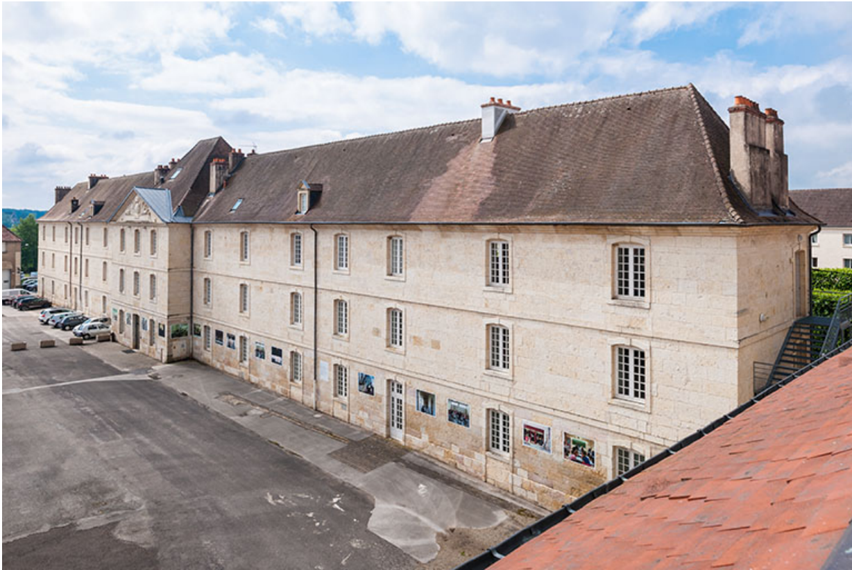
Externat : vue 3/4 depuis le nord de la façade antérieure.