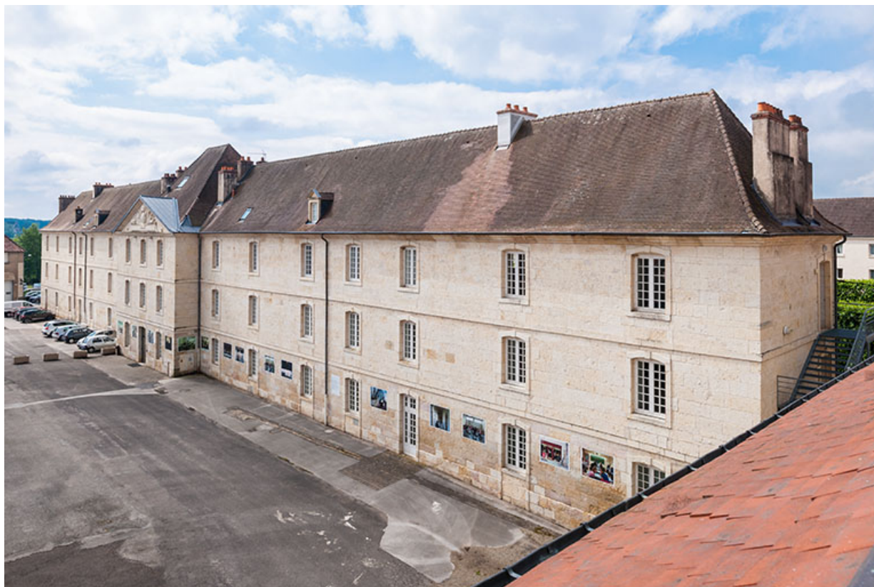
Externat : vue 3/4 depuis le nord de la façade antérieure.