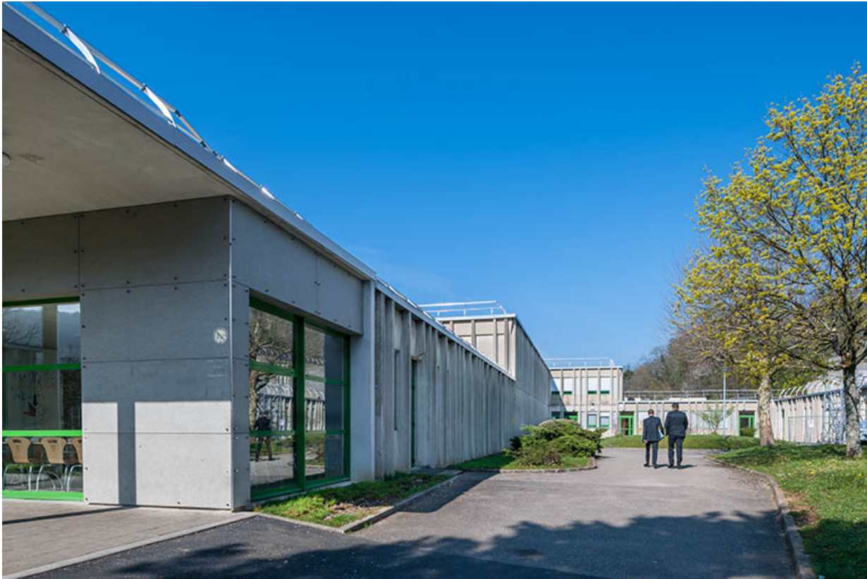
Bâtiments de la restauration, de l'internat et l'infirmierie.