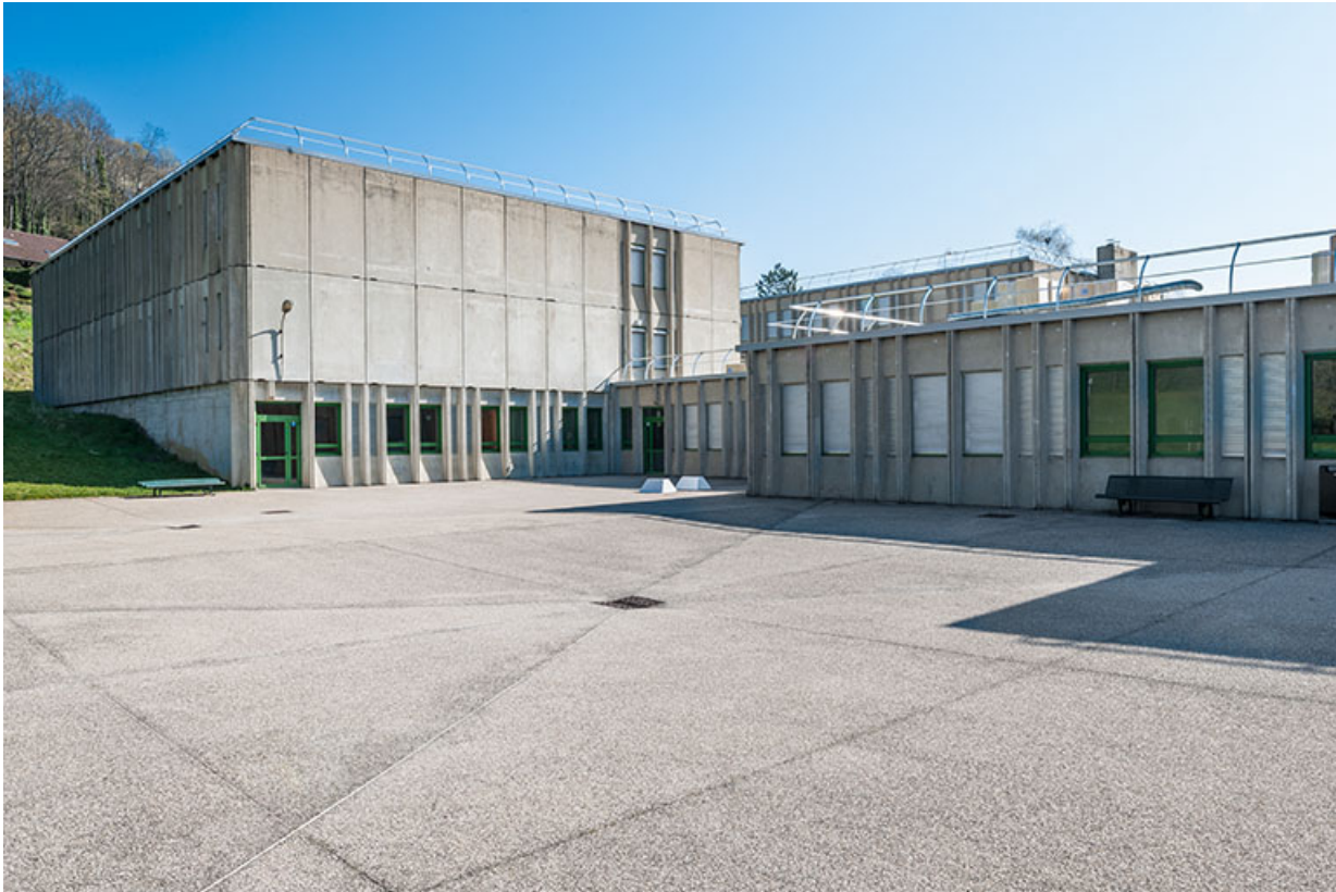
Vue des internats et façade postérieure de l'infirmerie.