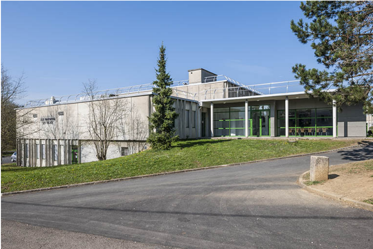
Bâtiment restauration : façade latérale.