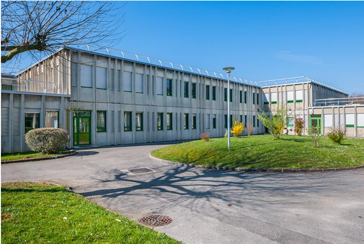
Infirmierie : façades postérieures