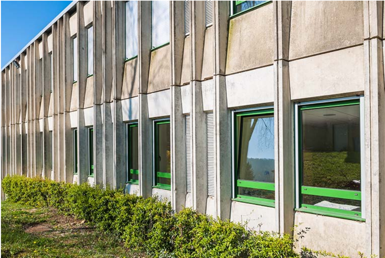
Façades préfabriquées : détail.