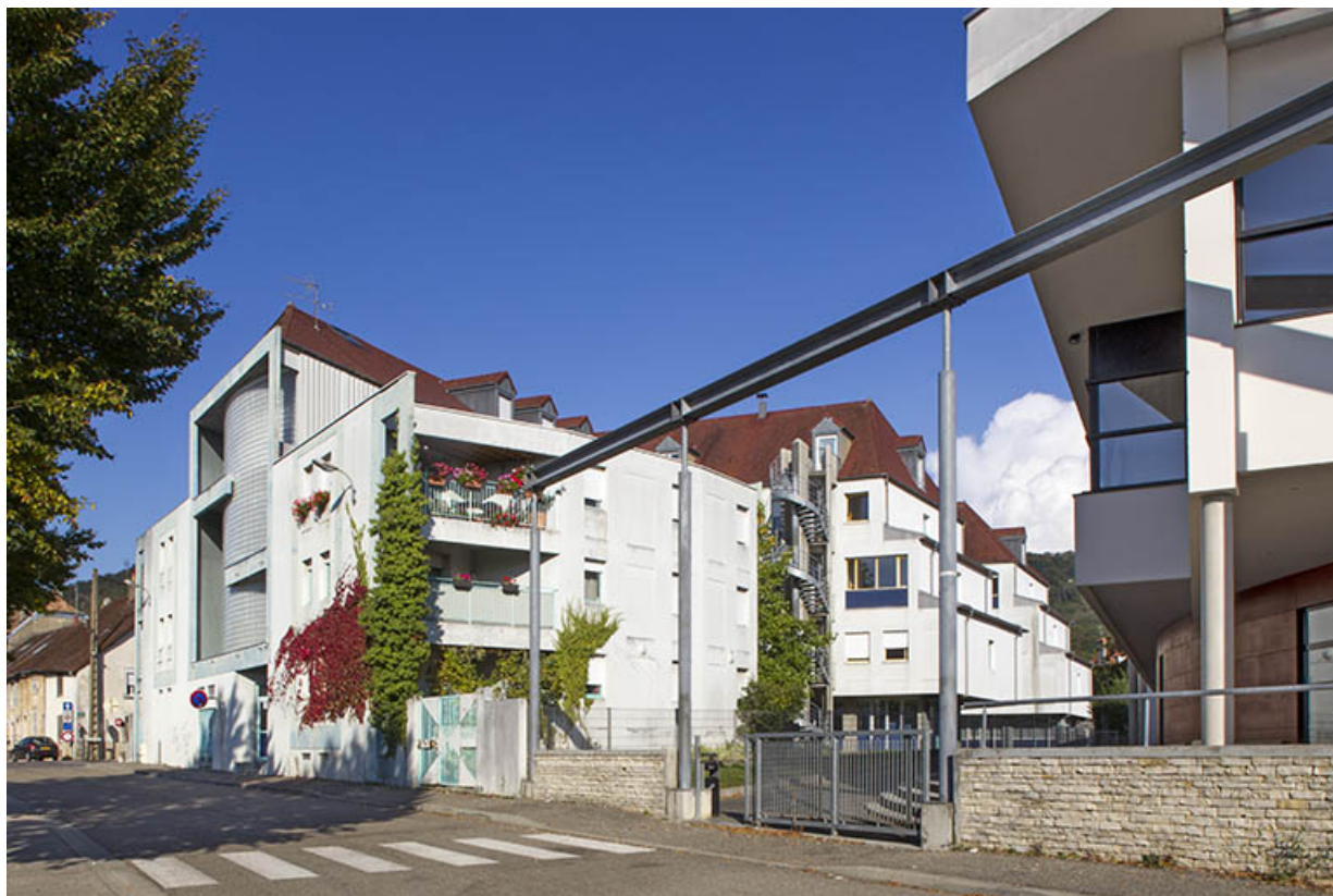
Internat : entrée, rue de Versailles.