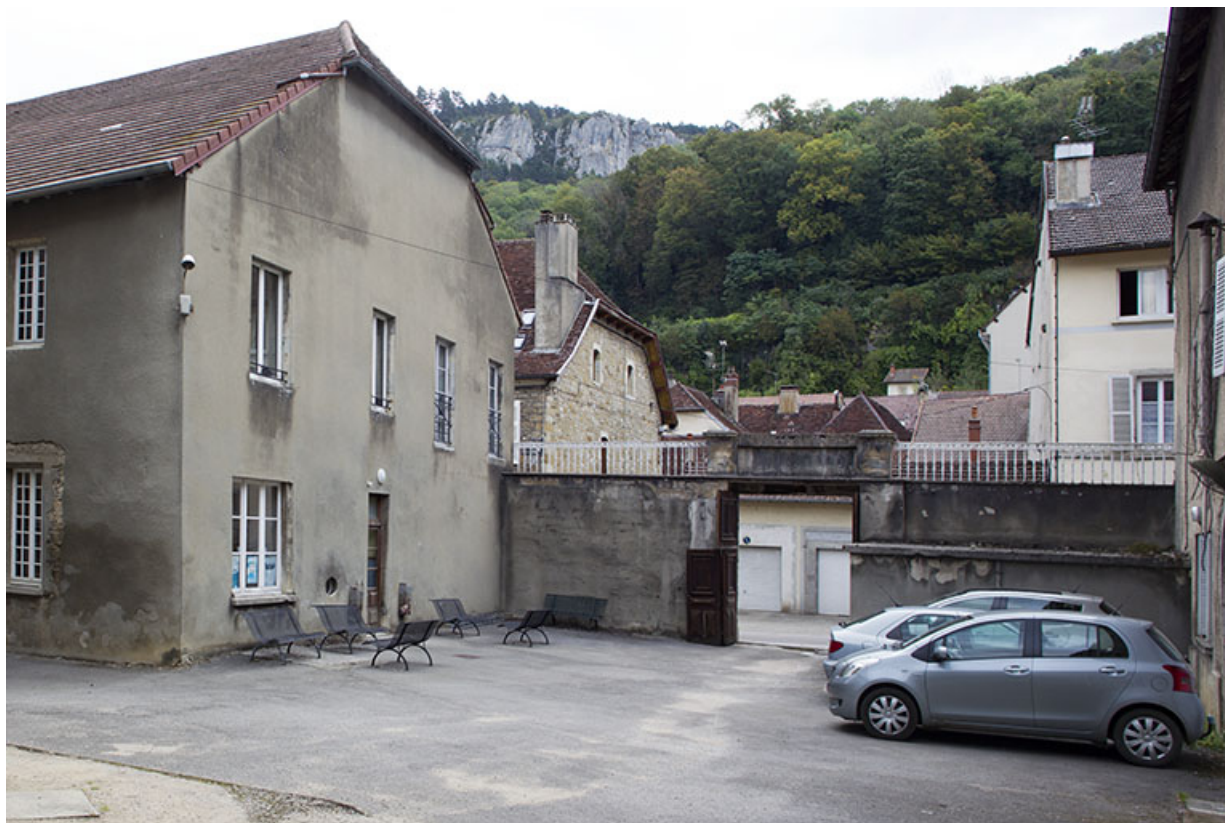
Cour intérieure, site Bonnotte.