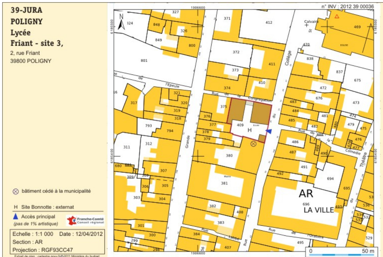
Plan-masse et de situation. Extrait du cadastre numérisé, 2012, section AR, échelle 1/ 1 100.