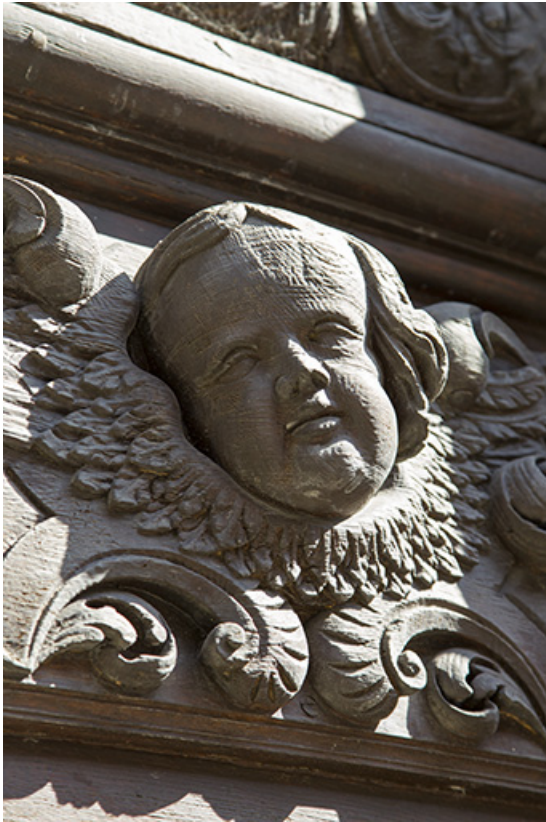
Site des oratoriens : détail de la porte des anges.