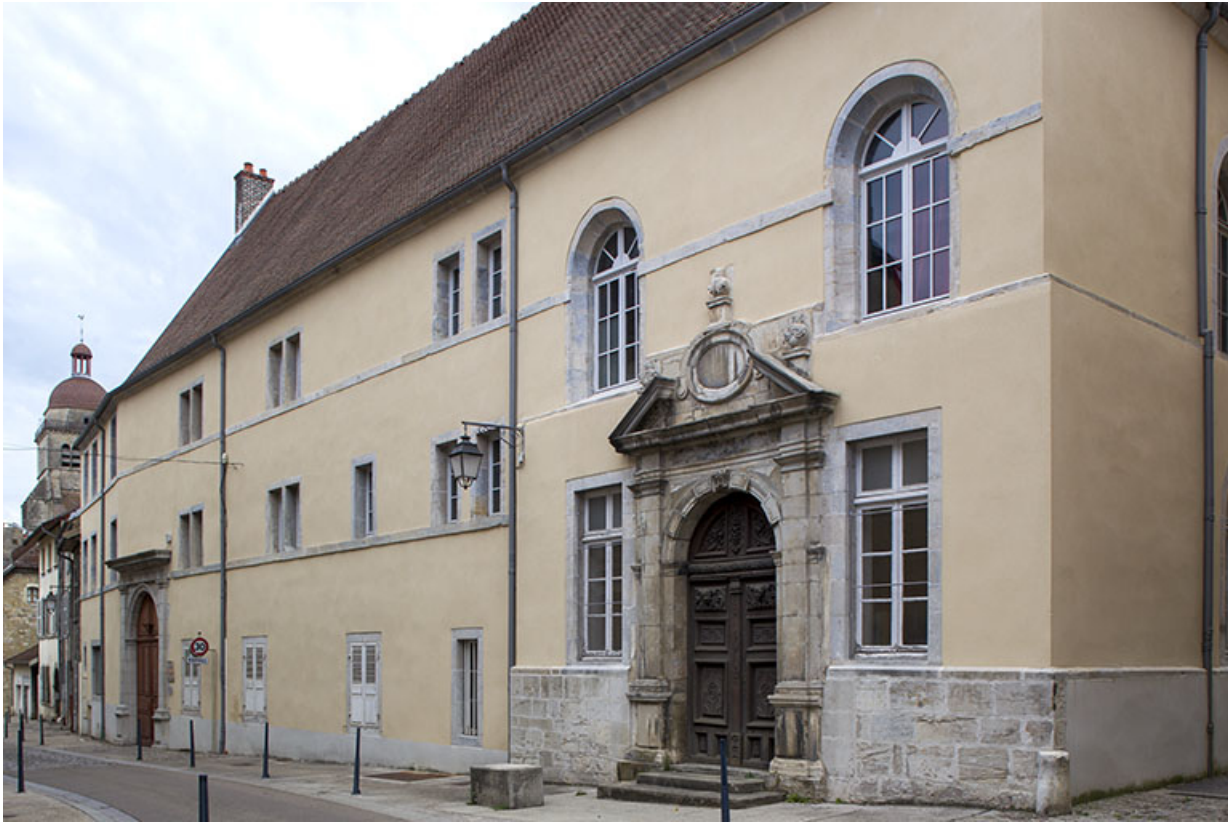
site des oratoriens : façade ouest donnant sur la rue du collège.