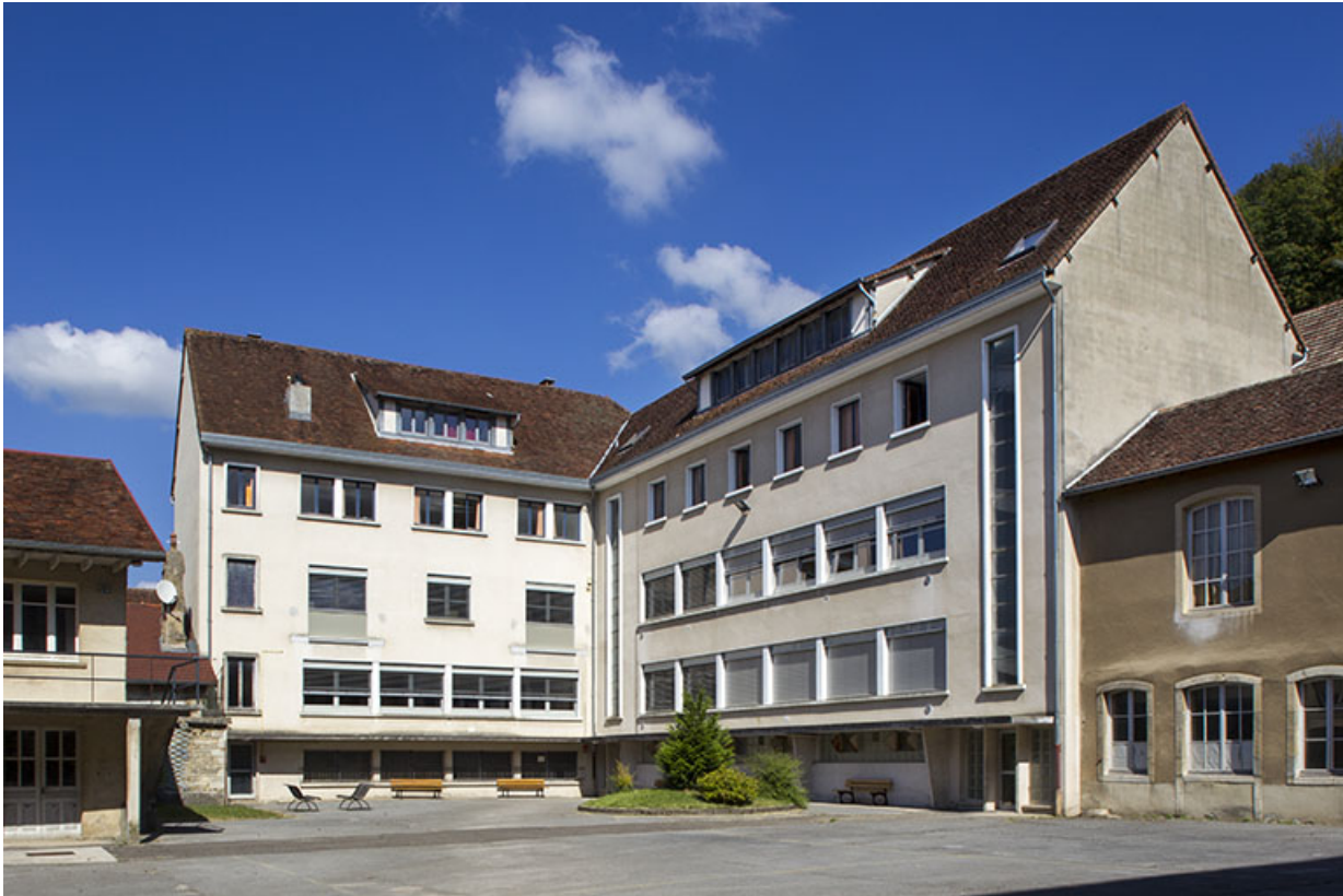
Site des oratoriens : bâtiments modernes fermant l'angle nord-est de la cour. 39, Poligny, 42 rue du Collège