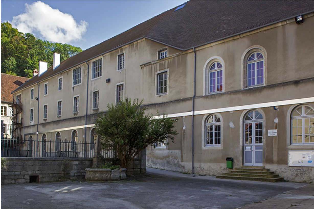
Site des oratoriens : façades sur cour.