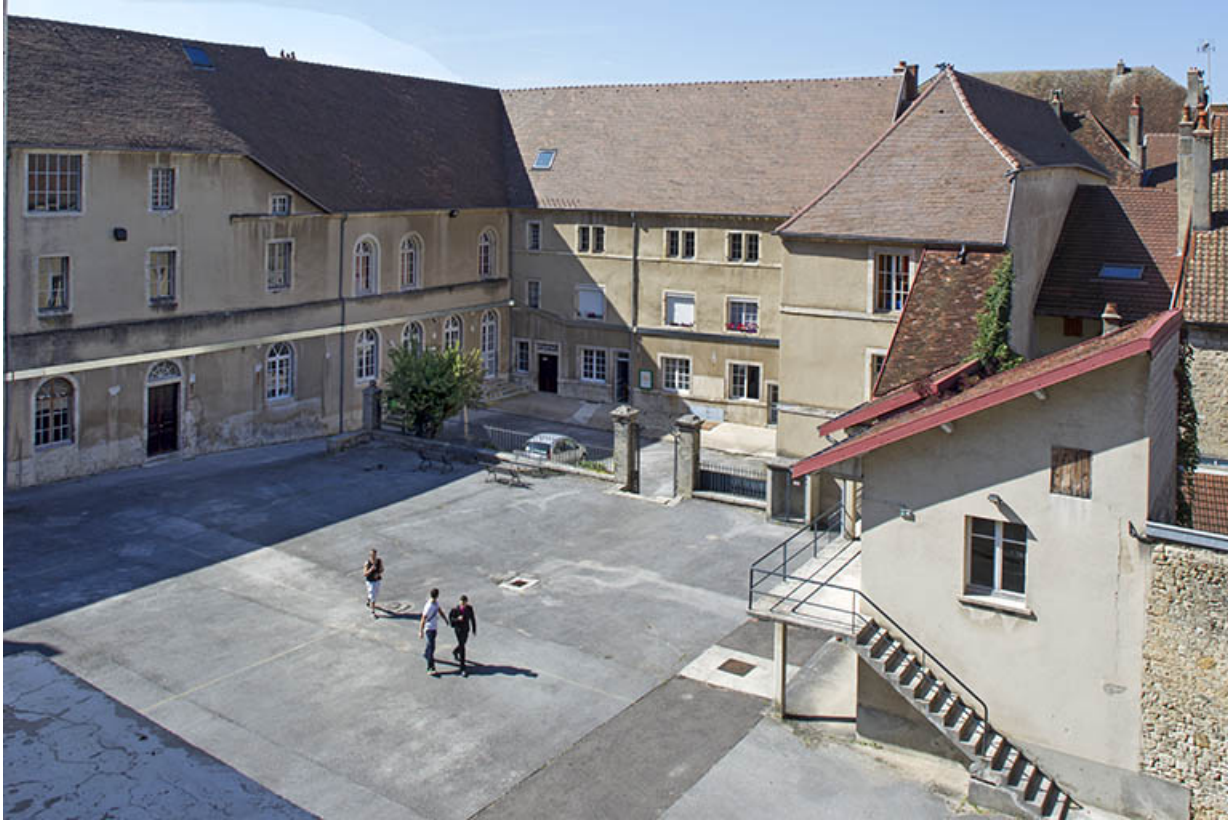
Externat : vue de la cour des oratoriens avec les adjonctions récentes.