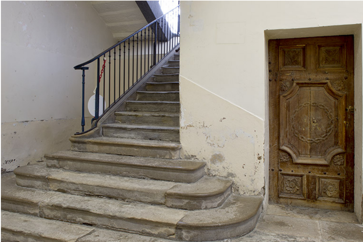
Site des oratoriens, aile sud.