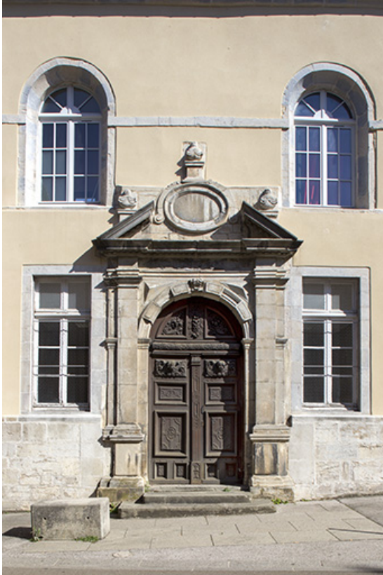
Site des oratoriens : façade Ouest sur la rue du collège, porte dite des anges. 39, Poligny, 42 rue du Collège