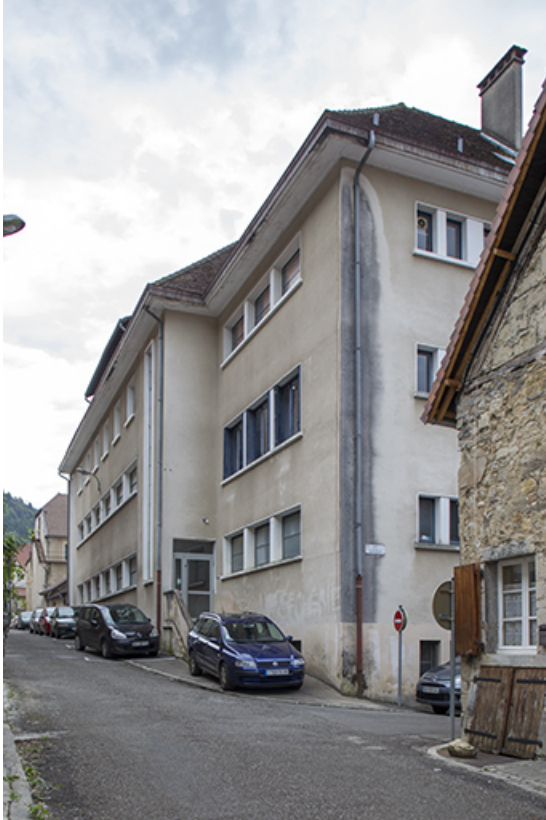
site des oratoriens : façades Nord des bâtiments, rue de la comédie. 39, Poligny, 42 rue du Collège