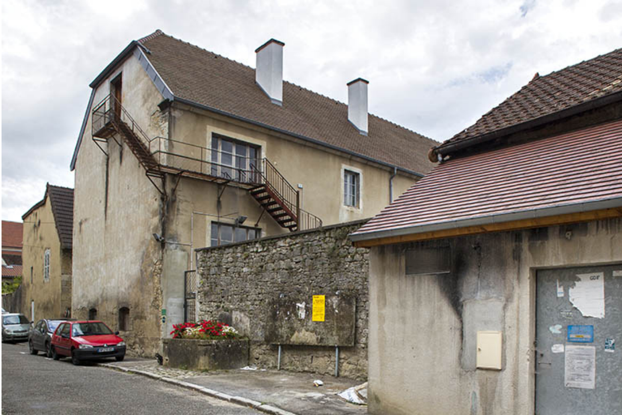
Site des oratoriens : façades Est, rue du théâtre 39, Poligny, 42 rue du Collège