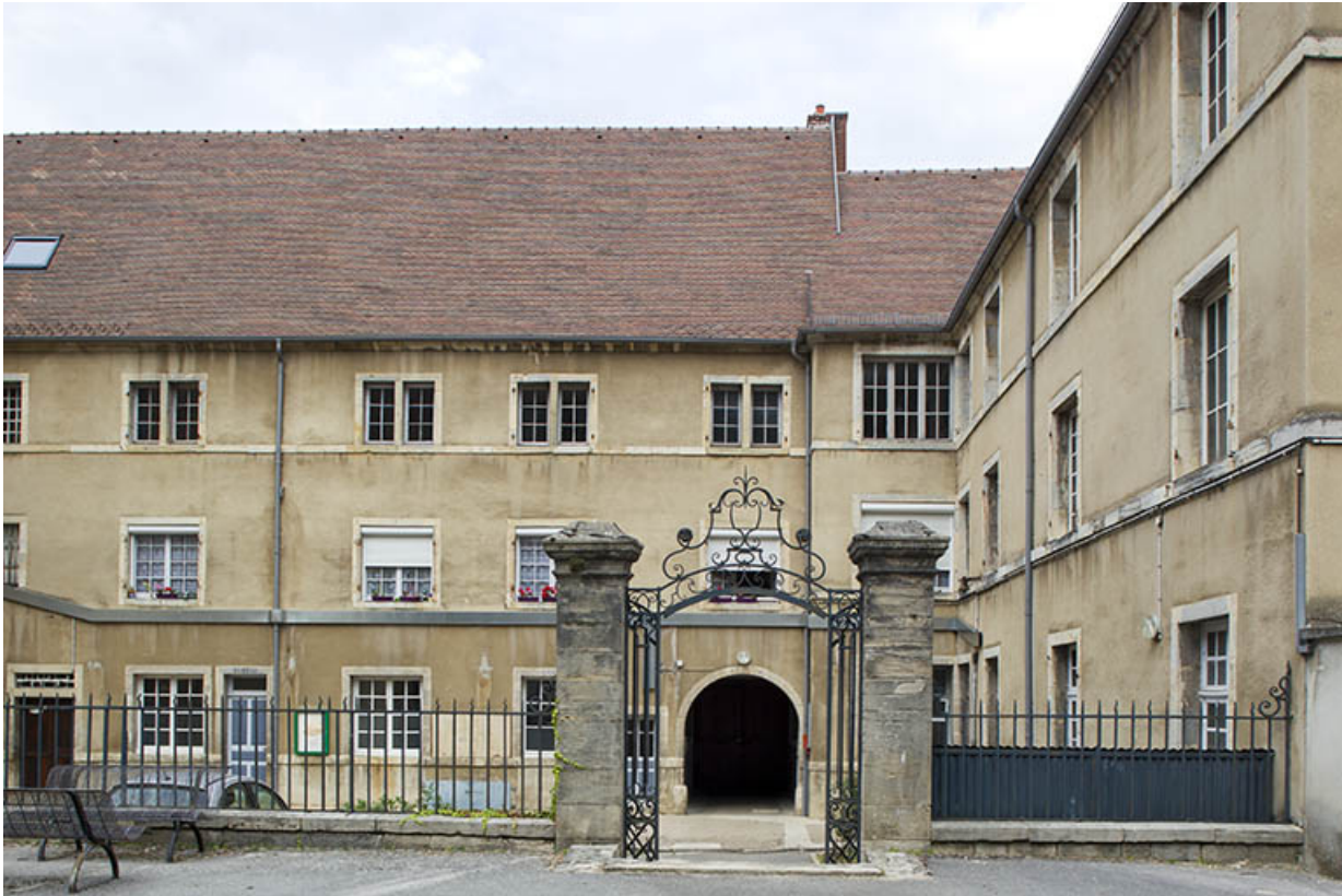
Cour des oratoriens : portail situé dans la cour intérieure.