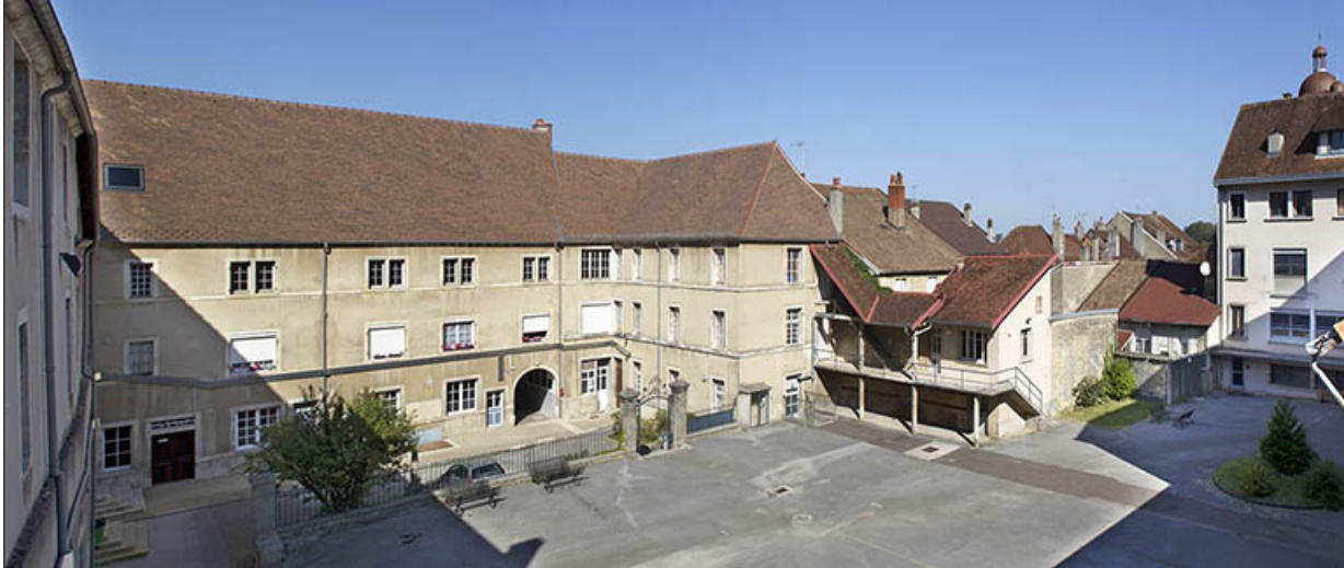
Cour intérieure du site des oratoriens : externat.