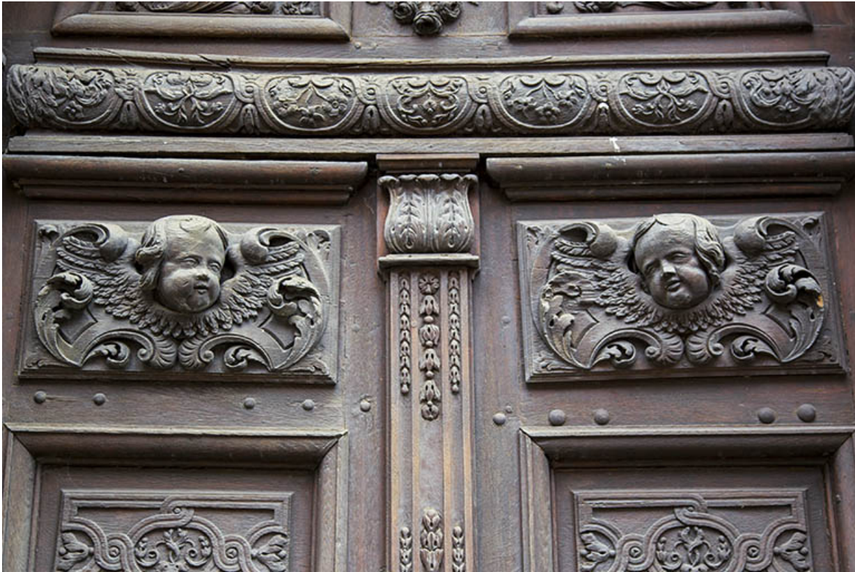
Site des oratoriens : détail du linteau de la porte des anges.