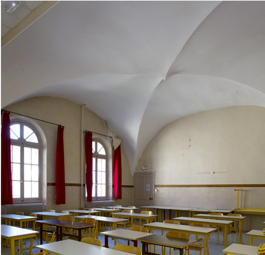
Site des oratoriens : salle de classe, dite de la chapelle.