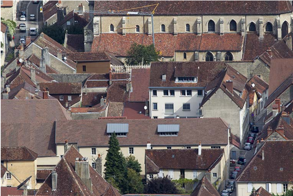
Vue générale du site des Oratoriens.