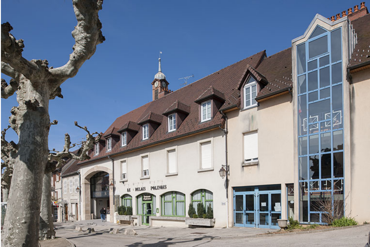
Poligny, lycée Hyacinthe Friant : restaurant d'application.