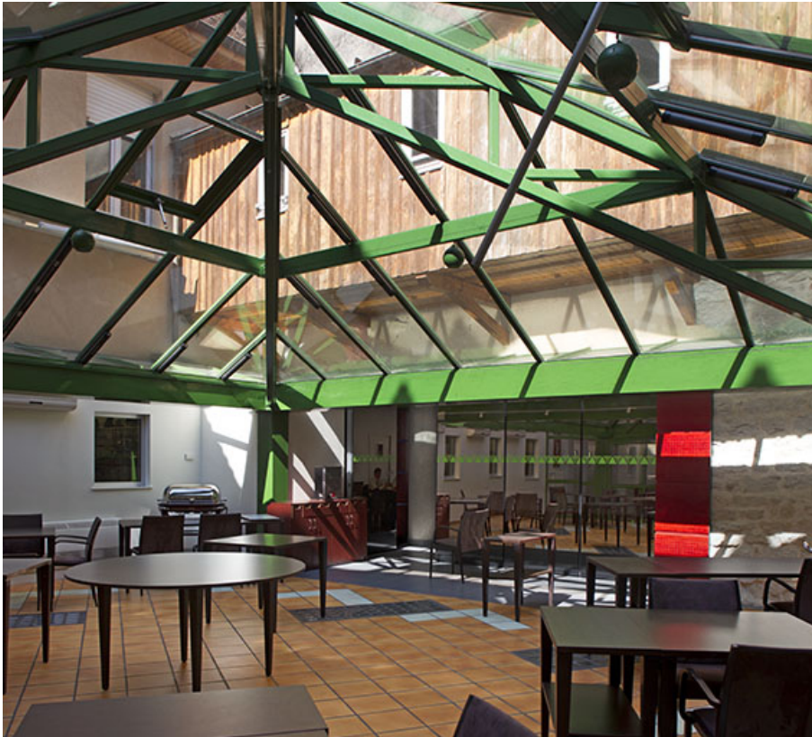
Restaurant d'application : salle sous la verrière.