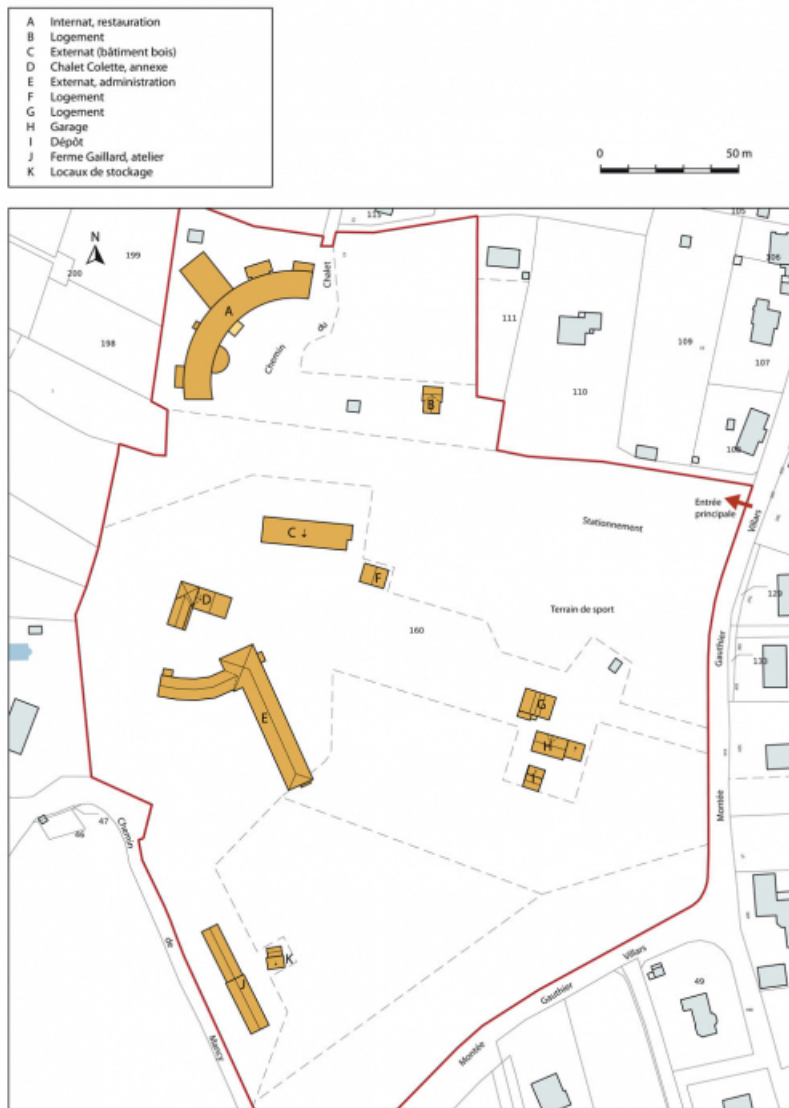
Plan-masse et situation. Extrait du plan cadastral, 2011, section BD, échelle 1/1 500. 39, Lons-le-Saunier, 410 montée Gauthier Villars