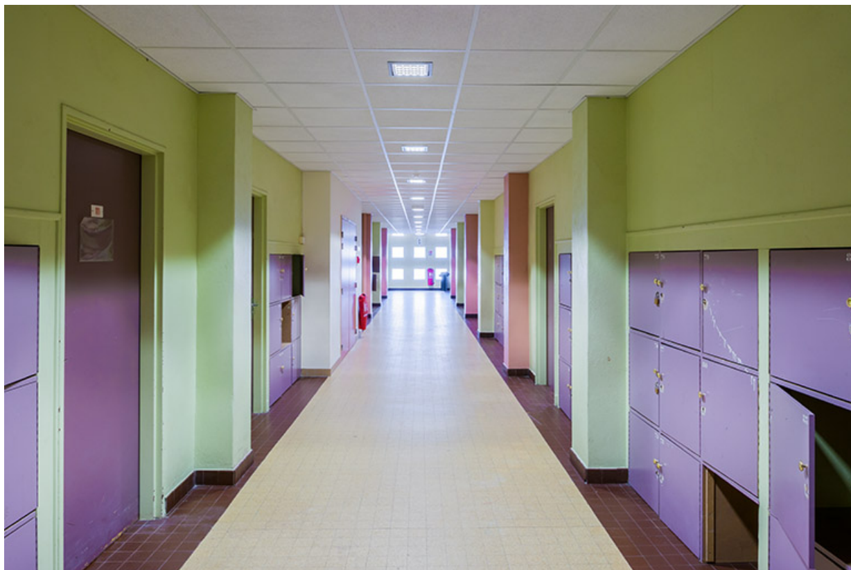
Couloir du premier étage l'externat.

39, Lons-le-Saunier, 400 rue du Docteur Jean Michel