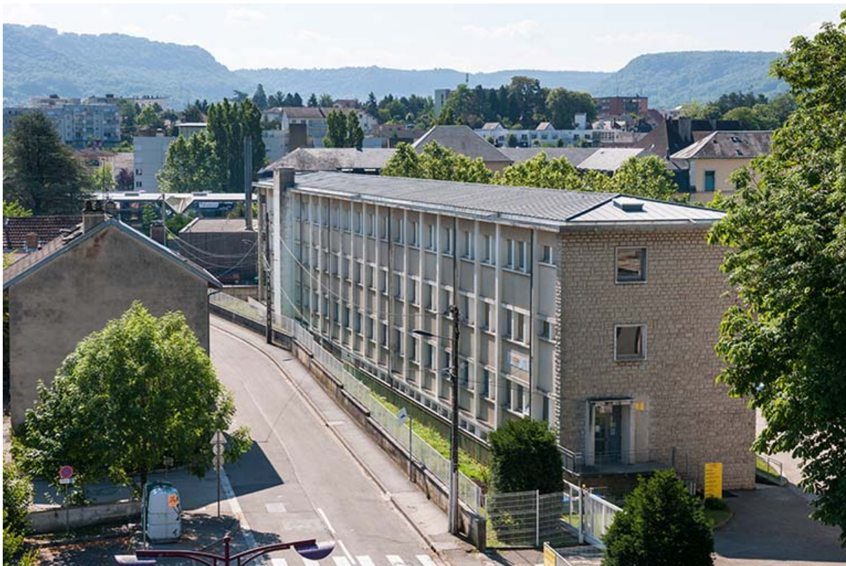
Vue trois quart de l'externat, ancien GRETA.

39, Lons-le-Saunier, 400 rue du Docteur Jean Michel