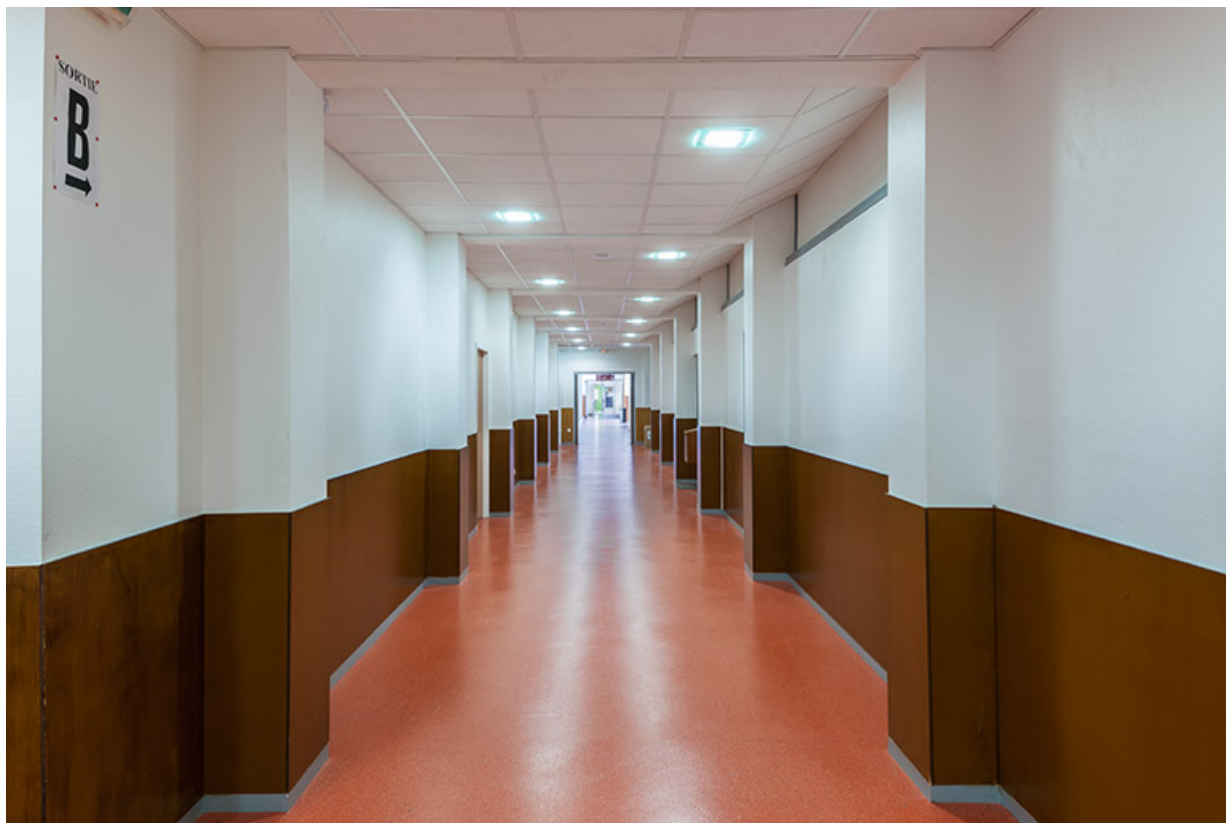
Couloir d'accès au hall d'entrée, rez-de-chaussée.

39, Lons-le-Saunier, 400 rue du Docteur Jean Michel