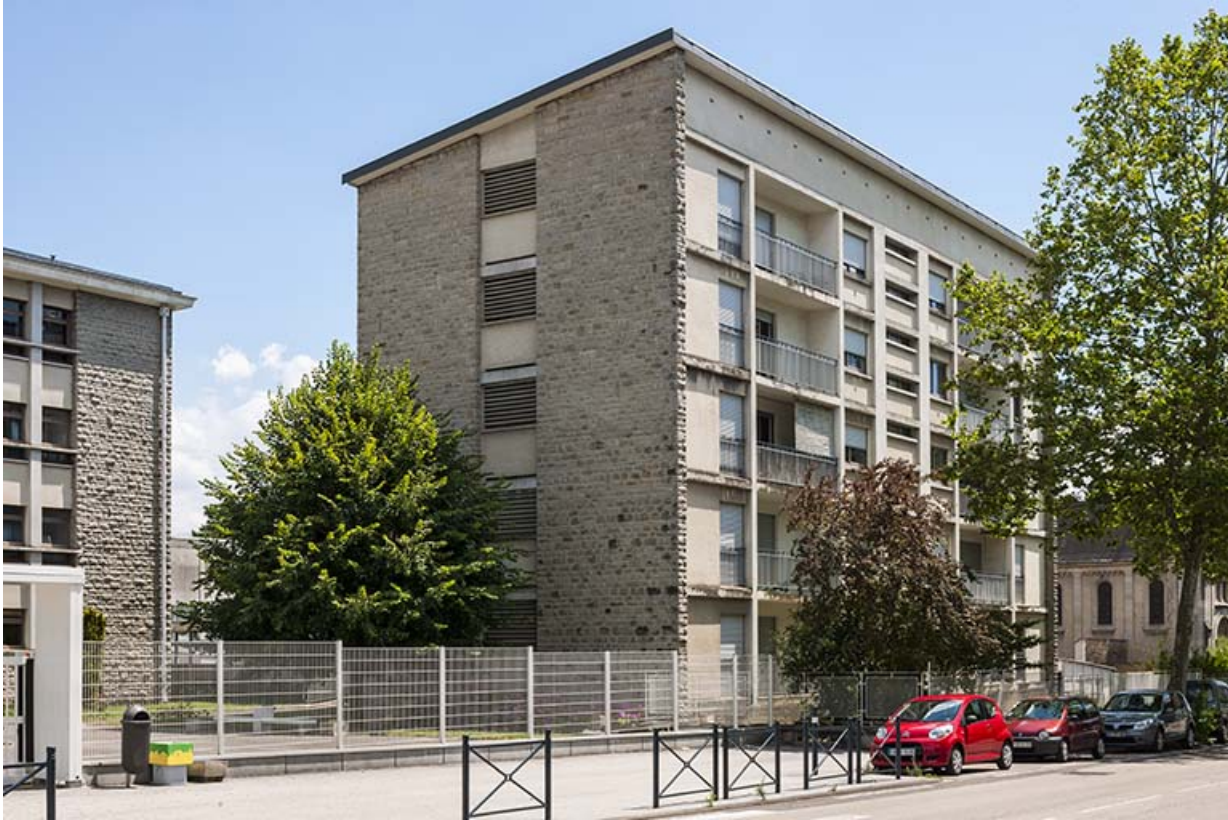
Bâtiment administration-logements, vue de trois quart depuis la rue Michel sur façade antérieure. 39, Lons-le-Saunier, 400 rue du Docteur Jean Michel