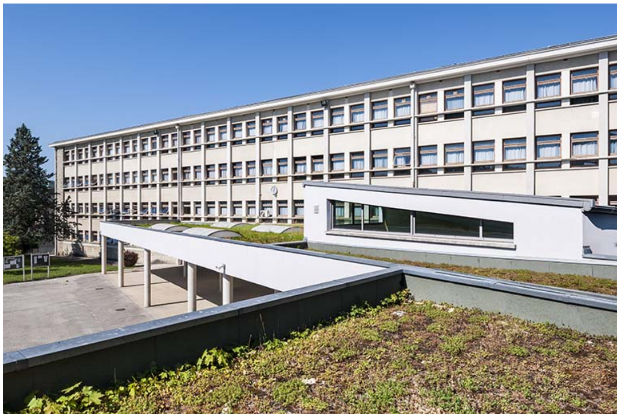
internat-externat, avec préau et liaisons, vue de puis la cour : toits végétalisés.

39, Lons-le-Saunier, 400 rue du Docteur Jean Michel