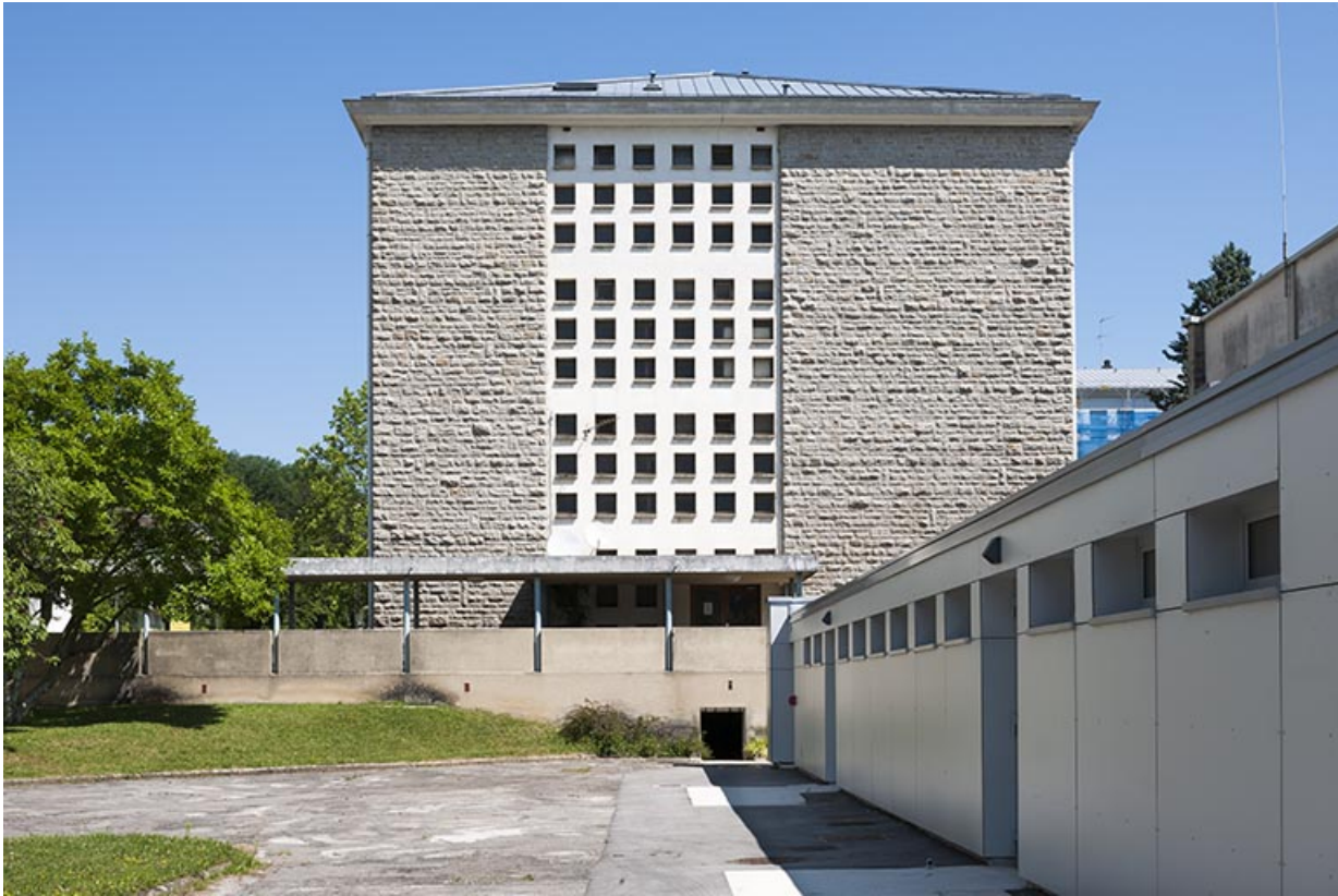
Pignon du bâtiment principal et gymnase.

39, Lons-le-Saunier, 400 rue du Docteur Jean Michel