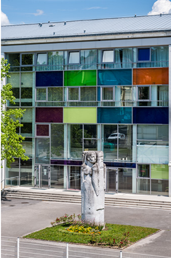
Sculpture 1% artistique : vue générale

39, Lons-le-Saunier, 400 rue du Docteur Jean Michel