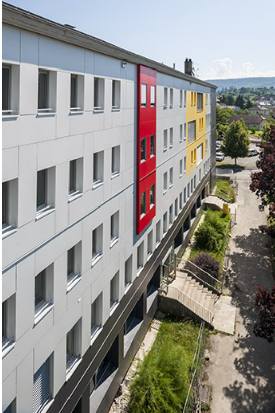
Façade antérieure de l'internat rénovée avec parement isolant.

39, Lons-le-Saunier, 400 rue du Docteur Jean Michel