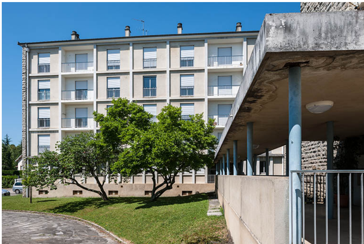
Cour intérieure : à droite gymnase, au fond bâtiment administration-logements.

39, Lons-le-Saunier, 400 rue du Docteur Jean Michel