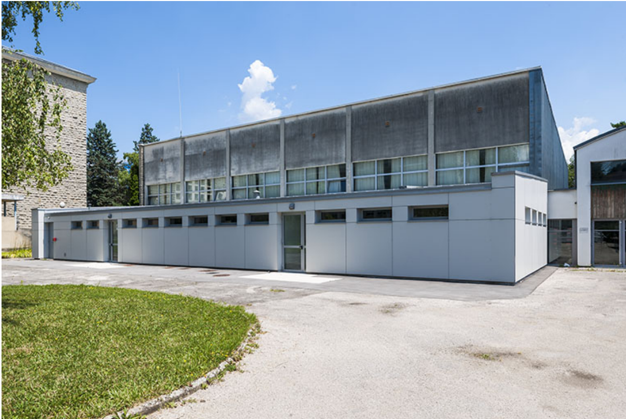
Façade antérieure du gymnase.

39, Lons-le-Saunier, 400 rue du Docteur Jean Michel