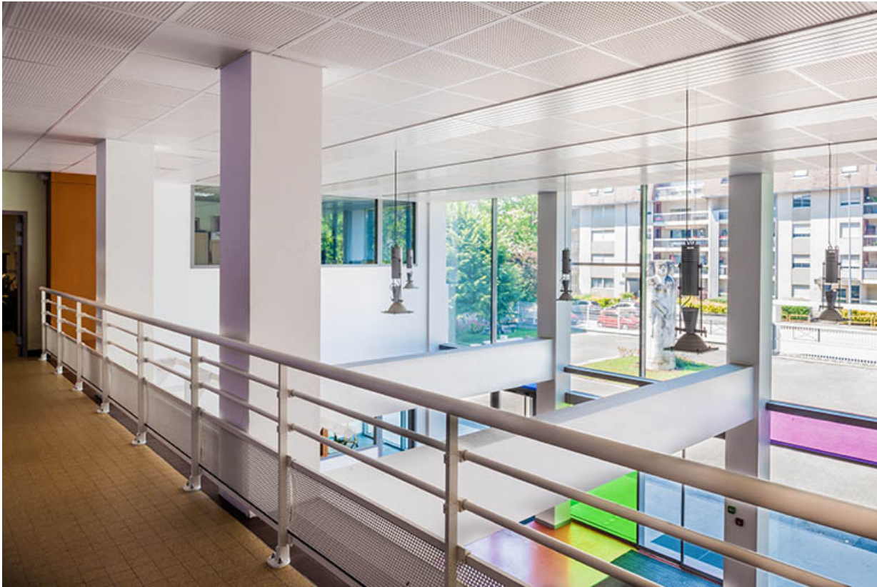
Vue depuis la mezzanine du hall d'entrée.

39, Lons-le-Saunier, 400 rue du Docteur Jean Michel