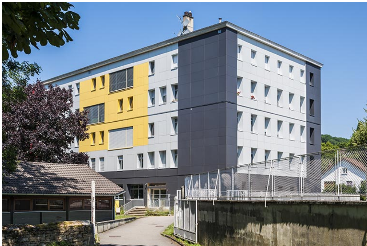
Façade latérale de l'internat après rénovation.

39, Lons-le-Saunier, 400 rue du Docteur Jean Michel