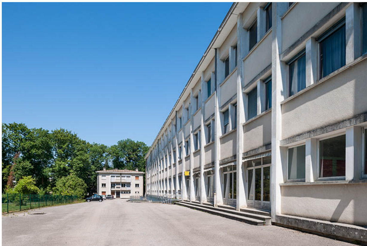
Façade de l'externat, en arrière-plan logements.

39, Lons-le-Saunier, 400 rue du Docteur Jean Michel