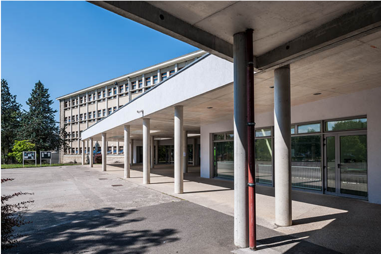
Liaison entre bâtiments : détail.

39, Lons-le-Saunier, 400 rue du Docteur Jean Michel