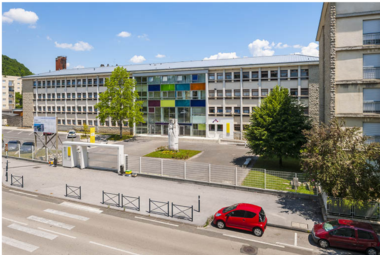
Vue générale depuis la rue Jean Michel.

39, Lons-le-Saunier, 400 rue du Docteur Jean Michel