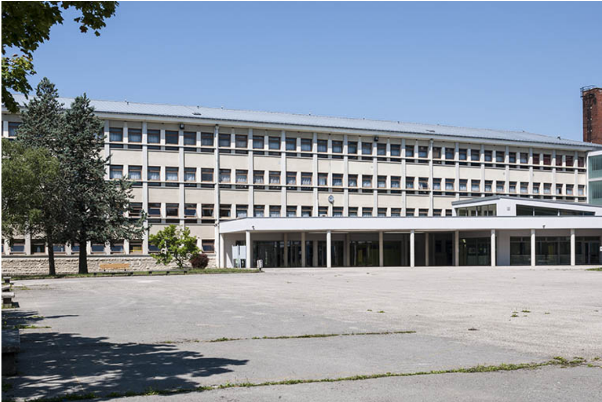
Vue de la façade postérieure de l'internat.

39, Lons-le-Saunier, 400 rue du Docteur Jean Michel