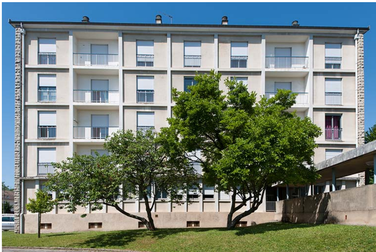
Bâtiment administration-logement : façade postérieure avec liaison vers le bâtiment principal.

39, Lons-le-Saunier, 400 rue du Docteur Jean Michel