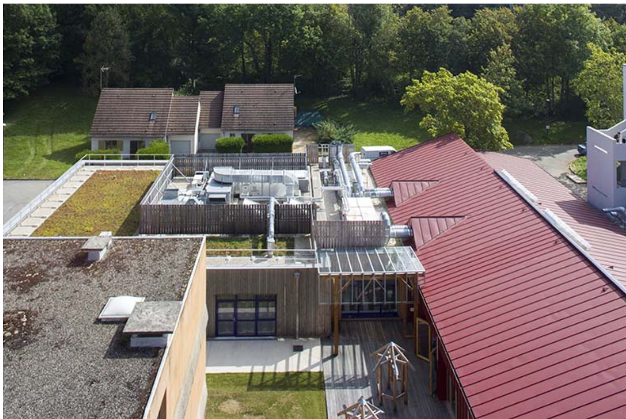
Restauration : vue sur la cour intérieure, au fond pavillons pour logements.