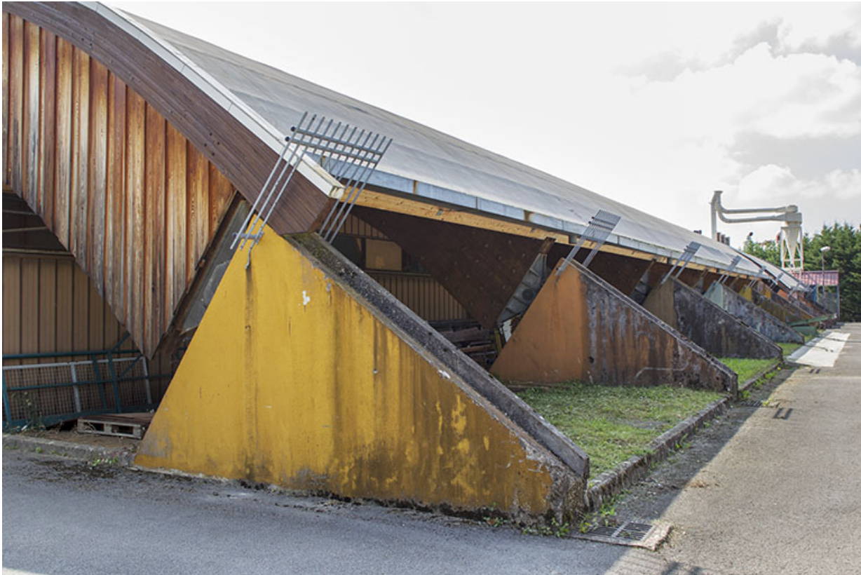
Atelier : couverture et charpente, détail de la culée.