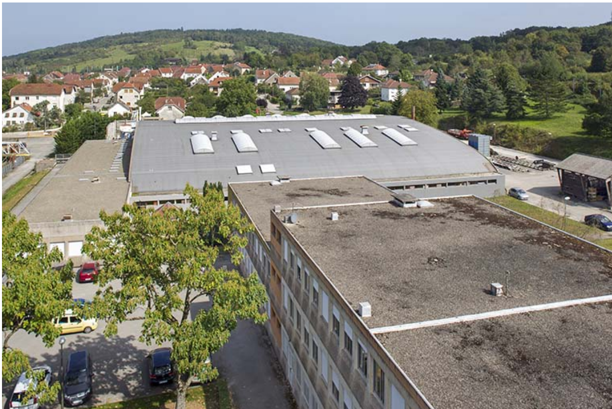
Externat et ateliers scierie et menuiserie : toitures.