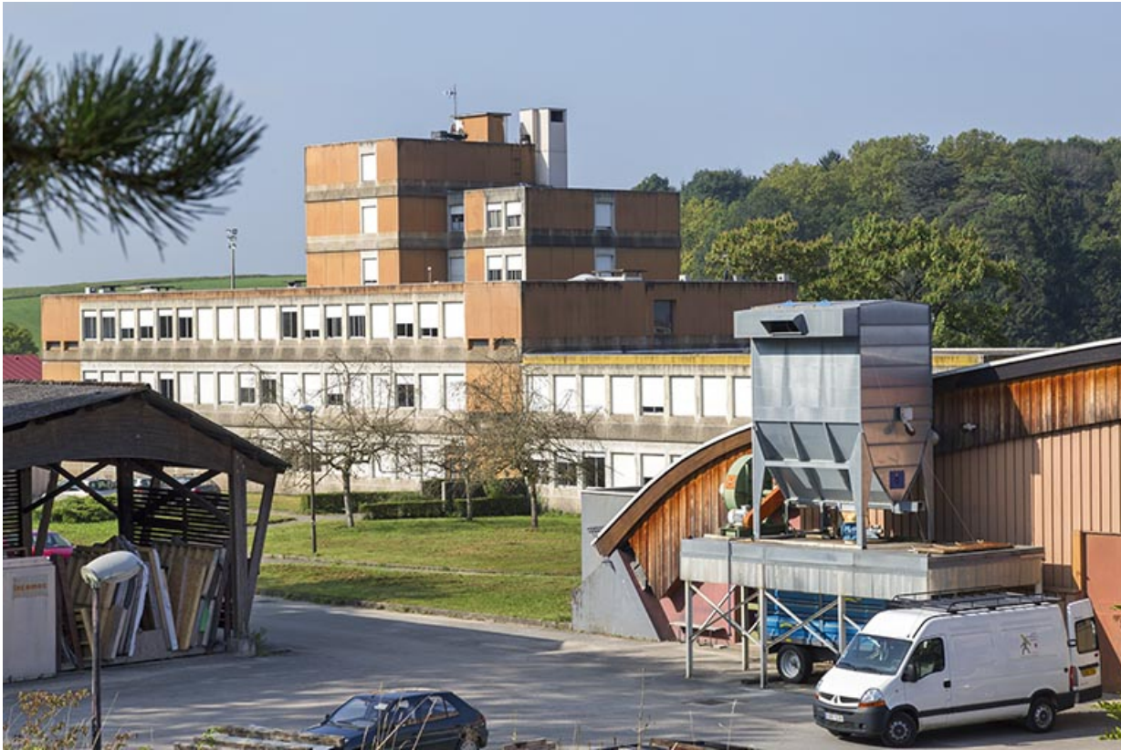
Externat : vue générale.