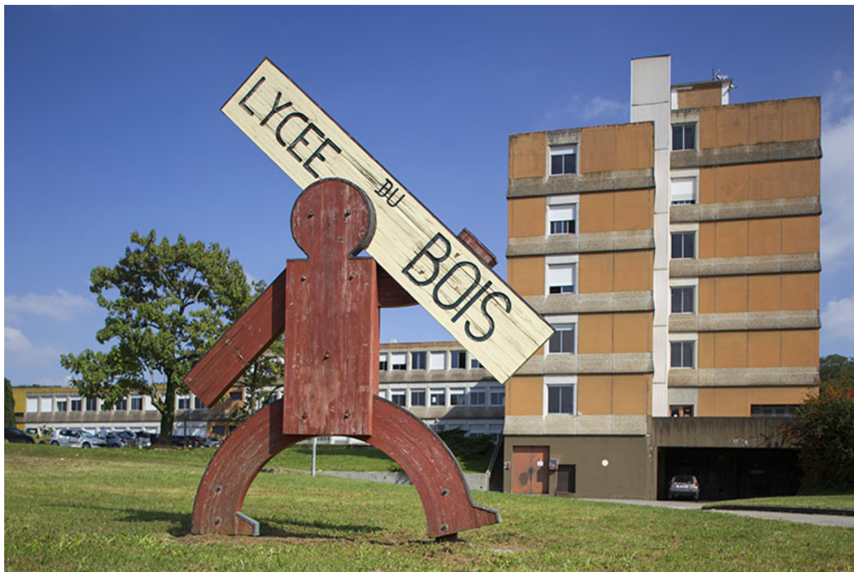
Administration : pignon ouest. Au pied, réalisation signalétique par les élèves. 39, Mouchard, 67 rue de Strasbourg