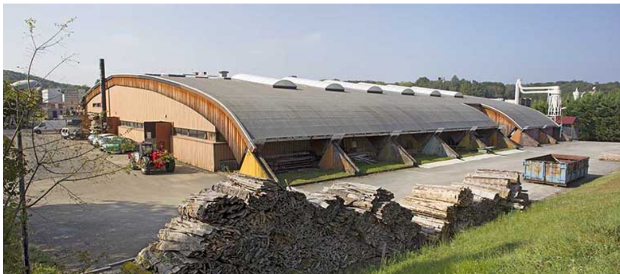
Atelier : couverture avec charpente en lamellé collé.