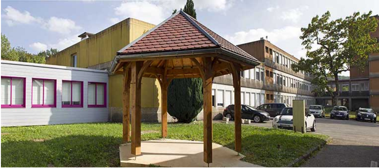
Externat : cour ouest.