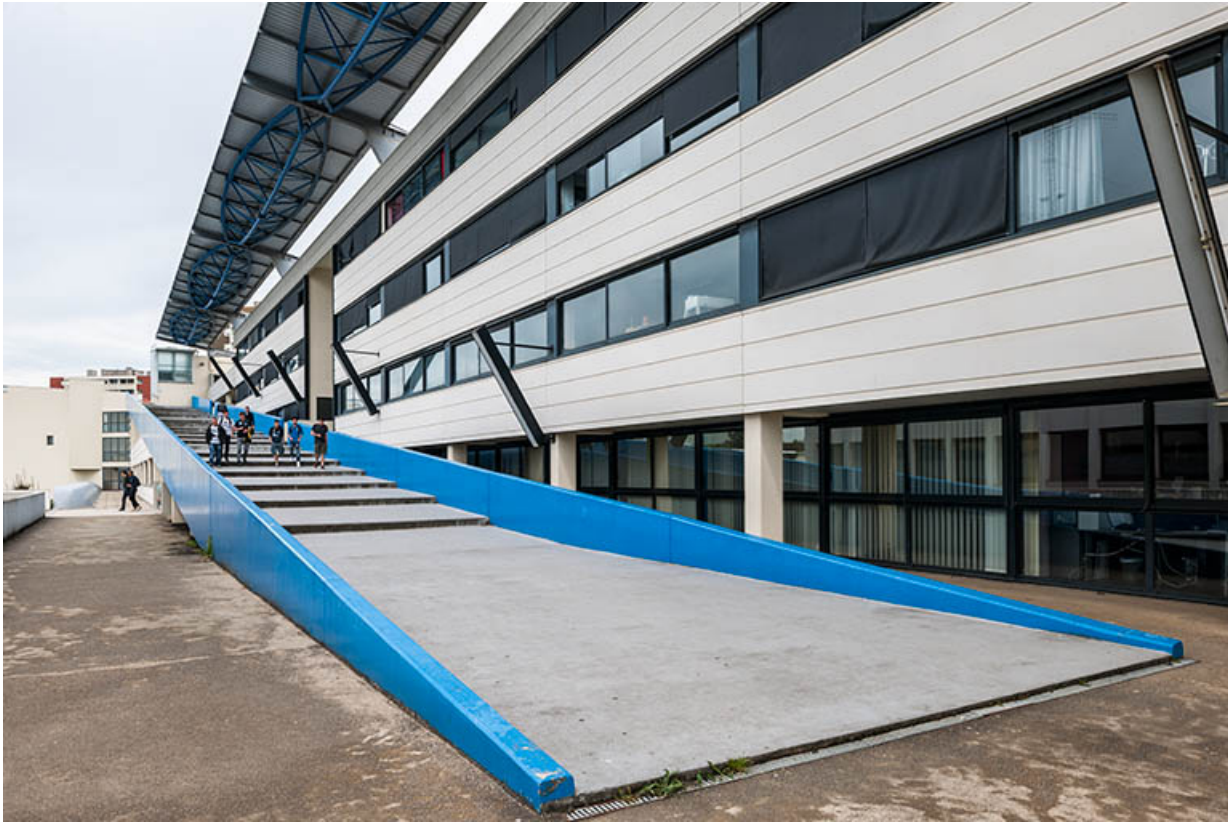
Externat, façade postérieure : rampe de secours.