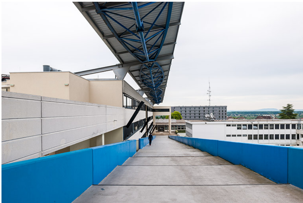
Externat : vue depuis le haut de la rampe avec aperçu de la couverture métallique.