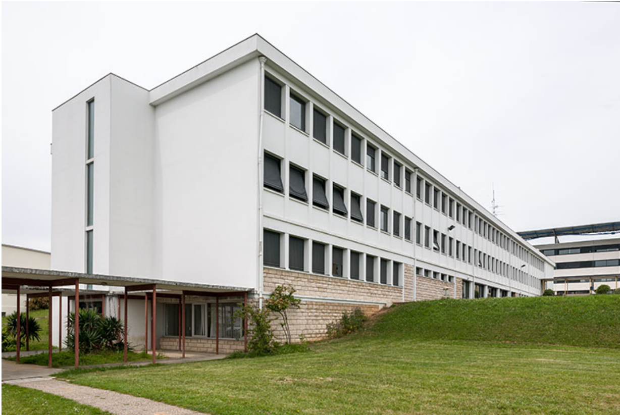
Externat : ancien bâtiment, pignon sud.