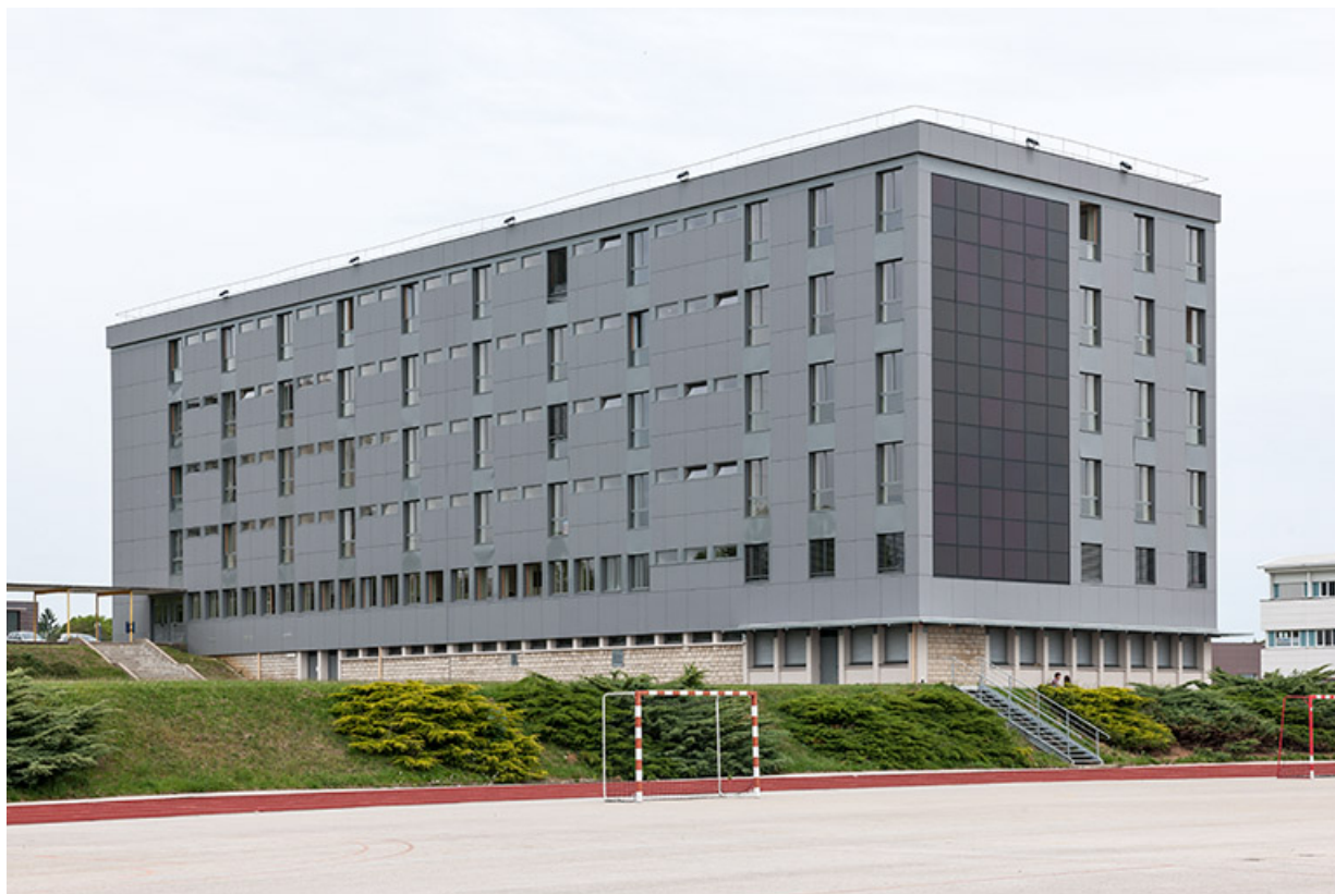
Internat : façade antérieure avec bardage et pignon sud avec panneaux photovoltaïques 39, Dole rue Charles Laurent-Thouverey