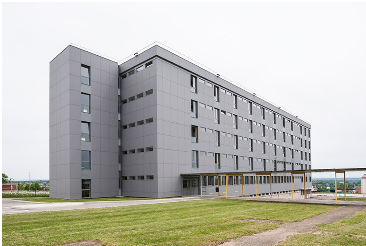
Internat : façade antérieure et pignon nord, passage vers l'externat-restauration. 39, Dole rue Charles Laurent-Thouverey