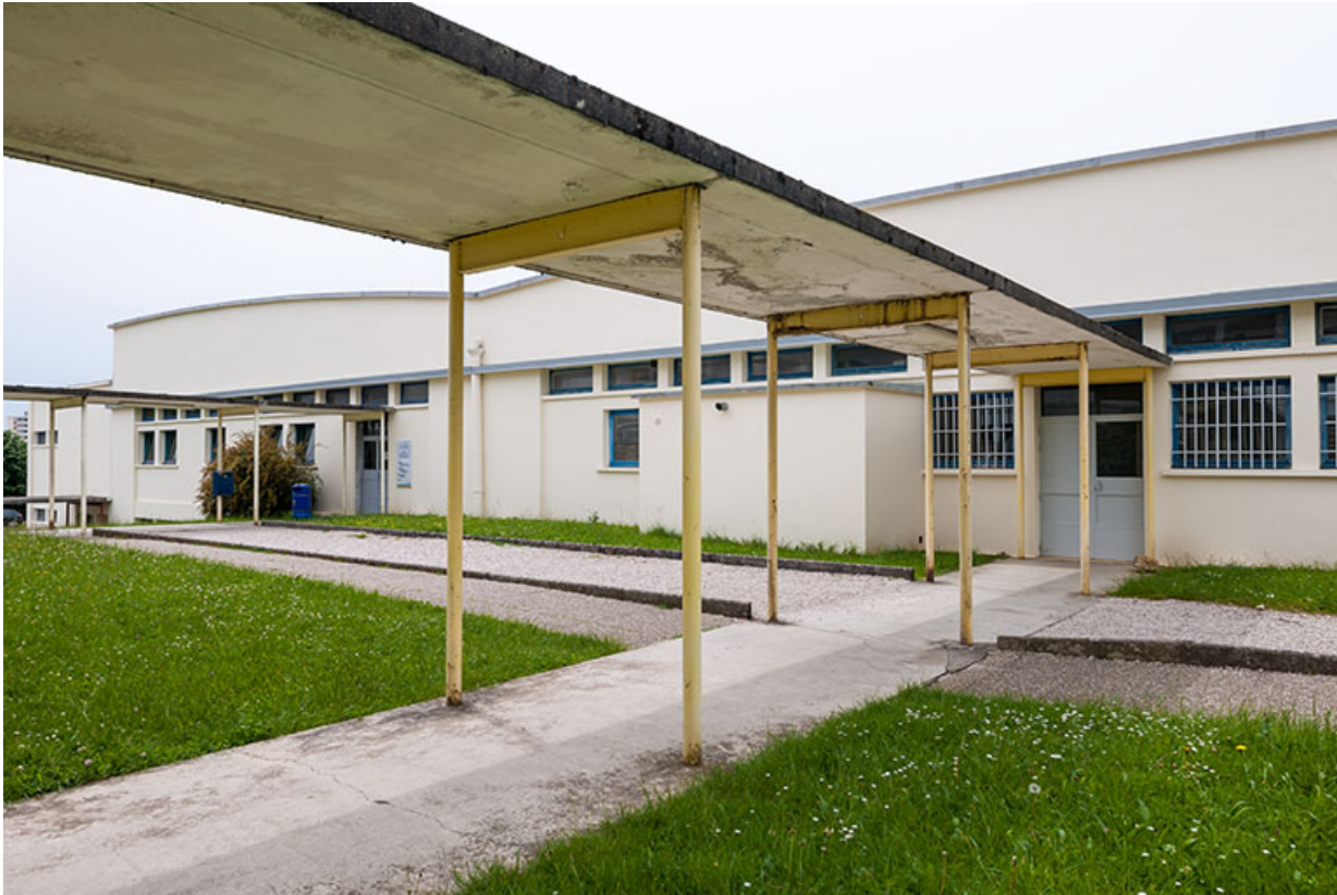
Passage couvert entre atelier et externat : détail.