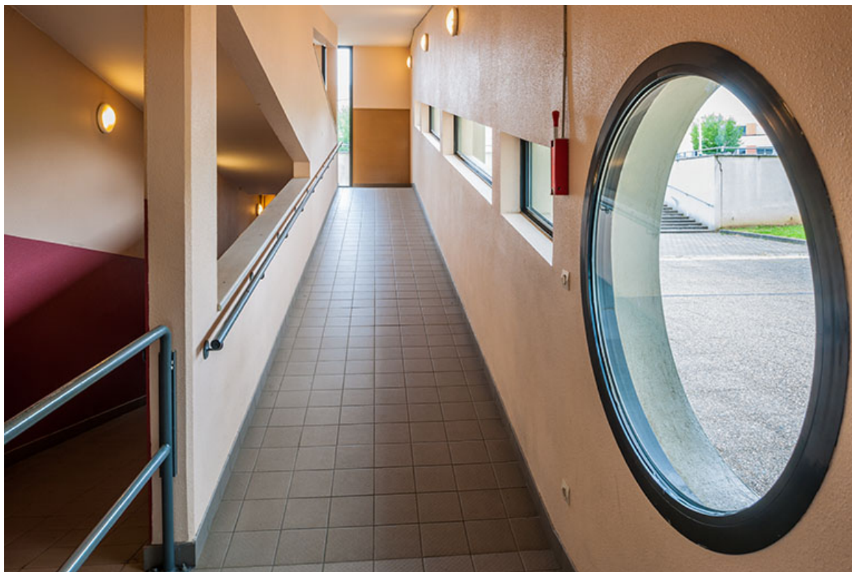
Bâtiment d'externat : circulation intérieure, détails des ouvertures.