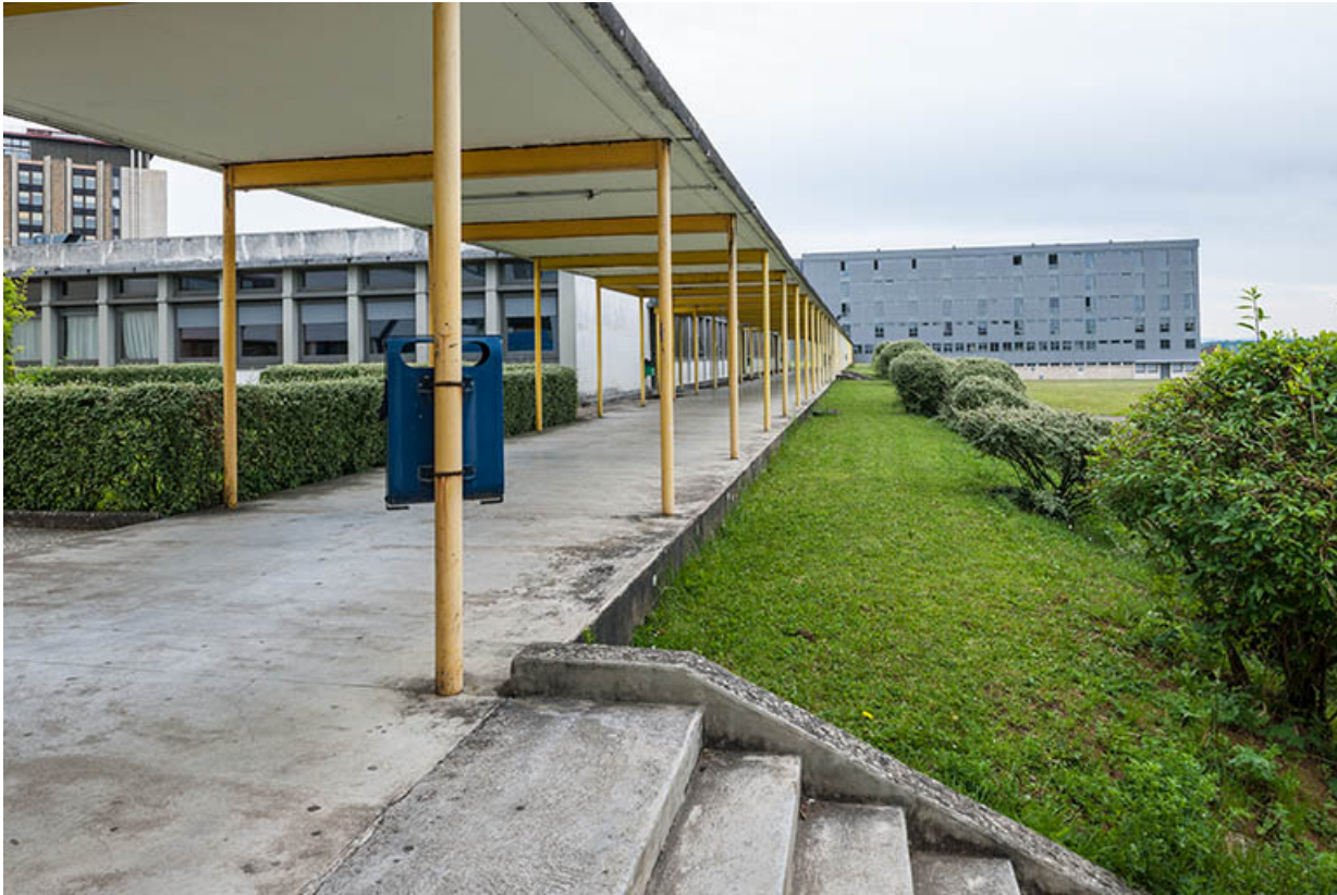
Passage couvert menant au bâtiment d'internat.