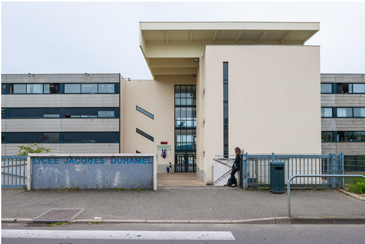
Entrée principale sur rue Charles Laurent Thouverey.