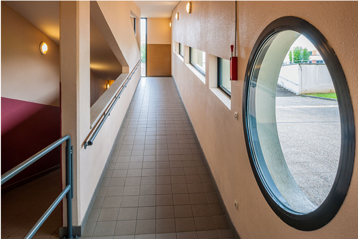
Bâtiment d'externat : circulation intérieure, détails des ouvertures.