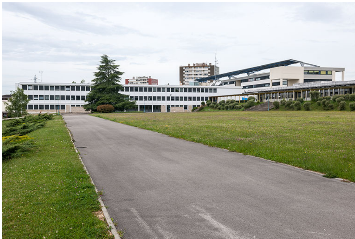
Vue générale des bâtiments d'externat depuis l'intérieur de l'établissement.