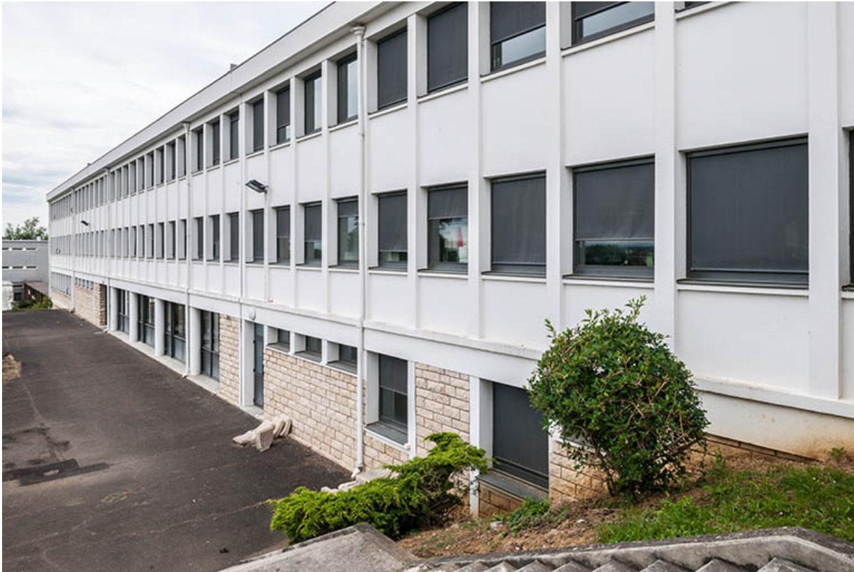
Façade antérieure de l'ancien externat.