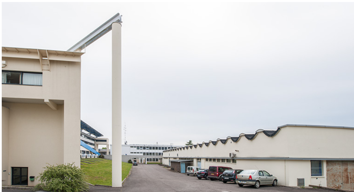
Ateliers : façade antérieure.