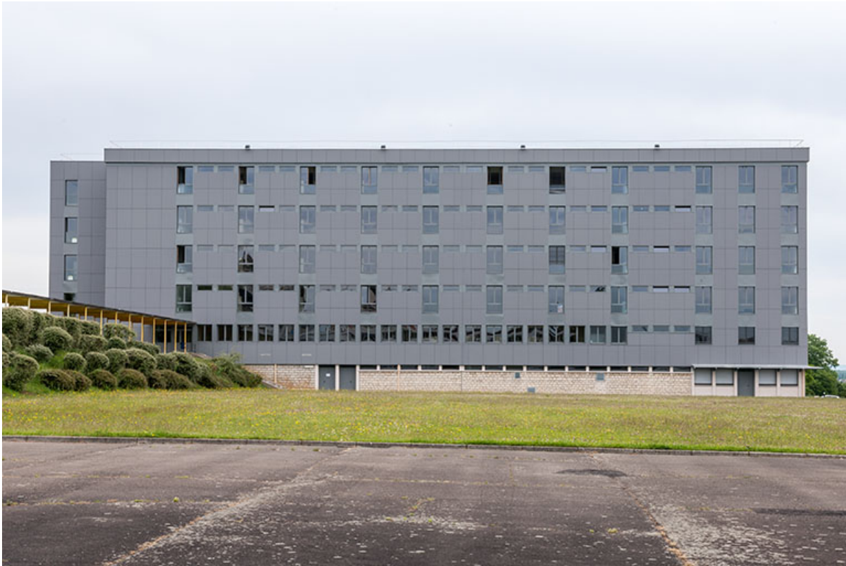
Internat : façade antérieure.