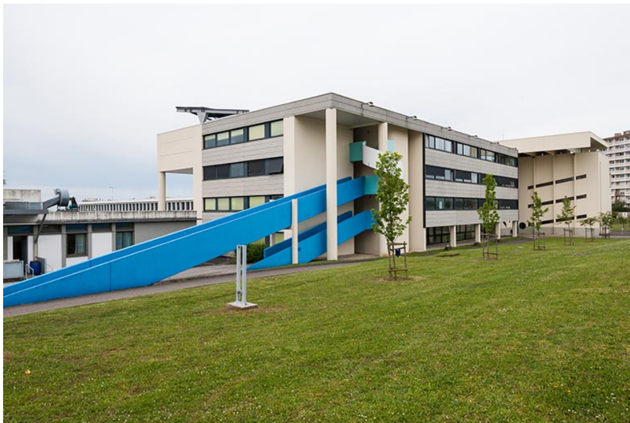
Bâtiment d'exernat avec rampe : vue depuis l'espace intérieur.