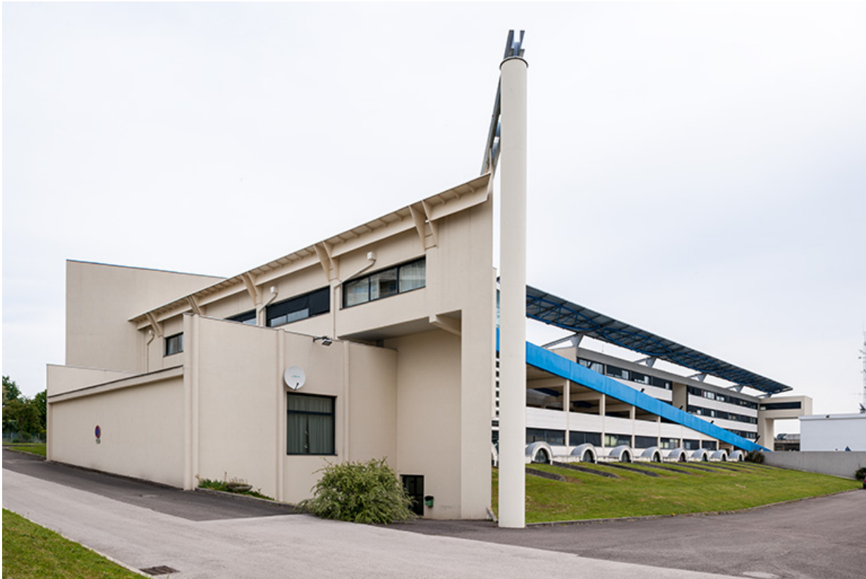
Bâtiment d'externat : pignon ouest.