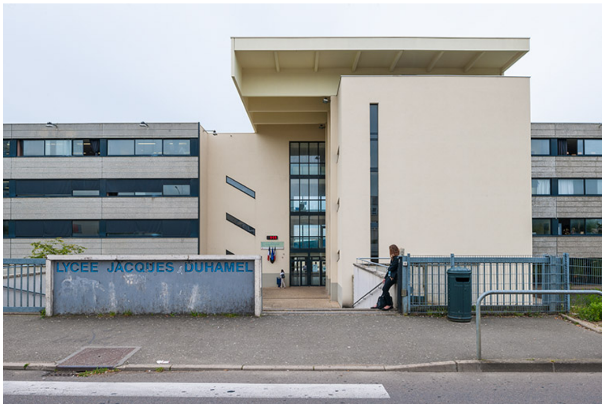
Entrée principale sur rue Charles Laurent Thouverey.