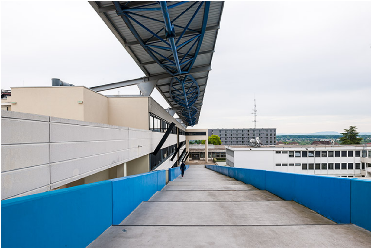
Externat : vue depuis le haut de la rampe avec aperçu de la couverture métallique.