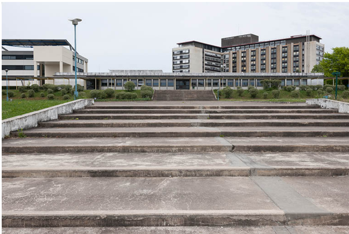
Façades postérieures des bâtiments d'externat et restauration