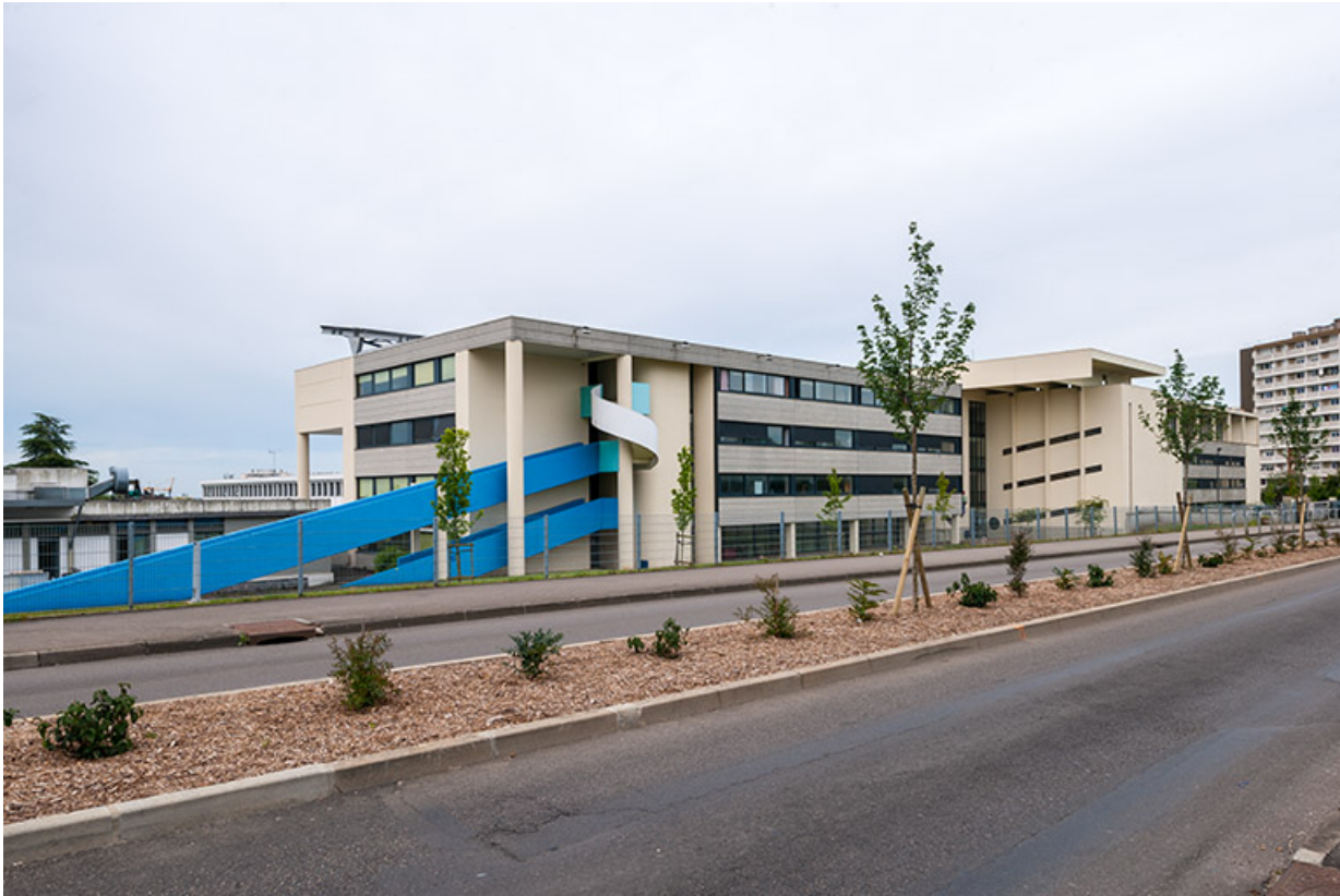
Externat : façade postérieure.