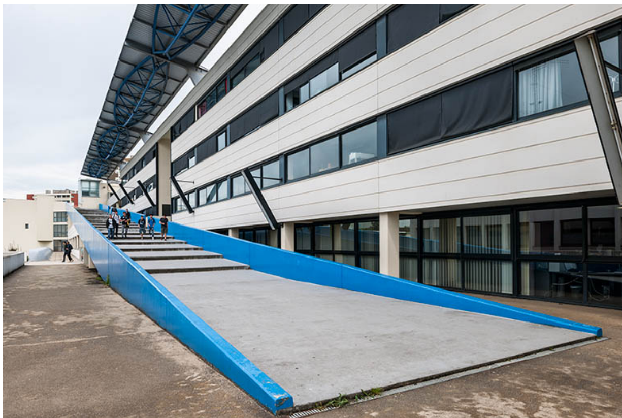
Externat, façade postérieure : rampe de secours.