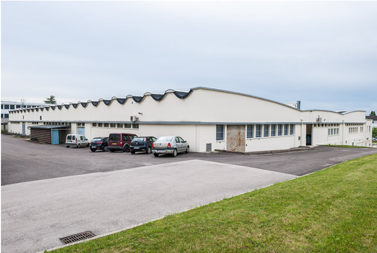
Ateliers : vue générale des façades arrière.