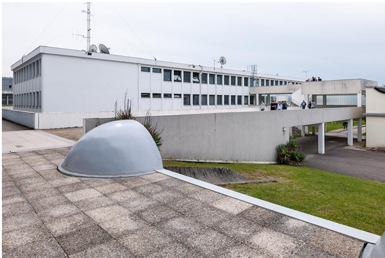
Externat : façade postérieure de l'ancien externat réaménagé.