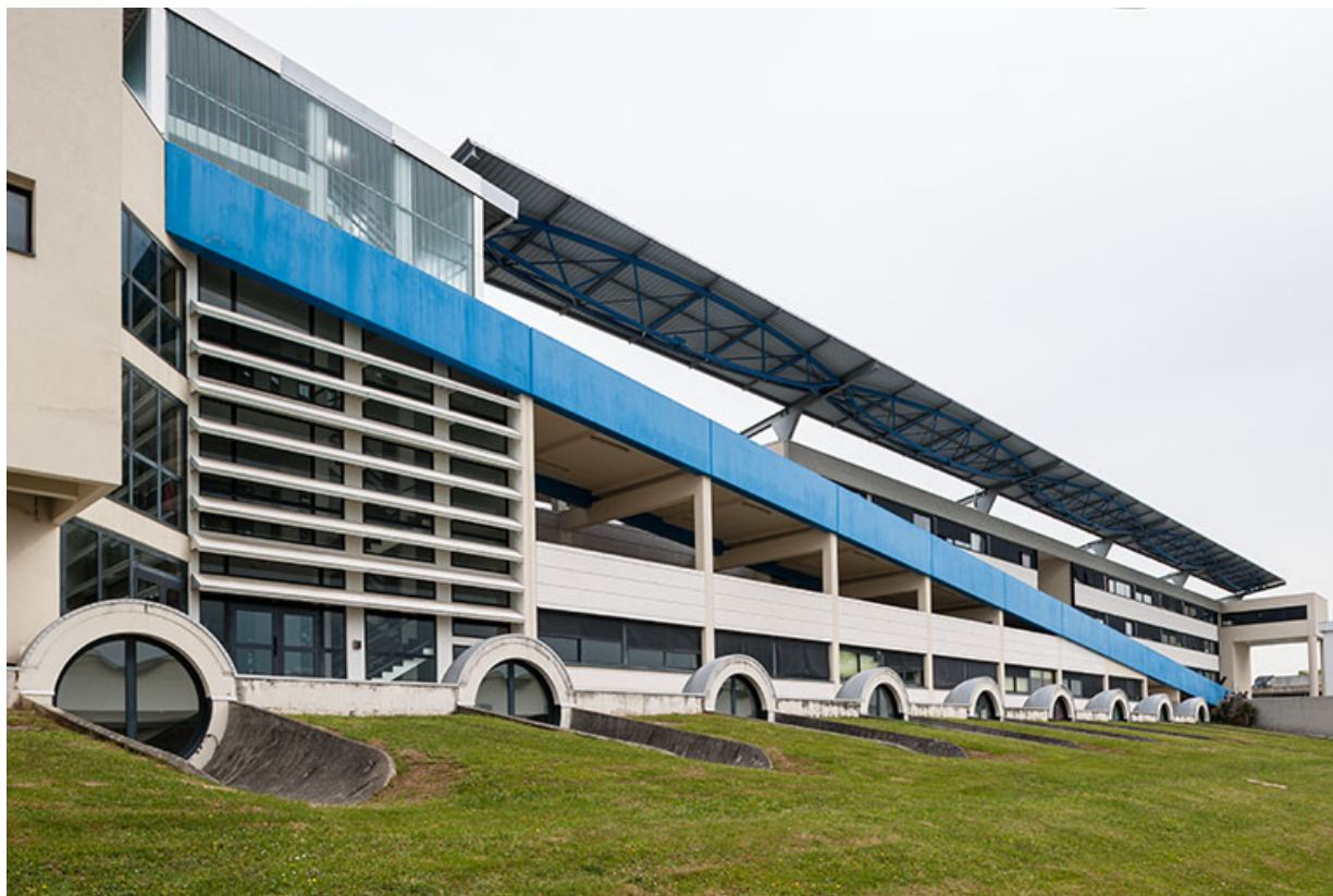
Bâtiment d'externat : façade antérieure.