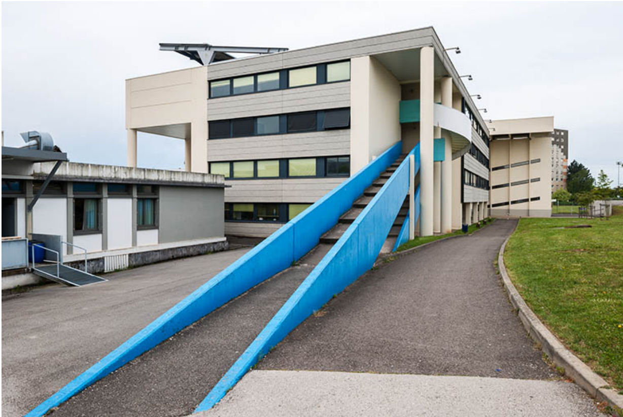
Bâtiment d'externat avec rampe d'accès.