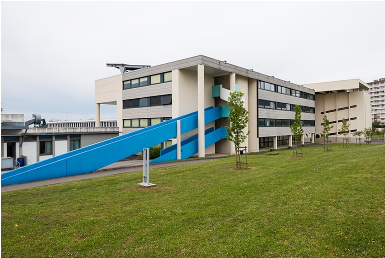
Bâtiment d'externat avec rampe : vue depuis l'espace intérieur.