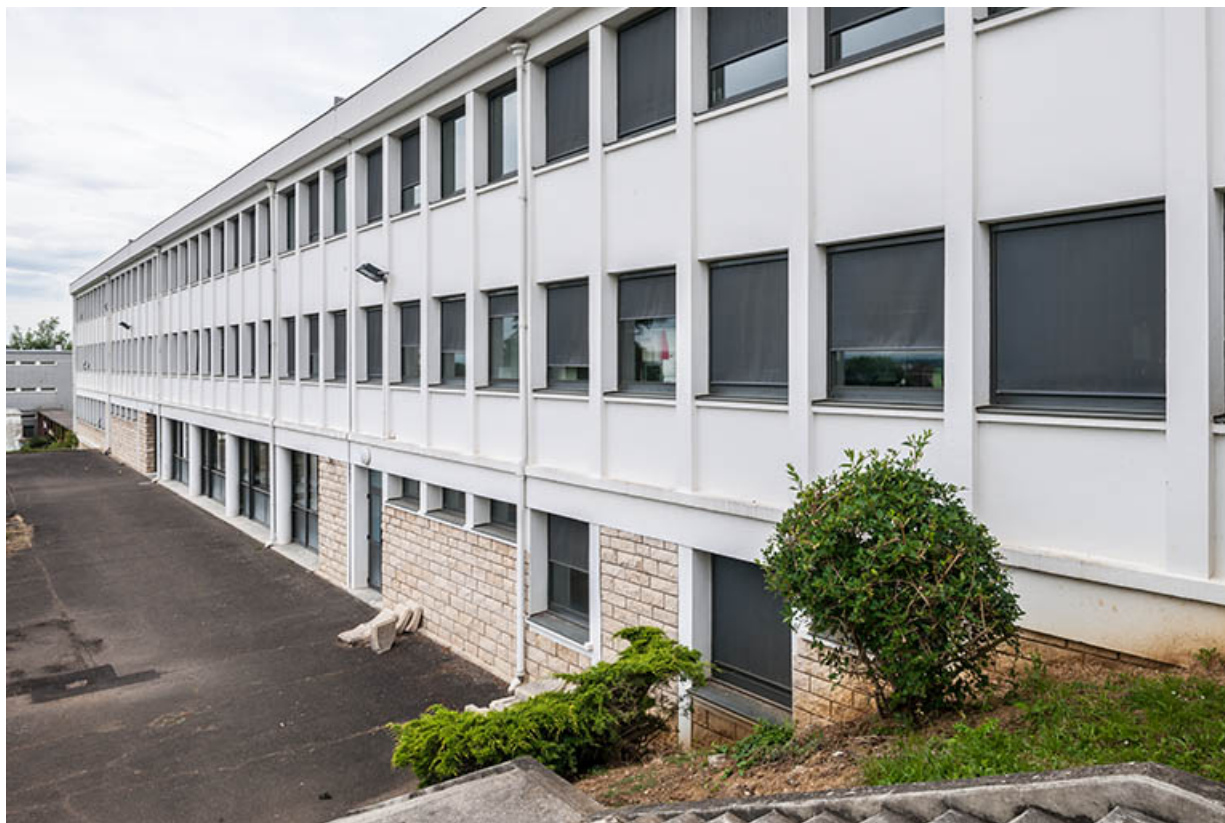
Façade antérieure de l'ancien externat.