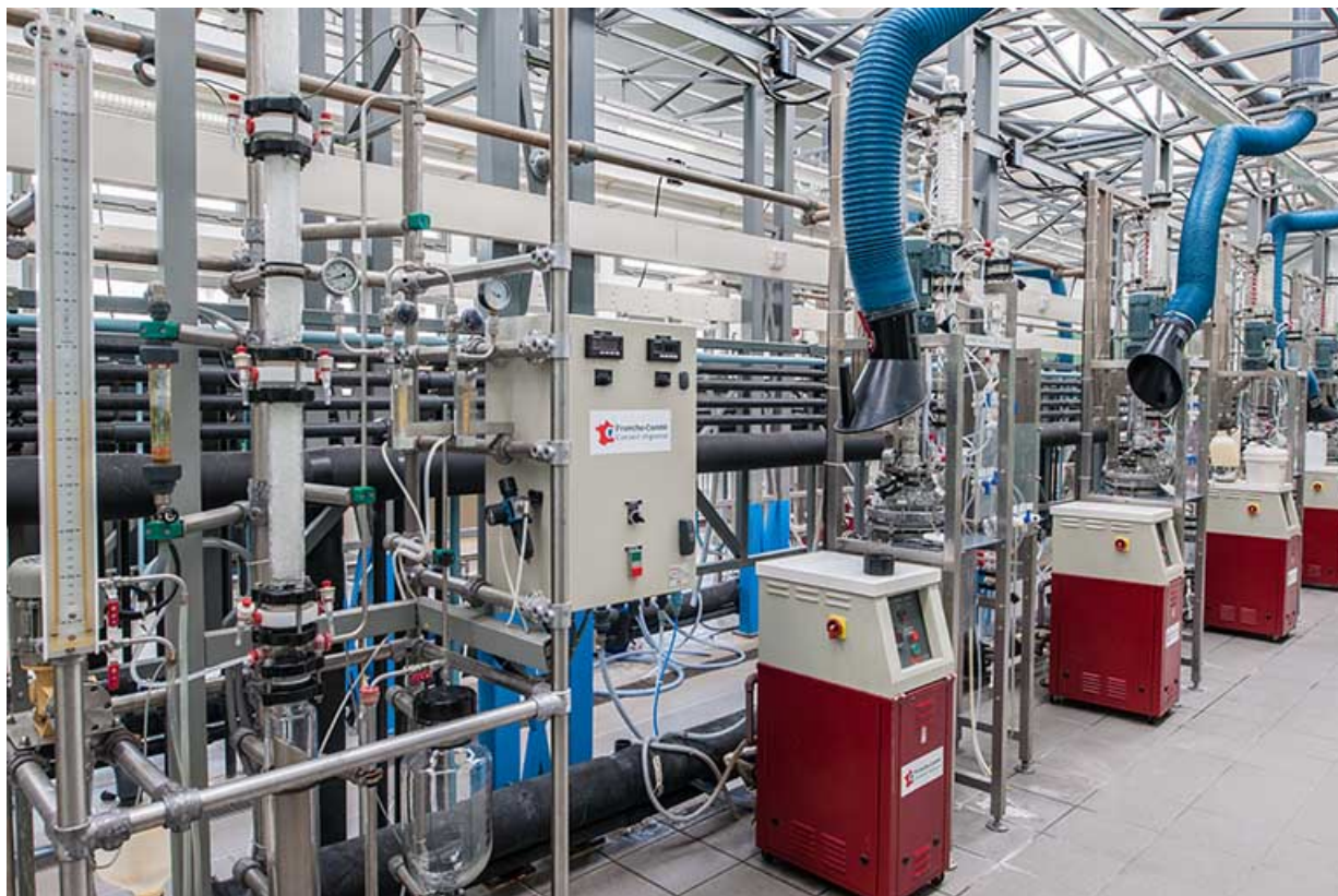
Atelier des filières technologiques et industrielles.