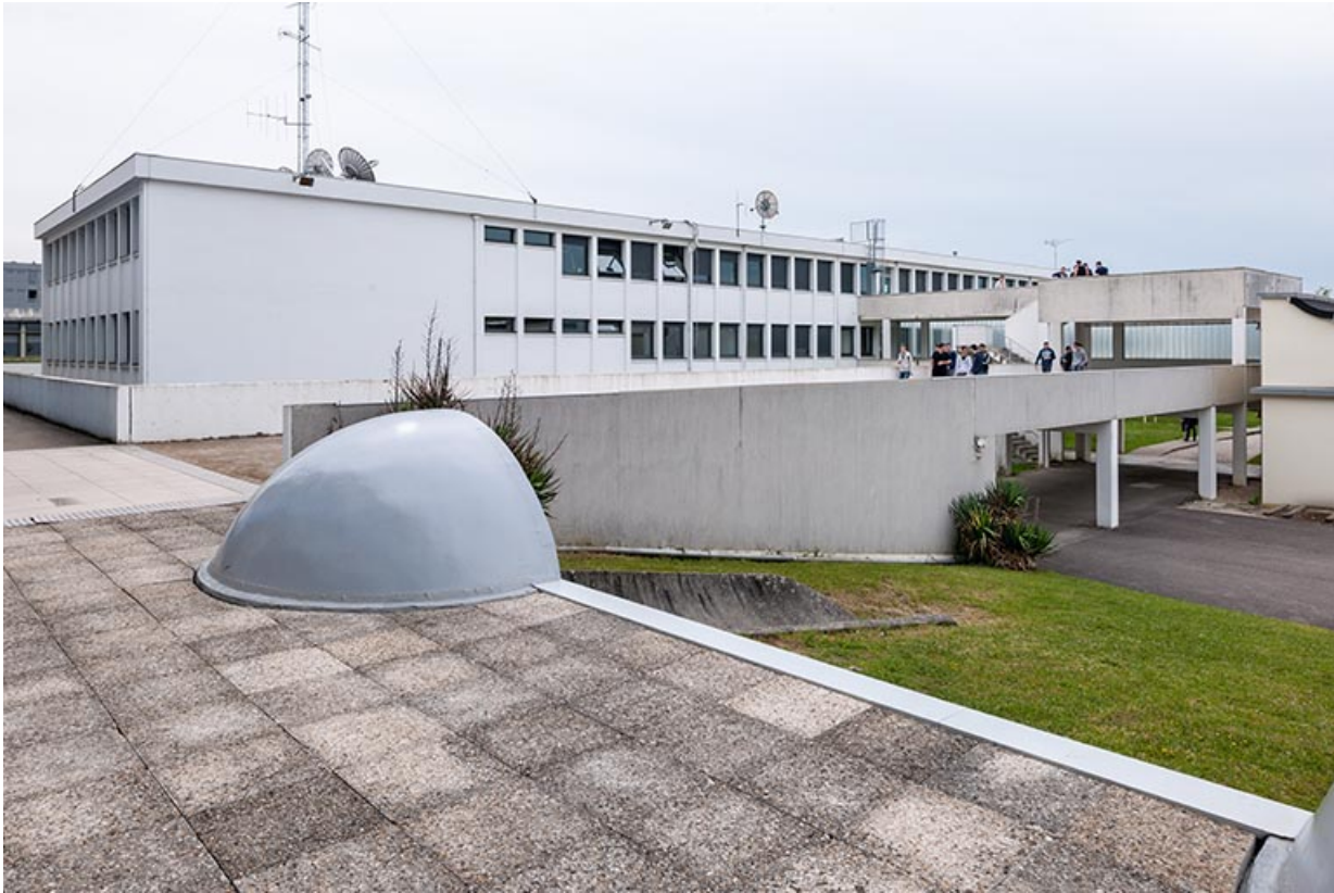
Externat : façade postérieure de l'ancien externat réaménagé.