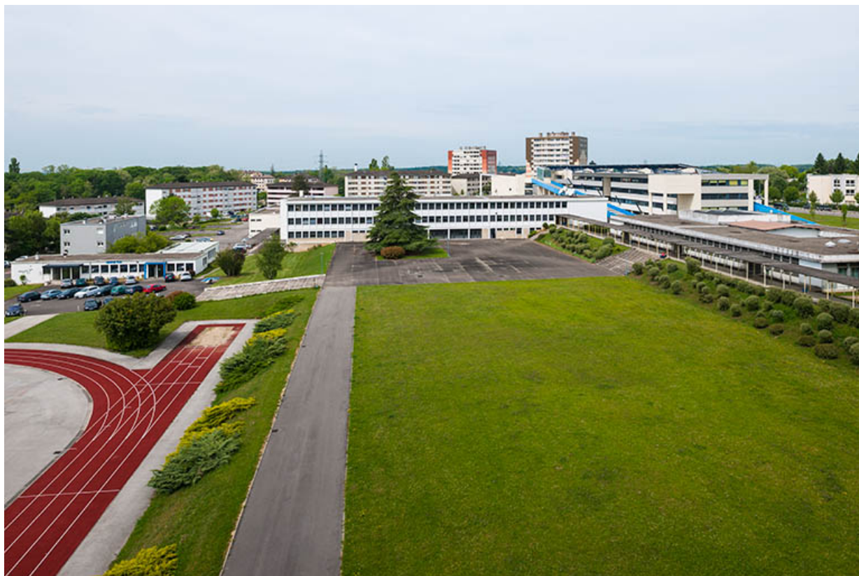
Vue générale depuis l'Est : 1er plan , installations sportives à droite locaux de restauration, au fond ancien externat et en contrebas locaux du GRETA.