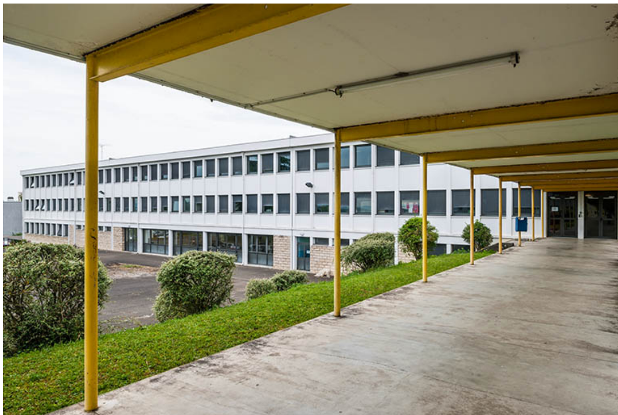
Façade antérieure de l'ancien externat vue depuis les coursives du nouveau bâtiment. 39, Dole rue Charles Laurent-Thouverey