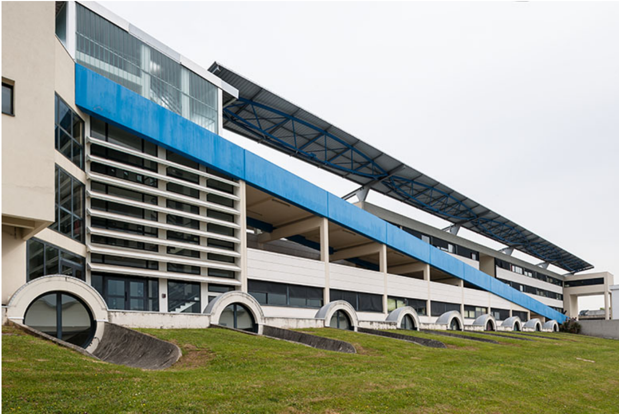
Bâtiment d'externat : façade antérieure.