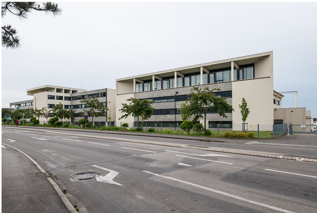
Vue générale des bâtiments d'externat depuis la rue Charles-Laurent Thouverey.