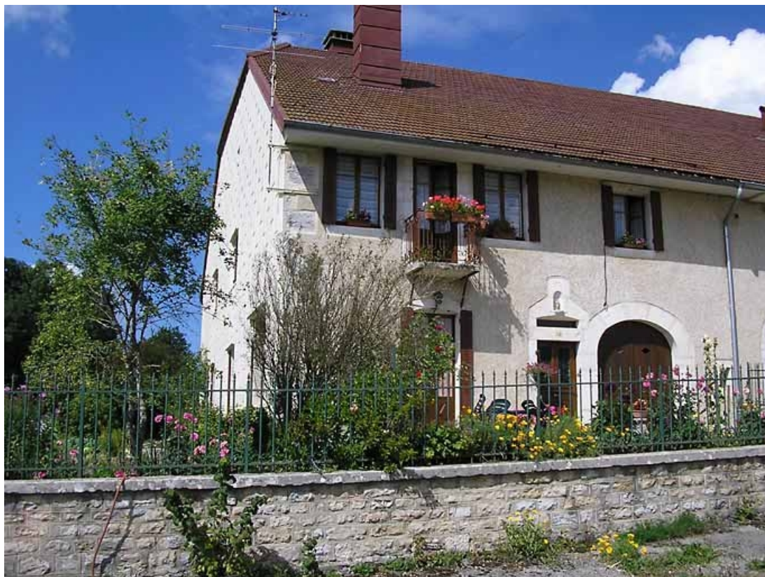
Vue latérale de la façade antérieure et d'une partie du pignon sud-ouest.

39, La Chaumusse, 52 route de Saint-Pierre