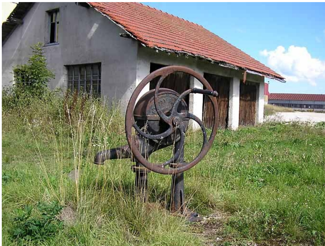
Vue générale. 39, Saint-Pierre