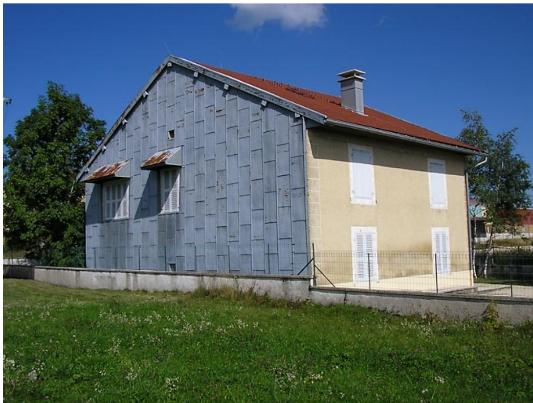
Pignon sud-ouest et façade latérale vus de trois quarts. 39, Saint-Pierre