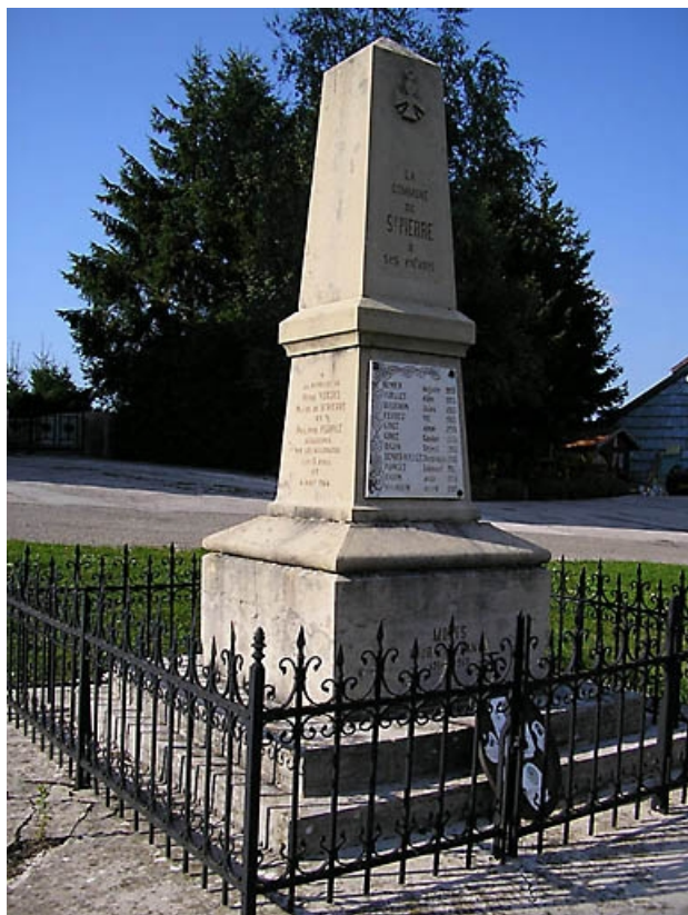
Vue générale. 39, Saint-Pierre