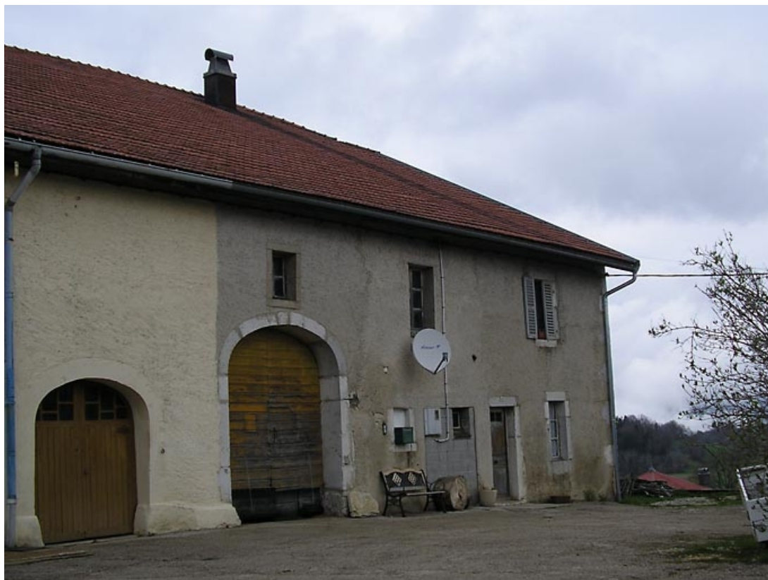
Vue de trois quarts de la façade antérieure.

39, Lac-des-Rouges-Truites C.D. 437 154, lieudit : les Thévenins