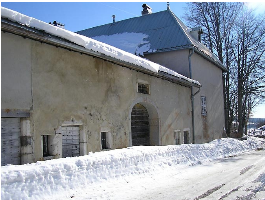
Façade antérieure vue de trois quarts.