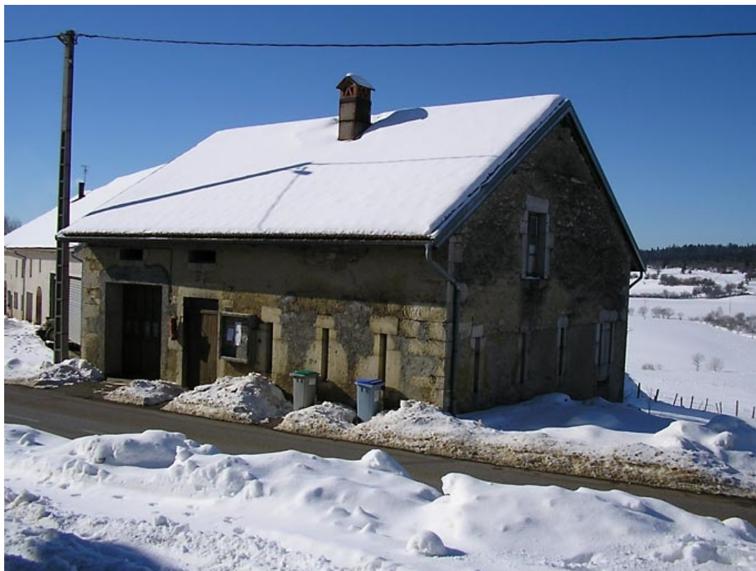
Pignon nord et façade antérieure vus de trois quarts. 39, Grande-Rivière