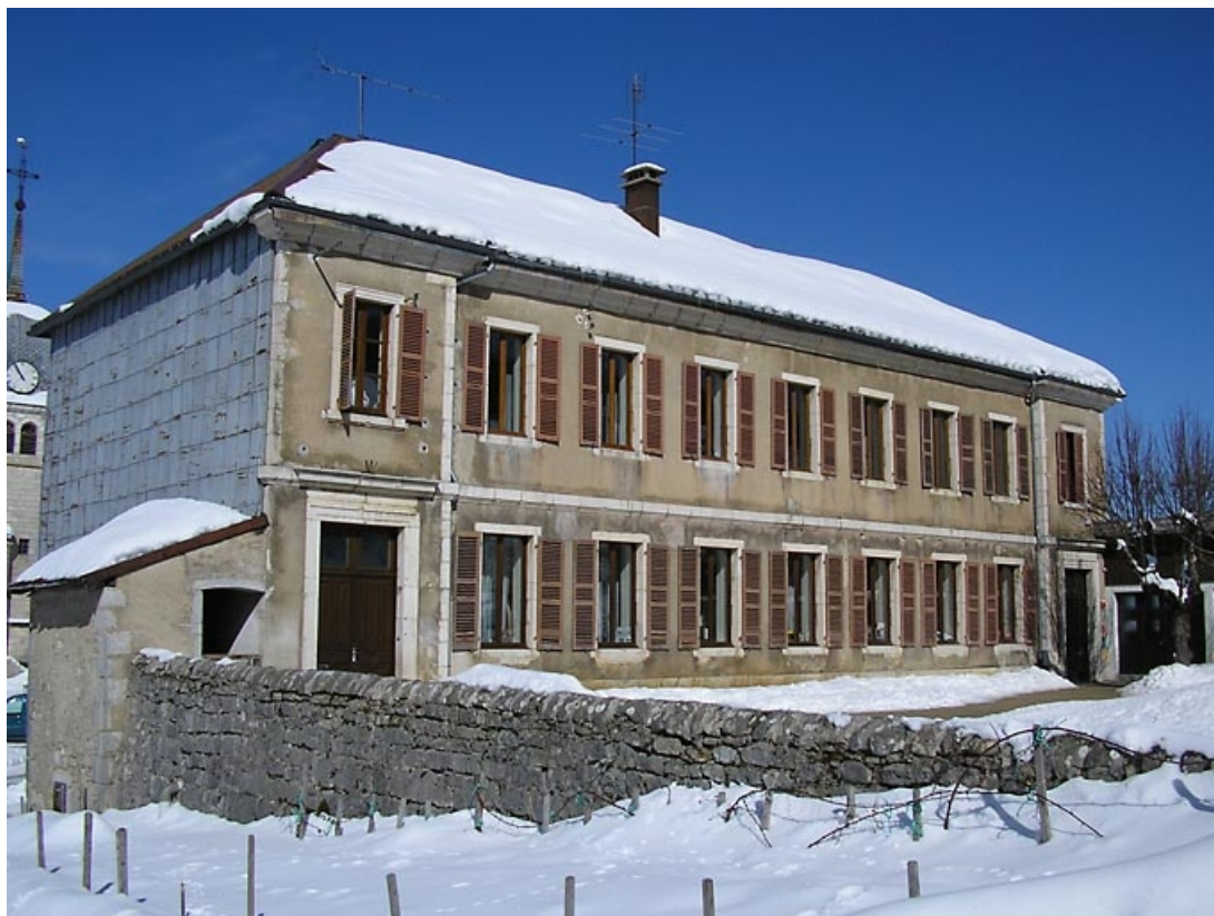
Façade antérieure et pignon sud-ouest vus de trois quarts. 39, Grande-Rivière C.D. 437 5, lieudit : l' Abbaye en Grandvaux