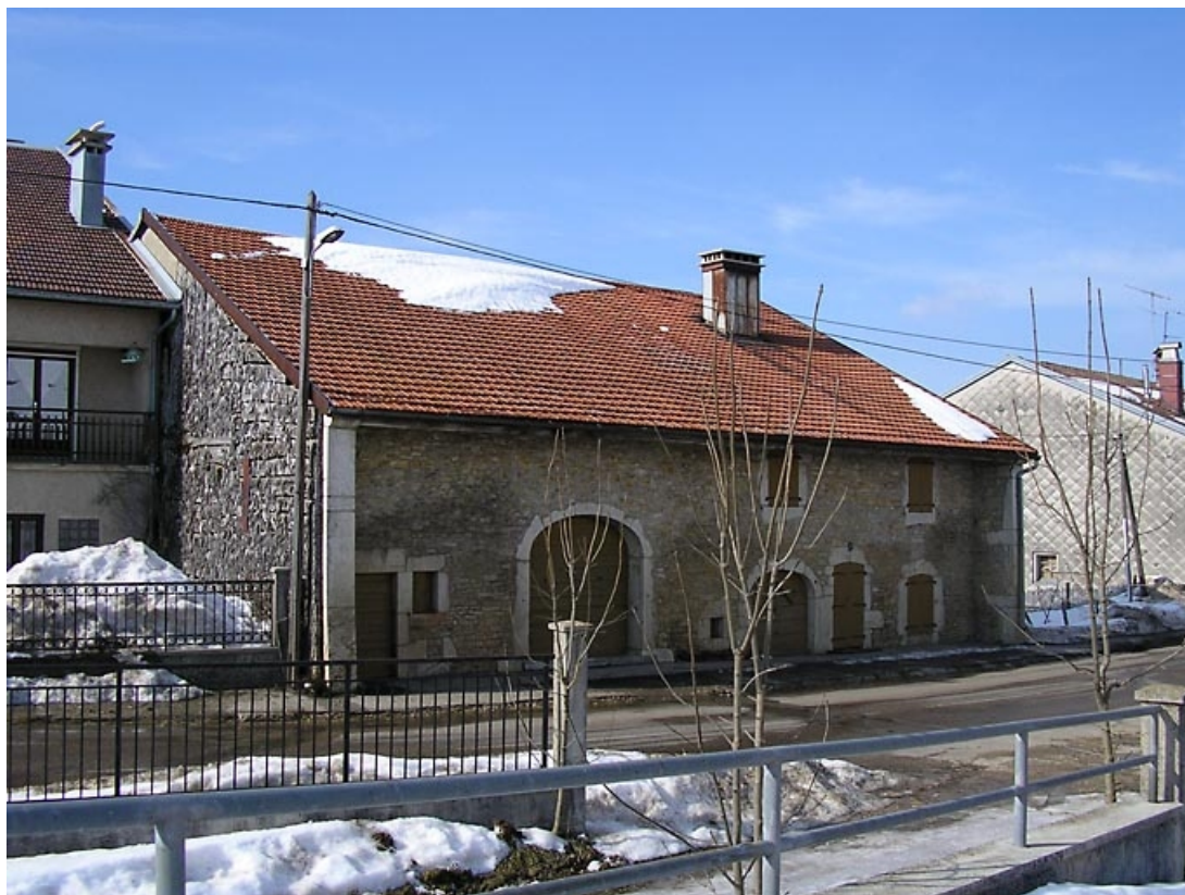
Façade antérieure et pignon sud-ouest vus de trois quarts.

39, Grande-Rivière C.D. 437 20, lieudit : les Chauvins