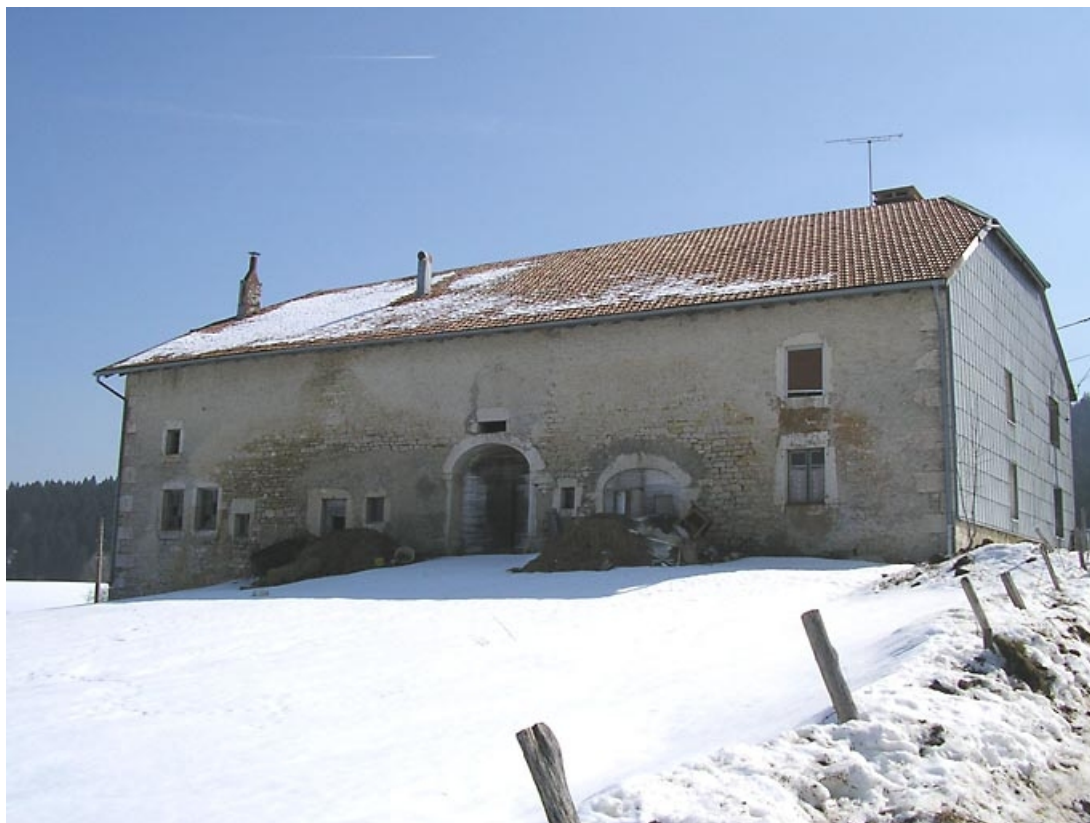
Façade postérieure et pignon sud-ouest vus de trois quarts. 39, Grande-Rivière