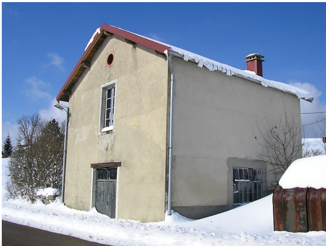
Façade postérieure et pignon sud-ouest vus de trois quarts.

39, Grande-Rivière C.D. 146 14, lieudit : les Farrods