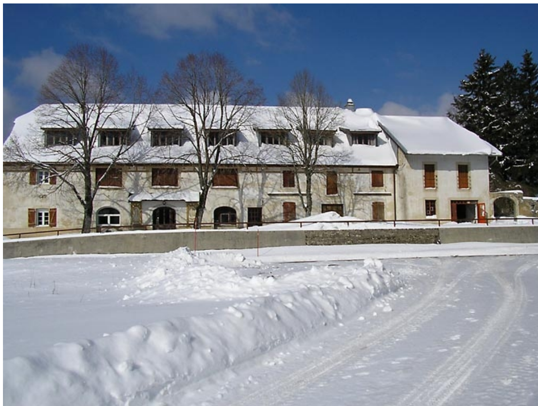
Façade antérieure. 39, Grande-Rivière