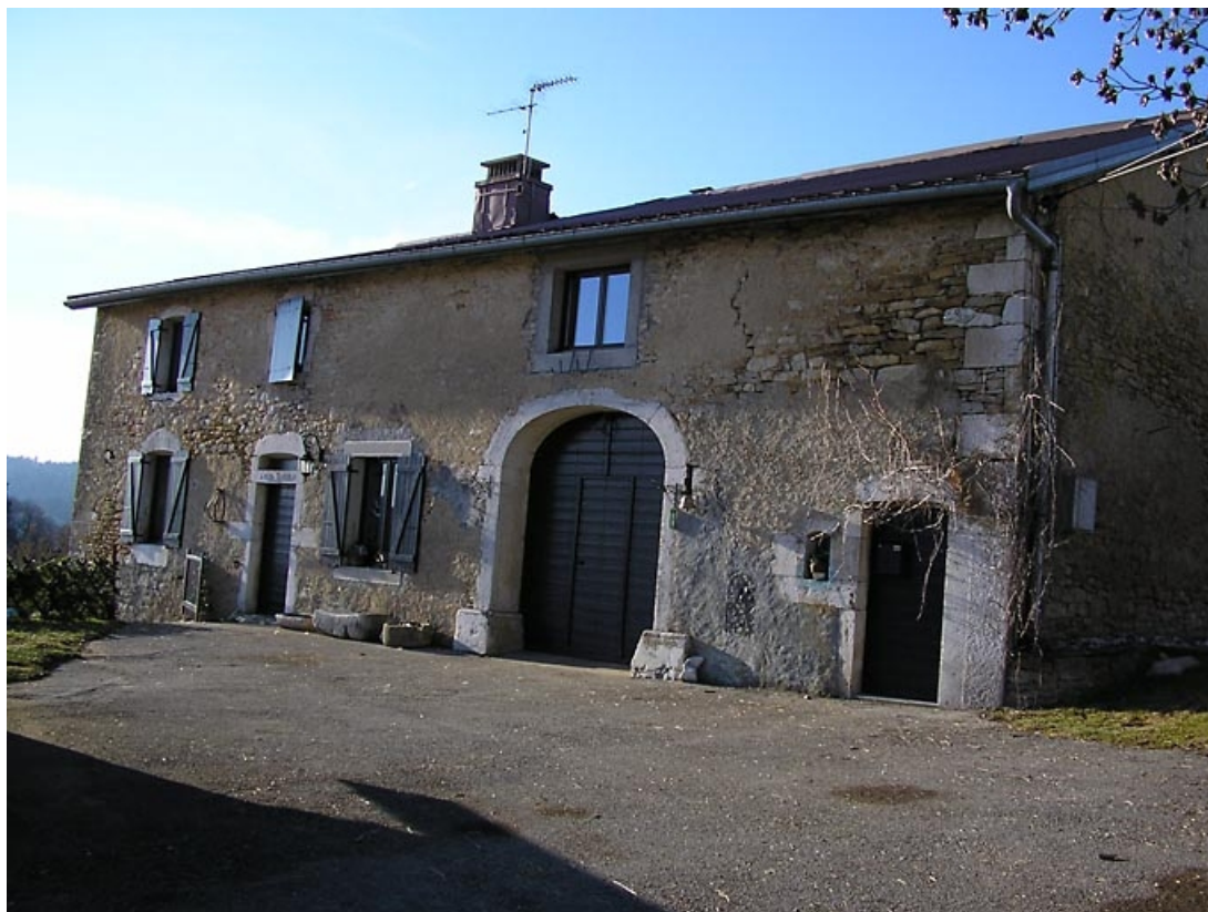
Façade antérieure vue de trois quarts.