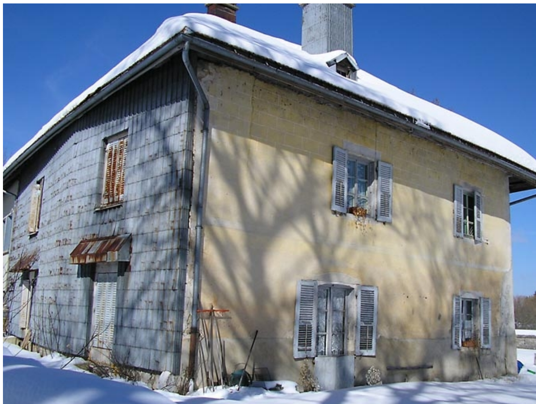
Façade latérale et pignon sud-ouest vus de trois quarts. 39, Grande-Rivière C.D. 437, lieudit : l' Abbaye en Grandvaux