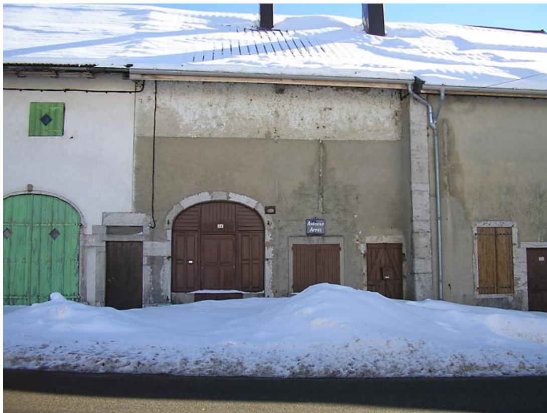
Façade antérieure. 39, Grande-Rivière