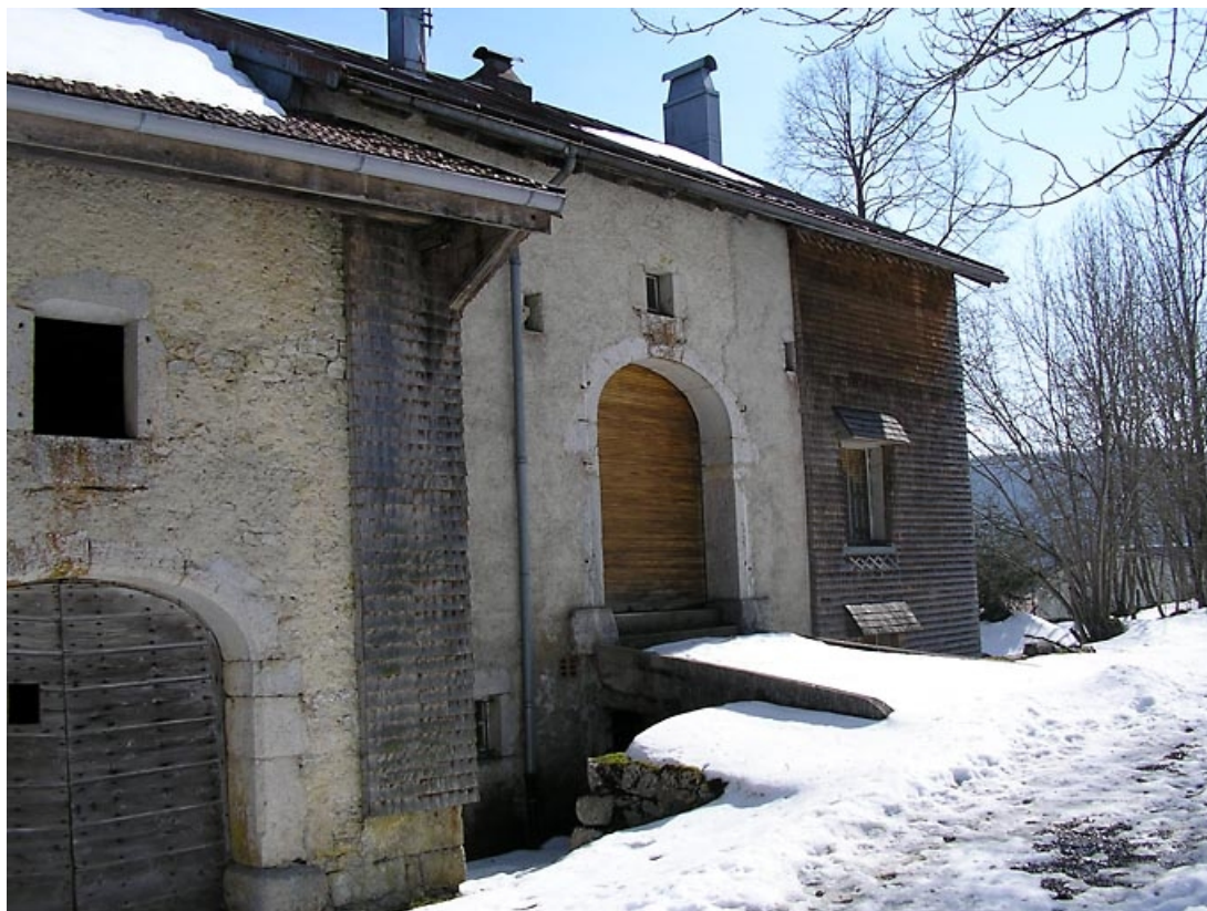
Façade postérieure et pont de grange vus de trois quarts.

39, Grande-Rivière chemin rural des Poncets, lieudit : les Jeannez