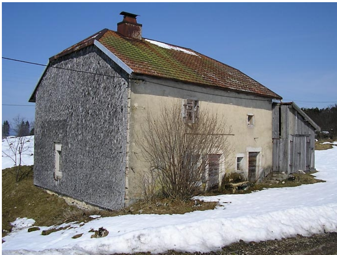
Pignon sud-ouest, façade antérieure et remise vus de trois quarts.

39, Grande-Rivière C.D. 344 21, lieudit : les Mussillons