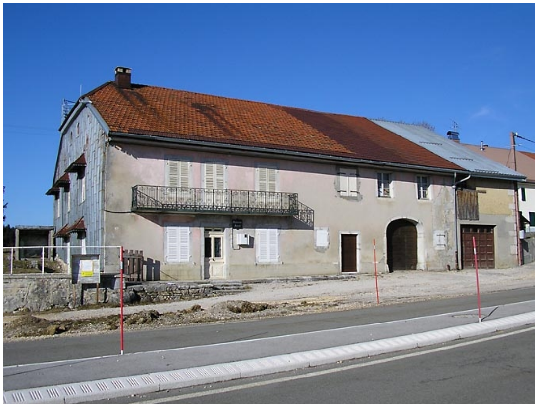
Façade antérieure et pignon sud-ouest vus de trois quarts.

39, Grande-Rivière R.D. 146 10, lieudit : les Faivres