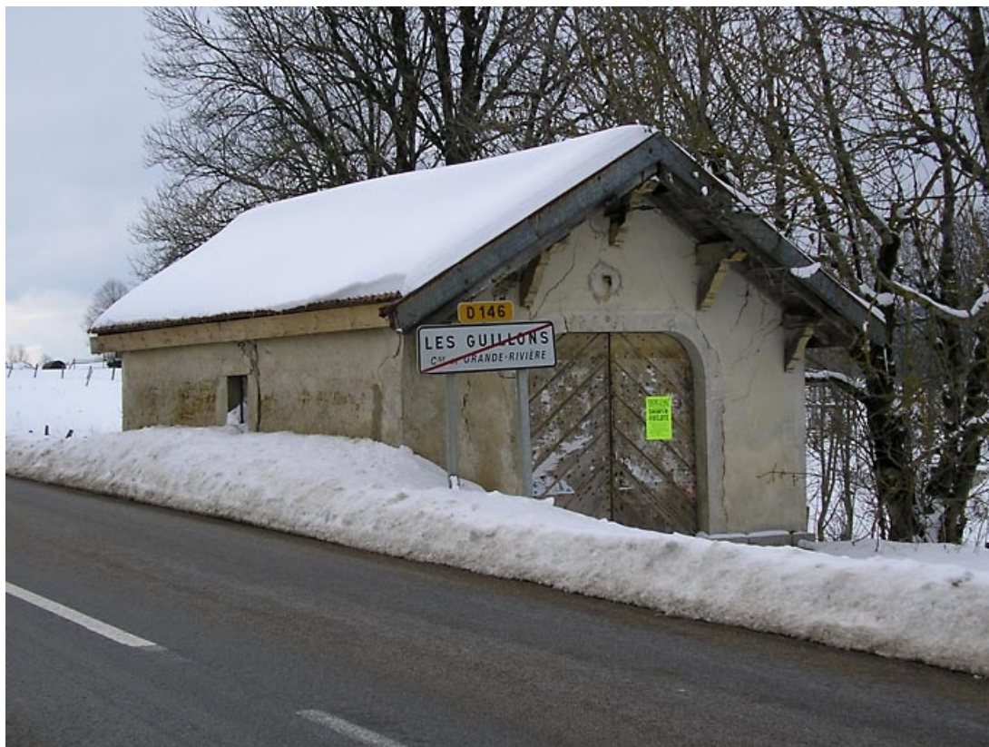
Entrée et façade latérale vues de trois quarts. 39, Grande-Rivière C.D. 146, lieudit : les Guillons