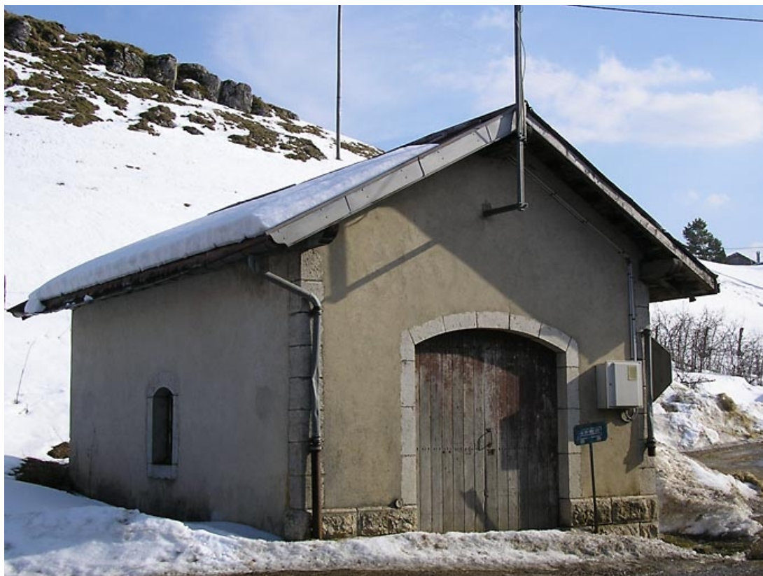
Entrée et façade latérale vues de trois quarts.