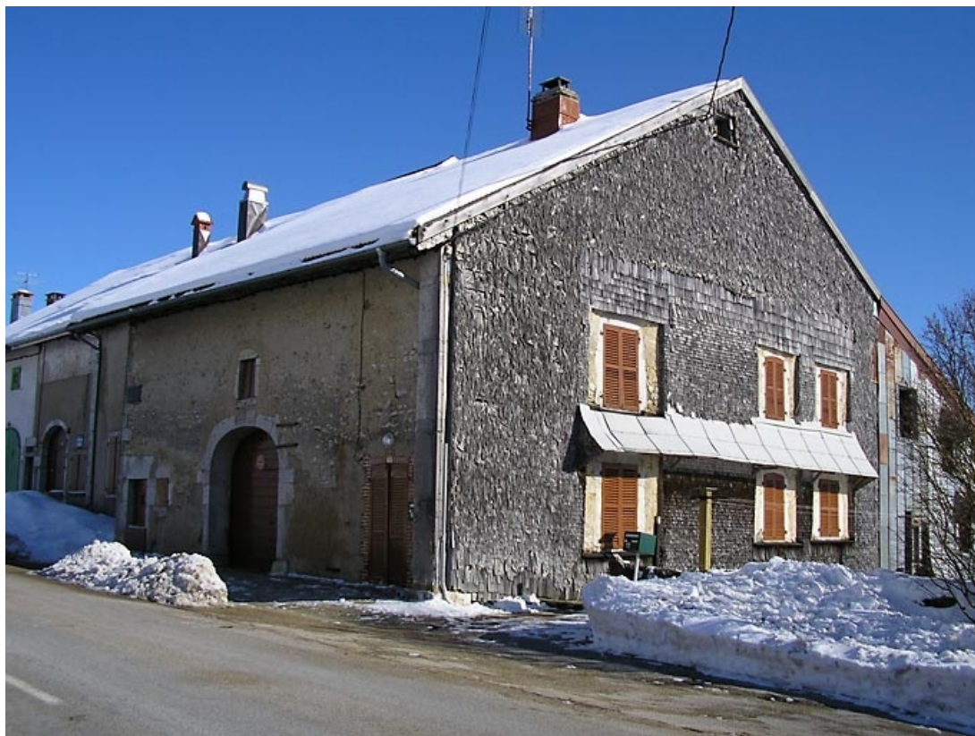
Pignon sud-ouest et façade antérieure vus de trois quarts.

39, Grande-Rivière C.D. 146 16, lieudit : les Bez