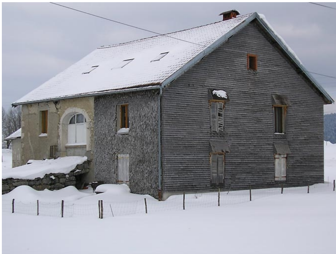
Pignon sud-ouest et façade postérieure vus de trois quarts.

39, Grande-Rivière C.D. 146 11, lieudit : les Bouviers