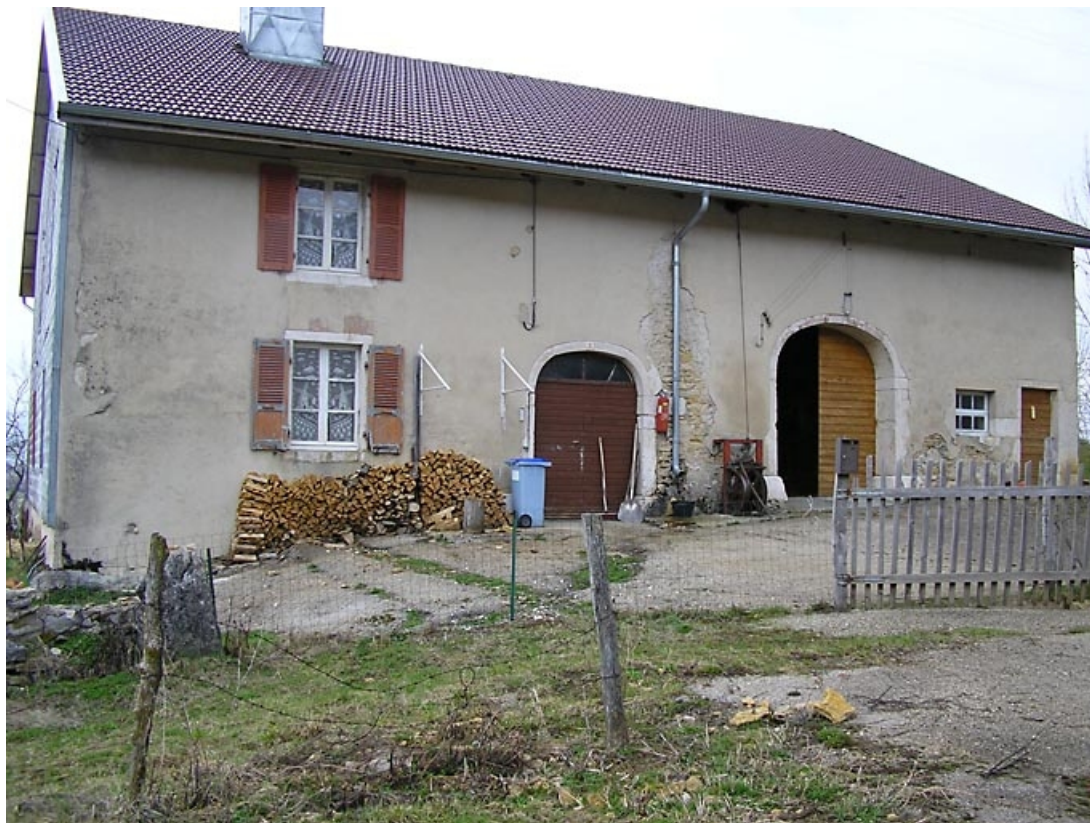
Façade antérieure et une partie du pignon sud-ouest vues de trois quarts. 39, Grande-Rivière