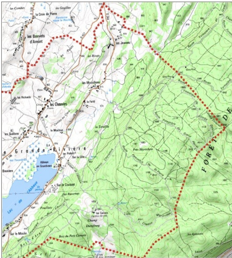
Carte des limites de la commune, partie est. Extrait de la carte IGN, échelle 1/25 000 ; SCAN 25 (c) IGN - 2008, Licence n° 2008CISE29-68.