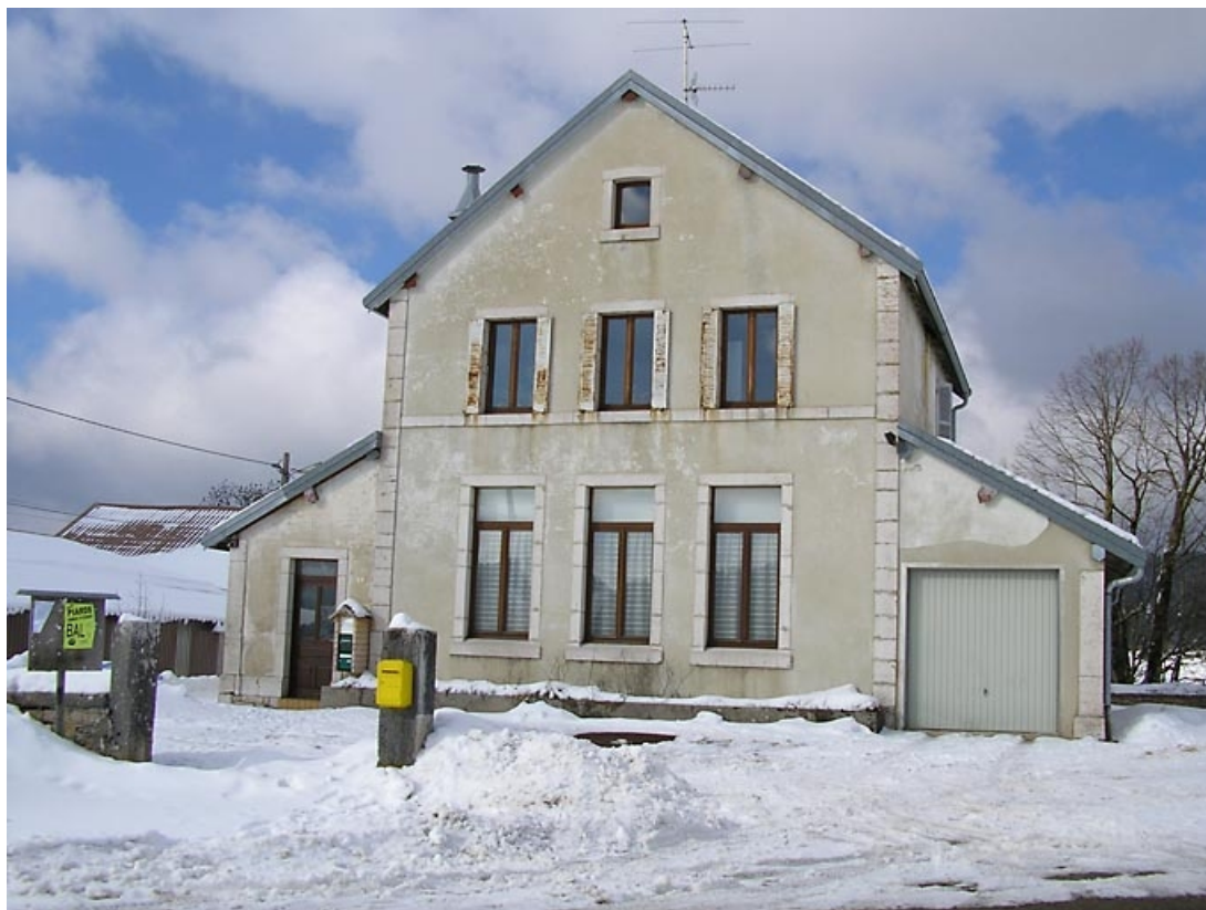
Façade antérieure. 39, Grande-Rivière