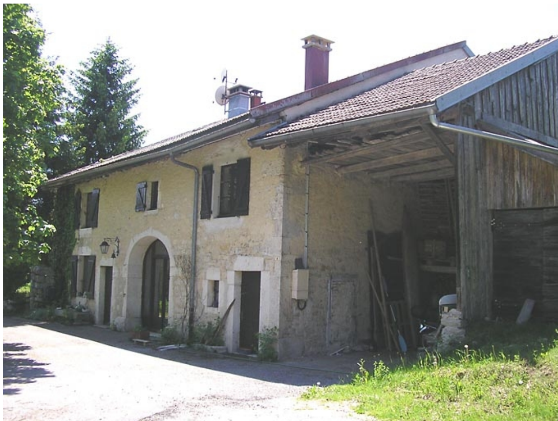
Façade antérieure et séchoir à bois vus de trois quarts. 39, Grande-Rivière