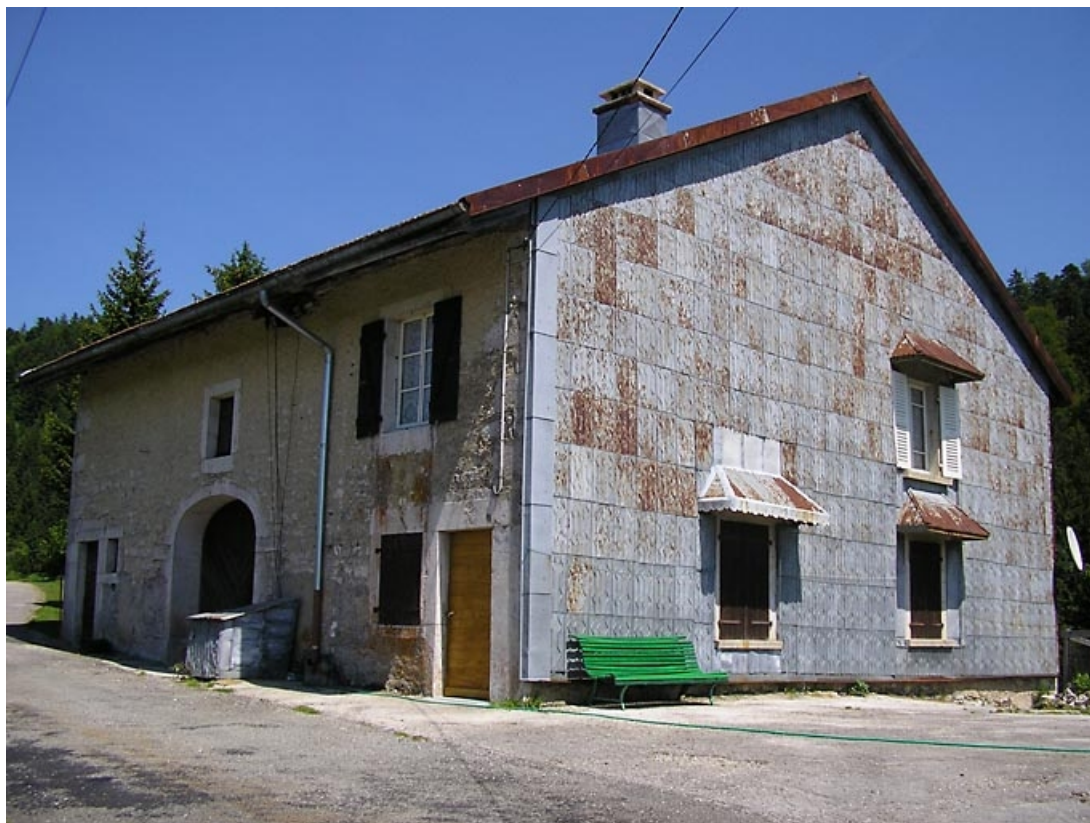
Pignon sud-ouest et façade antérieure vus de trois quarts.

39, Grande-Rivière, 3 l' Arête, lieudit : l' Arête