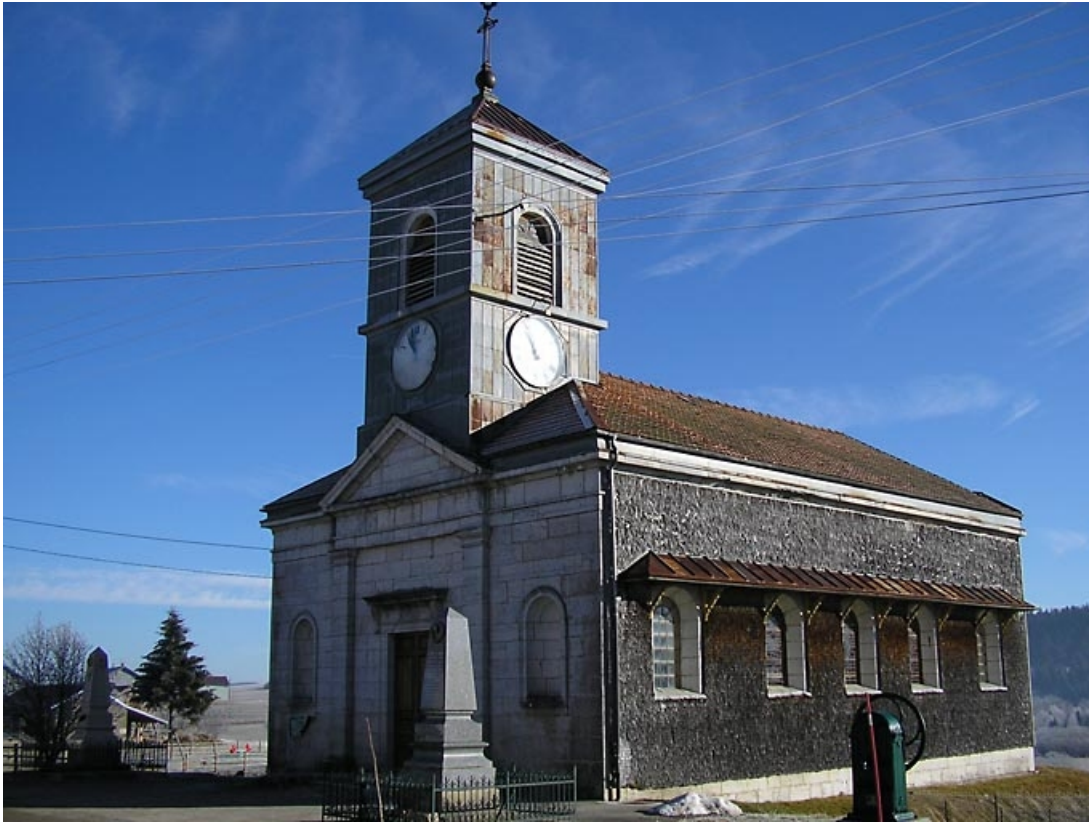
vue de trois quarts de l'édifice.