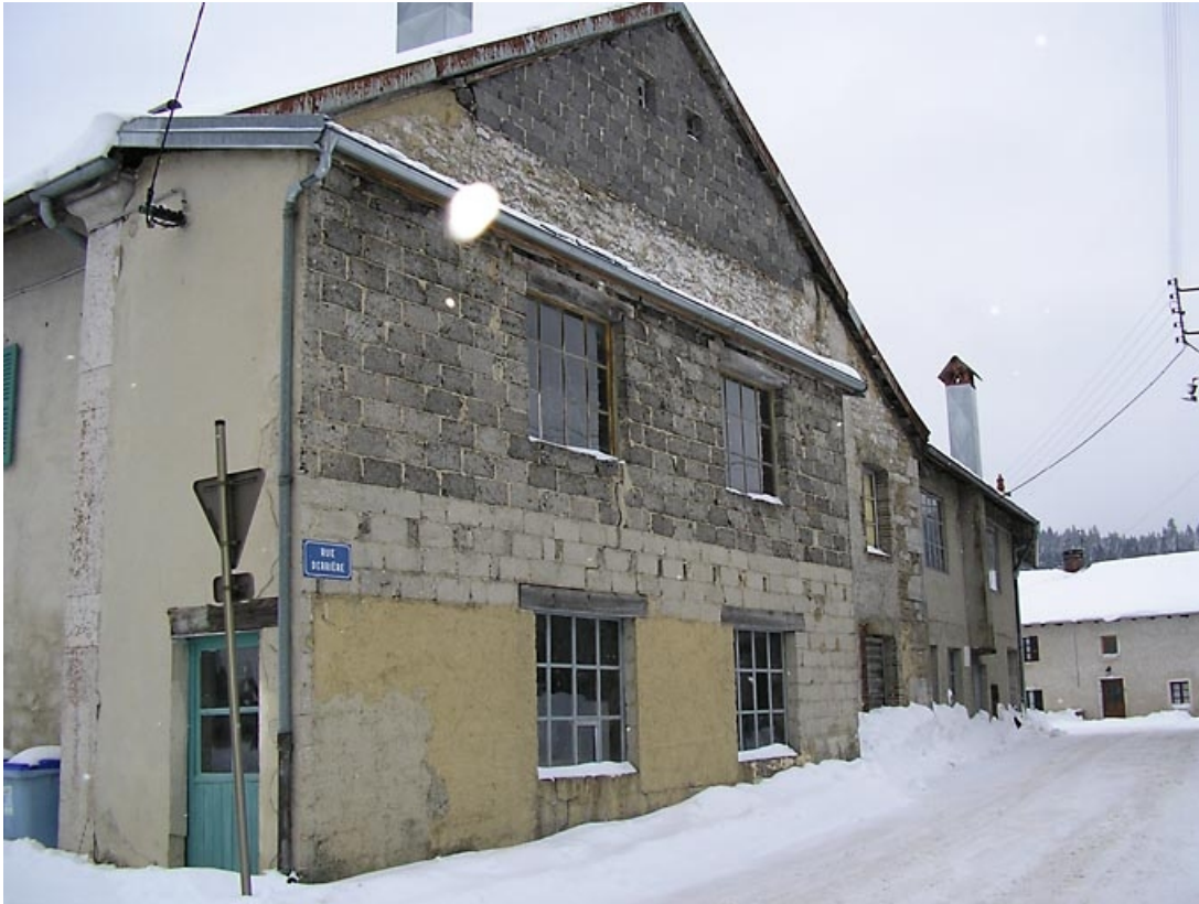
Façade latérale vue de trois quarts.