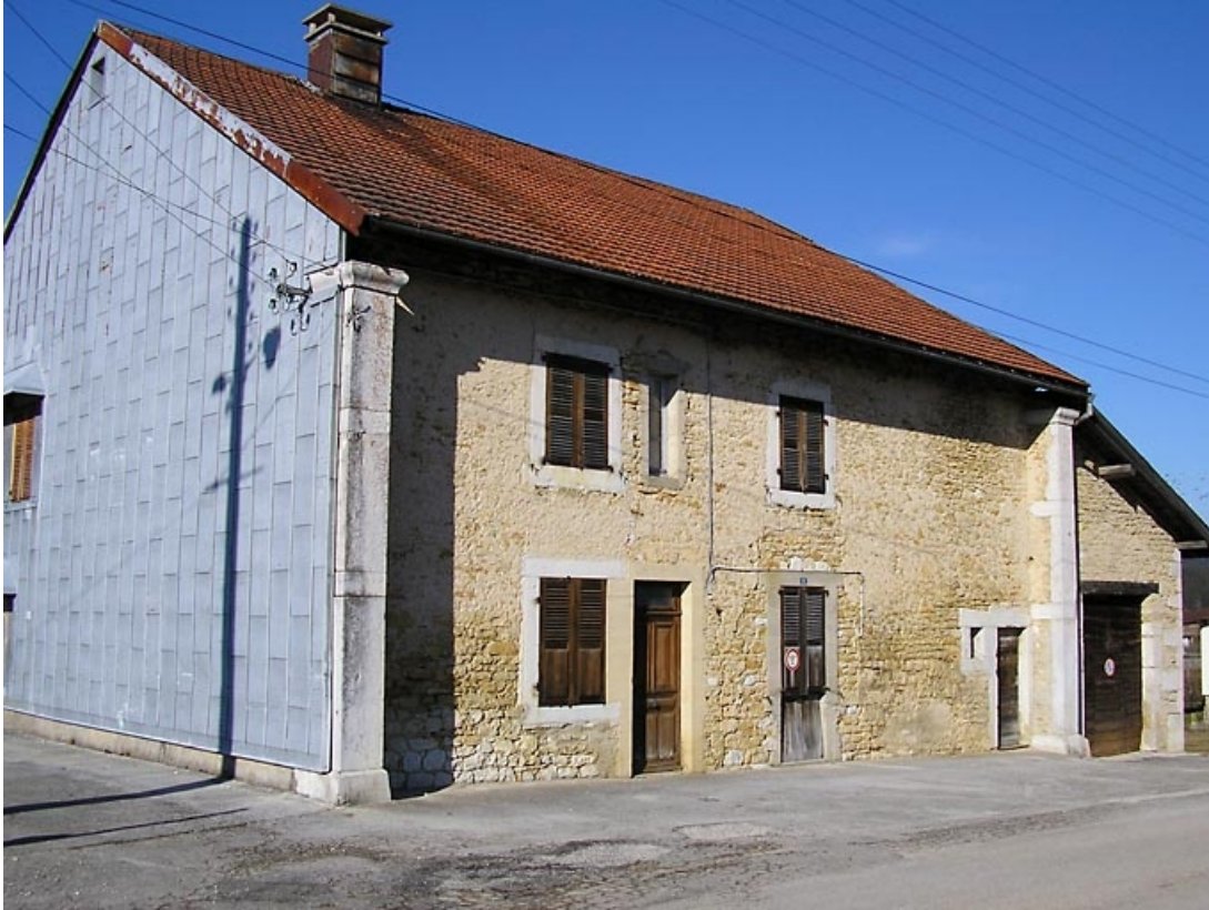
Façade antérieure et pignon sud-ouest vus de trois quarts.

39, Chaux-des-Prés, 6 chemin communal du Culoche, lieudit : les Chaumiers