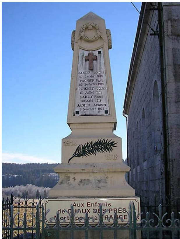
Vue de la partie du monument dédié à 1914-1918.