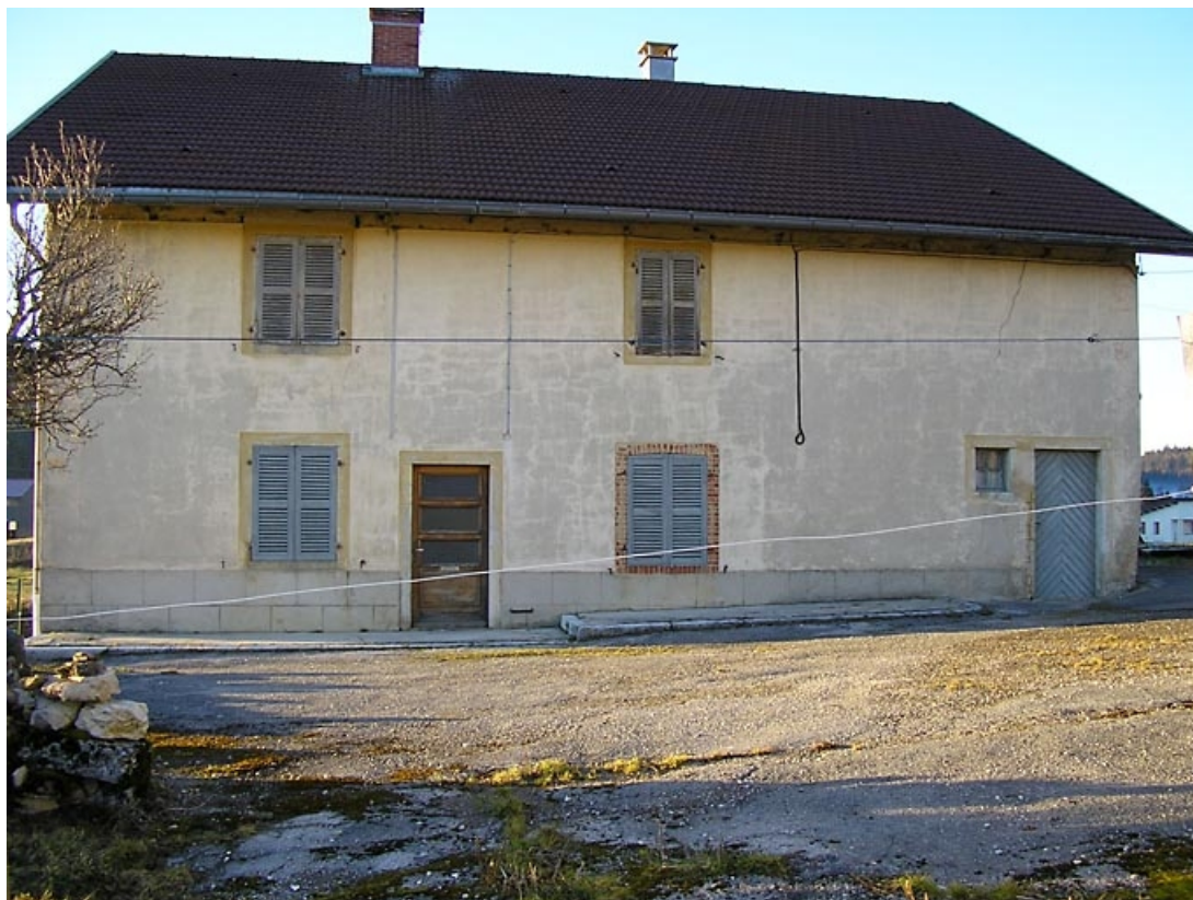
Façade antérieure. 39, Chaux-des-Prés