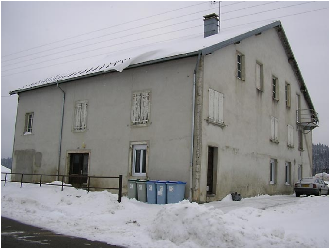
Façade antérieure et pignon sud-ouest vus de trois quarts.