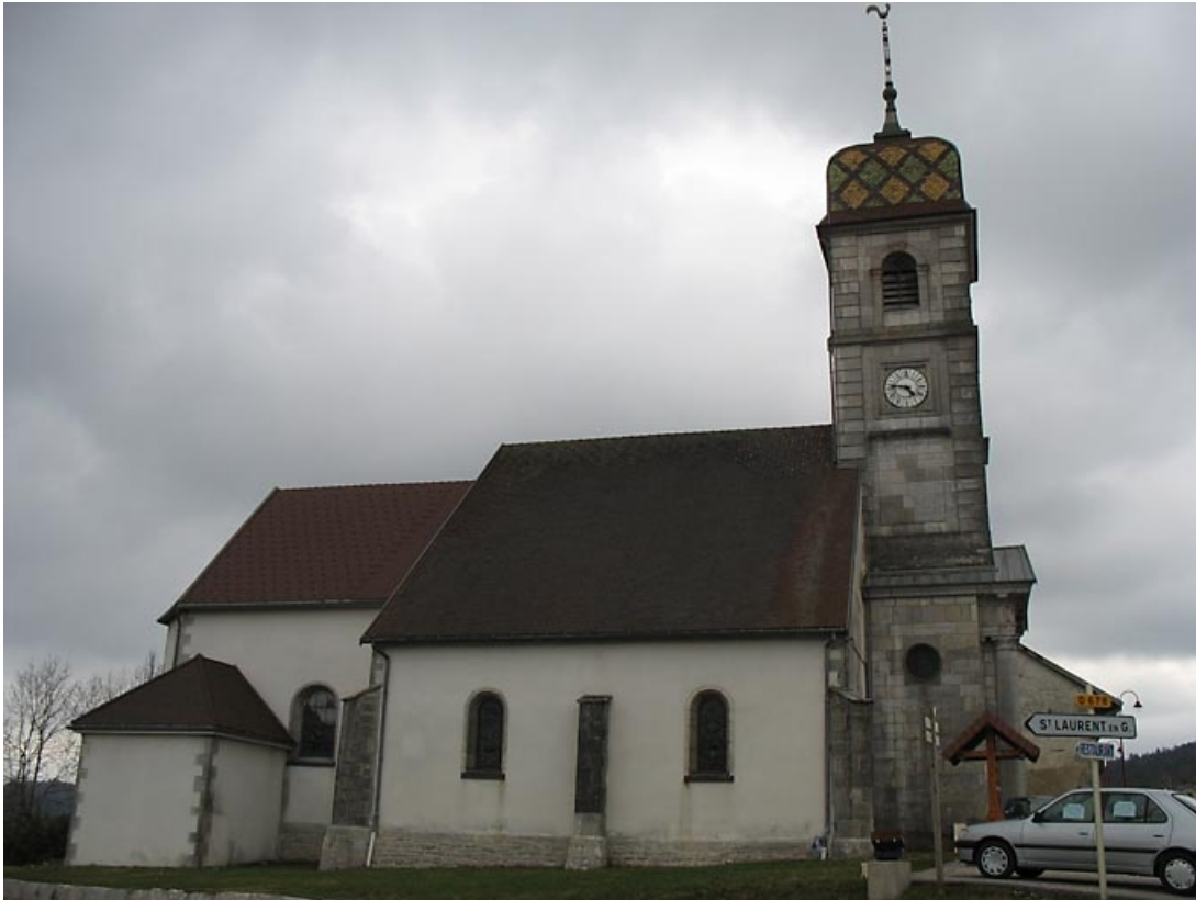
Vue générale sur la façade latérale et le clocher.