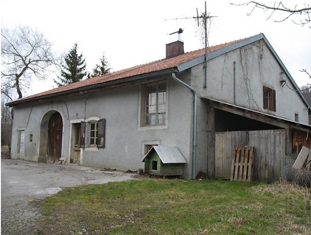
Façade antérieure vue de trois quarts.

39, La Chaux-du-Dombief, 6 rue de la Boissière, lieudit : la Boissière