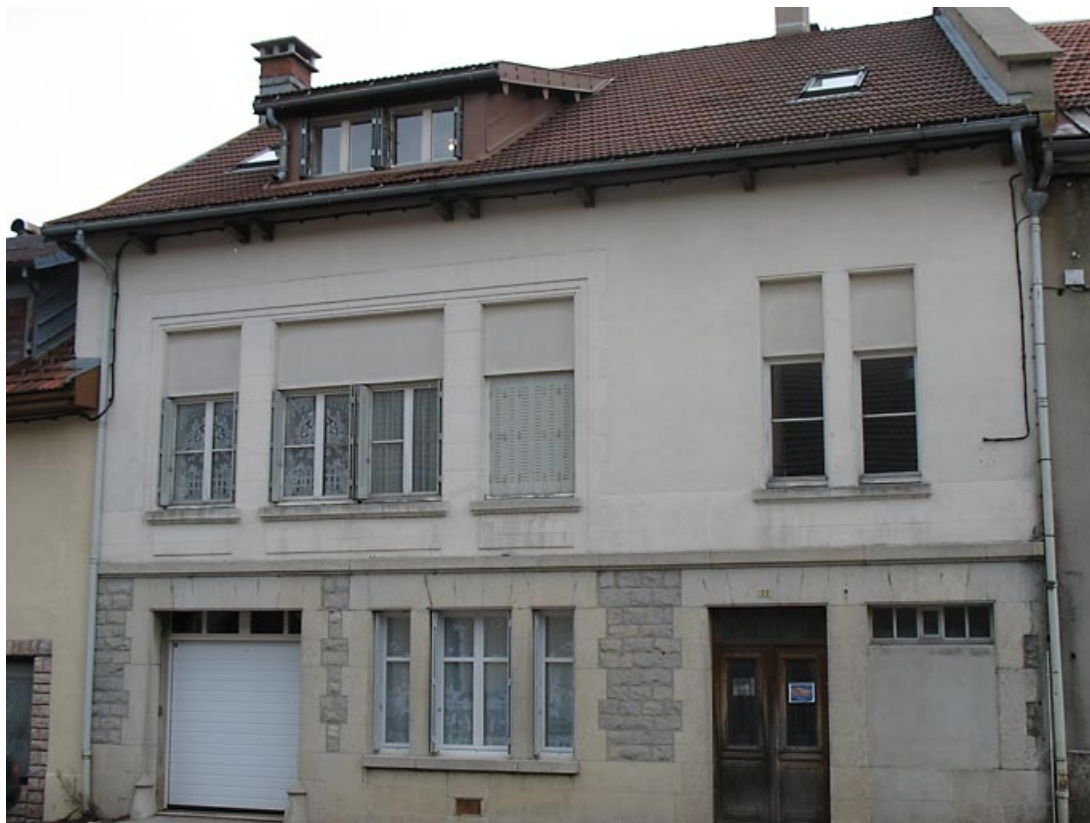
Vue générale de la façade antérieure.

39, La Chaux-du-Dombief, 22 rue des Saillards