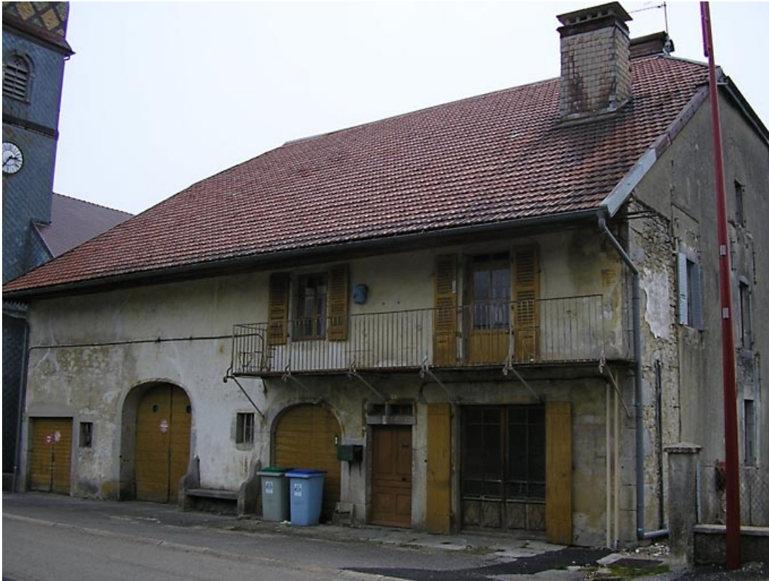
Vue de trois quarts sur façade antérieure.