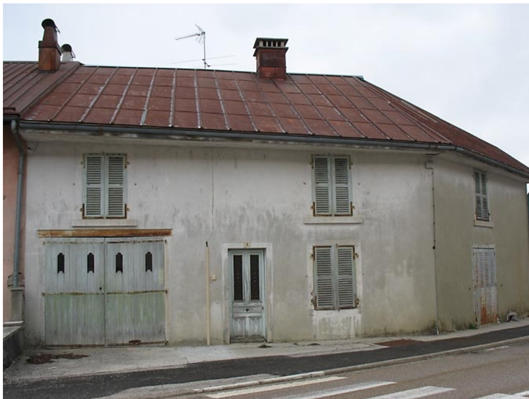
Vue générale de la façade antérieure.

39, La Chaux-du-Dombief, 2 rue des Saillards