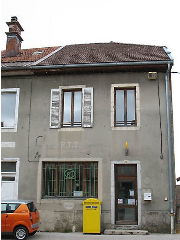
Vue générale de la façade antérieure.