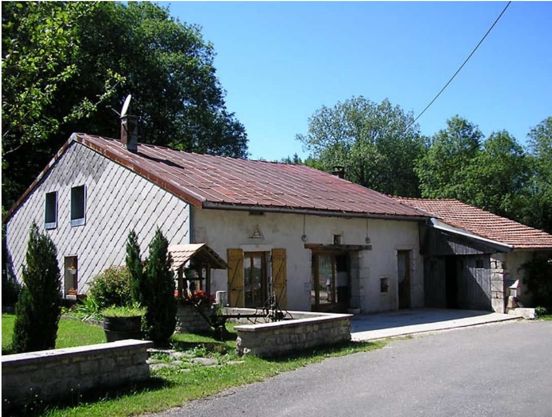
Façade antérieure et pignon essenté vus de trois quarts. 39, La Chaux-du-Dombief