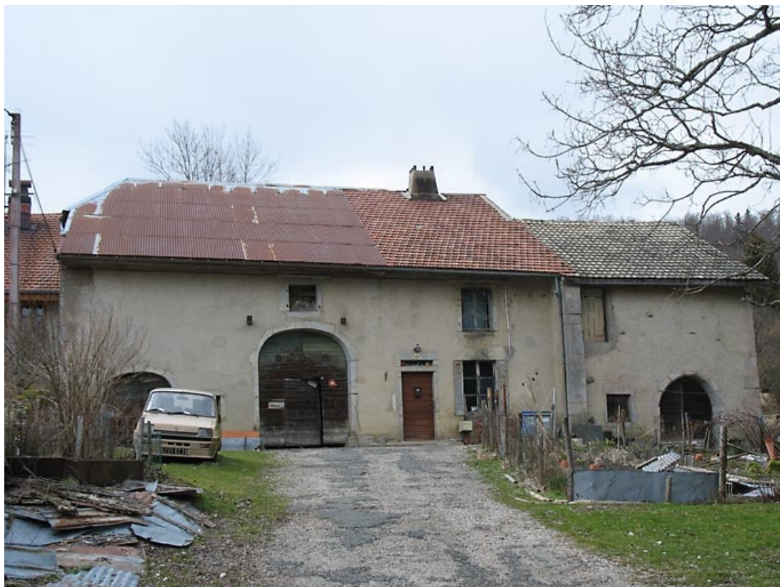
Vue générale de la façade antérieure.

39, La Chaux-du-Dombief, 5 chemin de la Boissière, lieudit : la Boissière