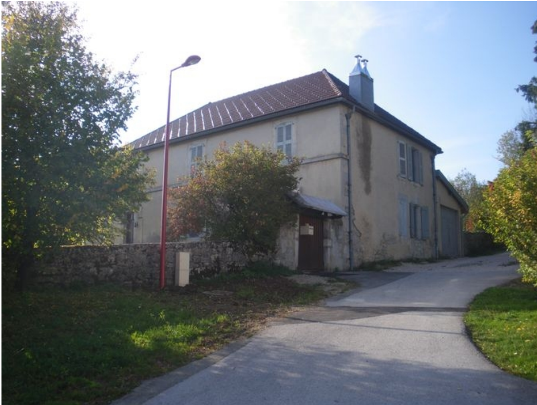
Façade et pignon sur rue.

39, La Chaux-du-Dombief, 1 allée des Sapins