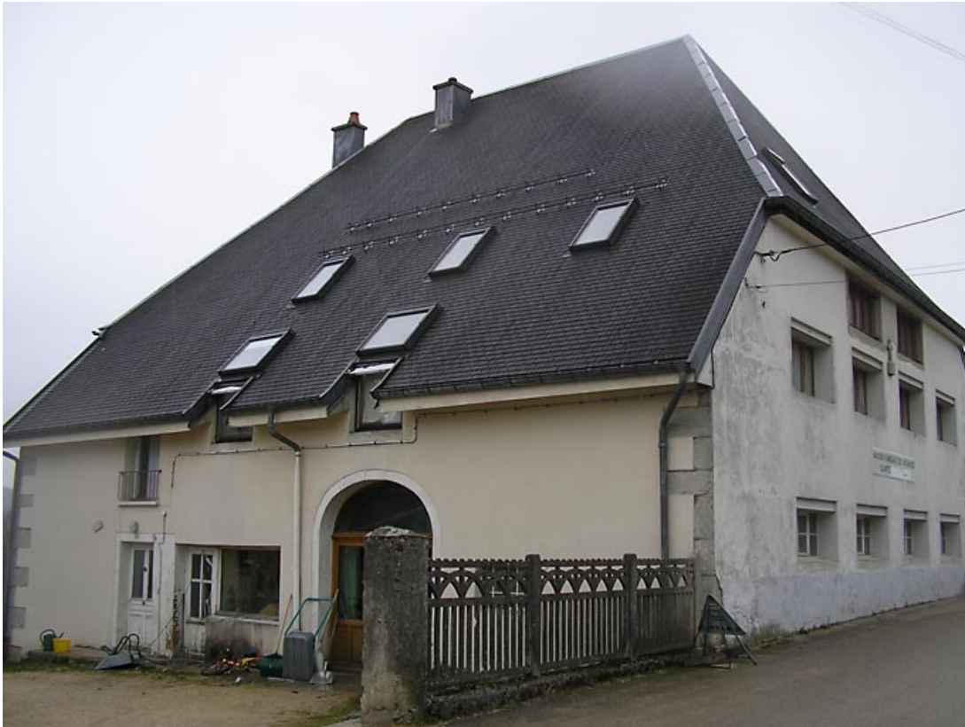
Vue de trois quarts sur façades antérieure et latérale.