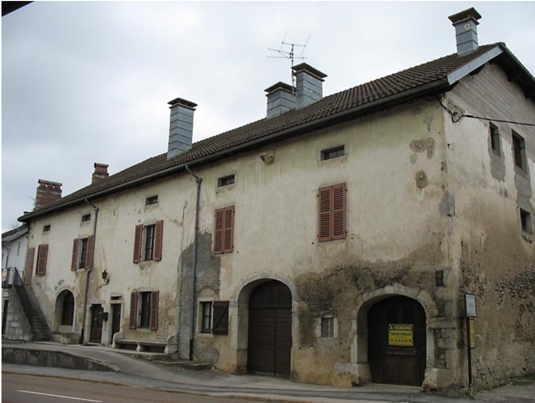
Façade antérieure vue de trois quarts.

39, La Chaux-du-Dombief, 13 rue des Saillards