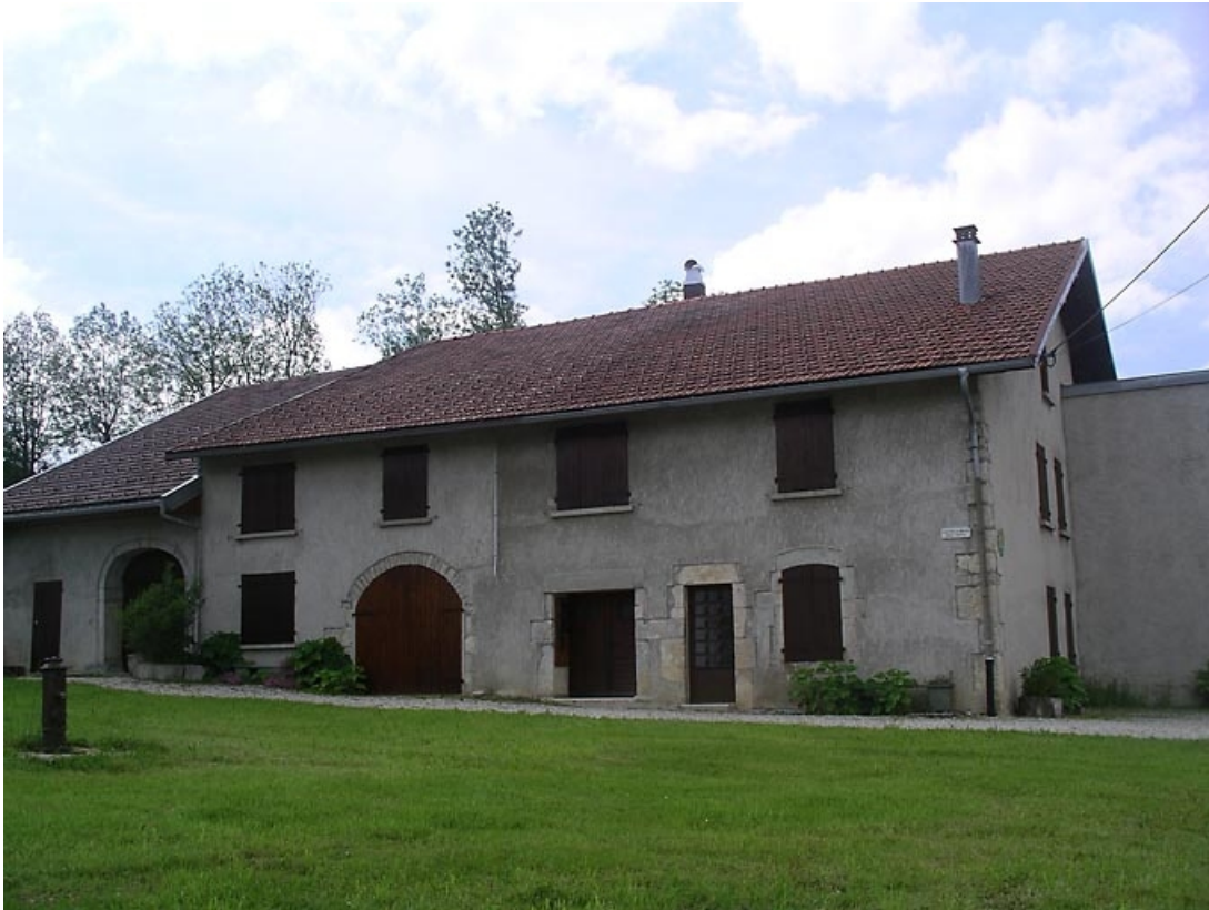
Vue générale sur façade antérieure et pignon nord.

39, La Chaux-du-Dombief, 56 Grande Rue, lieudit : sur l' Otat