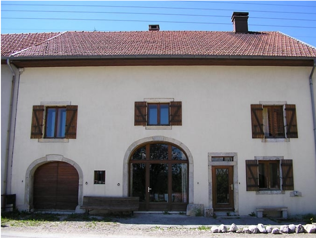
Vue générale sur façade antérieure.