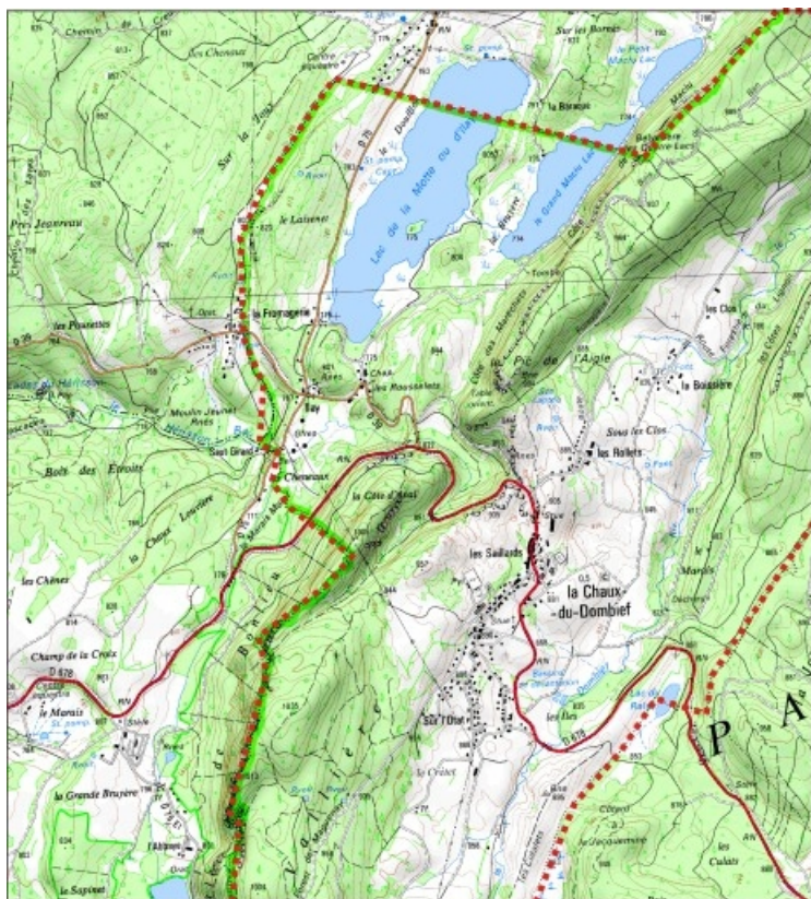
Carte des limites de la commune, partie centre. Extrait de la carte IGN, échelle 1/25 000 ; SCAN 25 (c) IGN - 2008, Licence n° 2008CISE29-68.