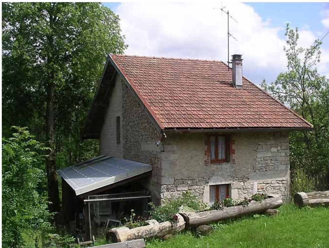
Vue de trois quarts sur façade latérale, pignon nord-est et véranda.

39, La Chaux-du-Dombief, 35 Grande Rue, lieudit : sur l' Otat