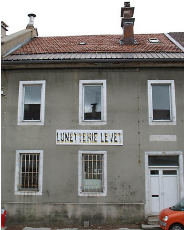
Vue générale de la façade antérieure.

39, La Chaux-du-Dombief, 20 rue des Saillards