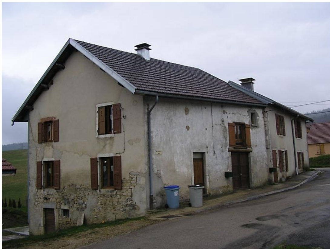
Vue de trois quarts sur façade antérieure et pignon nord-est.

39, La Chaux-du-Dombief, 76 rue de l' Otat, lieudit : sur l' Otat