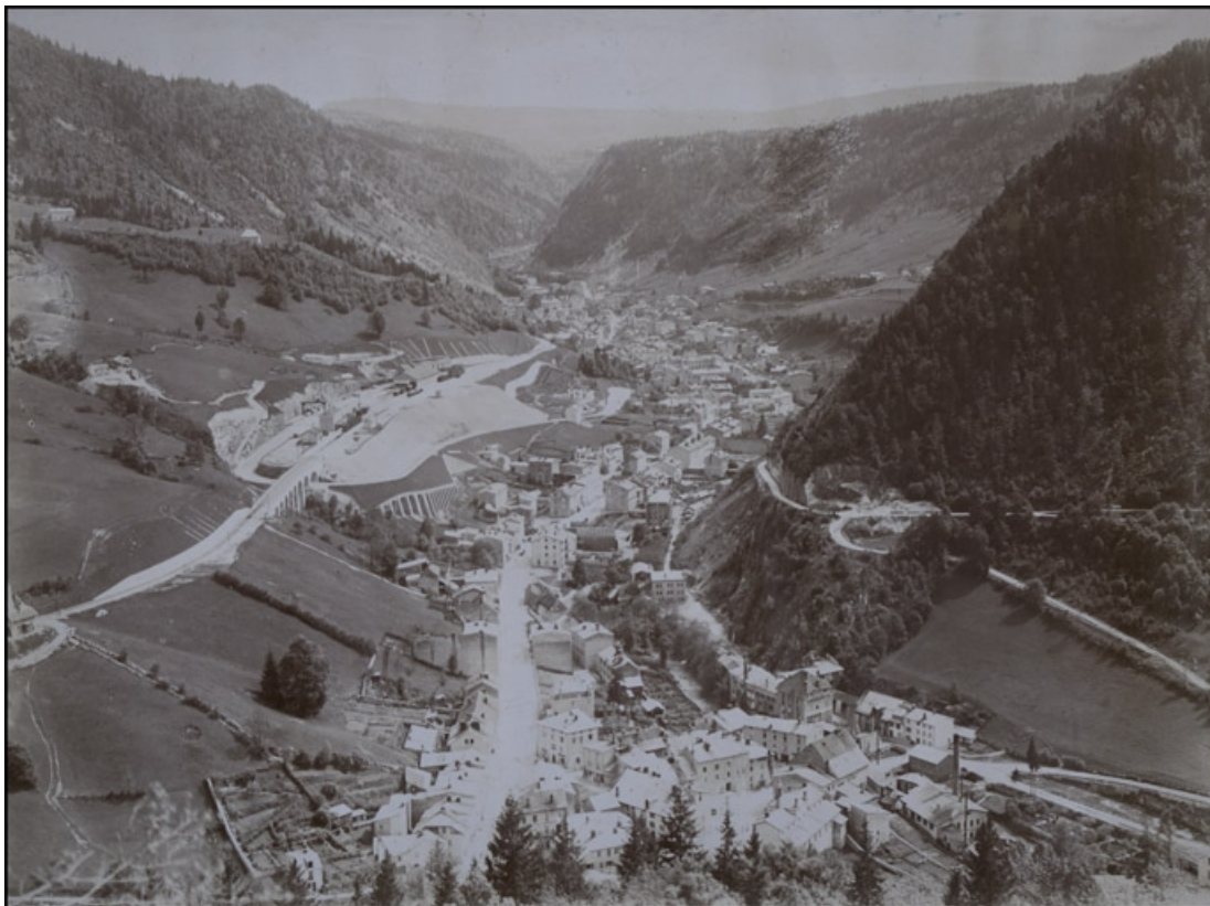
Morez - Jura, France [vue d'ensemble de la vallée depuis le nord], entre 1900 et 1912.