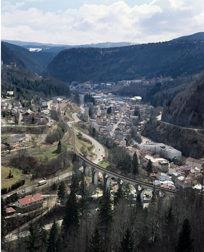
La vallée depuis le viaduc des Crottes, au nord. 39, Morez