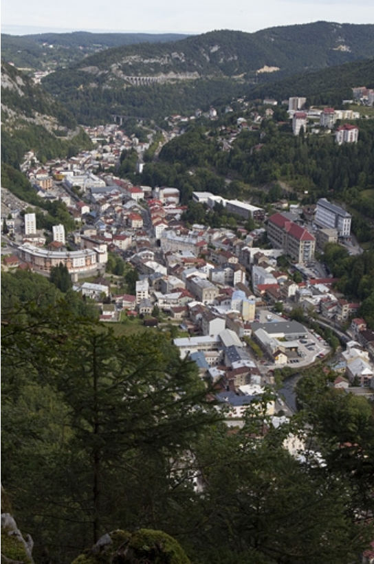
La vallée, depuis le belvédère du Béchet, au sud. 39, Morez