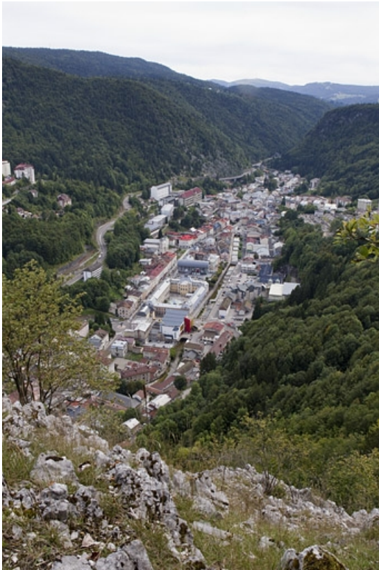
La vallée et le quartier de l'hôtel de ville, depuis le belvédère de la Roche au Dade, à l'ouest. 39, Morez