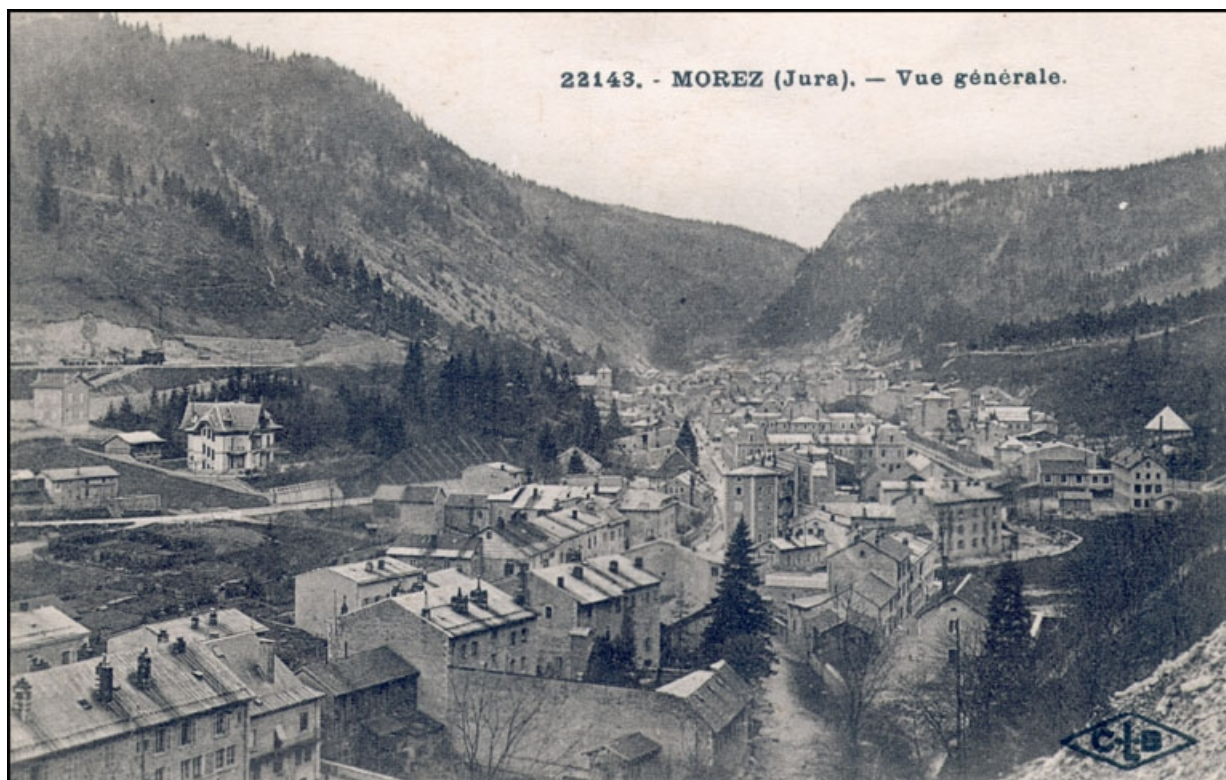
Morez (Jura). - Vue générale [du quartier du centre depuis le nord-ouest], 1er quart 20e siècle. 39, Morez

Carte postale, s.d. [1er quart 20e siècle], C. Lardier éd. à Besançon.