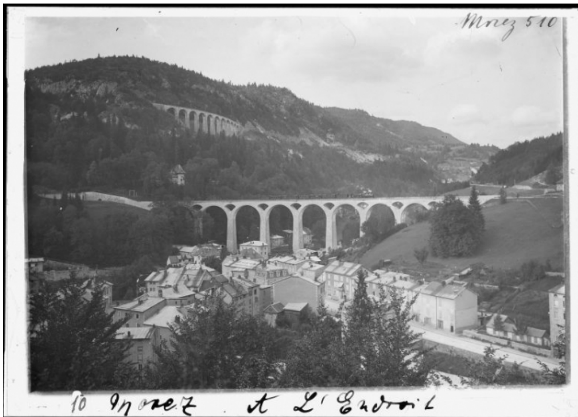
[Le bas de Morez et le grand viaduc, en avant de la vallée de l'Evalude], après 1912. 39, Morez

Photographie, s.d. [1er quart 20e siècle, après 1912], plaque de verre 13 x 18 cm, par Manias, Jules (? , photographe). Lieu de conservation : Région Bourgogne-Franche-Comté, service Inventaire et Patrimoine, Besançon. Cote : Fonds Manias