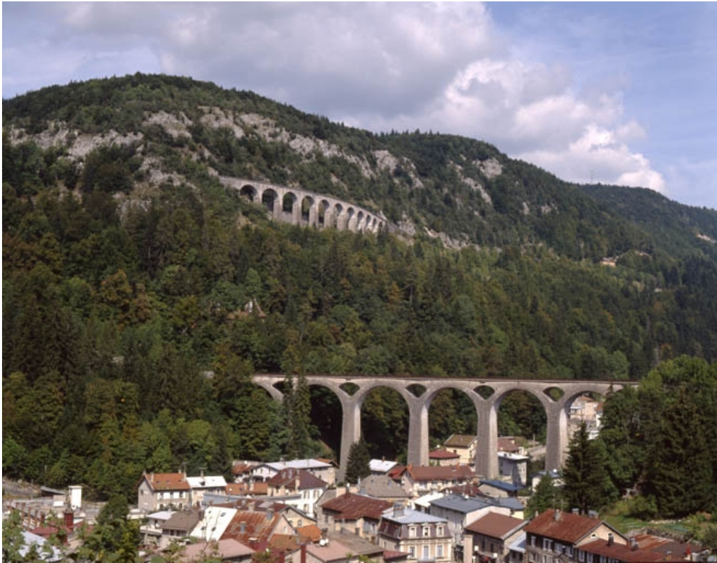
Le bas de la ville, le viaduc et la vallée de l'Evalude. Montagne et viaduc des Crottes en arrière-plan. 39, Morez