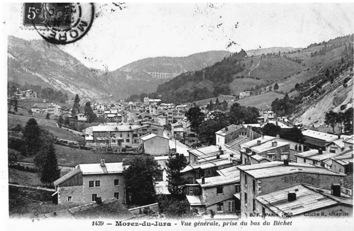
Morez-du-Jura - Vue générale, prise du bas du Béchét, avant 1907.