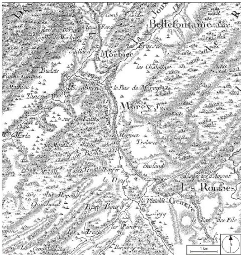
[Carte de Cassini] Feuille n° 147, 1759.