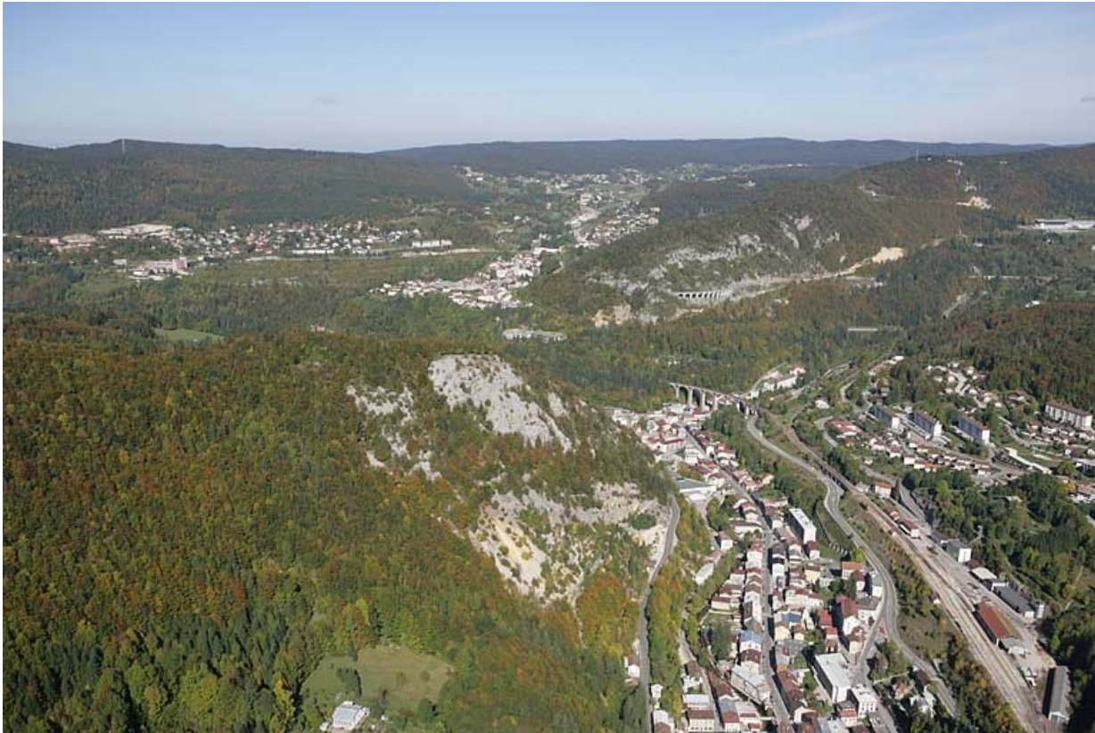
Vue aérienne du bas de la ville et du confluent de la Bienne et de l'Evalude, depuis le sud. 39, Morez