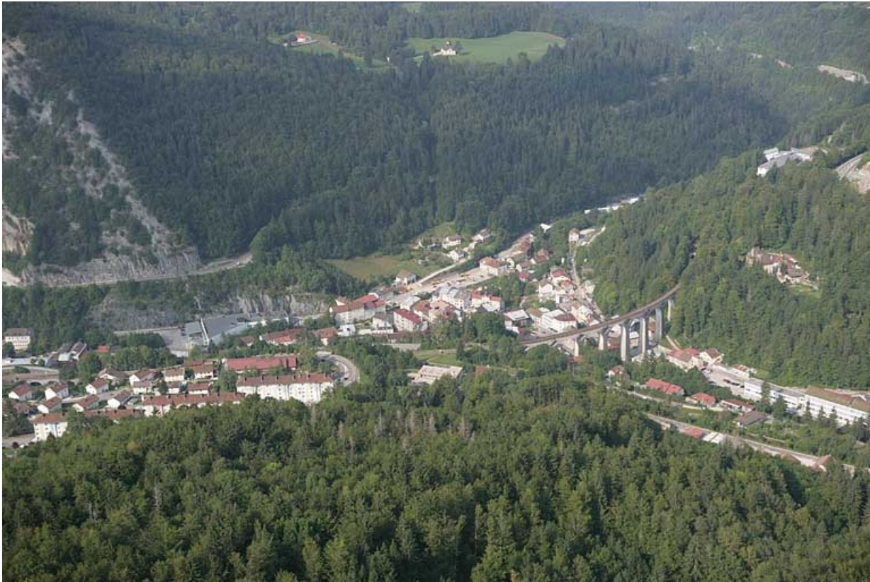
Vue aérienne du bas de la ville et du confluent de la Bienne et de l'Evalude, depuis l'est. 39, Morez