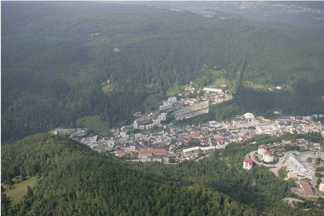
Vue aérienne du haut et du centre de la ville, depuis l'est. 39, Morez