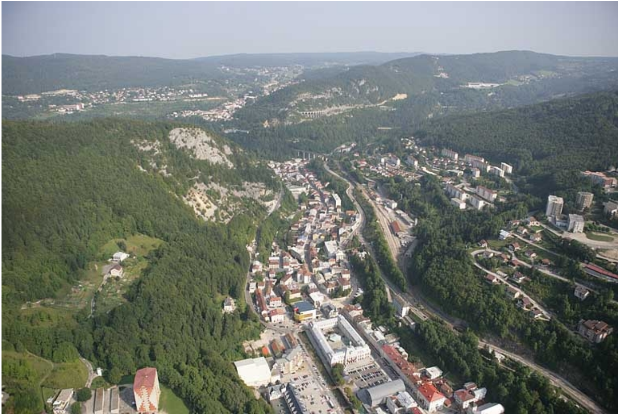
Vue aérienne du centre et du bas de la ville, depuis le sud. 39, Morez