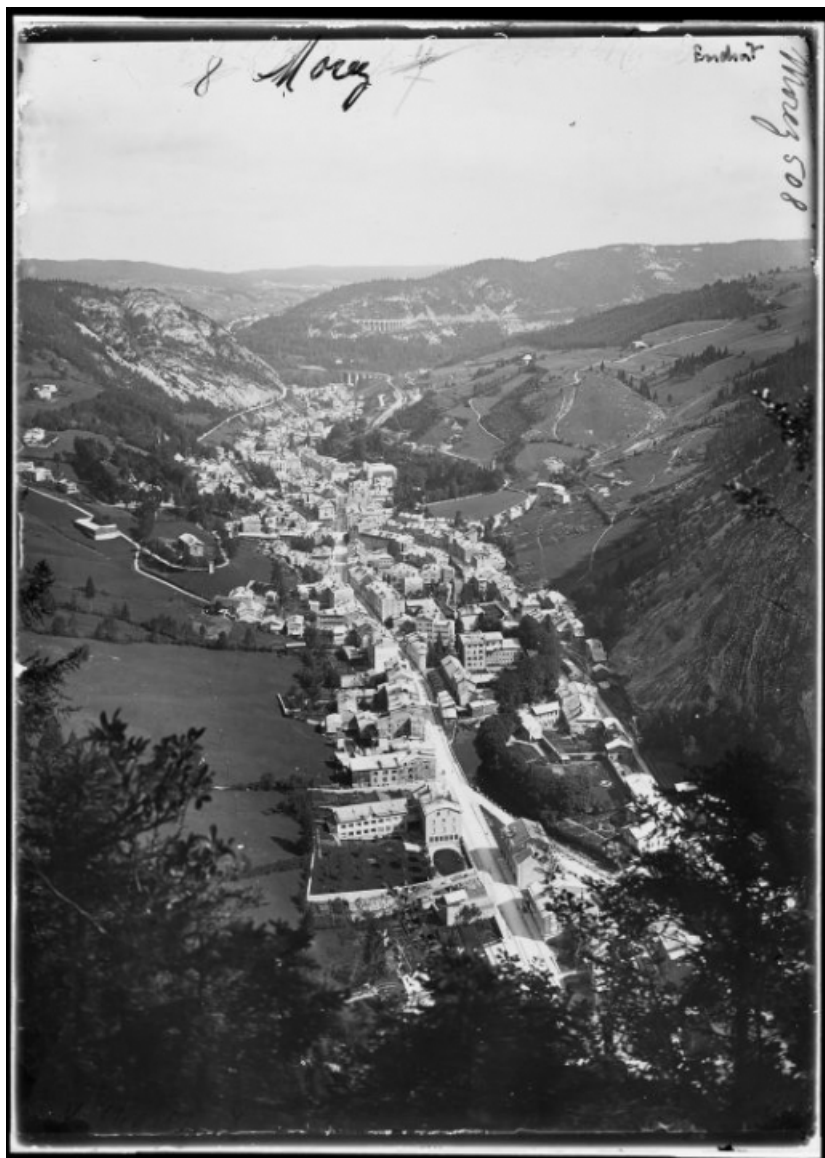
[Morez et sa vallée, depuis le belvédère du Béchet, au sud], 1er quart 20e siècle. 39, Morez

Photographie, s.d. [1er quart 20e siècle], plaque de verre 13 x 18 cm, par Manias, Jules (? , photographe). Lieu de conservation : Région Bourgogne-Franche-Comté, service Inventaire et Patrimoine, Besançon. Cote : Fonds Manias