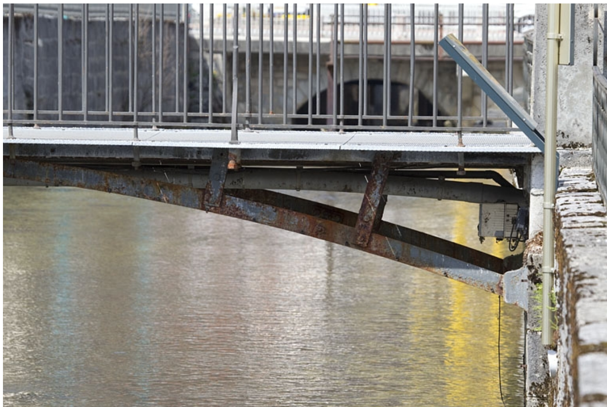
Passerelle aval : détail de l'extrémité rive droite.