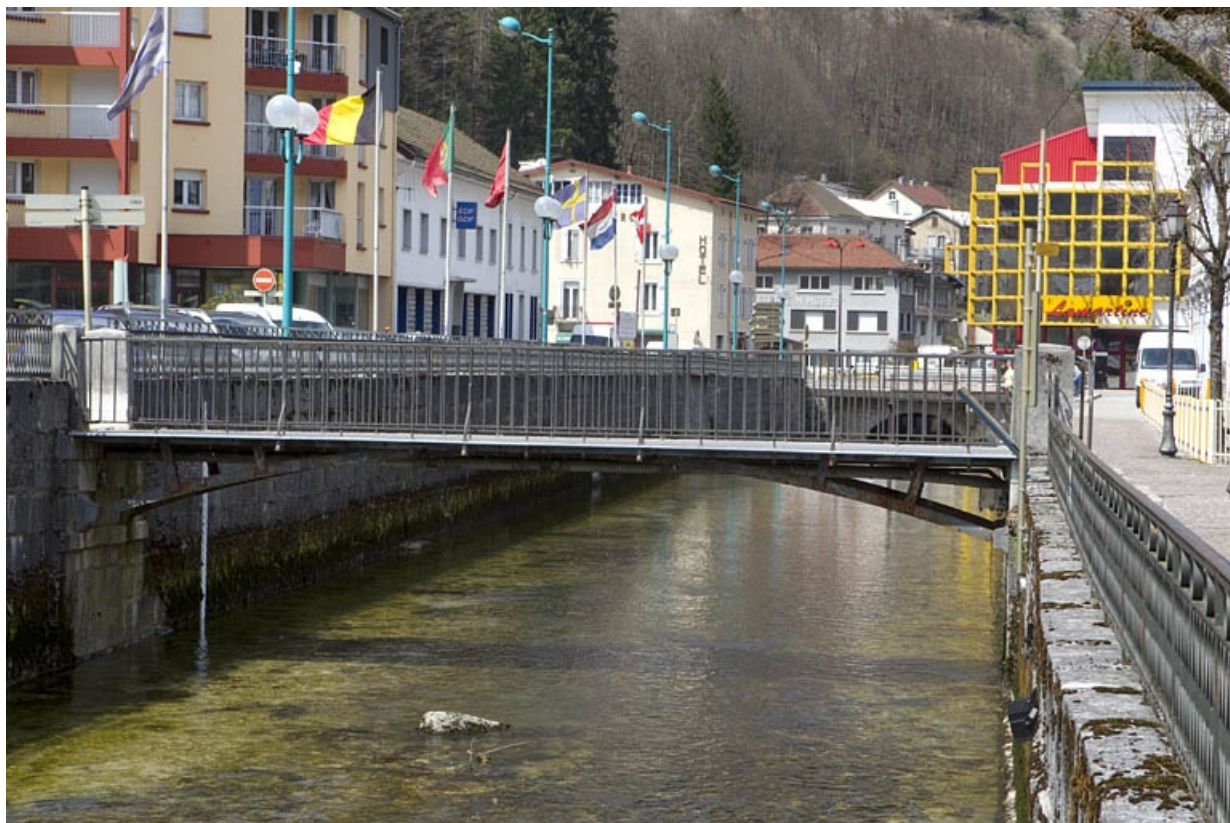
Passerelle aval, vue de l'amont.