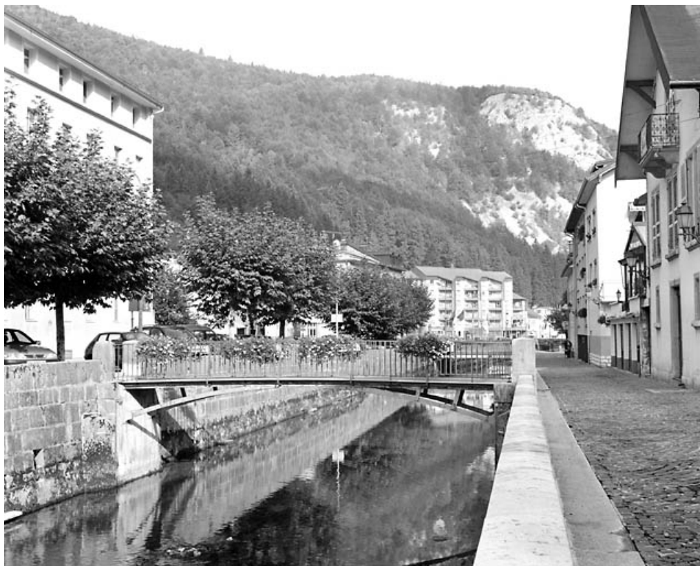
Passerelle amont, vue de l'amont.