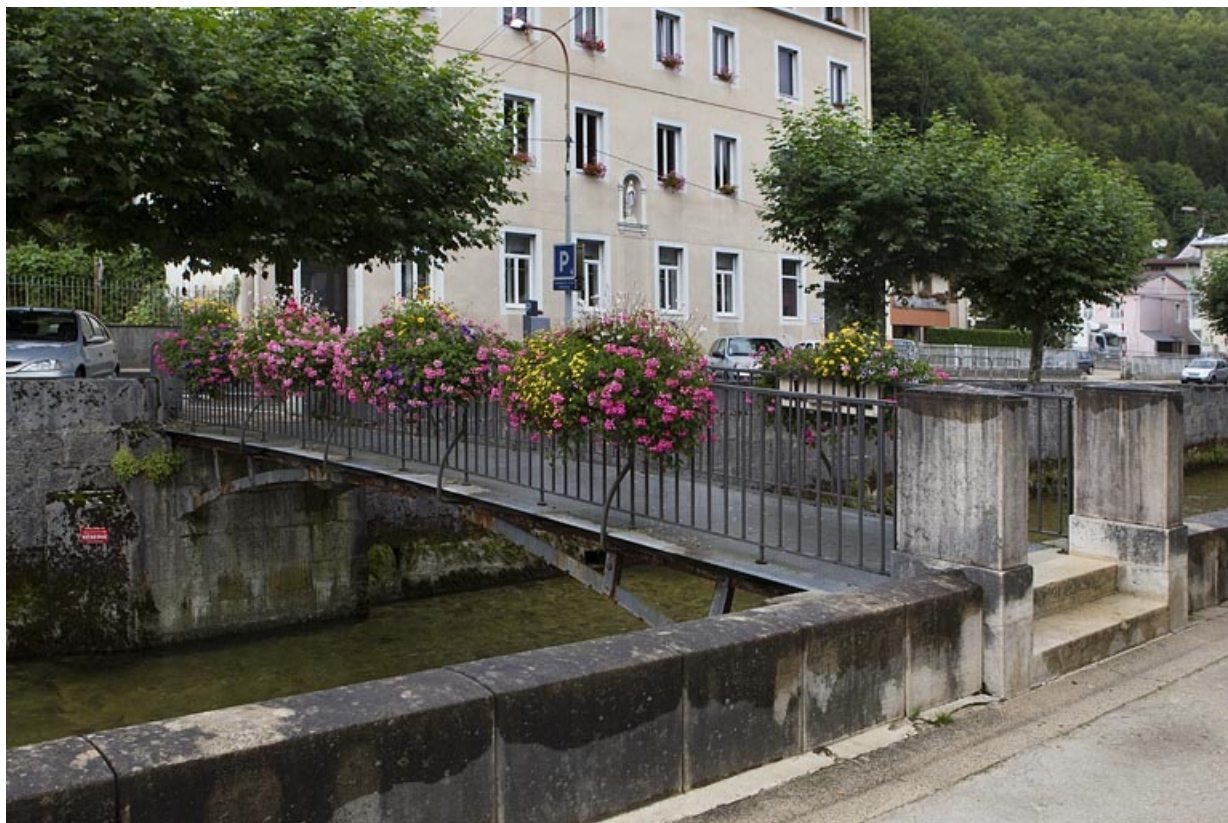
Passerelle amont, vue de trois quarts droite.