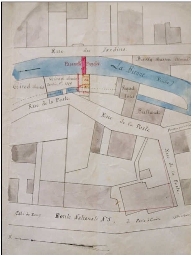
Construction d'une passerelle en fer sur la rivière de Bienne [...], 1896.