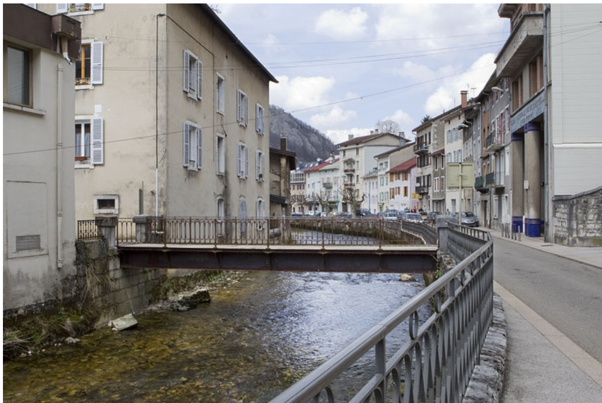
Vue d'ensemble, depuis l'amont.