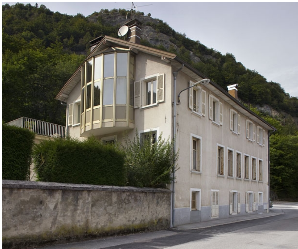
Élévation antérieure, de trois quarts gauche.