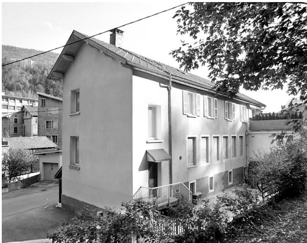
Élévation postérieure, de trois quarts gauche.